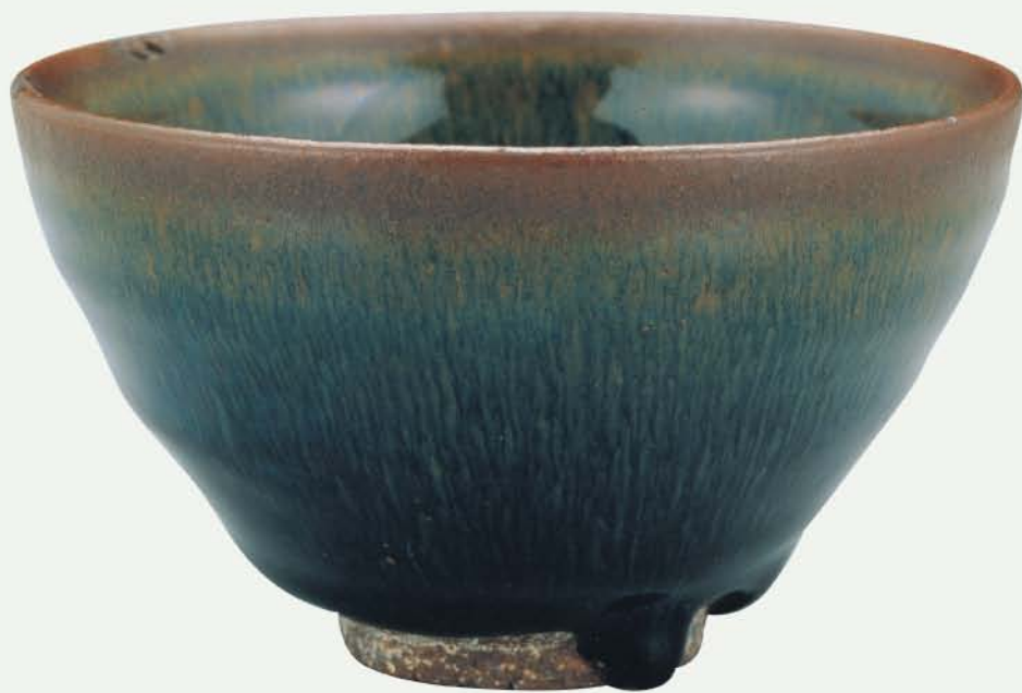
宋 建窯 黑釉兔毫盞 高6.5公分 口徑11.5公分 足徑4.2公分

建窯茶盞深底寬嘴的器型，以茶筴攪拌起來相當容易，而釉色黑亮的建窯茶盞，更襯托茶色的白淨。