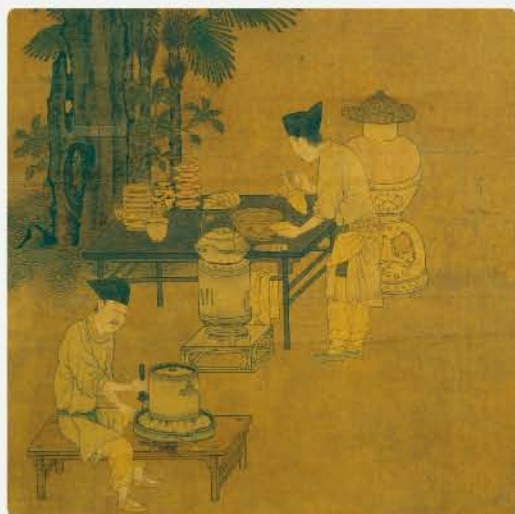
宋 劉松年 攪茶圖(局部) 絹本設色 軸 縱44.2公分 橫61.9公分

再看前方的侍者，正用石磨將茶餅、茶磚磨成粉末。仔細觀察石磨下方，還仔細描繪了粉末洩出的模樣呢！