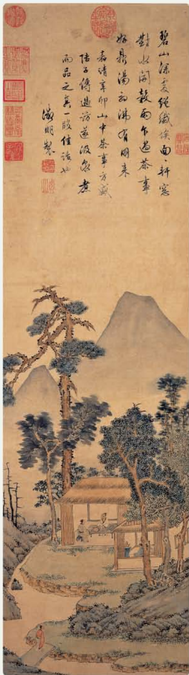
明 文徵明 品茶圖 紙本設色 軸 縱88.3公分 橫25.2公分

可見陽羨春茶自唐代就是難能可貴的貢茶，滋味更是不凡。啜飲陽羨茶的詩人，一面沉吟低迴，在東風吹暖、蝴蝶蜜蜂翩翩舞動的春天傍晚，寫下了這首輕快歡樂的詩句。詩句快意暢然，書法也是，傳達了詩人在春天享受新茶的喜悅。