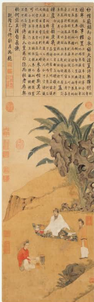
宋 錢選 盧仝烹茶圖 紙本設色 軸 縱128.7公分 橫37.3公分

一碗茶能潤肺滋喉；二碗茶能破解胸中孤獨煩悶，腦筋清明；三碗茶可以捕捉靈感，下筆神速；四碗茶足以使人身體暢快，微微發汗，平日不平的感受，全都藉著暢快的毛孔消散；五碗茶可以讓身體感到肌骨清爽；到了第六碗，簡直可以與仙靈通神；第七碗最高境界，最好是不要喝了，否則滋味的美妙，足以讓人兩腋生風，飄飄然飛往蓬萊仙山。