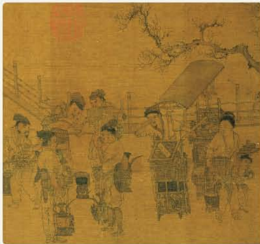
宋 劉松年 茗園賭市 絹本設色 冊 縱27.7公分 橫25.7公

鬥茶的方法就是將滾燙的熱水注入茶 盞後，以茶筴攪拌，品聞茶香、觀察茶湯 的色澤與湯花分佈的情況，以判別高下。 畫幅左方四人正在鬥茶，每個人都有一個 茶籃，裝著滾水，手拿一個茶盞，有的正 朝茶盞注水、有的舉杯啜飲、也有人正觀 望別人、還有一位像是剛喝完了茶，正用 袖子擦嘴呢。當時鬥茶的情景，是不是很 生動呢？