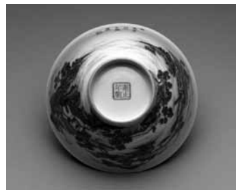
圖 34 清 雍正 瑤瑯彩瓷青綠山水碗 國立故宮博物院藏