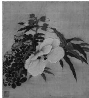
圖 11 清 蔣廷錫 花卉草蟲冊之秋葵雜菊 國立故宮博物院藏