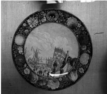
圖 20 德國 十七世紀晚期至十八世紀初期銅胎 畫琺瑯盤 英國 V&A 博物館收藏