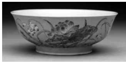
圖 15-3 清 康熙 琺瑯彩瓷黃地荷花碗 國立故宮博物院藏