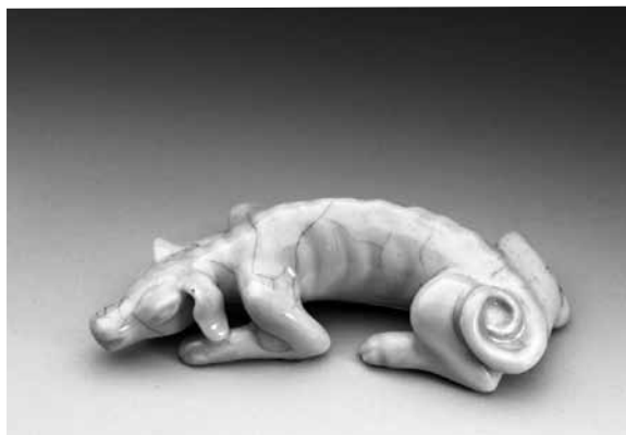
圖 41-1 清 十八世紀 青瓷犬 國立故宮博物院藏