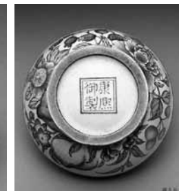
圖 8 清 康熙 銅胎畫琺瑯花果紋盒 國立故宮博物院藏