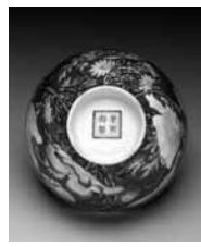
圖 5 清 康熙 琺瑯彩瓷紅地花卉碗 國立故宮博物院藏