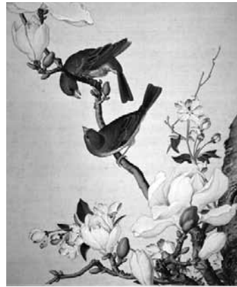
圖 15-8 清 郎世寧 仙萼長春圖冊之海棠玉蘭 局部 國立故宮博物院藏