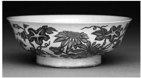
圖 15-1 清 康熙 琺瑯彩瓷花卉碗 國立故宮博物院藏