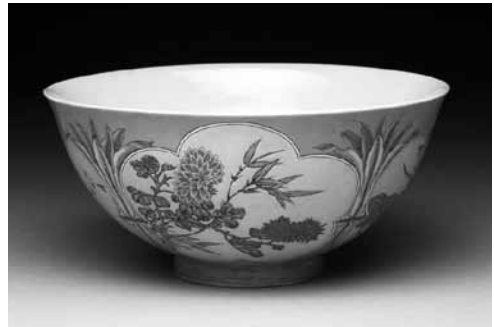
圖 15-2 清 康熙 琺瑯彩瓷粉紅地開光四季花卉碗 國立故宮博物院藏