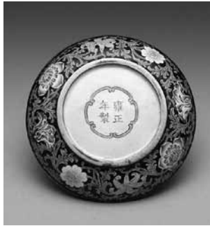
圖 24 清 雍正 銅胎畫琺瑯 福壽扁圓盒 國立故宮博物院藏