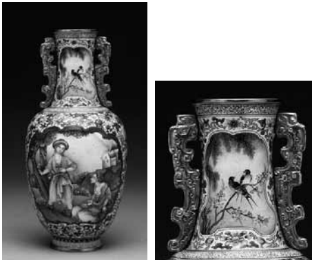
圖 15-7 清 乾隆 畫瑠瑯西洋人物觀音瓶 國立故宮博物院藏