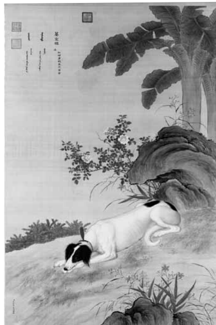
圖 41-2 清 郎世寧 十駿犬之驀空鶴 國立故宮博物院藏