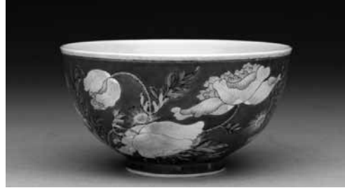
圖 15-4 清 康熙 瑤瑯彩瓷紅地花卉碗 國立故宮博物院藏