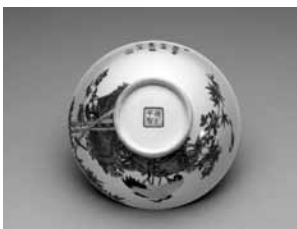
圖 27 清 雍正 琺瑯彩瓷芝仙祝壽圖碗 國立故宮博物院藏