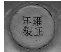
圖 23 清 雍正 銅胎畫琺瑯黃地番蓮九壽蓋杯、托 國立故宮博物院藏