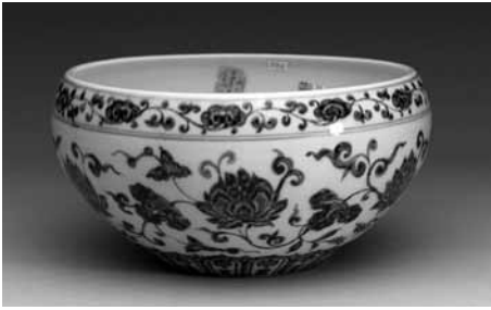
圖 1 明 宣德 青花纏枝番蓮紋鉢 國立故宮博物院藏