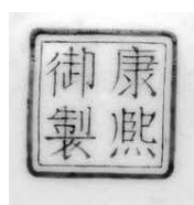
圖 7 清 康熙 琺瑯彩瓷黃地荷花碗 國立故宮博物院藏