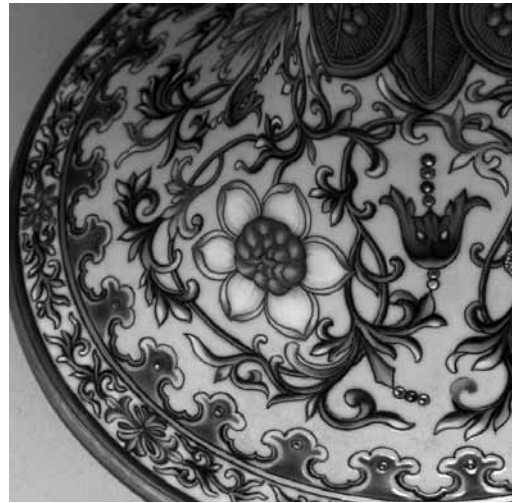
圖 32 清 乾隆 洋彩黃地蕉葉觚 局部 國立故宮博物院藏