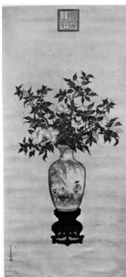
圖 35 清 郎世寧 瓶花圖 Mrs. J. Riddle Collection, London