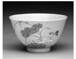
圖 15-3 清 雍正 琺瑯彩瓷黃地蓮花鍾 國立故宮博物院藏