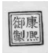
圖 6 清 康熙 琺瑯彩瓷黃地秋花碗 國立故宮博物院藏