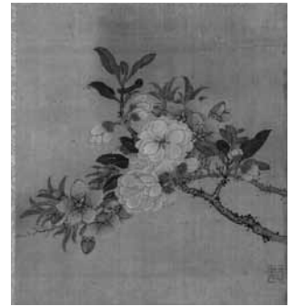
圖 12 清 蔣廷錫 花卉草蟲冊之碧桃 國立故宮博物院藏