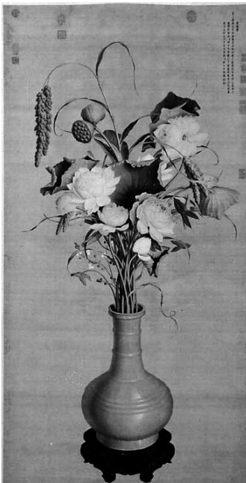
圖 13 清 郎世寧 聚瑞圖 國立故宮博物院藏