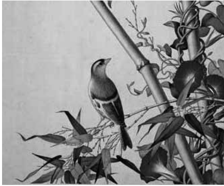
圖 15-1 清 郎世寧 仙萼長春圖冊之翠竹牽牛 局部 國立故宮博物院藏