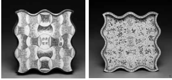
圖 17 清 康熙 銅胎畫琺瑯花卉盤 國立故宮博物院藏