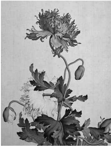
圖 15-4 清 郎世寧 仙萼長春圖冊之罌粟 局部 國立故宮博物院藏