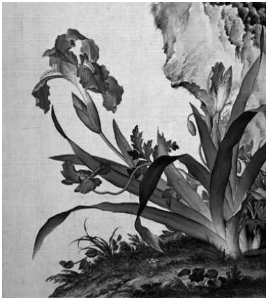
圖 15-6 清 郎世寧 仙萼長春圖冊之虞美人 蝴蝶蘭 局部 國立故宮博物院藏