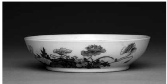
圖 15-6 清 雍正 瑤瑯彩瓷虞美人花碟 國立故宮博物院藏