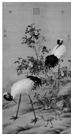
圖 28 清 郎世寧 花陰雙鶴圖 國立故宮博物院藏