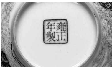
圖 33 清 雍正 瑤瑯彩瓷赭墨山水碗 國立故宮博物院藏