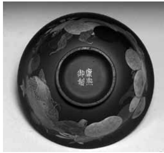
圖 9 清 康熙 宜興胎畫瑤瑯花果紋碗 國立故宮博物院藏