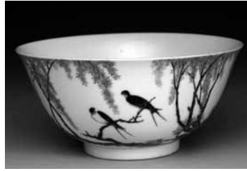
圖 15-7 清 雍正 瓷胎畫瑠瑯柳燕 紋碗 國立故宮博物院藏