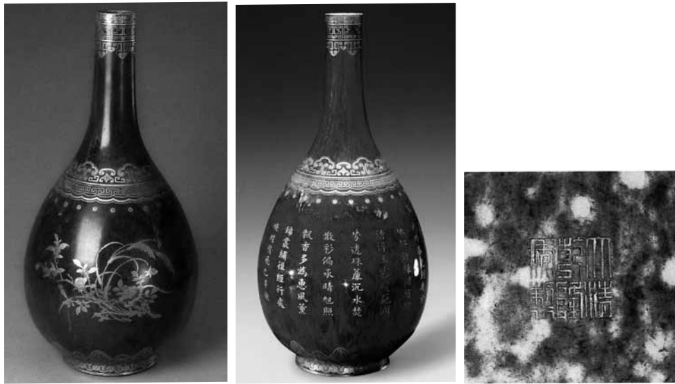
圖 40 清 乾隆 鈞釉膽瓶 北京故宮博物院藏