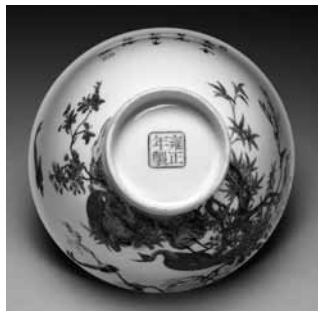
圖 26 清 雍正 琺瑯彩瓷花鳥圖碗 國立故宮博物院藏