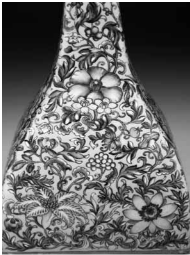
圖 31 清 乾隆 洋彩黃地洋花方瓶 局部 國立故宮博物院藏