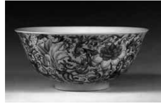
圖 30 清 乾隆 洋彩黃地番蓮碗 北京故宮博物院藏