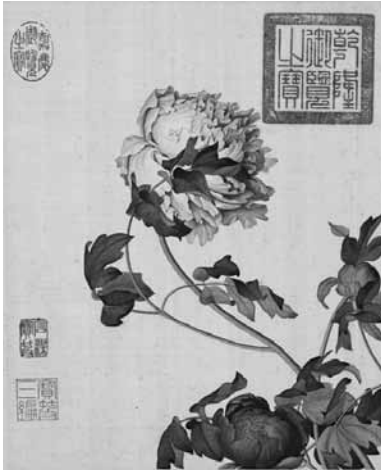
圖 15-5 清 郎世寧 仙萼長春圖冊之牡丹 局部 國立故宮博物院藏