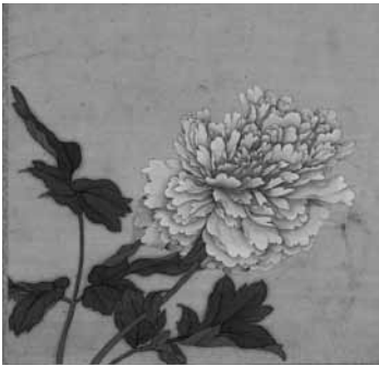
圖 10 清 蔣廷錫 花卉冊之牡丹 國立故宮博物院藏