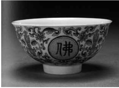
圖 29 清 乾隆 黃地佛日常明碗 北京故宮博物院藏