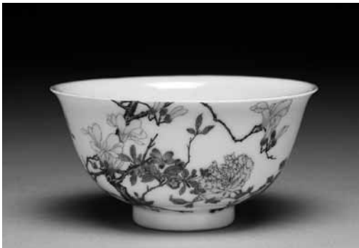
圖 15-8 清 雍正 瑠瑯彩瓷玉堂富貴圖碗 國立故宮博物院藏