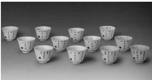
圖 16 清 康熙 青花十二花神杯 北京故宮博物院藏