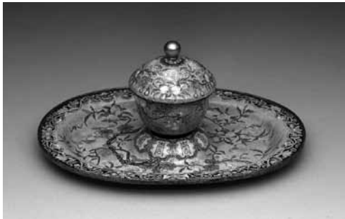
圖 22 清 雍正 銅胎畫琺瑯粉橘地福壽杯、托 國立故宮博物院藏