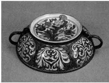
圖 18 清 康熙 五彩花果紋雙耳盆 法國吉美博物館 (Guimet) 藏