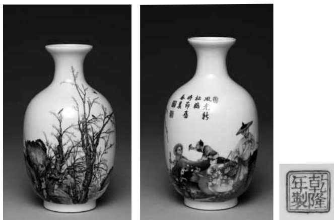
圖 36 清 乾隆 琺瑯彩瓷春農圖瓶 國立故宮博物院藏