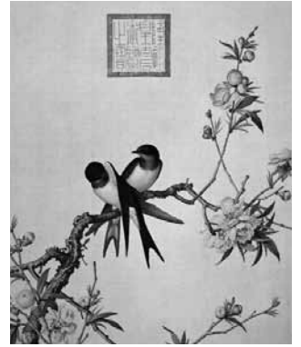
圖 15-7 清 郎世寧 仙萼長春圖冊 之桃花 局部 國立故宮博物院藏