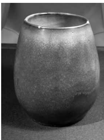
圖 37 清 郎世寧 仙丹眉壽圖及清宮舊藏鈞窯罐 述鄭齋收藏