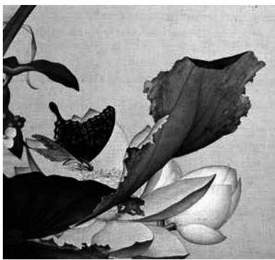
圖 15-3 清 郎世寧 仙萼長春圖冊之 荷花慈菇 局部 國立故宮博物院藏