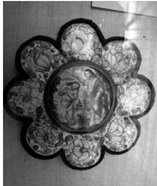
圖 21 德國 十七世紀晚期至十八世紀初期銅胎畫琺瑯盤 英國 V&A 博物館收藏