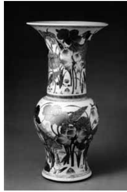
圖 2 清 康熙 五彩加金鷺鷥荷花紋鳳尾尊 北京故宮博物院藏