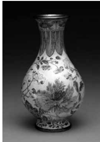
圖 15-5 清 康熙 銅胎畫瑤瑯玉堂富貴瓶 國立故宮博物院藏