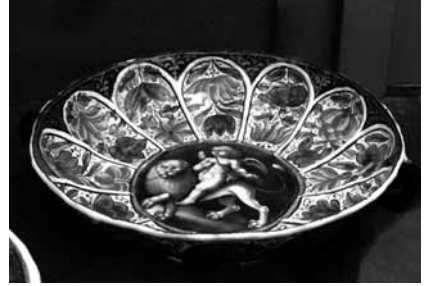
圖 19 十七世紀 Limegoes 銅胎畫琺瑯盤 英國 Ashmolean 博物館藏