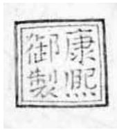
圖 3 清 康熙 銅胎畫琺瑯玉堂富貴瓶 國立故宮博物院藏