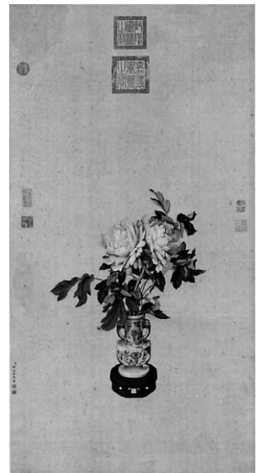
圖 14 清 郎世寧 畫瓶花 國立故宮博物院藏