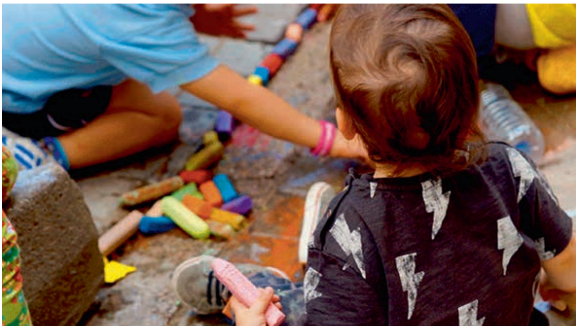
圖11 「博物館怎麼玩？」親子工作坊活動照 Imagen para la actividad Savia 1. ¿Cómo jugar el Museo?