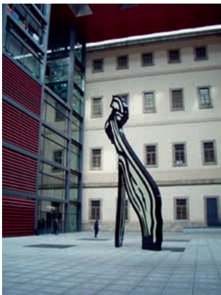
圖2 努維爾大樓近入口處