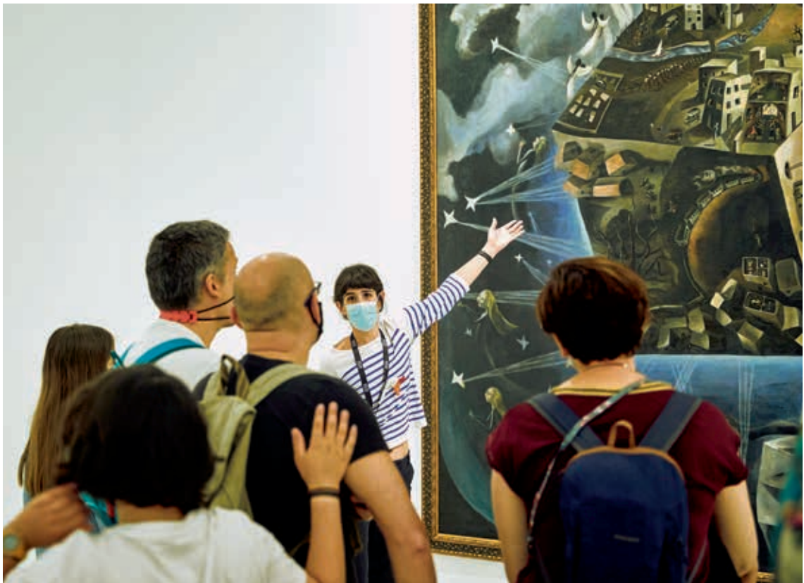
圖 10 「火炬」親子導覽活動 ¡Antorcha! Museo Reina Sofía, 2021

此外，「博物館怎麼玩？」（¿Cómo jugar el Museo?）親子工作坊（圖 11），針對學齡前 0 至 7 歲兒童及陪同家長，設計新穎有趣的互動遊戲。課程內容並依循教育學家史代納（Rudolf Steiner, 1861-1925）提出的十二項感官探索（觸覺、視覺、聽覺、嗅覺、味覺、生命覺、動覺、平衡覺、溫度覺、語言覺、思想覺及自我覺），將展示空間與作品相互扣連，今年三月更提供線上活動手冊，供家長自由下載運用。 8