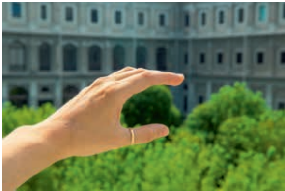
圖5 「閃閃發光」導覽活動宣傳照 Uno de los gestos coreográficos de Brillante. Cine sin película.