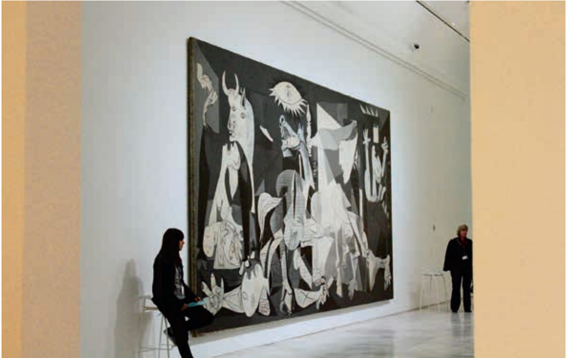
圖4-1 索菲亞王后博物館的鎮館之寶〈格爾尼卡〉