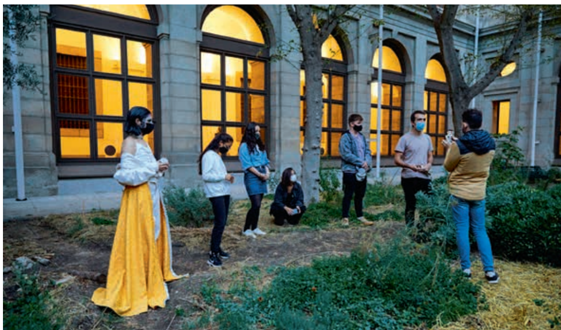
圖8 1517團隊準備在薩巴提尼庭院埋下「時光膠囊」