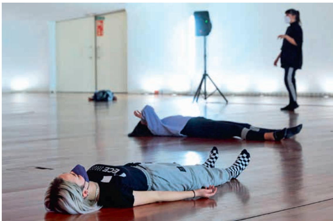
圖9 1821團隊「寧靜狂歡」活動照