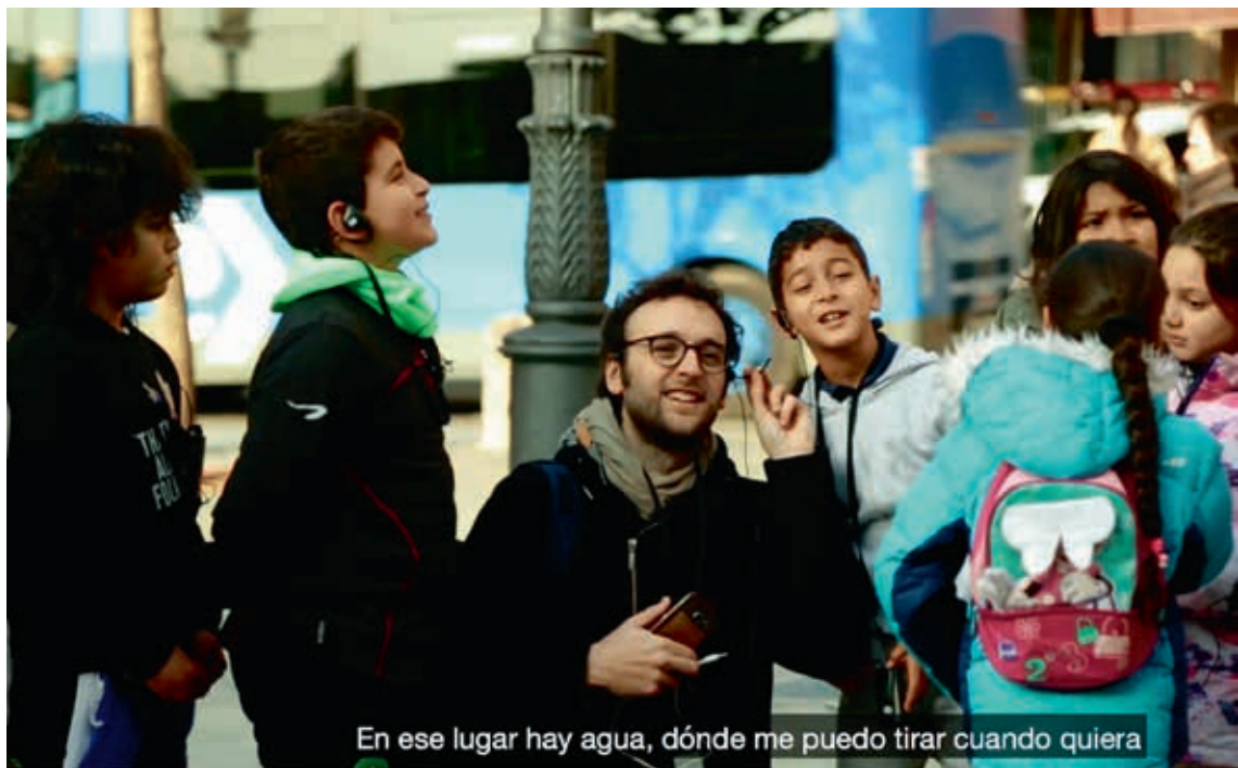
圖7 「這個地方」影片紀實片段

藏於肢體裡，以眼神和手勢邀請學生們打開想像的鏡頭，透過簡單的舞蹈手勢取景，盡情發揮想像力，精心建構每一電影場景，不論是展示中的作品、博物館的參觀動線，周圍的生活場景，任何微小的細節，將構成獨一無二的藝術創作。藉此強化學生對時空場域的感知，提供一種欣賞作品的方法和步驟，參與者從客體變為主體，從被動觀者成為主動的創作者，讓觀看成爲一種創造性行爲。