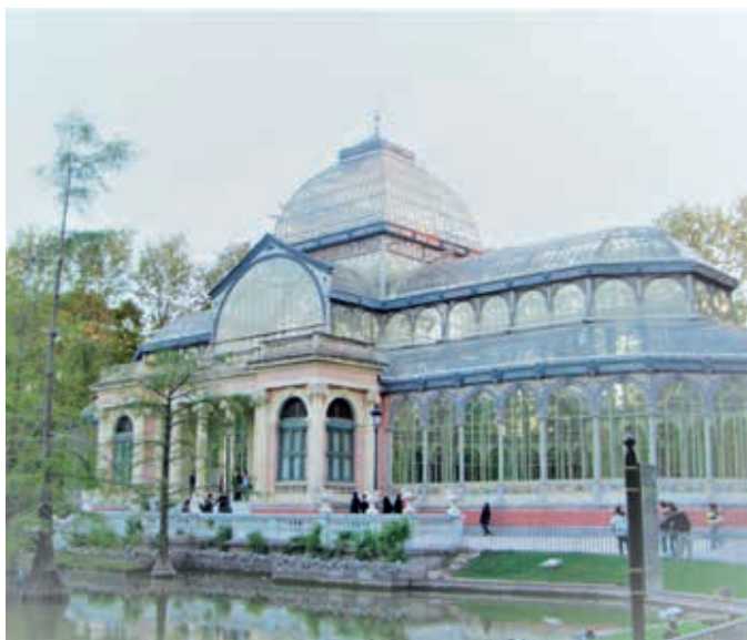
圖3 索菲亞王后博物館 水晶宮展館