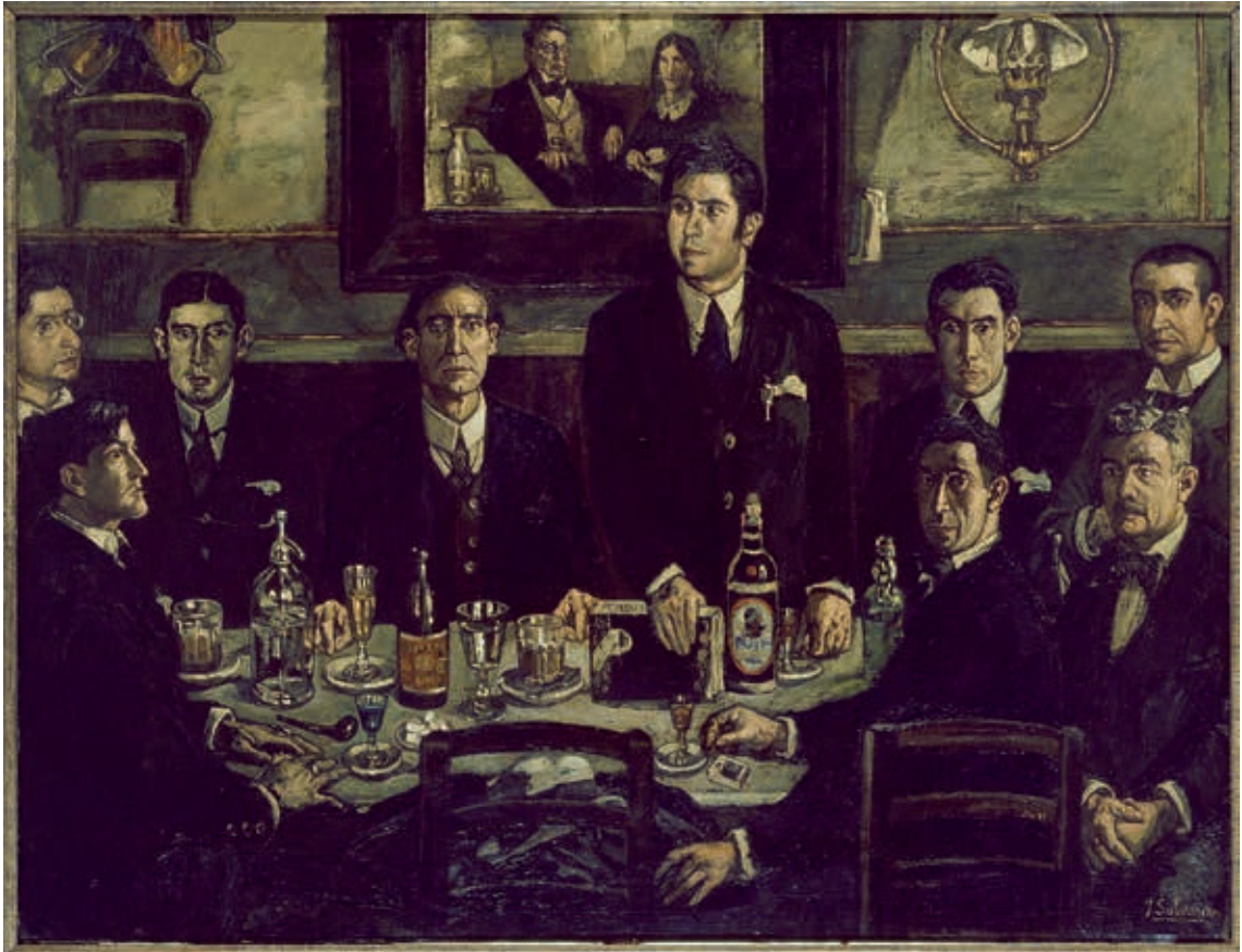
圖13 1920年 古提耶雷茲·索拉納 龐波咖啡館的聚會 (La tertulia del Café de Pombo) 索菲亞王后博物館藏 Museo Nacional Centro de Arte Reina Sofía. Register number: AS00915

朋友規劃「走入細節」(En detalle) 導覽活動，設計兩大主題，分別為西班牙表現主義畫家古提耶雷茲·索拉納 (José Gutiérrez Solana, 1886-1945) 於1920年紀錄當時知識份子於龐波咖啡館 (Café Pombo) 的聚會場景 (圖13)，及西班牙超現實主義女畫家桑托斯 (Ángeles Santos, 1911-2013) 的〈世界〉(Un mundo)，除了針對作品的內容、結構及創作背景等詳盡地介紹，並與修護保存部門跨單位合作，為觀眾揭開畫下暗藏的創作「秘密」，一同走進不為人知的「細節」。(圖14)