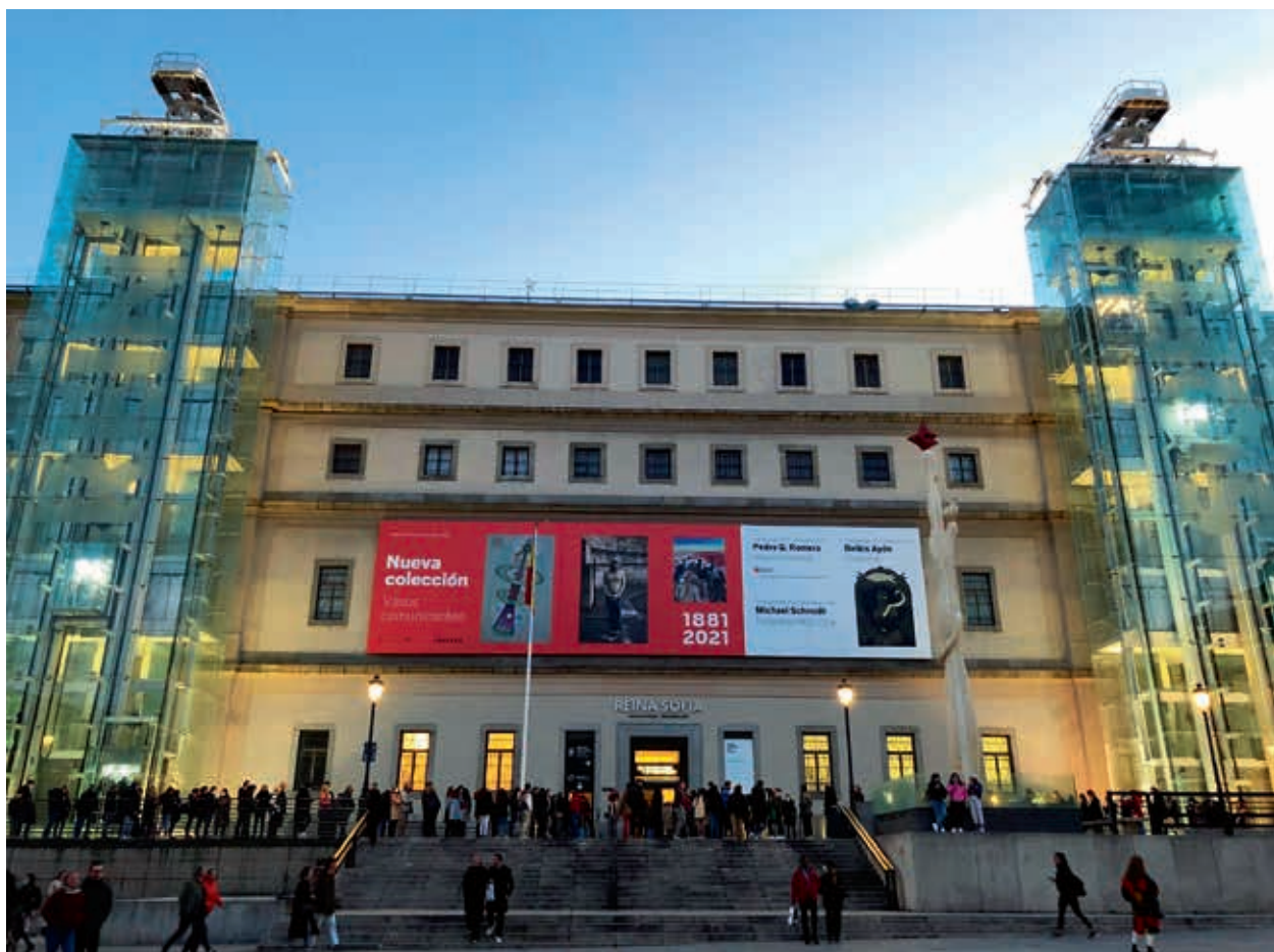
圖1 索菲亞王后博物館正面建築

據索菲亞王后國家藝術中心博物館（Museo Nacional Centro de Arte Reina Sofía，以下簡稱索菲亞王后博物館）的官方新聞稿，觀眾平均在藝術機構停留的時間約為 35 分鐘；為反轉此一現況，該博物館教育部門經長期分析、研究調查，並獲得西班牙桑坦德銀行基金會（Fundación Banco Santander）贊助，於 2019 年 7 月推出全新的教育推廣計畫「Gira」，試圖與觀眾建立更長久、深遠的互動關係。本文將介紹該計畫之緣起、實施理念及活動策略，一窺其反轉契機。