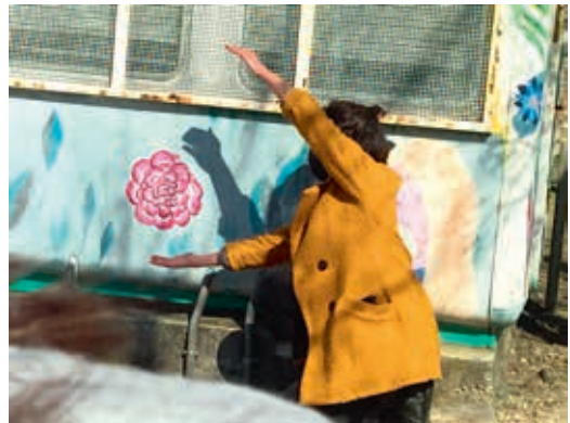
圖6 「閃閃發光在學校」活動照 Brillante en la escuela.