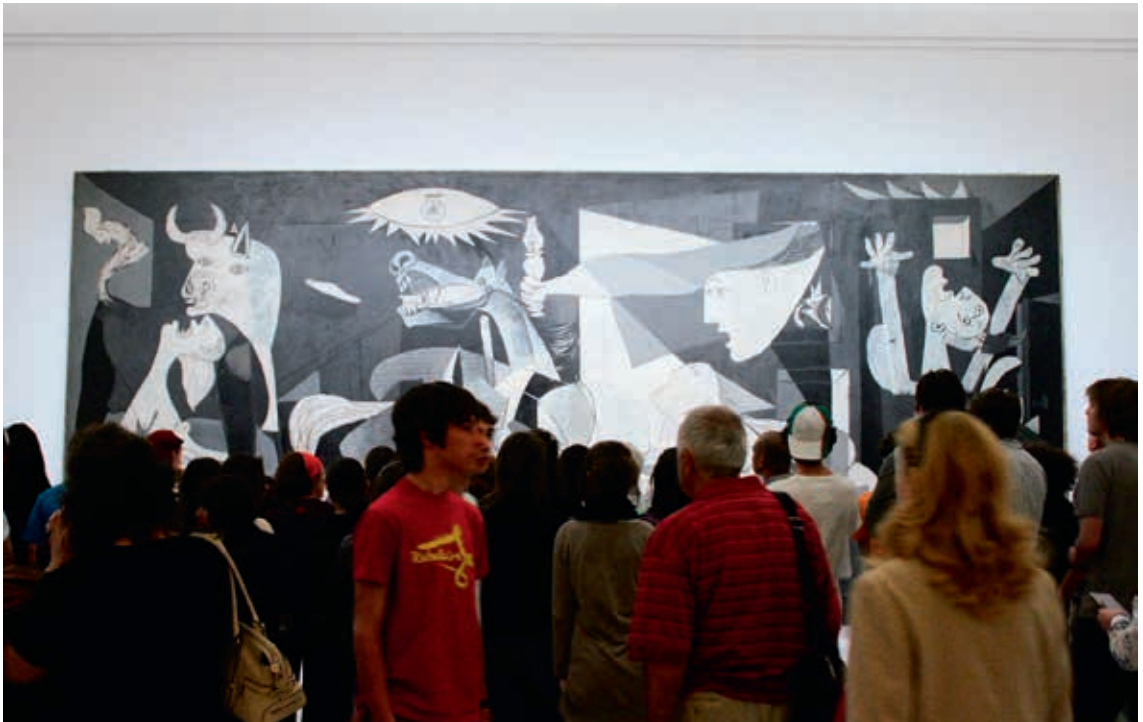
圖4-2 大量參觀人潮聚集在〈格爾尼卡〉畫作前 柯太云攝於2011年