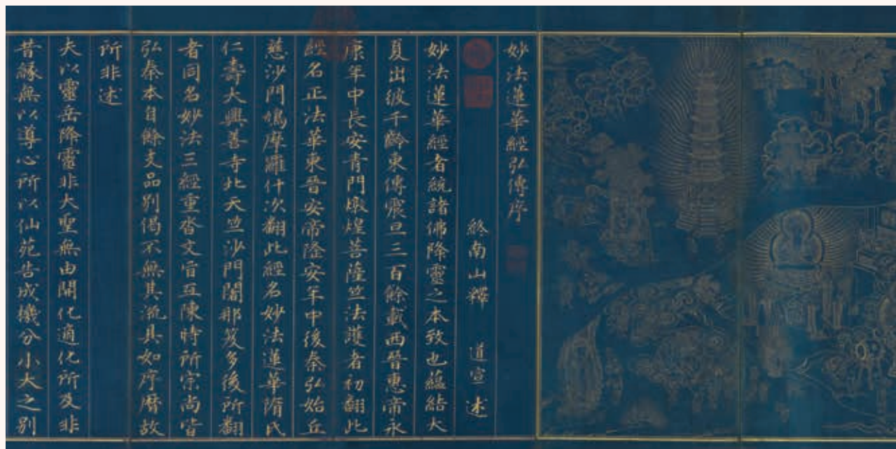
圖1 《妙法蓮華經》 元至順元年（1330）僧元浩、朱珺泥金寫繪本 卷1 國立故宮博物院藏

特別值得指出的是卷二「火宅喻」的表現（圖2），除了常見的羊車、鹿車、牛車外，還畫了一輛由大象拉的華麗大車，應當是經文中