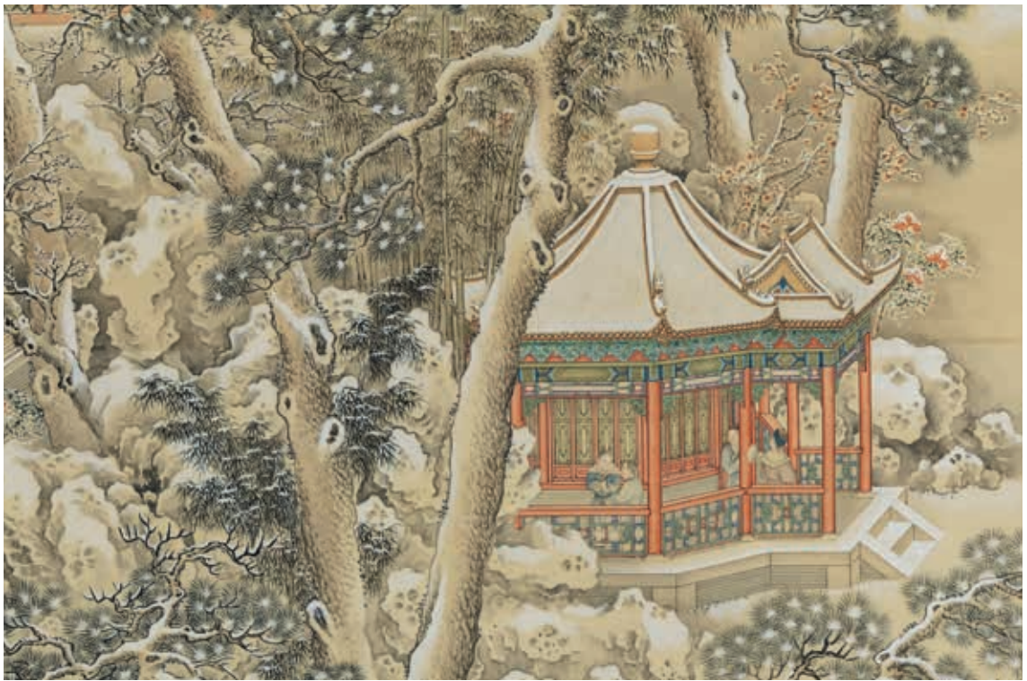
圖7 清 余省 畫大呂星回 局部 四神祠