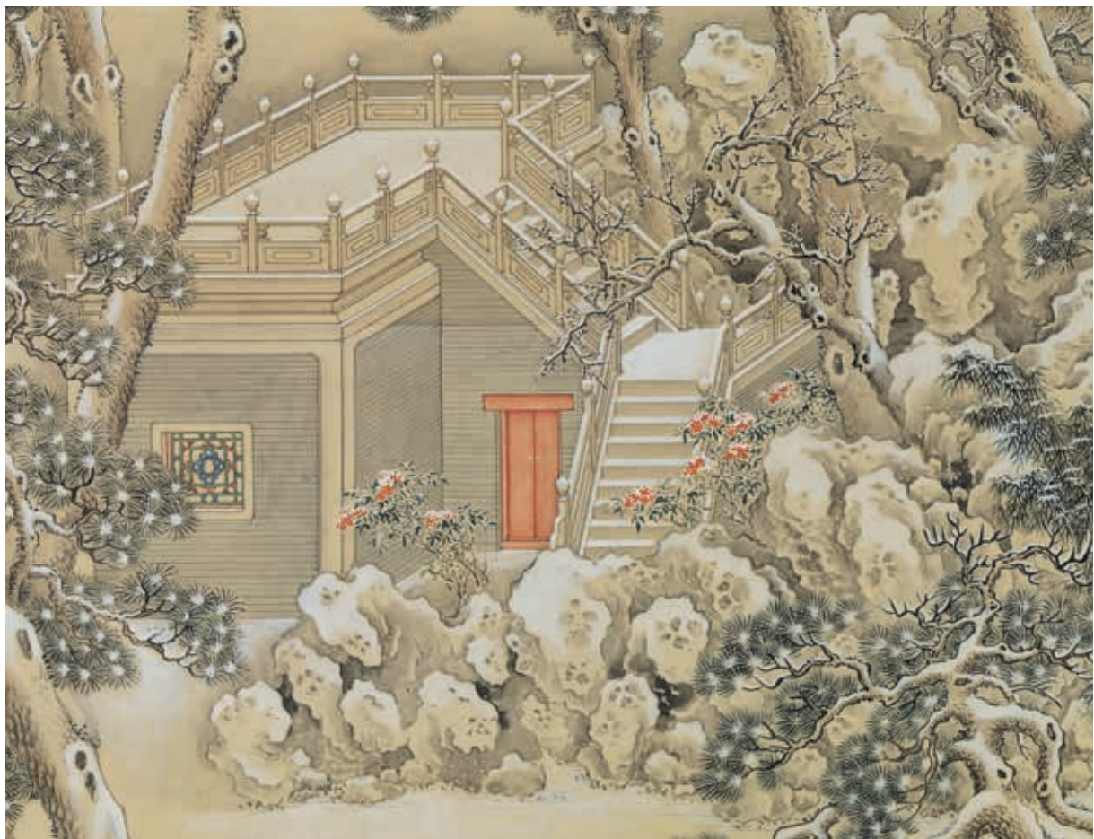
圖9 清 余省 畫大呂星回 局部 露臺