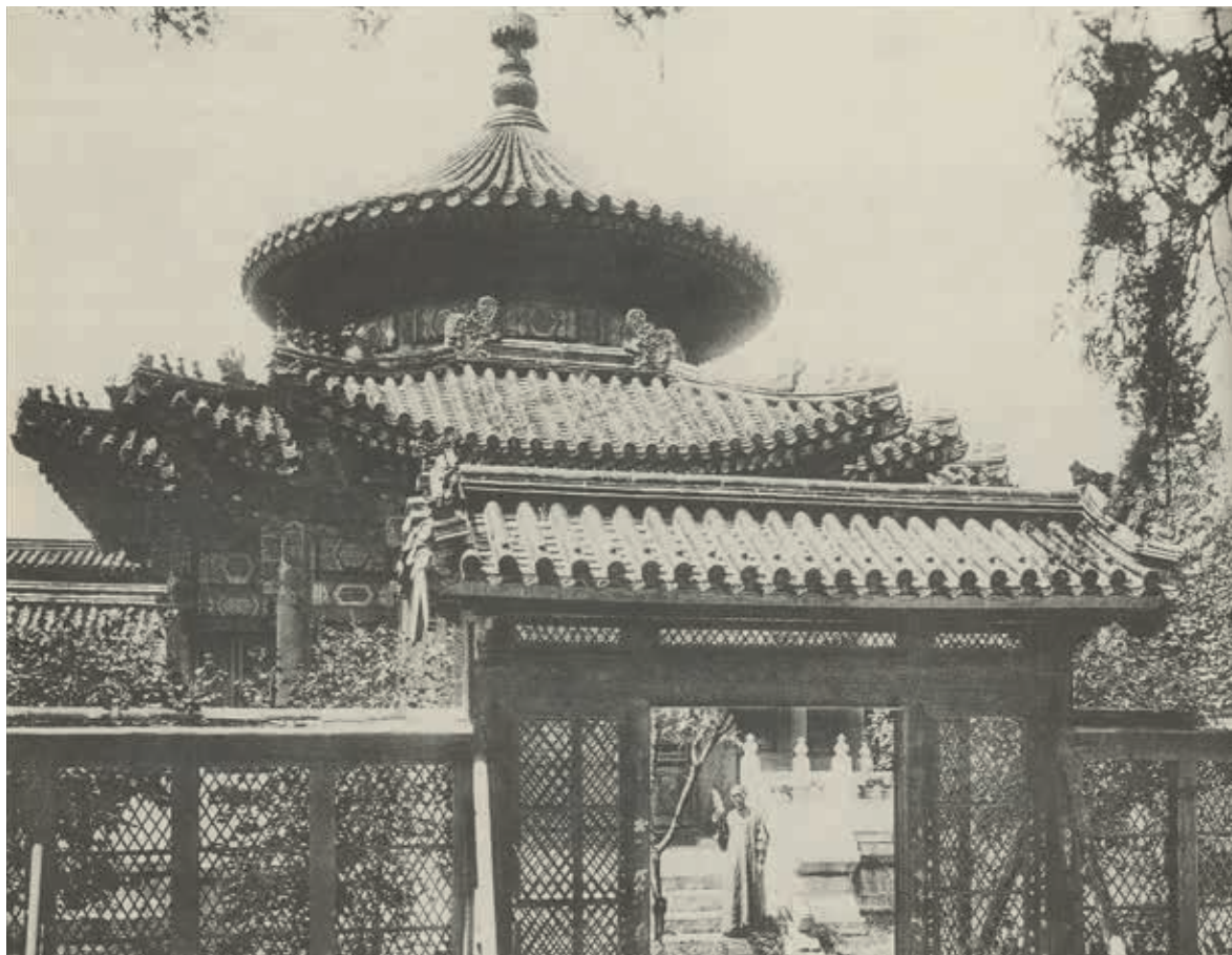
圖4 千秋亭

裝飾「旋子彩畫」，搭配朱紅柱框、隔扇門窗裝修，色彩鮮豔，充分顯示出皇家園林的氣勢。冬天寒冷季節，正面隔扇門安裝有厚布簾，以遮擋寒風。（圖3）不過與實際御苑景區相比，惟千秋亭的亭臺規模比例明顯縮小，這應是為符合構圖透視距離「近大遠小」的緣故。余省所畫的〈畫大呂星回〉記錄了乾隆盛期御花園的冬日美景，若將此軸與二十世紀初拍攝的黑白照片相互比對，可以發現所繪建築群與當時實景恰能一一對應，畫面寫實程度予人一種如臨其境的真實感。 10 （圖4）