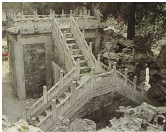
圖10 御花園餵鹿臺 取自天津大學建築工程系編，《清代內廷宮苑》，御花園總平面圖，頁29。

紫禁城御花園區佔地有限，為補救面積狹窄的限制，採曲折佈局取勝。又因地勢較為平坦，故而堆築疊石營造園林地形。古代皇家苑囿有參養珍禽異獸的園林，清宮餵養賞鹿場所就在四神祠南。以磚石砌築的「觀鹿臺」（諧音露臺），可供登臨，居高俯視，觀賞園中古柏與湖石景緻。 15 （圖9）高臺下砌有門洞，築有「T」形兩折臺階可供上下，平臺周邊圍以「尋杖」漢白玉石欄杆（由欄版、望柱頭、淨瓶、華板、地袱組成）。畫中露臺與階梯皆被白雪覆蓋，更突顯出花園裡靜謐幽雅的意境。（圖10）