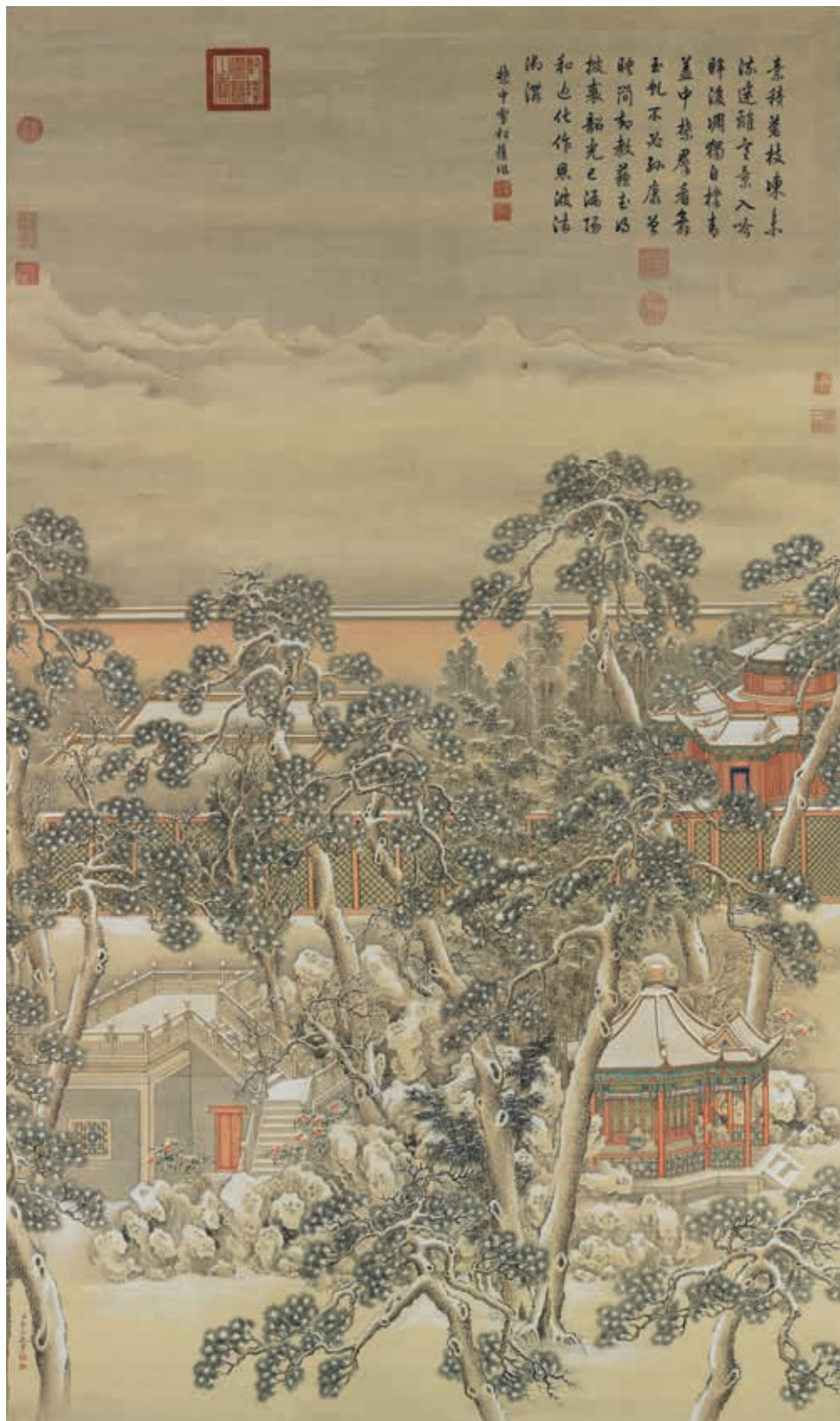
圖1 清 余省 畫大呂星回 國立故宮博物院藏 故畫003057