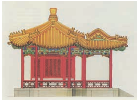
圖8 御花園四神祠東立面 取自王其鈞著，《圖解中國園林》，新北：楓香坊文化出版社，2016，頁39。

色彩鮮艷。轉角有柱子支撐著亭子的狹小迴廊，柱礎為「覆盆式」，外檐柱額與廊內樑枋繪有彩畫。（圖8）四神祠作為園林點景建築，祠旁數峰湖石映襯，湖石整體橫向起伏連綿，紋理似雲頭皴，假山高過四神祠屋檐。