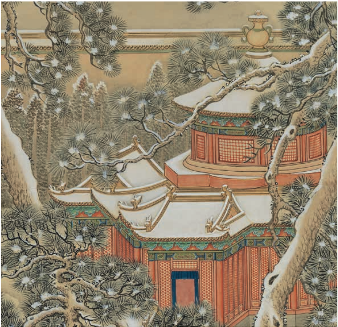
圖3 清 余省 畫大呂星回 局部 千秋亭

檐宇錯落，另以竹籬圍成若干封閉空間，增加遊賞園林的趣味。建物屋頂、地面步道、樹木植栽，均以白粉敷染，斜方格竹製籬牆，隔而不斷，木條上白雪殘留，頗具立體感。