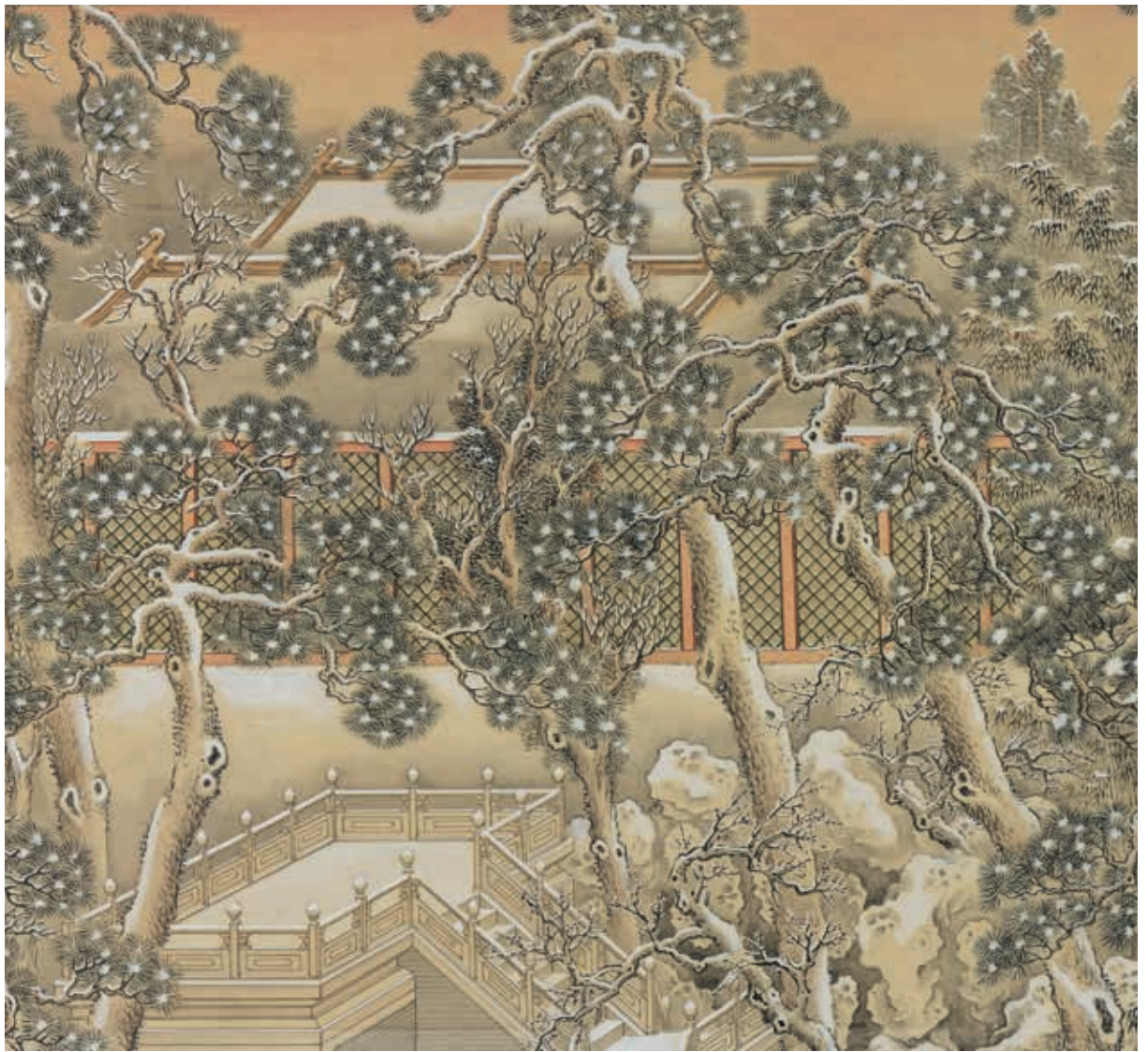
圖5 清 余省 畫大呂星回 局部 養性齋