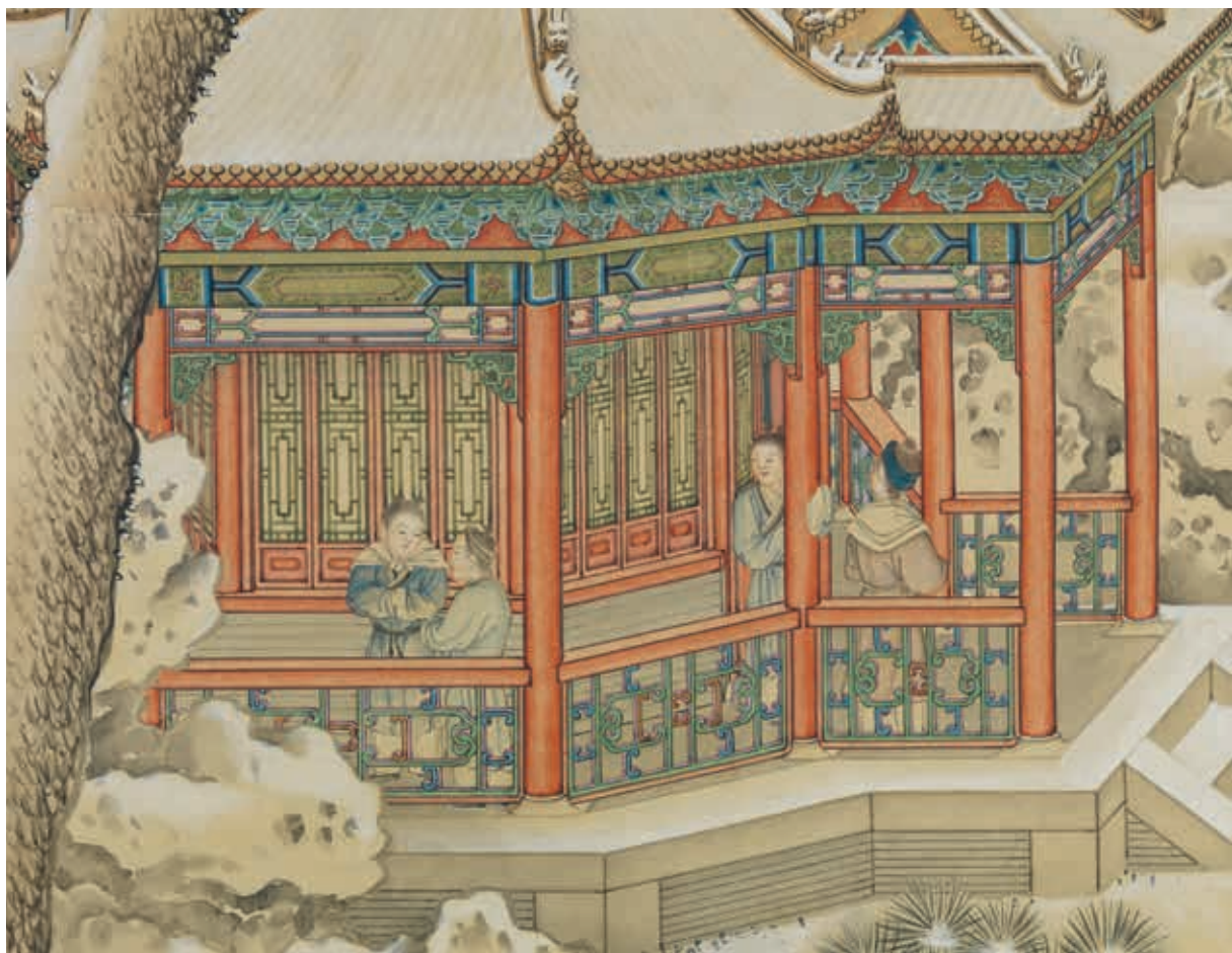
圖11 清 余省 畫大呂星回 局部

余省〈畫大呂星回〉畫中的空間構圖與組景，除了藝術價值，更可視為鉤沉歷史場景的延伸。表現的主題是皇家園林與苑囿，畫中景點建築形式變化多樣，通過畫家精湛的空間佈局，呈現出紫禁城御花園冬日雪後的美景特色。〈十二禁籟圖〉此組畫作不同於合作畫，是由四位畫家單獨完成再組合成套，起稿繪製時已確