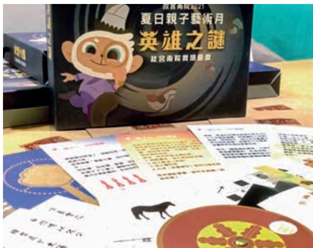
圖9 2021年「夏日親子藝術月」展廳實境遊戲以「英雄之謎」為題，以深入淺出的設計，鼓勵親子觀眾探索真正英雄的本質。

廣南院當期各展廳文物所設計（不限於前揭特展），惟為聚焦本文主題，僅就「英雄的選擇」策劃概念及搭配「遠方的戰爭」特展所設計之兩題實境解謎為例，說明博物館教育活動如何深入淺出地引領觀眾思索「戰爭」這樣沉重深刻的困難議題。（圖8）