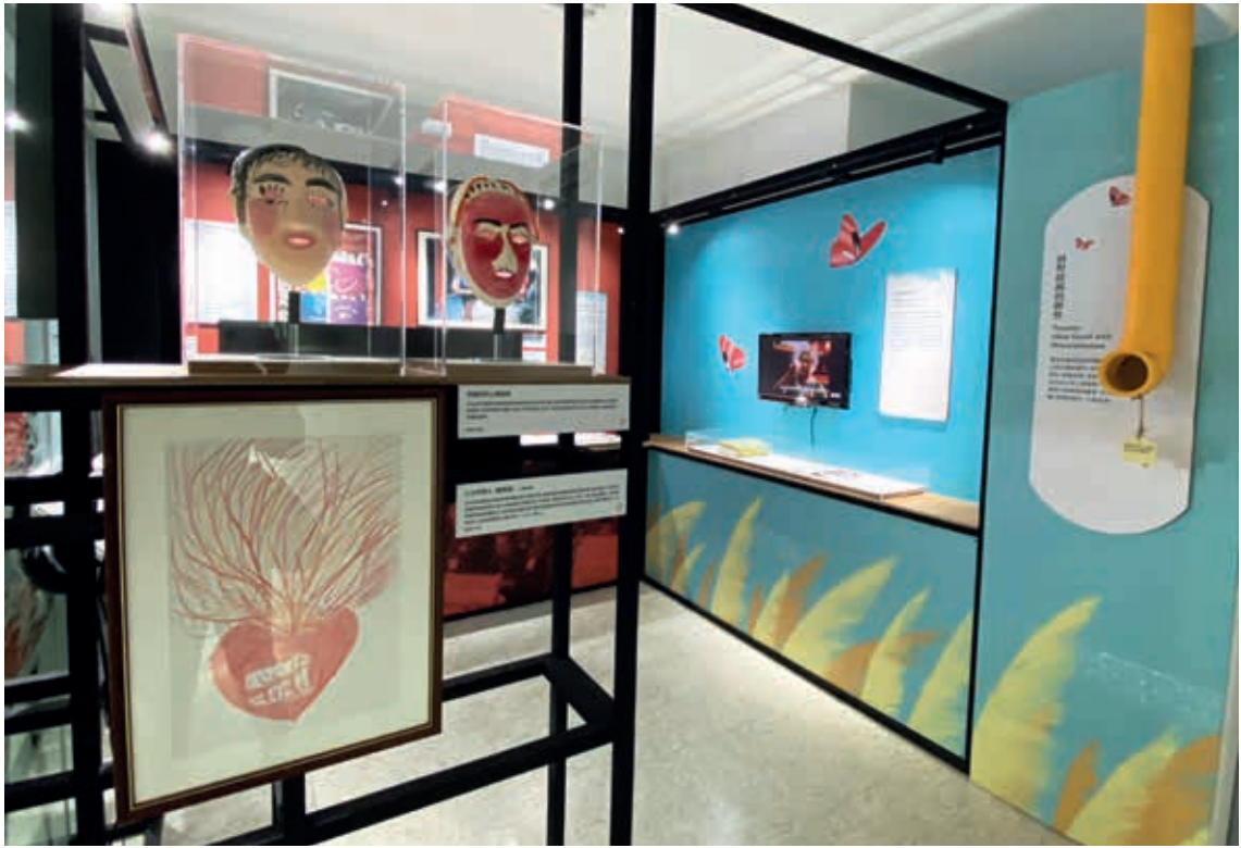
圖7-1 第四單元「面對歧視的韌性」，訴說阿嬤的傷痛不僅在滿是病痛的身體，更在他人的污名化與歧視目光之中。她們在身心工作坊努力與生命和好，並勇敢站出提起訴訟、要求返還正義，體現她們的堅強與韌性。 作者攝