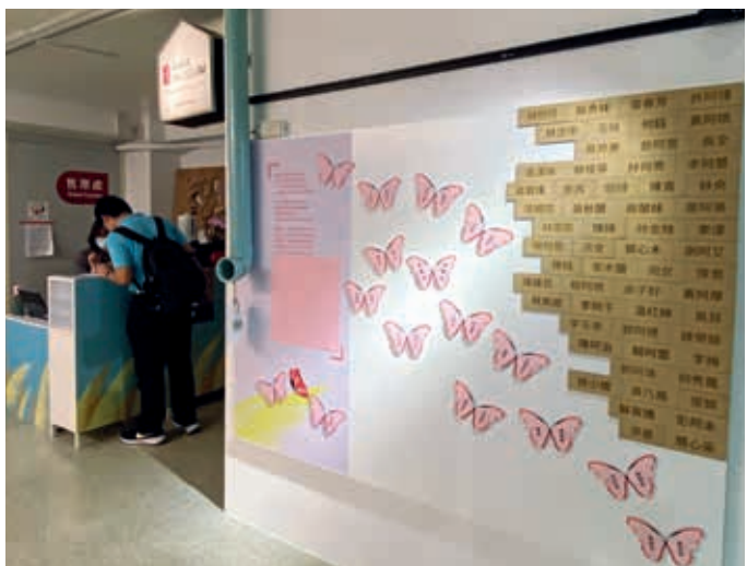
圖3 展示以「請聽，傾聽！」為起點，邀請觀眾親耳傾聽阿嬤們的訴說，並以飛舞的蝴蝶象徵她們終究穿越了傷痛、與生命和好。