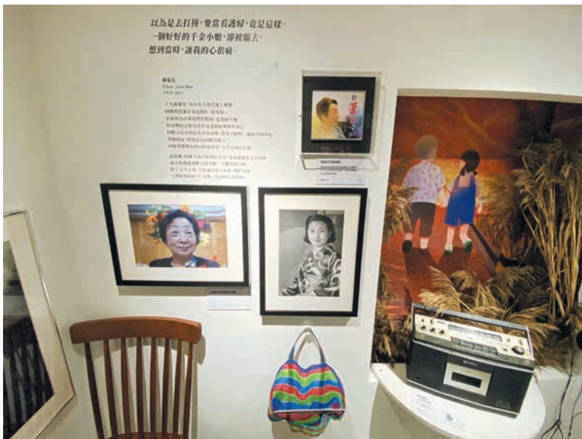
圖6-3 蓮花阿嬤展區。展示並排列阿嬤年輕和年老的照片，讓觀眾意識到她被剝奪的，是如同我們一樣曾有未來的人生。

污名及異樣眼光，展示企盼的，是觀眾在感同阿嬤們的遭遇之際，也思考如何能加入反歧視、反壓迫的行動者行列。（圖6）