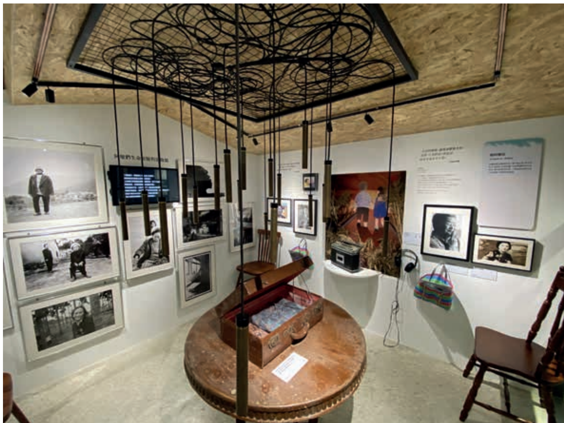
圖6-2 「家屋」空間呈現阿嬤們個人的創傷生命故事，並以人性的同理、連結，召喚觀眾加入反歧視、反壓迫的行動者行列。作者攝