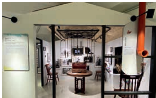
圖6-1 第三單元「我們就是她們」，以「家屋」為概念進行設計。

名則會投影在觀眾手心。敏銳的觀眾或許會發現，溫暖的家屋，對比離鄉背井、在數月至數年間以狹小黑暗的慰安所為起居場所的阿嬤們遭遇，以及她們終於倖存「回家」後所承受的