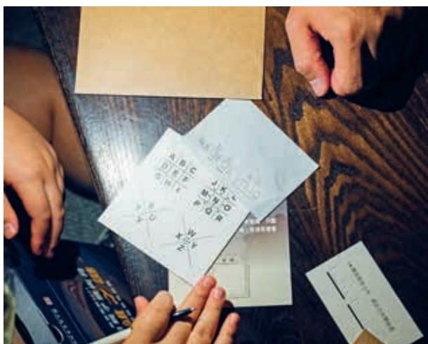
圖11-1 實境解謎關卡六以《平定準噶爾回部得勝圖·格登山斫營圖》為選件，模擬銅版畫凹版印刷效果，觀眾以鉛筆拓印出密碼後，將紙左右翻轉，對照提示可解出「GE DENG SHAN (格登山)」。