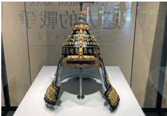
圖13 展廳出口將乾隆皇帝華麗的「嵌東珠寶石盔」及敗戰首領頭盔骨所製成的「陽布拉碗」對照展陳，突顯戰爭的殘酷及成王敗寇之嘆。

【時空出口】呼，看來任務完成了，總算可以回到原來的世界。但戰場的硝煙味一直未散，地面上許多人還在倉皇逃竄，難道大戰還沒有結束嗎？