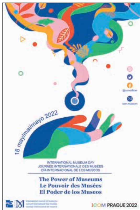
圖1 2022年國際博物館日以「博物館的力量 (The Power of Museums)」為主題。取自國際博物館協會 (ICOM) 網站： https://imdmuseum.com/international-museum-day-2022/the-poster/ ，檢索日期：2022年3月22日。

第二次世界大戰之後，為保存、見證、傳承戰爭歷史傷痛記憶的紀念類型博物館紛紛誕生，如美國華盛頓特區的猶太浩劫紀念館 (United States Holocaust Memorial Museum, USHMM)、以色列的猶太浩劫紀念館 (Yad Vashem)、荷蘭阿姆斯特丹安妮之家 (Anne Frank House)、日本廣島和平紀念館 (Hiroshima Peace Memorial Museum)、臺灣「阿嬤家——和平與女性人權館」等。 8 這些紀念博物館透過對史料及證言的耙梳、整理、詮釋、再現，致力為「困難歷史」(Difficult History) 9 留下紀錄，使受難者或受壓迫者的苦痛得以透過訴說及被理解而分擔，並不至於為歷史及人們所遺忘。