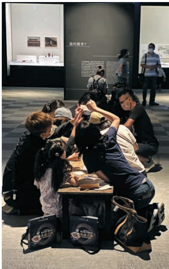
圖11-2 觀眾就著燈光努力解開最具挑戰性的關卡六謎題

者的友好和誠意。乾隆皇帝將其命名為「如意驄」，滿語意為「祥瑞又長壽的青馬」，並命西洋傳教士畫家郎世寧將之繪成巨幅。在展廳及遊戲的家長提示手冊中，觀眾將進一步得到雍正十二年至乾隆十九年（1734-1754）為清、準兩國和平時期的訊息。（圖10）