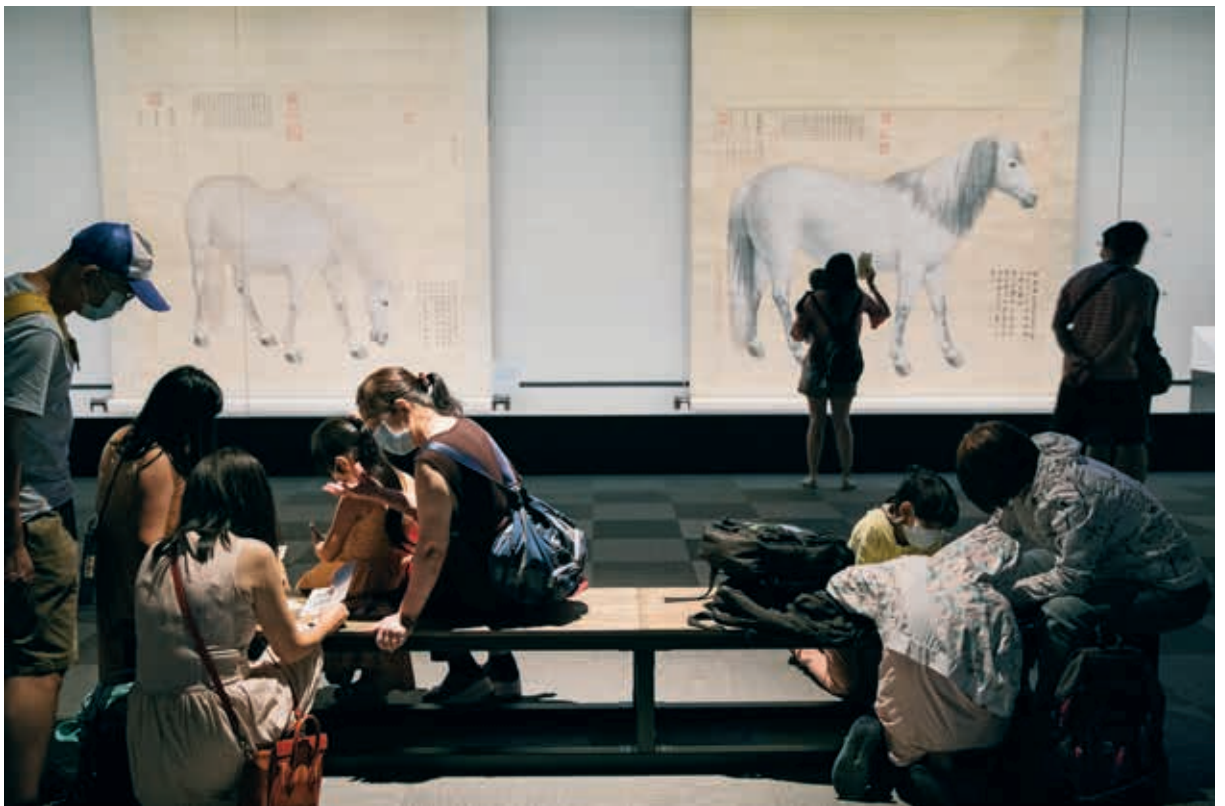
圖10-1 親子觀眾依循遊戲提示尋找展品，一同努力完成解謎任務。

運使用道具及文字提示，觀眾將獲得「十駿圖」、「青馬」及「曾有的美好和平」三重線索，據以找到一幅接近馬兒原尺寸的大畫——清郎世寧（1688-1766）畫《十駿圖·如意驄》。如意驄在乾隆八年（1743）由準噶爾汗噶爾丹策凌（1727-1745 在位）遣使進獻，這匹來自內陸亞洲、極其珍貴的「大宛馬」展現出送禮