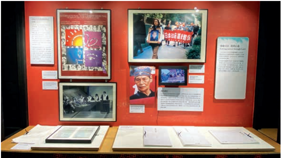
圖7-2 小小的展區以有限篇幅，呈現阿嬤們曾努力透過司法、爭取正義的歷程及訴訟結果。