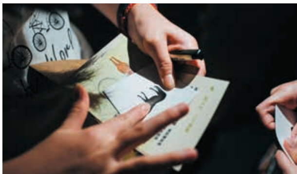
圖10-2 關卡五道具運用密碼表及感溫油墨進行設計