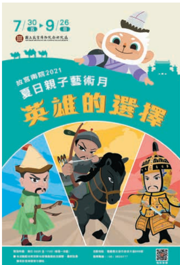
圖8 「故宮南院2021夏日親子藝術月—英雄的選擇」主視覺 南院處提供