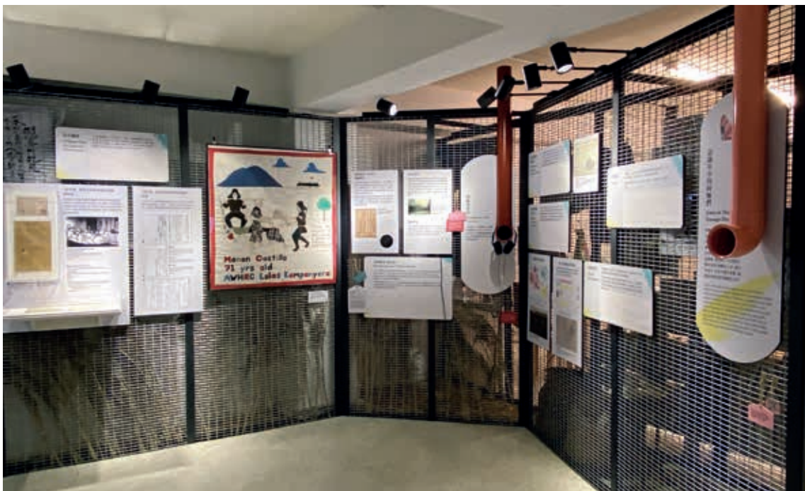
圖4 展示第一單元「認識年少的阿嬤們」，揭露阿嬤多來自貧苦家庭，幫忙養家餬口的需求為後續海外工作埋下伏筆。