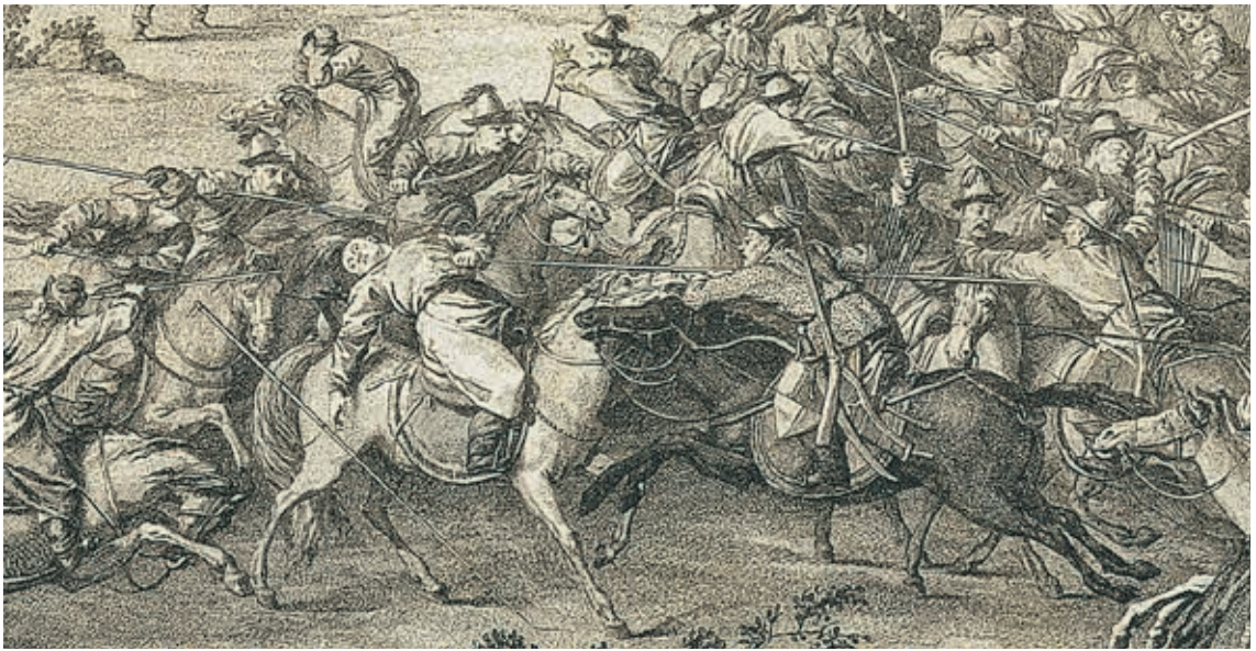
圖12 清 乾隆 《平定準噶爾回部得勝圖·格登山斬營圖》 國立故宮博物院藏 平圖21228 畫面中央身騎黑馬、手持長矛刺向敵軍胸前的，即為清帝國立下大功的阿玉錫。

達瓦齊及其軍隊潰散奔逃，超過七千人投降。一個月後，達瓦齊被俘，準噶爾汗國滅亡。 14