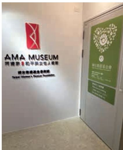
圖2 2021年重新開館的「阿嬤家」隱身於大樓之內

展示的第二單元「誘騙與脅迫」，援用1996年聯合國人權委員會特別調查員的報告，指出慰安婦制度為「日本戰時軍事性奴隸制度」，並以史料（電報、渡航證、慰安所遺址考證及照片等）搭配倖存者證言，呈現該制度是日本政府建置的證據，以及阿嬤們是被騙、被迫、非自願成為軍隊性奴隸，隱含回應在多年慰安婦人權運動中，日本政府否認軍方參與（認定為民間業者之商業行為）、否認強徵（認定慰安婦為自願賣春）等言論。 11 （圖5）