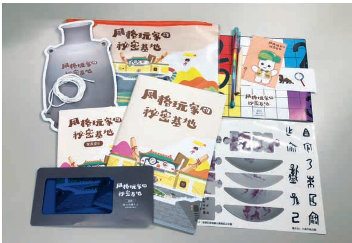
圖11 「風格玩家的秘密基地」親子探索包內容物。