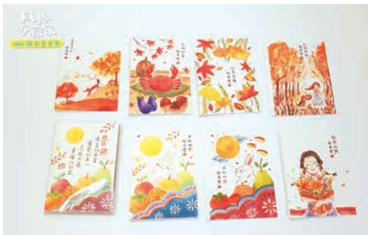
圖9 「琺瑯彩瓷的詩文情懷」線上教學影片，鼓勵大小朋友連結自己的生活經驗，進行圖文印創作。