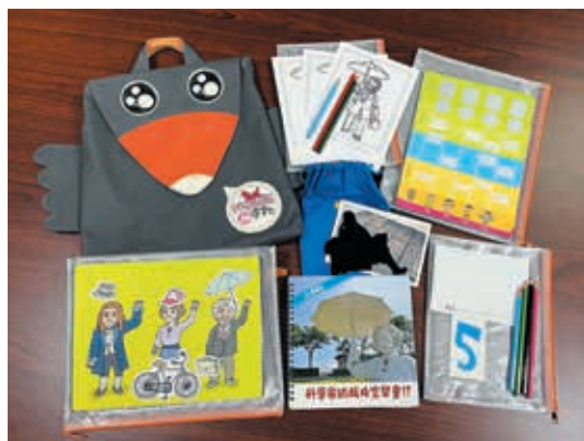
圖10 朱銘美術館「尋寶包」內容物。

自己喜歡的瓷器名稱。再補充陶器與瓷器的小知識，請小朋友連結自己的日常生活，思考家中有哪些陶製品或瓷製品，則是結合了「文物觀察」與「文物再思考」兩類題型，希望能夠