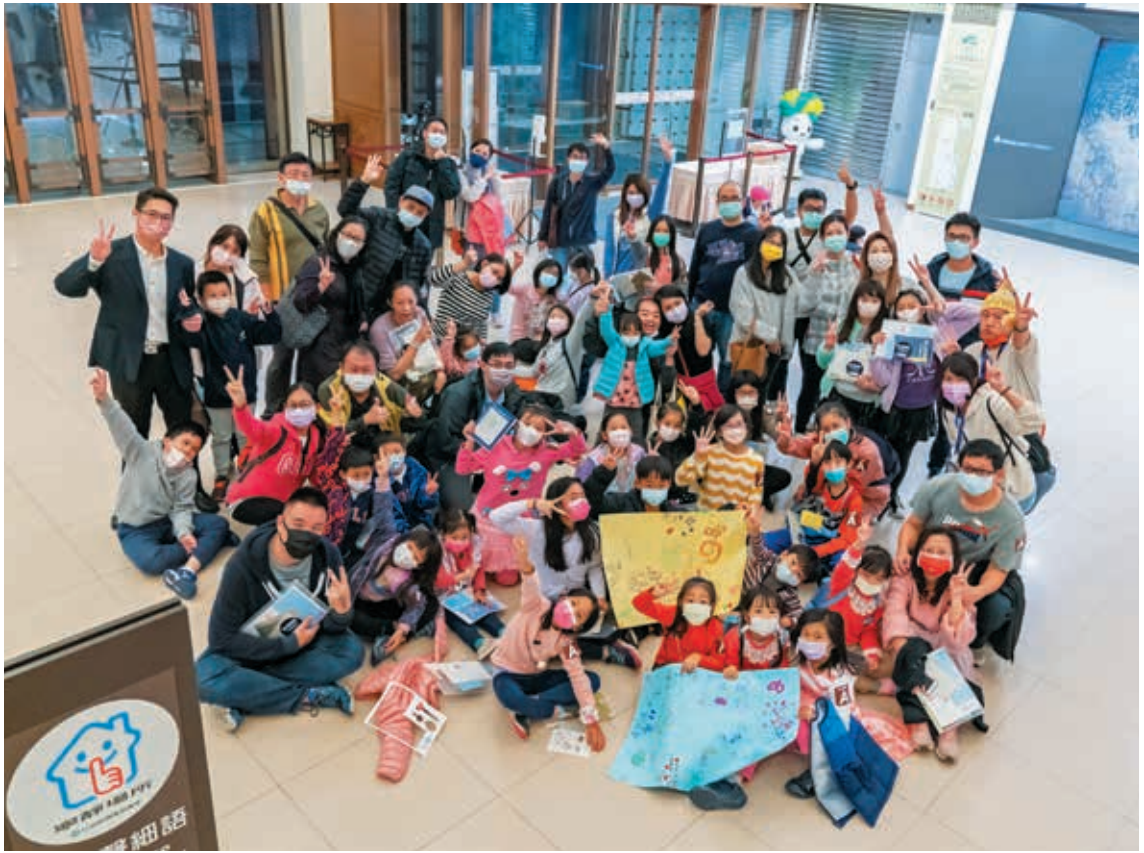
圖2 許多兒童親子觀眾熱情參與「2021故宮童樂節」的密室逃脫活動。

為在具備更高能力的教師或同儕協助引導下，可提升兒童的能力發展。維高斯基亦強調遊戲對於兒童認知發展的重要性，指出兒童在遊戲中創造「想像情境」，借用物件的表徵過程可提升抽象思考能力，而遊戲當中的人際互動則可促進認知發展。 5 維高斯基的「近側發展區間」理論為親職教育奠定了基石，其對於「遊戲」及「想像」的重視，亦成為本次「故宮童樂節」的重要參照之一。另一方面，博物館學者亦陸續指出「想像」對於博物館經驗或學習的重要性。Beverly Serrell 在 1996 年借用 Bernice McCarthy 的 4 MAT 學習模式，區分在博物館學習的四種觀眾，分別為「分析的」(analytical)、「想像的」