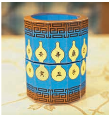
圖8 「筆筒轉轉趣」線上教學影片，利用簡易紙板操作，認識筆筒的旋轉原理。取自《國立故宮博物院YouTube頻道》： https://www.youtube.com/watch?v=XCngTVG8q0o ，檢索日期：2022年3月11日。

除了在題目上設定難易差別，並設定適齡的闖關條件之外，本次親子探索包亦設計「互動解謎」、「文物觀察」、「文物再想像」以