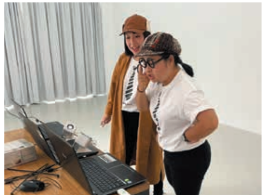
圖6 「故宮·藝想世界」親子劇場中，「咖哩玩劇團」講師與學員熱烈地線上互動。