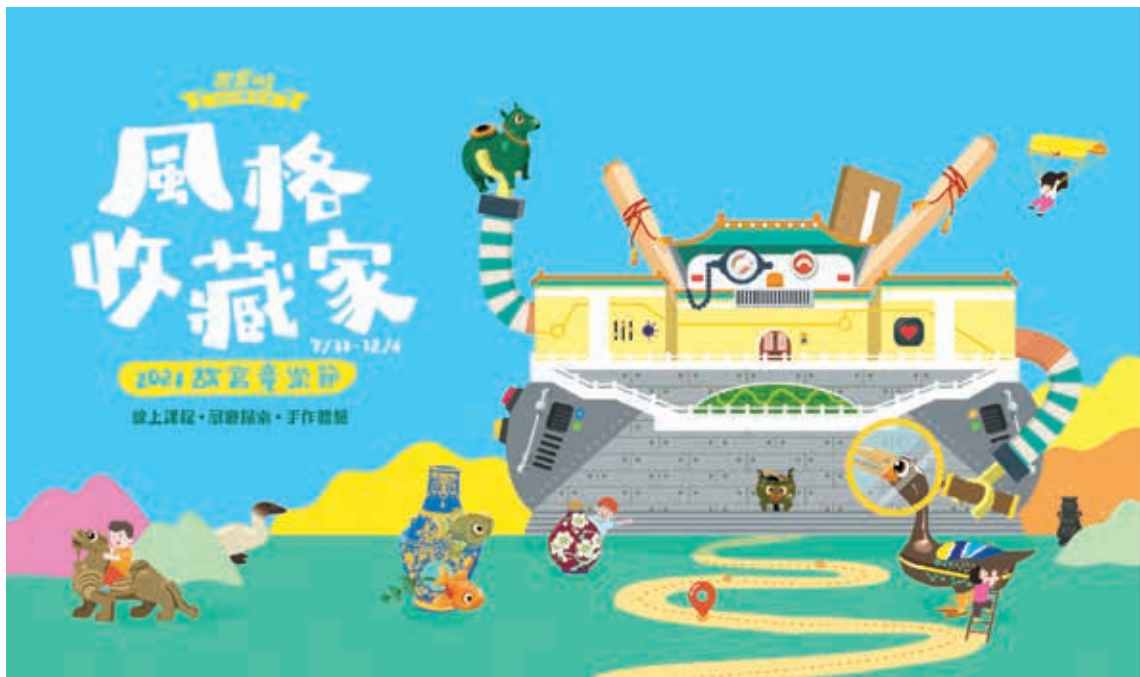
圖 1 「2021 故宮童樂節」主視覺。

述說對文物的看法與想像。10月以後，隨著國內疫情趨緩，則陸續推出青銅科學實驗、鼻煙壺彩繪製香等手作課程，以及「曲水流觴派對」、「未來人的考察筆記」密室逃脫等互動探索活動，並舉辦流行音樂演出與兒童劇場等兩場大型表演。「風格收藏家——2021 故宮童樂節」就是一場大型的藝術約會（圖 2～4），邀請觀眾在線上及展廳相會，進行一系列的美力探索。