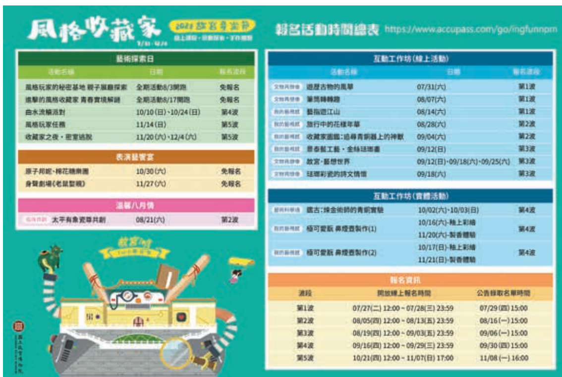
圖3 「2021故宮童樂節」活動總覽。