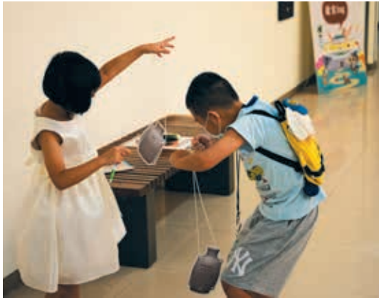
圖12 小朋友興味盎然地進行「白瓷穿帶壺」互動體驗。

促進小朋友的觀察能力，從中思考文物的本質、用途與當代的連結，建立自己的觀點、表達喜好與審美價值。（圖 13）在破解闖關展廳位置時，則運用「互動解謎」題型，透過多型態的