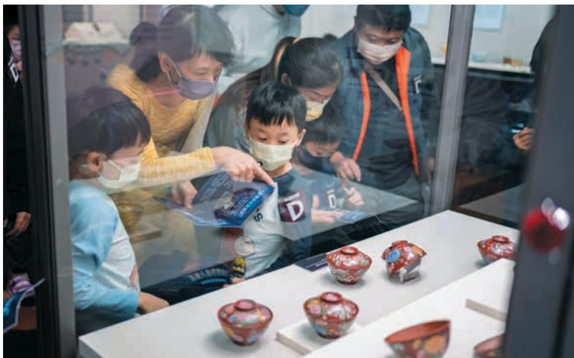
圖4 「2021故宮童樂節」期望能促進兒童親子觀眾針對文物進行觀看、互動以及再想像。