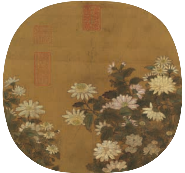
圖21 宋 林椿 秋晴叢菊 國立故宮博物院藏