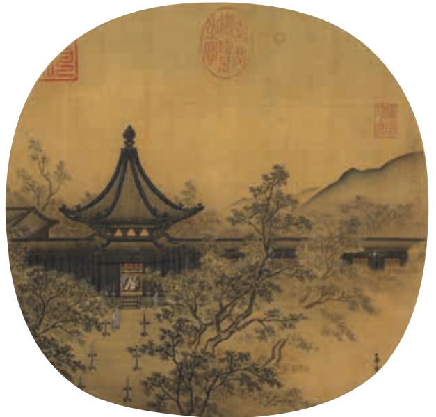
圖17 宋 馬麟 秉燭夜遊 國立故宮博物院藏

宋代花卉畫家進行類似詩人「詠物形容之妙」，花卉畫對物象不僅須畫得像，更要能掌握神態。例如宋徽宗時期龍德宮建成，特別喜愛新進少年畫斜枝月季的故事，即深刻反映北宋末畫家於花卉畫的講究；「徽宗建龍德宮成，命待詔圖畫。宮中屏壁皆極一時之選，上來幸，一無所稱。獨顧壺中殿前柱廊棋眼斜枝月季花。