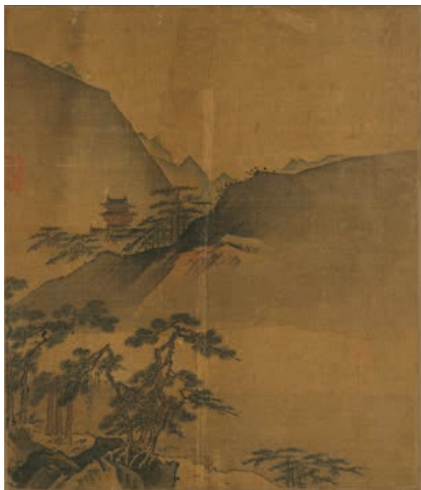
圖9-3 宋 葉肖巖 西湖十景圖 南屏晚鐘 國立故宮博物院藏