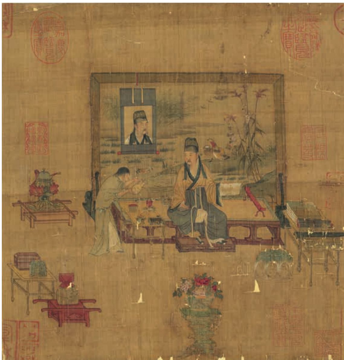
圖6 宋 無款 人物 國立故宮博物院藏

曠的景象，稱為「小景」，在當時被認為充滿詩意。 5 惠崇雖無畫作流傳至今，不少傳世作品仍見這類汀渚水禽題材，且大多表現水境迷濛、虛曠景象，堪稱惠崇「小景」的影響。此次展出傳惠崇〈寒林鴛鳥〉（圖5），做為這類題材流傳例作。