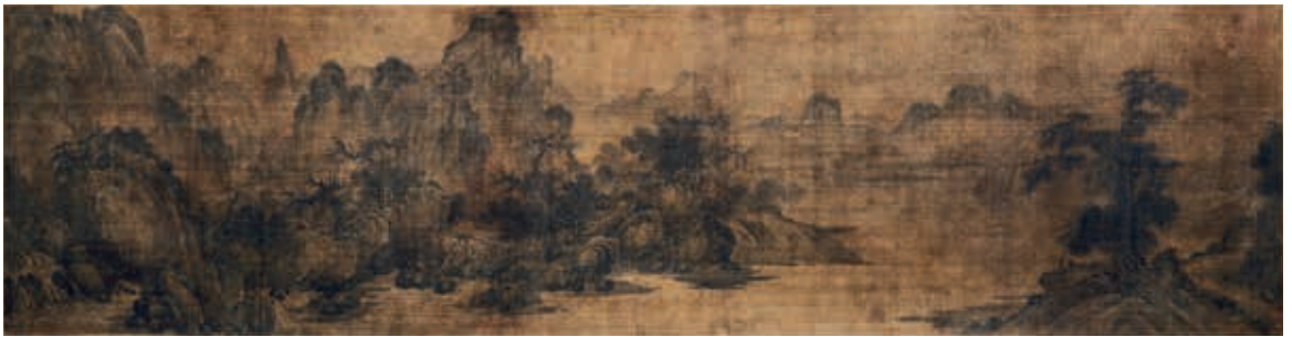
圖10-3 宋 王洪 瀟湘八景 煙寺晚鐘 Princeton University Art Museum藏 Edward L. Elliott Family Collection. Museum purchase, Fowler McCormick, Class of 1921, Fund.