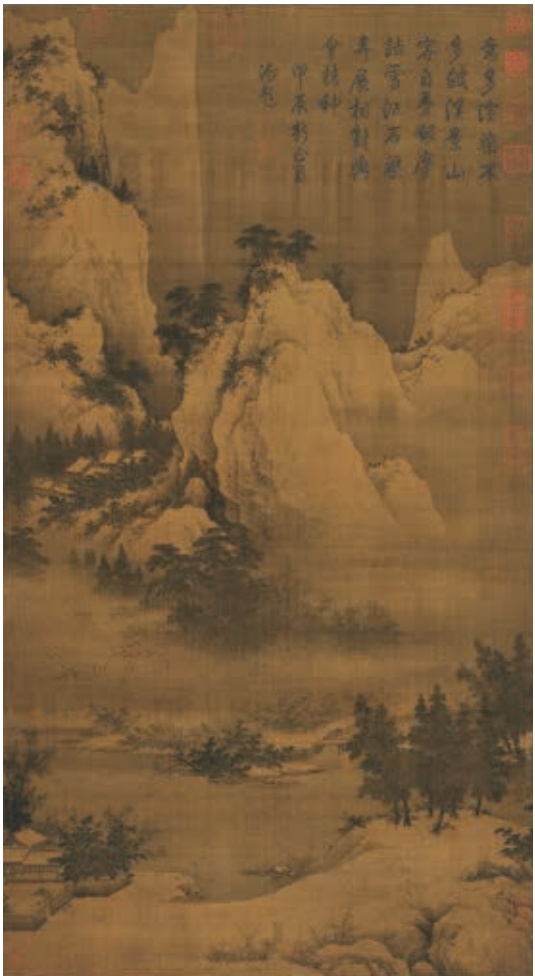
圖8 宋 無款 溪山暮雪 國立故宮博物院藏

繪蜿蜒水岸兩旁遍植橙橘的情景，沙渚之間尚有棲息的鶺鴒、雙鳧。全幅以略帶迷濛的煙林野岸構圖，結合汀渚水禽題材「小景」畫風，表現對幅孝宗書寫蘇軾〈贈劉景文詩〉：「一年好處君須記，正是橙黃橘綠時」詩意，是幅精彩的詩畫作品。畫幅和書幅原為團扇，後裱裝成冊頁。雖舊傳北宋宗室趙令穰（約活動於西元 1070 ~ 1100 年間）作，從畫風判斷，應為南宋初年宮廷畫家作品。 6