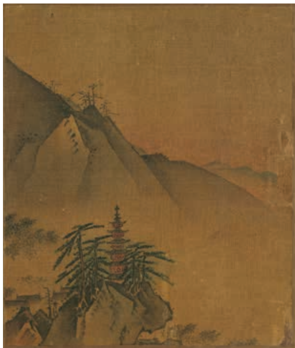
圖9-1 宋 葉肖巖 西湖十景圖 雷峰夕照 國立故宮博物院藏