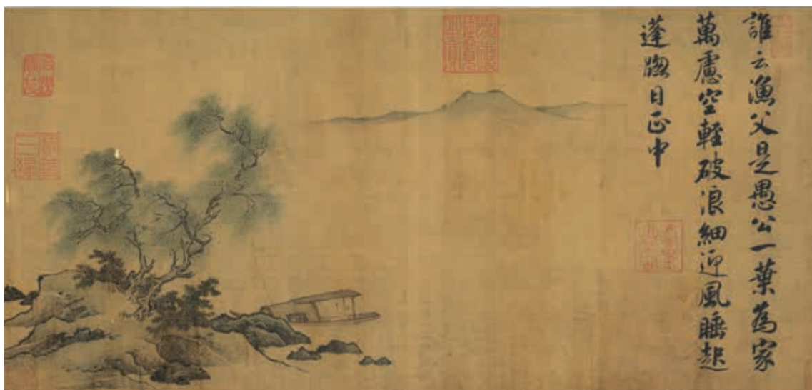
圖3 宋 無款 蓬窗睡起 國立故宮博物院藏