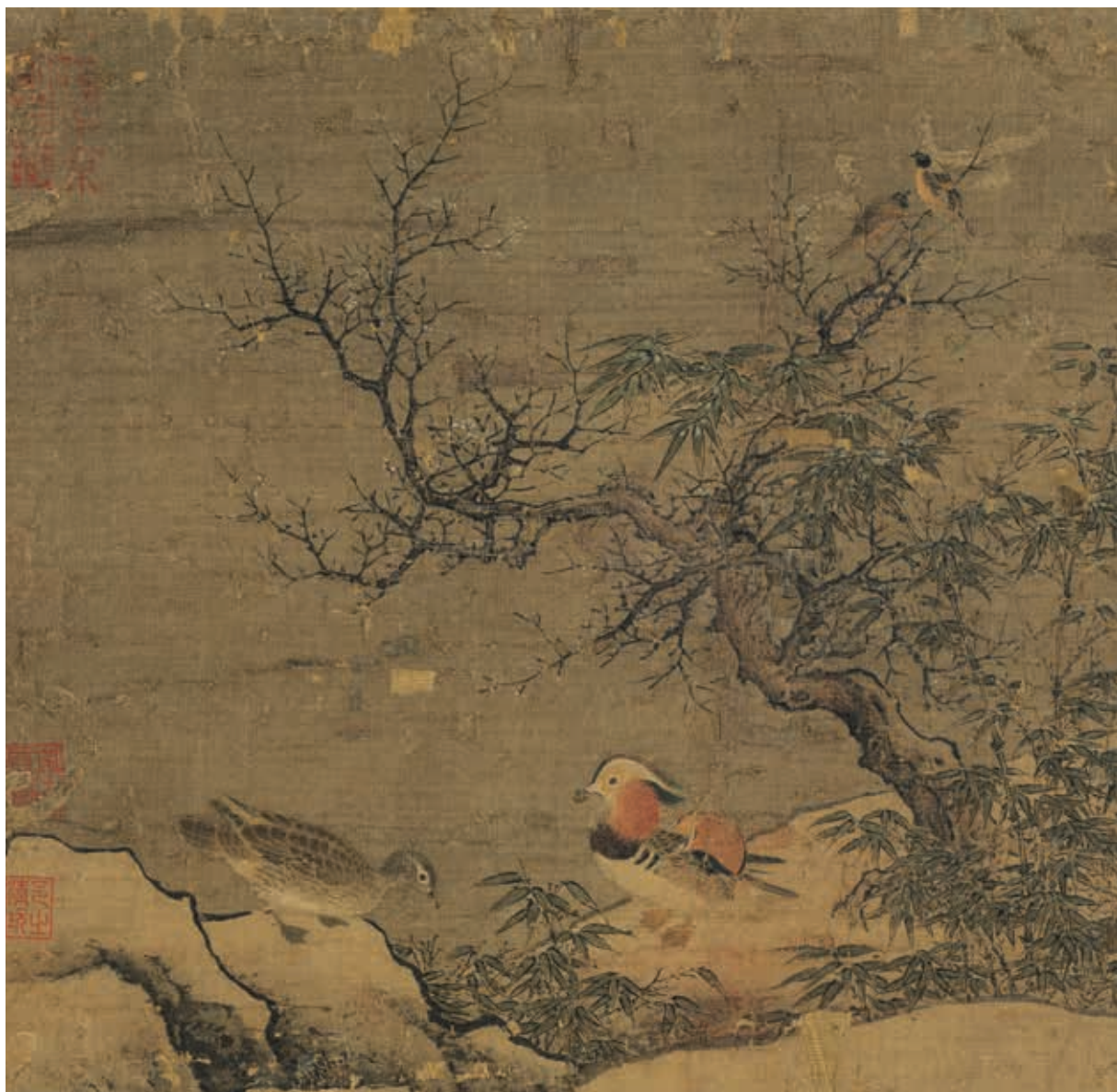
圖6 傳宋 惠崇 寒林鷺鳥 國立故宮博物院藏