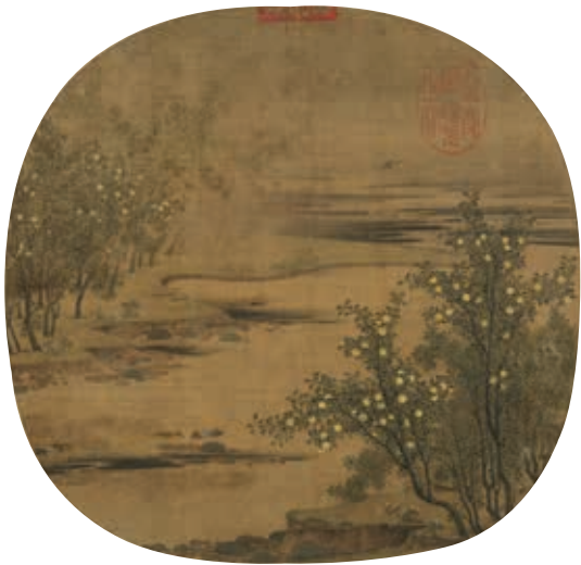
圖7 傳宋 趙令穰 橙黃橘綠 國立故宮博物院藏