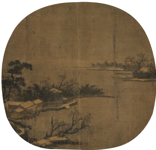
圖13 宋 無款 平湖雪霽 國立故宮博物院藏