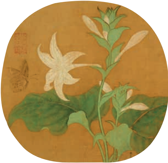
圖20 宋 林椿 寫生玉簪 國立故宮博物院藏