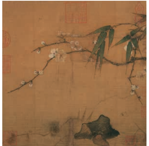
圖23 宋 馬麟 暗香疏影 國立故宮博物院藏

暗香浮動月黃昏。」畫面斜梅枝與稀疏竹影掩映，自右向左斜出，轉折角度細膩優雅，背景空無一物。水面倒映梅枝與竹葉，亦隱約可見白色花苞與綠色花萼。不畫月卻表現月下梅影，份外清雅。而畫中白梅花萼染石綠、胭脂，