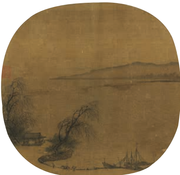
圖12 宋 無款 柳亭行旅 國立故宮博物院藏

從葉肖巖《西湖十景圖》具體來看，小巧的畫幅表現四時晨昏下西湖不同景致，藉著廣闊的水域和迷濛霧氣營造詩意氛圍。