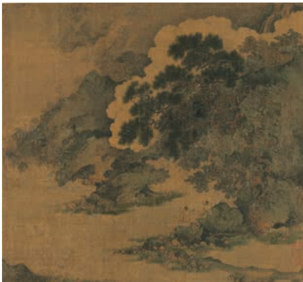
圖14 宋 李唐 坐石看雲 國立故宮博物院藏

李唐〈坐石看雲〉畫深林間泉瀑有聲，青翠松樹盤繞著，眼前盡現雲霧蒸騰的景象。溪水旁二位高士臨流濯足，神態至為愉悅。看這幅作品可以體會唐代詩人王維（699-761）〈終南別業〉詩：「行到水窮處，坐看雲起時」詩意，是一件「畫中有詩」的作品。在北宋語境之中，「有聲畫」原本指「詩」，例如釋惠洪（1070-1128）〈宋迪作八景絕妙。人謂之無聲句。演上人戲余曰。道人能作有聲畫乎。因為之各賦一首〉。 9 但值得注意的是在此種藝術潮流之下，從藝評家鄧椿（生卒年不詳）《畫繼》：「宋復古（宋迪）八景，皆是晚景，其間煙寺晚鐘，瀟湘夜雨，頗費形容。鐘聲固不可為，而瀟湘夜矣，又復雨作，有何所見，蓋復古先畫而後命意，不過略具掩靄慘淡之狀耳。後之庸工學為此題，以火炬照纜，孤燈映船，其鄙淺可惡。」 10 可見鄧椿已關注一些具有詩意的畫題，例如〈瀟湘八景〉之中「瀟湘夜雨」、「煙寺晚鐘」，實難以繪畫形式傳達聲音意境。然而現存南宋