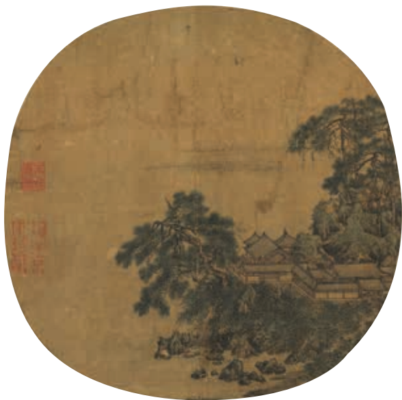
圖11 宋 閻次平 松磴精廬 國立故宮博物院藏