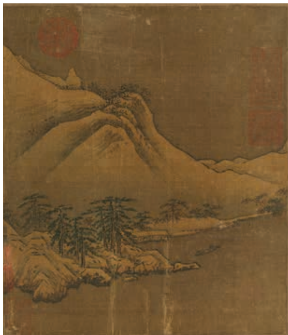
圖9-4 宋 葉肖巖 西湖十景圖 斷橋殘雪 國立故宮博物院藏