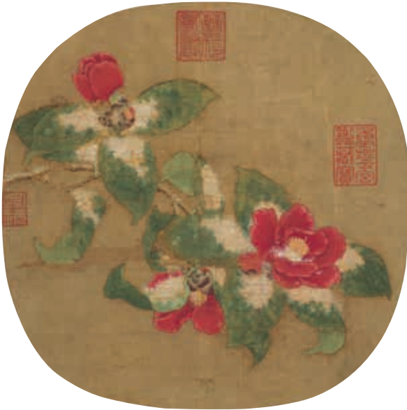
圖22 宋 林椿 山茶霽雪 國立故宮博物院藏