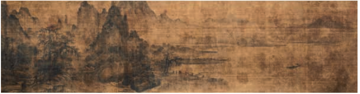
圖10-1 宋 王洪 瀟湘八景 漁村夕照 Princeton University Art Museum藏 Edward L. Elliott Family Collection. Museum purchase, Fowler McCormick, Class of 1921, Fund.