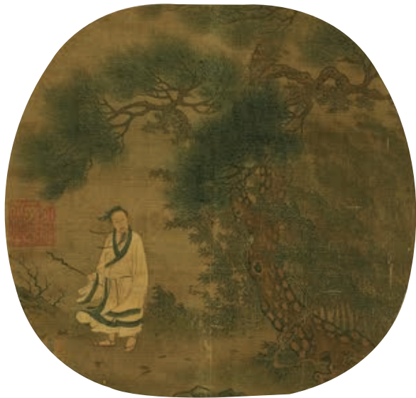
圖15 傳宋 許道寧 松下曳杖 國立故宮博物院藏

李唐〈坐石看雲〉畫深林間泉瀑有聲，青翠松樹盤繞著，眼前盡現雲霧蒸騰的景象。溪水旁二位高士臨流濯足，神態至為愉悅。看這幅作品可以體會唐代詩人王維（699-761）〈終南別業〉詩：「行到水窮處，坐看雲起時」詩意，是一件「畫中有詩」的作品。在北宋語境之中，「有聲畫」原本指「詩」，例如釋惠洪（1070-1128）〈宋迪作八景絕妙。人謂之無聲句。演上人戲余曰。道人能作有聲畫乎。因為之各賦一首〉。 9 但值得注意的是在此種藝術潮流之下，從藝評家鄧椿（生卒年不詳）《畫繼》：「宋復古（宋迪）八景，皆是晚景，其間煙寺晚鐘，瀟湘夜雨，頗費形容。鐘聲固不可為，而瀟湘夜矣，又復雨作，有何所見，蓋復古先畫而後命意，不過略具掩靄慘淡之狀耳。後之庸工學為此題，以火炬照纜，孤燈映船，其鄙淺可惡。」 10 可見鄧椿已關注一些具有詩意的畫題，例如〈瀟湘八景〉之中「瀟湘夜雨」、「煙寺晚鐘」，實難以繪畫形式傳達聲音意境。然而現存南宋