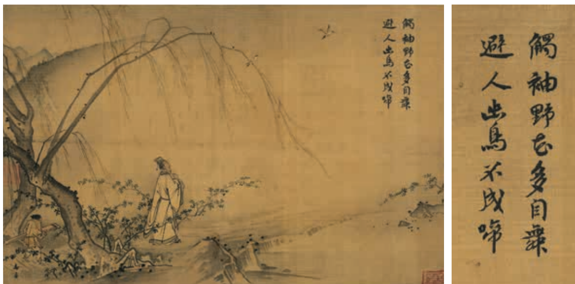
圖4 宋 馬遠 山徑春行 國立故宮博物院藏

馬遠（活動於1190-1224）〈山徑春行〉（圖4）為南宋詩畫融合代表作，詩境萃取精煉，構圖亦經過巧妙構思，筆墨極其精微。寧宗題詩「觸袖野花多自舞，避人幽鳥不成啼」。畫面近景高士頭戴漆紗籠冠，漫步駐足於柳樹花徑。題詩以單聯轉化北宋程顥（1032-1085）〈春日偶