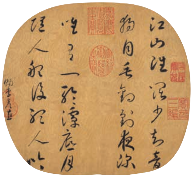
圖2 宋 孝宗 詩帖 國立故宮博物院藏

北宋末徽宗創立「畫學」，並以「詩題甄試畫士」，繪畫表達詩境成爲宮廷畫家重要課題。南宋皇帝亦提倡繪畫融合詩詞藝術，宮廷畫家作品可見皇帝題寫詩詞。無款〈蓬窗睡起〉（圖3）畫幅上孝宗題寫高宗作〈漁父詞〉：「誰云漁父是愚公。一葉爲家萬慮空。輕破浪。細迎風。睡起蓬牕日正中。」據載高宗曾經觀覽黃庭堅書寫的唐代張志和（生卒年不詳）〈漁父詞〉十五首，並且作詞戲和其韻。〈蓬窗睡起〉的〈漁父詞〉爲其中第十一首。 2 帝王於繪畫作品題寫〈漁父詞〉前例還可溯及南唐李後主（937-978）〈漁父詞二首〉題〈春江釣叟圖〉：「其一曰：浪花有意千里雪，桃花無言一隊春。一壺酒，一竿鱗，世上如儂有