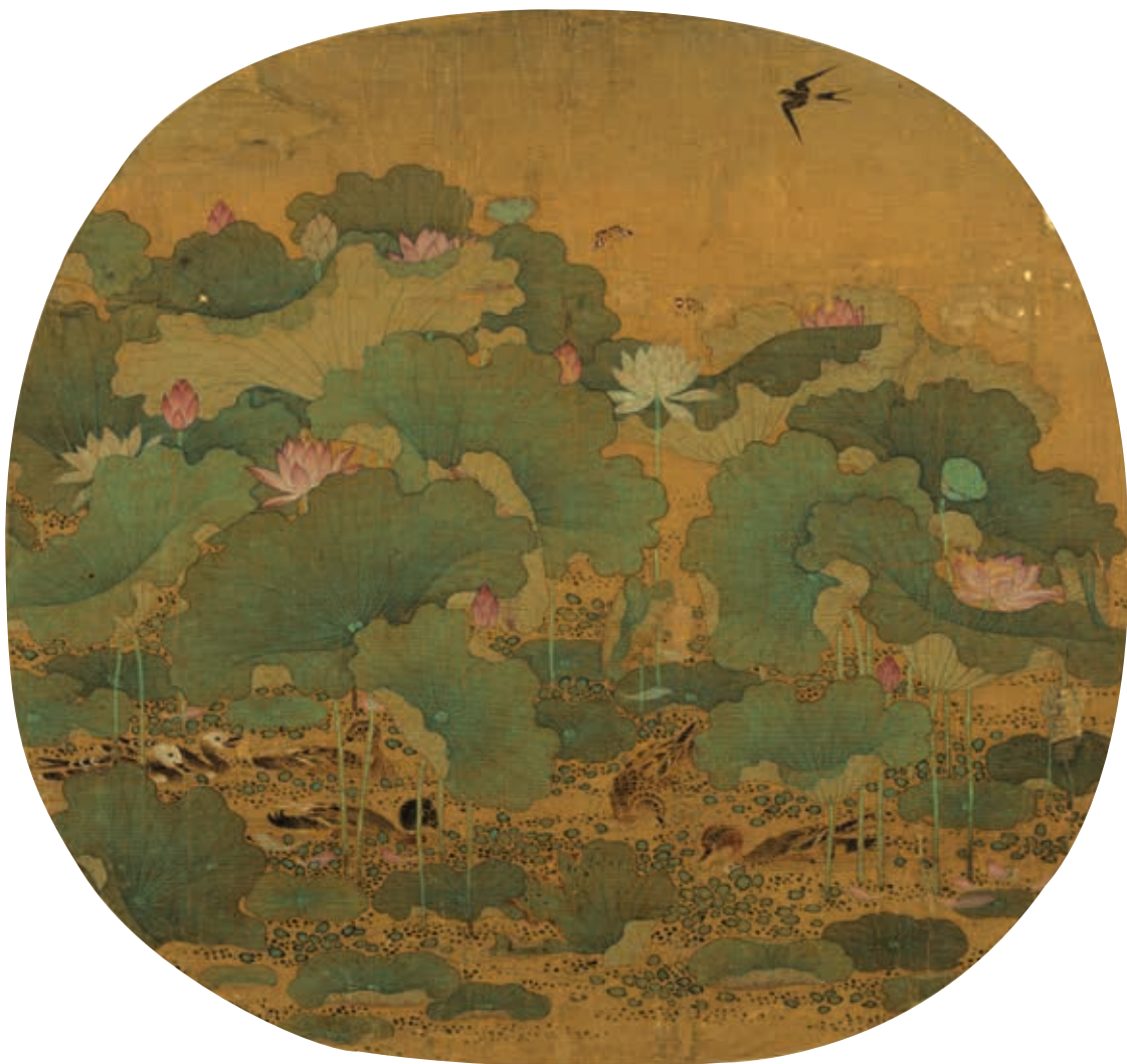
圖16 宋 馮大有 太液荷風 國立故宮博物院藏

的荷花，為南宋宮廷刻意營造的時序美感。孝宗淳熙間（1174-1189）作翠寒堂，翠寒堂為禁中避暑之所。周密《武林舊事》載：「……及翠寒堂納涼……有寒瀑飛空，下注大池可十畝。池中紅白菡萏萬柄，蓋園丁以瓦盎別種，分列水底，時易新者，庶幾美觀。……」孝宗曾在宮苑池中種紅、白荷花萬柄，以瓦盆別種，分列水底，時易新者，以為美觀。 12 紅、白相間荷花也是同時代文人喜愛吟詠的題材，楊萬里