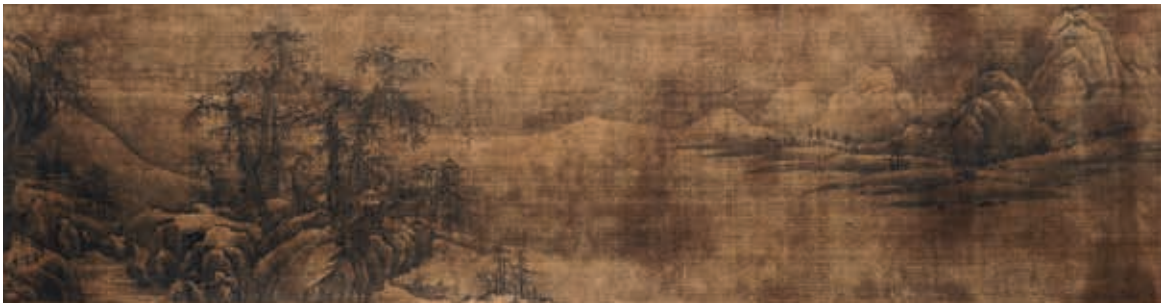
圖10-4 宋 王洪 瀟湘八景 江天暮雪 Princeton University Art Museum藏 Edward L. Elliott Family Collection. Museum purchase, Fowler McCormick, Class of 1921, Fund.