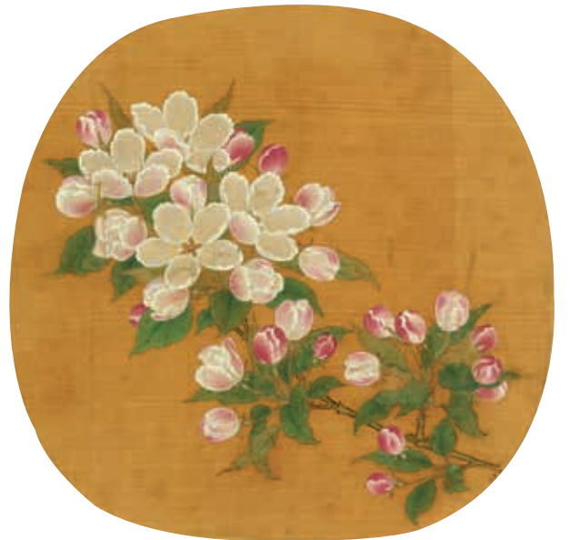
圖19 宋 林椿 寫生海棠 國立故宮博物院藏

問畫者為誰，實少年新進。上喜，賜緋褒錫甚寵，皆莫測其故。近侍嘗請於上。上曰：『月季鮮有能畫者。蓋四時朝暮，花葉皆不同。此作春時日中者，無毫髮差，故厚賞之。』 18