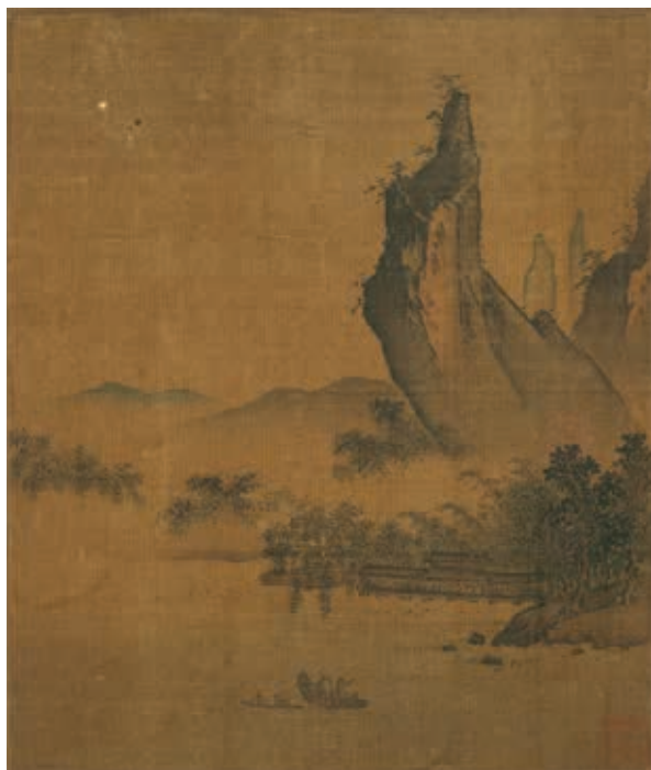
圖9-2 宋 葉肖巖 西湖十景圖 平湖秋月 國立故宮博物院藏