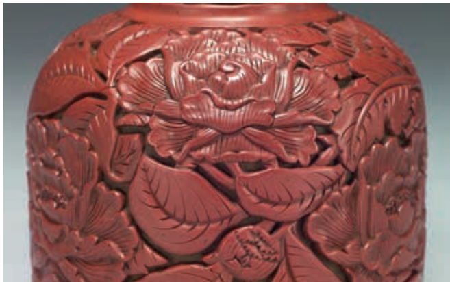
圖17 明 永樂 剔紅花卉長頸瓶 局部 國立故宮博物院藏