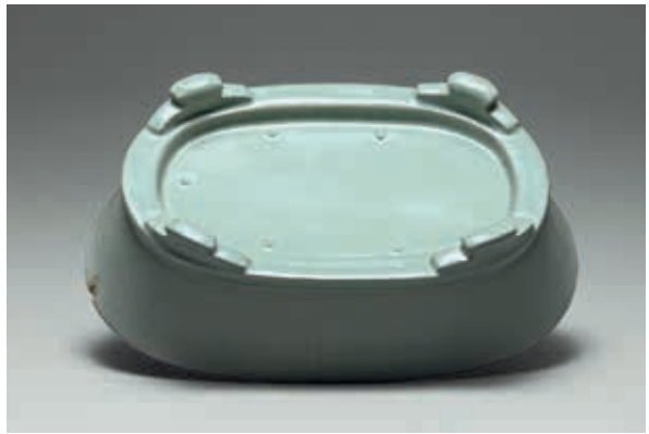
圖15 北宋 汝窯 青瓷水仙盆 器底 國立故宮博物院藏

以天青色釉色聞名的汝窯青瓷，窯址位於河南省寶豐縣清涼寺。汝窯傳世數量稀少，水仙盆尤為如此，傳世僅存六件；本院有四件，源自清宮舊藏。此次展出的北宋汝窯〈青瓷水仙盆〉（圖13），是院藏當中唯一無加刻乾隆御製詩，口沿亦無後世施加的金屬扣，最大程度呈現水仙盆的原貌。水仙盆盆身作橢圓形、