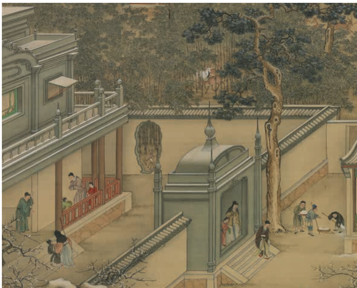
圖8 清 畫院 畫十二月月令圖 十二月 局部 十八世紀的西洋風建築 國立故宮博物院藏