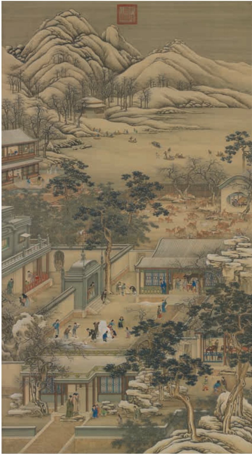
圖7 清 畫院 畫十二月月令圖 十二月 國立故宮博物院藏