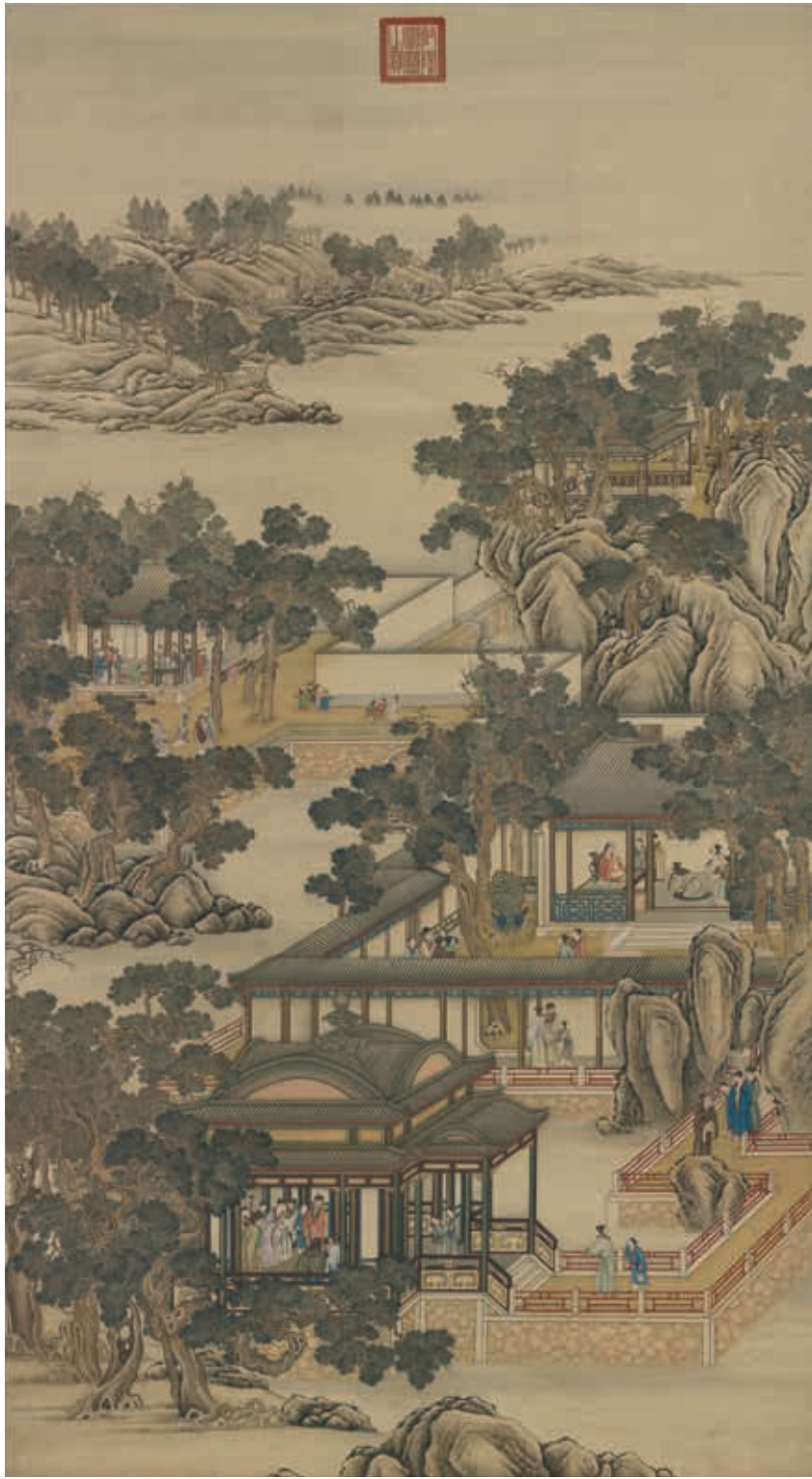
圖4 清 畫院 畫十二月月令圖 十一月 國立故宮博物院藏