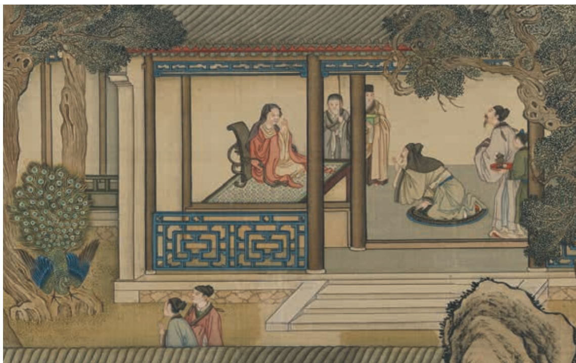
圖5 清 畫院 畫十二月月令圖 十一月 局部 頂禮禪師 國立故宮博物院藏