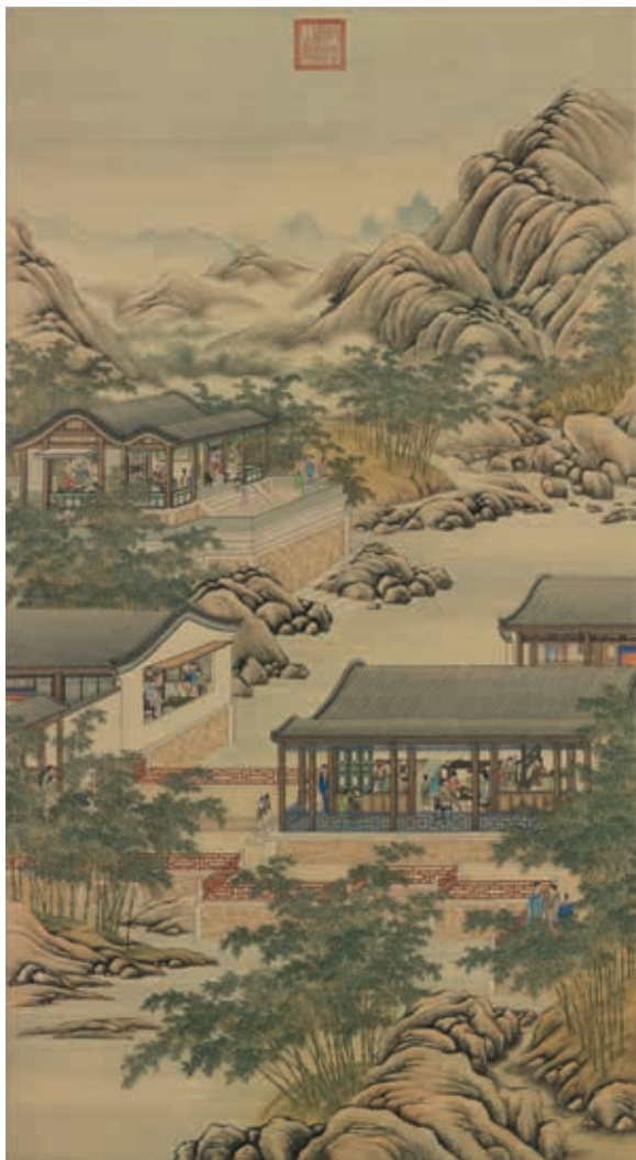
圖1 清 畫院 畫十二月月令圖 十月 國立故宮博物院藏

清代院畫家所描繪的《畫十二月月令圖》，可以看到不同時令的宮廷居家生活。十月進入深秋初冬後，氣候漸冷，人們更趨向室內活動；例如欣賞彝鼎、字畫等古玩，室內陳設則插花、薰香等等作妝點。此次特別展出古代彝鼎〈作冊大方鼎〉，以及〈剔紅花卉長頸瓶〉、汝窯〈青瓷水仙盆〉、〈翠玉白菜〉等室內陳設器，讓觀眾體驗宮廷生活的典雅氛圍。讓我們一起