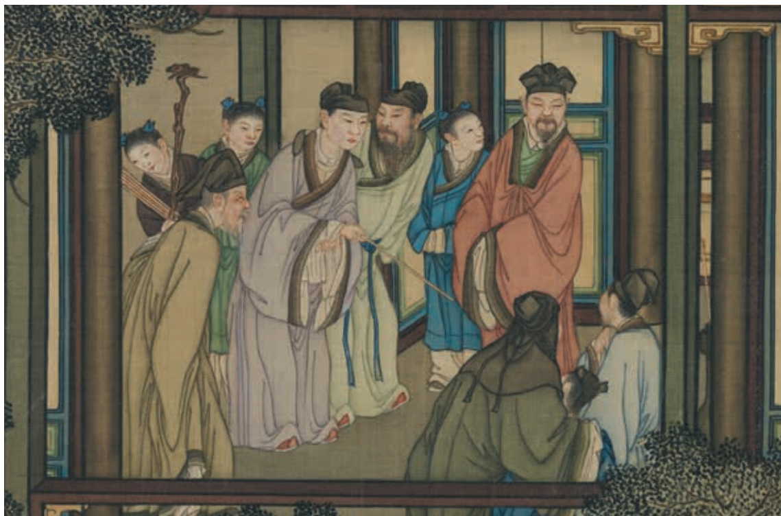
圖6 清 畫院 畫十二月月令圖 十一月 局部 投壺 國立故宮博物院藏