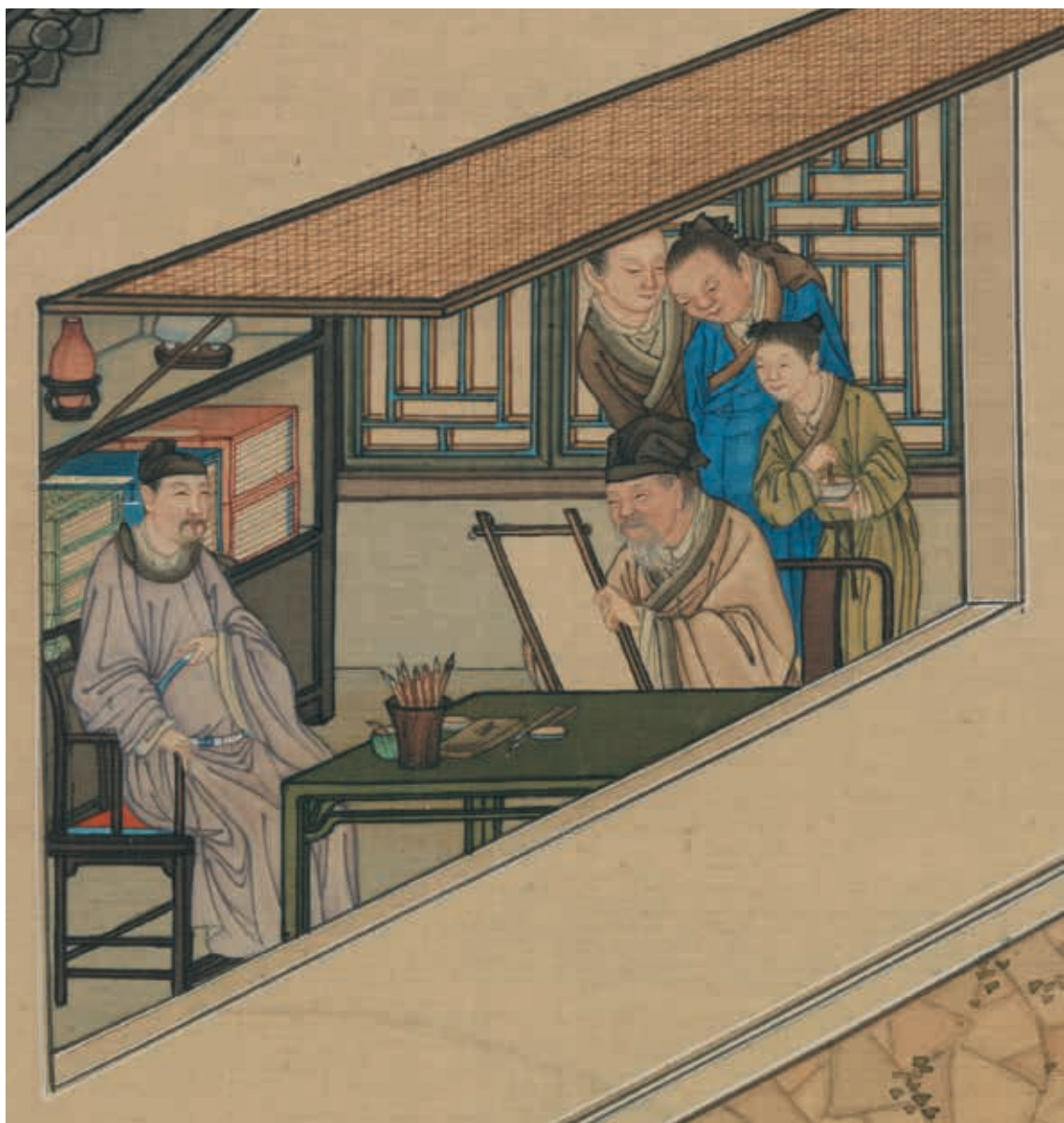
圖3 清 畫院 畫十二月月令圖 十月 局部 老畫師畫像 國立故宮博物院藏