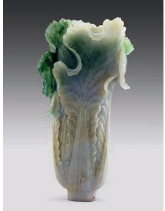
圖19 清 翠玉白菜 菜梗與背部 國立故宮博物院藏

的部份；創作者巧妙地利用原料天然色澤，以濃綠表現菜葉，不僅表現出菜葉複雜交疊，葉間甚至隱藏二蟲。碧綠菜葉上蝨蝟，體型稍大，後足脛刻劃鋸齒痕。它的身體下壓，翅膀上舉，似乎在模擬出摩擦前翅發出蟲鳴的姿態。另一方面，蝗蟲體型較小，且後足較短，平滑無刺。