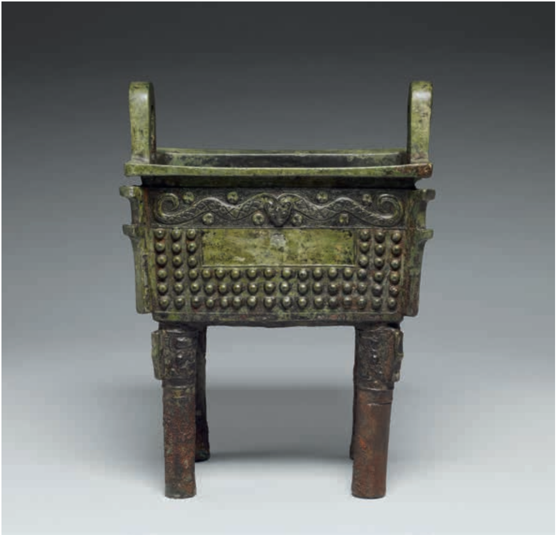
圖10 西周早期 作冊大方鼎 國立故宮博物院藏