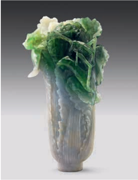
圖18 清 翠玉白菜 國立故宮博物院藏