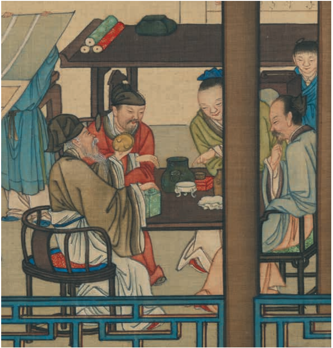
圖2 清 畫院 畫十二月月令圖 十月 局部 鑑定古器彝鼎 國立故宮博物院藏