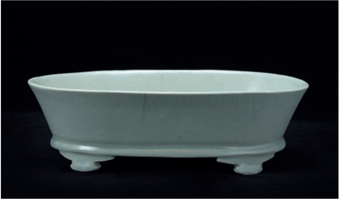
圖13 北宋 汝窯 青瓷水仙盆 國立故宮博物院藏