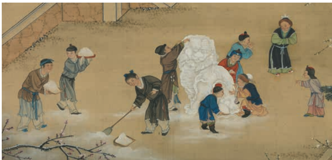
圖9 清 畫院 畫十二月月令圖 十二月 局部 堆雪獅 國立故宮博物院藏