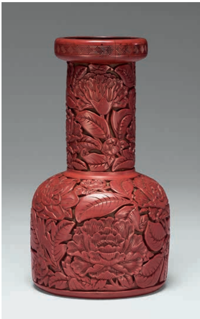
圖16 明 永樂 剔紅花卉長頸瓶 國立故宮博物院藏

最後的壓軸則是本院的超人氣精品——清〈翠玉白菜〉。（圖 18）〈翠玉白菜〉是以一塊同時具有濃綠、斑白的翡翠為原材。整塊玉料濃綠的部份較少，卻是整株白菜刻劃最為精細