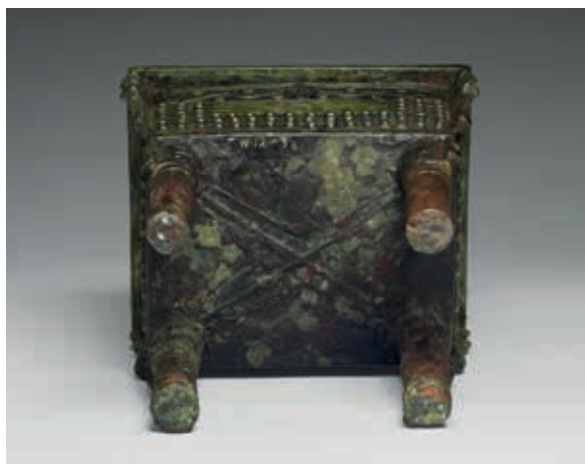
圖12 西周早期 作冊大方鼎 器底 國立故宮博物院藏

器內銘文因提及武王、成王等重要歷史人物，尤具歷史價值。院藏有一對「作冊大方鼎」，大小、紋飾皆近似，唯銘文有一字之差。此鼎有四十一字，另一鼎少一字。由此可知，兩鼎銘文是各別書寫、各自製作泥範，而非以同一字模翻印。方鼎底部常見有「X」形的凸稜，也稱作「加強筋」。學者推測是鑄造時有加固底部的作用。（圖 12）