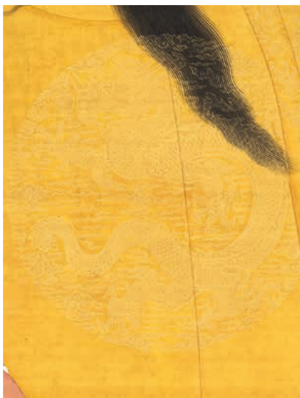
圖 3-1 明成祖坐像 局部

明成祖朱棣（1360-1424，年號永樂，1402-1424 在位），明太祖第四子，即位四十三歲，明朝第三任皇帝。〈明成祖坐像〉（圖 3）身著團領常服，窄袖袍，中衣為紅色交領，腰束革帶，上鑲雜寶。黃袍前後及兩肩各織金龍一，龍頭扁瘦，濃密毛髮由雙角間往後飄揚。立眉似火焰形，如意形鼻，下頷短髭較長，具有明代早期典型特徵。軀體粗壯，爪雄健有力，龍鱗疏密有序。畫家以纖細描金線條刻劃龍的形象。（圖 3-1、3-2）畫面寶珠與龍紋同時出現，作戲珠狀。龍的形象豪放生動，神態威武至尊，昂然向上，反映出永樂時期國勢的強盛。