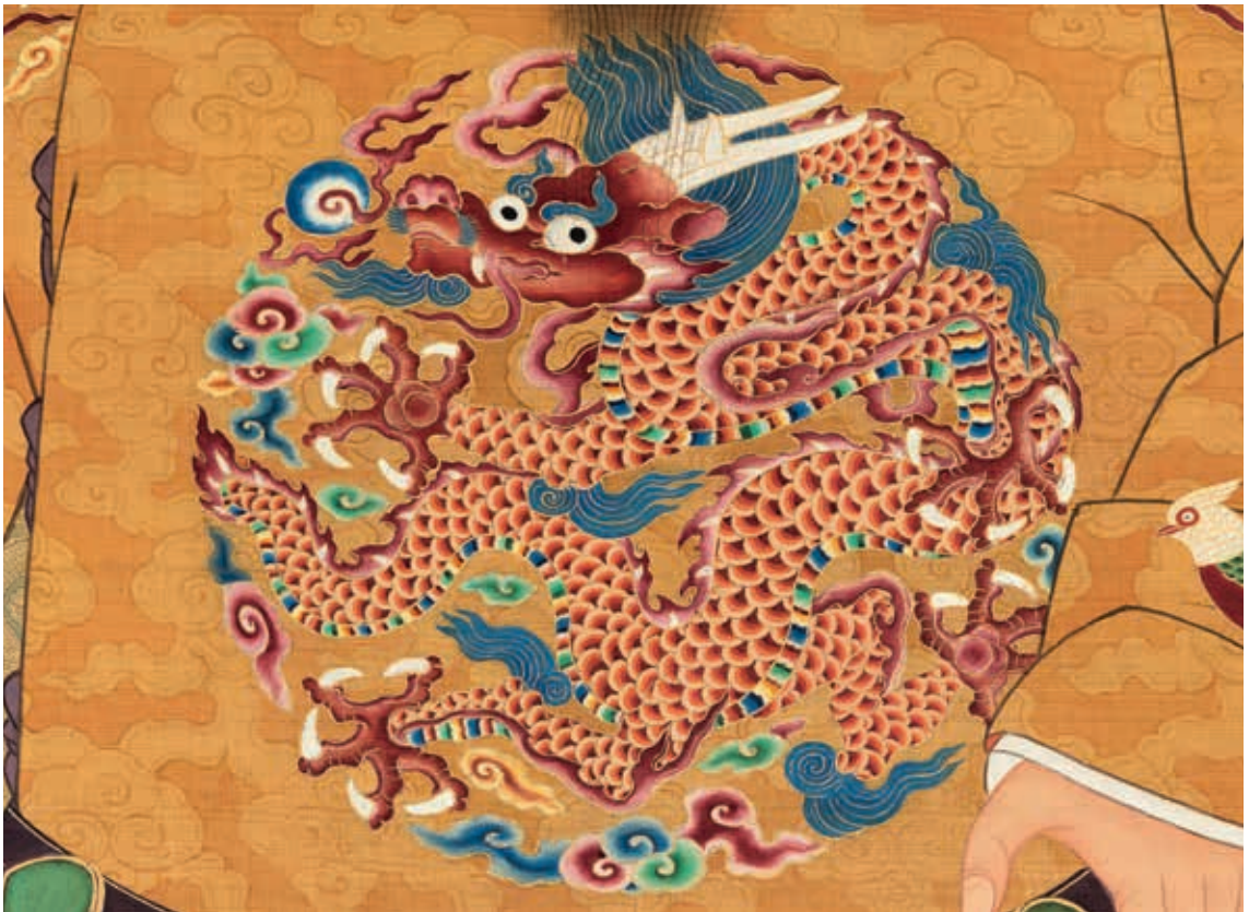
圖 8-1 明憲宗坐像 局部

1465-1487 在位)，明英宗庶長子，即位十八歲，明朝第九任皇帝。〈明憲宗坐像〉（圖 8）頭戴翼善冠，袞服，窄袖（早期袖口處收窄，後逐漸變為寬袖），束碧玉帶，黑靴。中衣領紅，袖滾邊白色，下裳兩側開衩處，繡有對稱升龍各二。龍閉口，雙角長伸，在近根部分叉，長髮飛動上飄，鬚髯亦隨風飛揚。圓眼和黑點狀眼珠，圓潤透亮，一派祥和氣象，鼻子呈如意形。（圖 8-1）團龍四肢粗壯，五爪趾甲似鐮刀，作舞爪狀，足拐生出藍色肘毛，有一種活潑流動的視覺美感。三角背鱗與尾鱗帶刺狀，有火焰狀尾。成化時期龍紋構圖、色彩，延續正統時期風格，紋飾描繪不依循衣紋起伏變化，呈現平面化圖案形式。