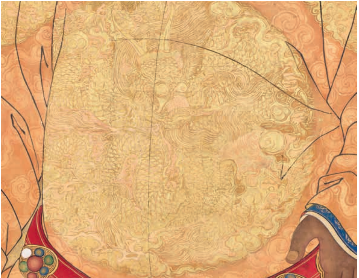
圖 6-1 明宣宗坐像 局部

正面龍首居於中央，龍角從近根部分叉後翹，濃密毛髮成束，往後或向上飄揚。龍口緊閉，下唇向上翻，翹鼻寬闊，鼻喙長，顎下長鬚飛揚。五爪銳利如鷹爪，指尖向內彎，腳爪剛勁有力，頸部到尾鰭邊緣作火燄狀。（圖 6-1）黃袍周圍裝飾四方連續的如意雲朵紋樣，雲頭由三個單卷雲構成，各有雲尾作飄動狀。畫中龍紋佔據大面積，