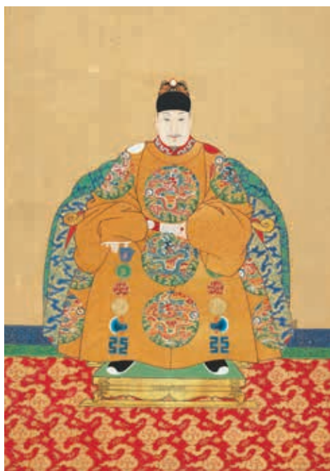
圖 13 明神宗坐像 國立故宮博物院藏 中畫000297

明神宗朱翊鈞（1563-1602，年號萬曆，1573-1602在位），明穆宗庶出三子，即位十歲，明朝第十四任皇帝。〈明神宗坐像〉（圖 13）頭戴翼善冠（冠上加二龍戲珠）、玉革帶。袞服基本延續前朝風格，袖上「華蟲」紋飾消失。「行龍」作側身行走狀，龍身細長，呈波浪狀。龍首較大，身軀細長，前肢左右伸展，靈活行於雲間。龍張嘴露齒，眉毛成「山」字形，下顎邊有刺齒狀短鬚，鬚髯捲曲誇張揚起。臉龐鼻額高聳，靈芝瓣造型正是此期特徵。萬曆朝背繡從早期鋸齒狀，逐漸變成連續珠紋，每三個連珠間隔一個鋸齒，毛髮較短，近尾處略細，尾端成芒針式。（圖 13-1）