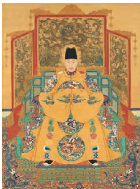
圖 11 明世宗坐像 國立故宮博物院藏 中畫000318