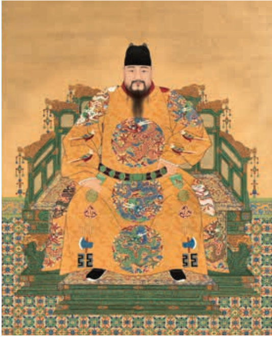
圖 8 明憲宗坐像 國立故宮博物院藏 中畫000315

1465-1487 在位)，明英宗庶長子，即位十八歲，明朝第九任皇帝。〈明憲宗坐像〉（圖 8）頭戴翼善冠，袞服，窄袖（早期袖口處收窄，後逐漸變為寬袖），束碧玉帶，黑靴。中衣領紅，袖滾邊白色，下裳兩側開衩處，繡有對稱升龍各二。龍閉口，雙角長伸，在近根部分叉，長髮飛動上飄，鬚髯亦隨風飛揚。圓眼和黑點狀眼珠，圓潤透亮，一派祥和氣象，鼻子呈如意形。（圖 8-1）團龍四肢粗壯，五爪趾甲似鐮刀，作舞爪狀，足拐生出藍色肘毛，有一種活潑流動的視覺美感。三角背鱗與尾鱗帶刺狀，有火焰狀尾。成化時期龍紋構圖、色彩，延續正統時期風格，紋飾描繪不依循衣紋起伏變化，呈現平面化圖案形式。