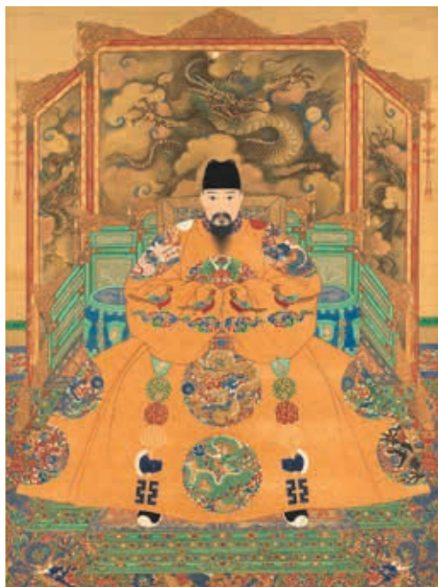
圖 9 明孝宗坐像 國立故宮博物院藏 中畫000316

明孝宗朱祐樞（1470-1505，年號弘治，1488-1505 在位），明憲宗庶出三子，即位十八歲，明朝第十任皇帝。〈明孝宗坐像〉（圖 9）頭戴翼善冠，龍袞領緣紅、青色，加織「黻」紋裝飾。皇帝端坐於寶座，雙手皆攏於袖中，通袖遮掩不現手，僅露出寶帶鑲金飾件。龍袞袖身寬大，衣飾華麗。上衣出現「正面龍」的形象，龍面朝前，圓目突起，眼部大而圓睜，看似鬥雞眼，表情擬人化。下裳半側臉五爪大龍，鼻部寬大，葉形眉上挑，嘴巴微開，牙齒尖銳，兩側鬚髯如短刺。雙角長伸呈枝狀，在近根部分叉。龍頸短，身粗，束髮向上衝，背脊邊緣由火焰改飾白色齒狀鬃毛。（圖 9-1）龍側身彎曲，作行走狀，刻劃生動有力，肘關節處有刺狀肘毛，前爪緊抓住藍色寶珠，一副唯我獨尊的姿態。