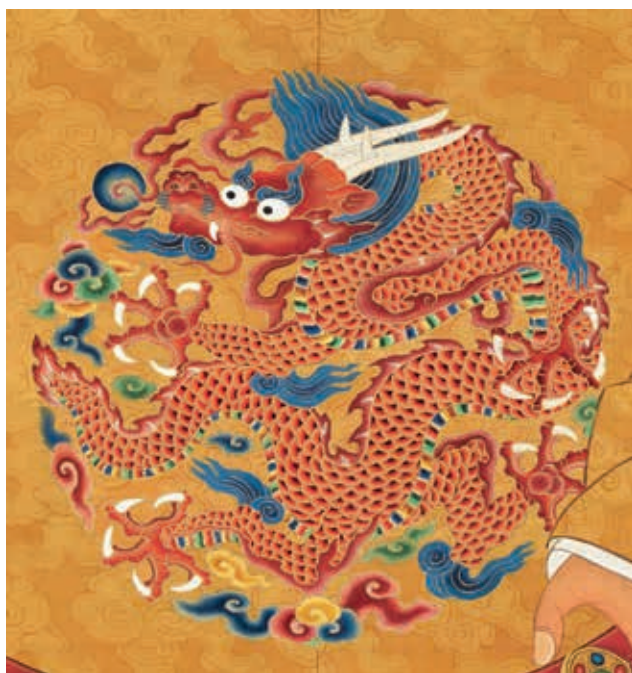
圖 7-1 明英宗坐像 局部

龍身壯碩，紋飾生動流暢。金彩暈染設色有層次變化，表現出宣德時期龍紋威武豪放，雄健英發的姿態。