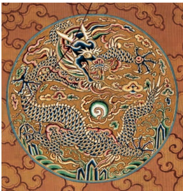
圖 15-1 明熹宗坐像 局部

〈明孝宗坐像〉與〈明世宗坐像〉、〈明穆宗坐像〉，皆有龍紋圍屏置於寶座後方，三面座屏佈滿祥龍雲氣繚繞；〈明熹宗坐像〉座屏的屏心則繪有「雙龍盤壽」吉祥寓意圖案，畫面增多的是，兩邊擺設朱漆香几，上方陳設卷冊、鼎爐、青花瓷碗、鑲金銅壺等物品，裝飾意味強。藉由各種層層疊疊花團錦簇的佈景裝飾，構築出屬於帝王的威儀與榮盛。