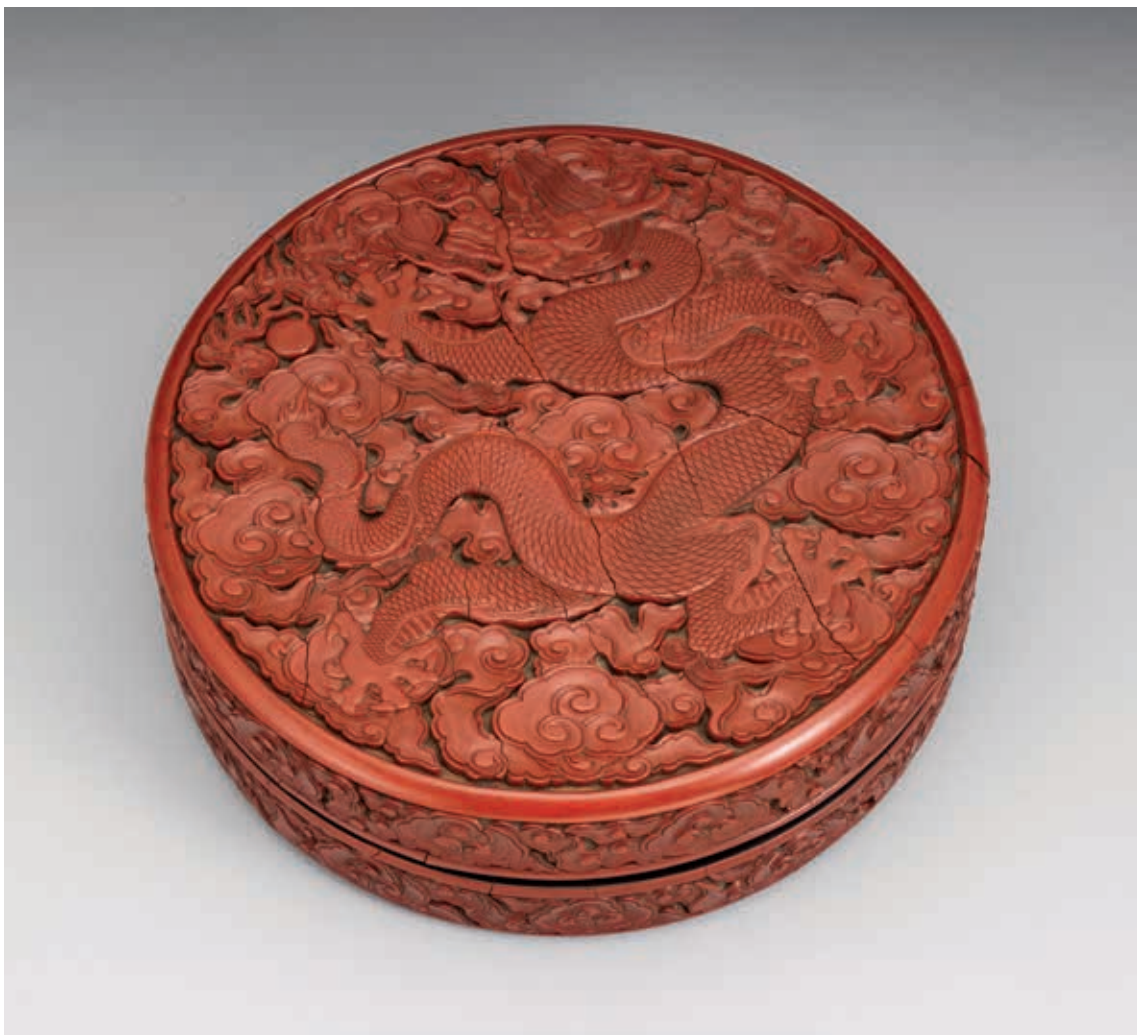
圖 5 明 宣德款 剔紅雲龍圓盒 國立故宮博物院藏 故漆000373

明仁宗朱高熾（1378-1425，年號洪熙，1424-1425 在位），明成祖長子，明朝第四任皇帝，在位時間很短。〈明仁宗坐像〉（圖 4）左手端帶，右手撫膝，身著黃色闊袖團龍袍，坐於朱漆交椅寶座上。服飾繡五爪金龍，金色筆描線條若不細審，圖案較不明顯。五爪「行龍」縱身雲間，側身昂首，探爪奪珠，姿態矯健。龍首比例較小，口緊閉，眼上方雙眉成羽狀向上揚，頭上鬃、頷下鬚鬚朝同一方向飛