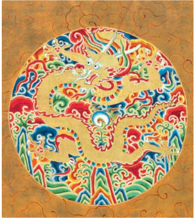
圖 14-1 明光宗坐像 局部