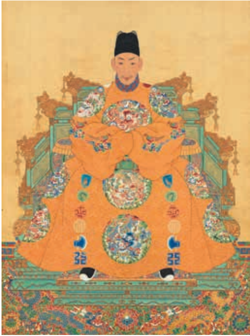
圖 10 明武宗坐像 國立故宮博物院藏 中畫 000317

「品」字如意雲頭，由三朵單卷構成，巧妙安排於圓框周圍，這種組合形式表達出「吉祥如意」的美好寓意。