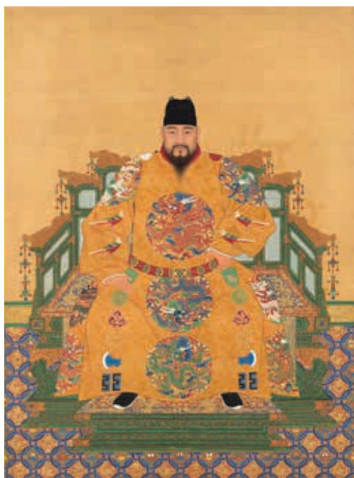
圖 7 明英宗坐像 國立故宮博物院藏 中畫000314