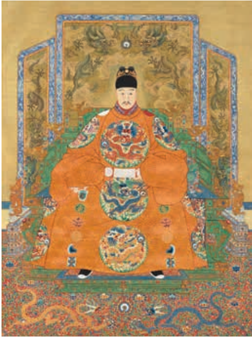
圖 12 明穆宗坐像 國立故宮博物院藏 中畫000319

年，即位三十歲，明朝第十三任皇帝。〈明穆宗坐像〉（圖12）頭戴翼善冠（冠上加二龍戲珠），龍袞，領緣紅、青色，加織「馱」紋裝飾，玉革帶。上裳袖子寬長，兩袖無「華蟲」（雉），下裳右手袖口遮住「宗彝」（一種祭器，上有虎與雌形）。昂首翻騰的五爪巨龍，作迴身探珠狀，身體呈波浪狀。頭大，角呈枝狀分叉，末端上彎。圓目突起，怒目圓瞪，張口露齒，爪舞牙張，鬚髮皆揚。龍翱翔於雲海之間，顯出帝王豪放威懾之力。（圖 12-1）