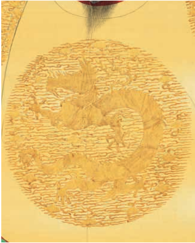
圖 1-1 明太祖坐像 局部