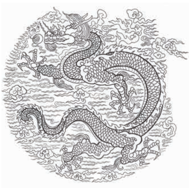
圖 3-2 明成祖坐像 龍紋線描圖 黃鴻琪繪

明成祖朱棣（1360-1424，年號永樂，1402-1424 在位），明太祖第四子，即位四十三歲，明朝第三任皇帝。〈明成祖坐像〉（圖 3）身著團領常服，窄袖袍，中衣為紅色交領，腰束革帶，上鑲雜寶。黃袍前後及兩肩各織金龍一，龍頭扁瘦，濃密毛髮由雙角間往後飄揚。立眉似火焰形，如意形鼻，下頷短髭較長，具有明代早期典型特徵。軀體粗壯，爪雄健有力，龍鱗疏密有序。畫家以纖細描金線條刻劃龍的形象。（圖 3-1、3-2）畫面寶珠與龍紋同時出現，作戲珠狀。龍的形象豪放生動，神態威武至尊，昂然向上，反映出永樂時期國勢的強盛。