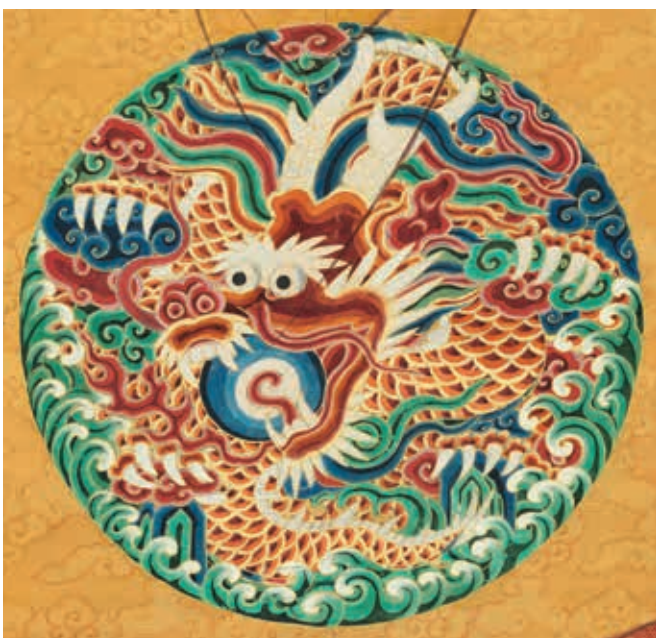
圖 11-1 明世宗坐像 局部

雲龍紋自頭部以下整個身體捲曲，呈盤旋狀，鬚髮向四周飄散。構圖與前期較不相同，布局繁縟滿密，幾無空隙。身軀深藏雲海之間，露出頭角，趾爪融入背景之中。龍失去主導地位，無主次區別，尾部不明顯，正符合古語所謂「神龍見首不見尾」。正德朝國力由盛轉衰，此期龍頭較大，與身體不成比例。圖案設計方面，圓形邊框飾以五色流雲、翻卷浪花紋，色澤華麗，裝飾風格強烈。