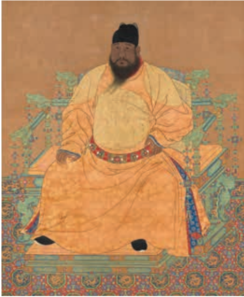
圖 6 明宣宗坐像 國立故宮博物院藏 中畫000313

明宣宗朱瞻基（1398-1435，年號宣德，1426-1435 在位），明仁宗長子，即位二十七歲，明朝第五任皇帝。〈明宣宗坐像〉（圖 6）著圓領黃袍，頭戴翼善冠，繫寶帶，黑靴。中衣領紅色，袖口用青色鑲邊，下裳側邊以紅、青作裝飾。胸前後、兩肩織有團龍。