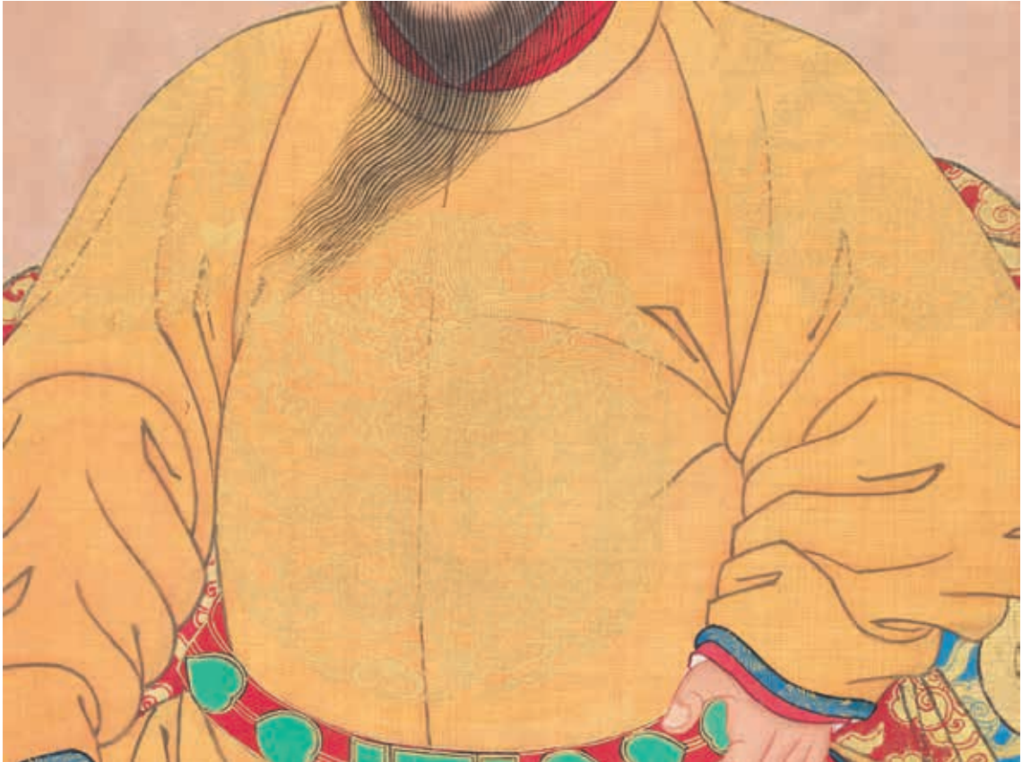
圖4-1 明仁宗坐像 局部