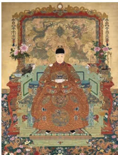
圖 15 明熹宗坐像 國立故宮博物院藏 中畫000320