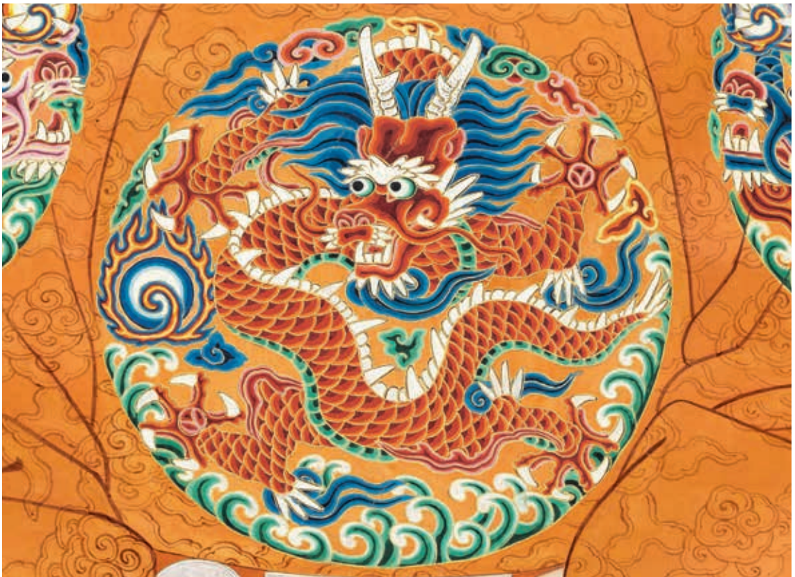
圖 12-1 明穆宗坐像 局部

畫中龍身粗壯，前後肢左右張開，爪呈輪狀，爪趾之間張開幅度較大。背脊白色齒狀鬃毛均勻分布，扇形鱗片刻劃仔細。圓框邊緣飾以如意雲紋與海水波濤，寶珠被火燄飄帶包圍。輔紋與主體龍紋組合緊密，兼具皇權威儀與圖案裝飾性效果。