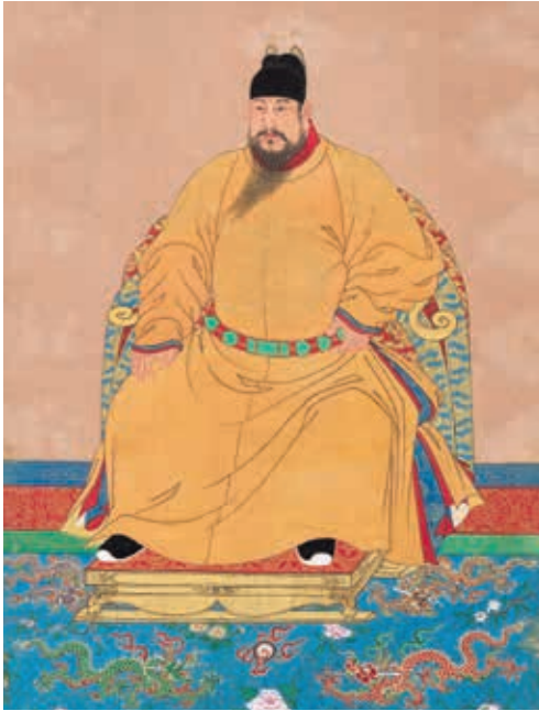
圖4 明仁宗坐像 國立故宮博物院藏 中畫000294