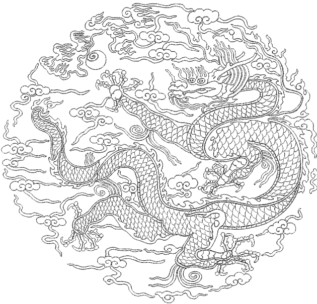
圖 2 明 妝金四團龍紋緞袍 胸、背盤龍紋紋樣 朱檀墓出土 山東博物館藏

腰束碧玉帶，黑靴露出袍服外。明代官服有公服、常服之分，洪武三年（1370）與永樂三年（1405），先後制定常服制度。畫面黃色圓領窄袖常服，兩肩及胸前各有金織盤龍（又稱四團龍袍），形制是明初典型樣式。袍上「行龍」體型矯健，全用金箔彩繪，搭配曲線雲氣，簡練流暢，呈現出優雅凝鍊的氣質。龍首相對扁平修長，龍耳較小，耳後毛髮直角轉折向上。雙目圓睜，上唇與下唇收齊，嘴下有鬚。