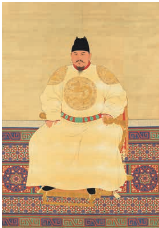
圖 1 明太祖坐像 國立故宮博物院藏 中畫000311

明太祖朱元璋（1328-1398，年號洪武，1368-1398 在位），即位時四十一歲，明朝開國皇帝。〈明太祖坐像〉（圖 1）身著團龍常服，