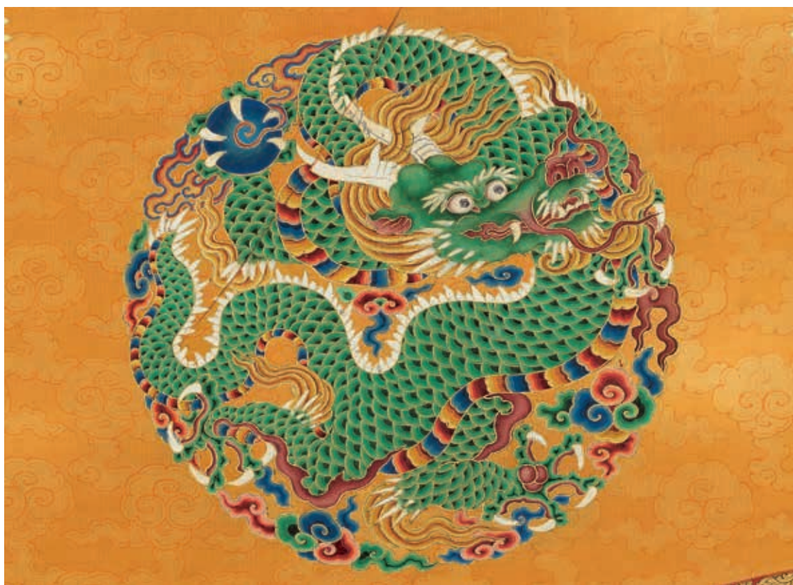
圖 9-1 明孝宗坐像 局部

明孝宗朱祐樞（1470-1505，年號弘治，1488-1505 在位），明憲宗庶出三子，即位十八歲，明朝第十任皇帝。〈明孝宗坐像〉（圖 9）頭戴翼善冠，龍袞領緣紅、青色，加織「黻」紋裝飾。皇帝端坐於寶座，雙手皆攏於袖中，通袖遮掩不現手，僅露出寶帶鑲金飾件。龍袞袖身寬大，衣飾華麗。上衣出現「正面龍」的形象，龍面朝前，圓目突起，眼部大而圓睜，看似鬥雞眼，表情擬人化。下裳半側臉五爪大龍，鼻部寬大，葉形眉上挑，嘴巴微開，牙齒尖銳，兩側鬚髯如短刺。雙角長伸呈枝狀，在近根部分叉。龍頸短，身粗，束髮向上衝，背脊邊緣由火焰改飾白色齒狀鬃毛。（圖 9-1）龍側身彎曲，作行走狀，刻劃生動有力，肘關節處有刺狀肘毛，前爪緊抓住藍色寶珠，一副唯我獨尊的姿態。