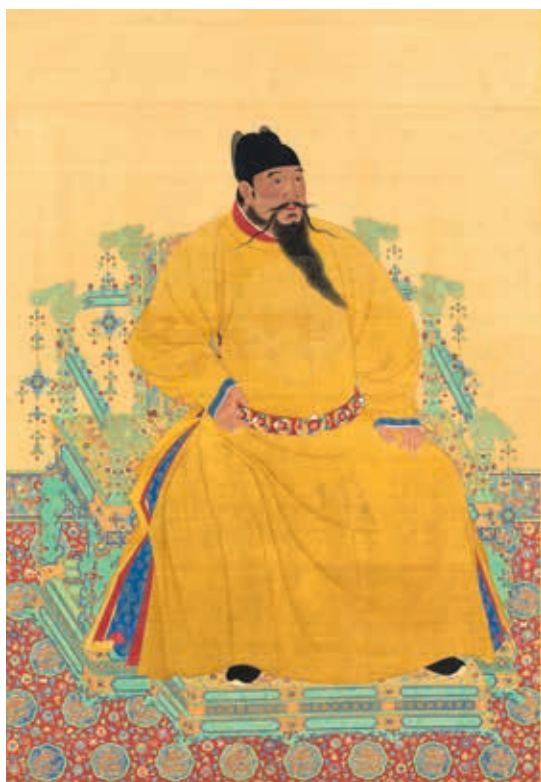
圖 3 明成祖坐像 國立故宮博物院藏 中畫000312