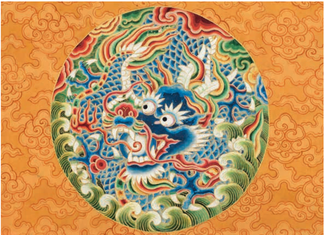
圖 10-1 明武宗坐像 局部

明武宗朱厚照（1491-1521，年號正德，1506-1521 在位），明孝宗嫡長子，即位十五歲，明朝第十一任皇帝。〈明武宗坐像〉（圖 10）頭戴翼善冠，龍袞，領緣飾紅、青色，加織「黻」紋裝飾，通袖遮掩不現手，露出方形碧玉帶板。龍首碩大居中心，髮冠稀疏，已無飄揚姿態。雙眼睜大突出，尖銳眉毛上挑，如意形鼻頭，鼻側飄起八字鬚，呈火焰狀。張口露牙，吐舌含珠。顎旁有齒狀粗刺，表情兇猛強勢。（圖 10-1）