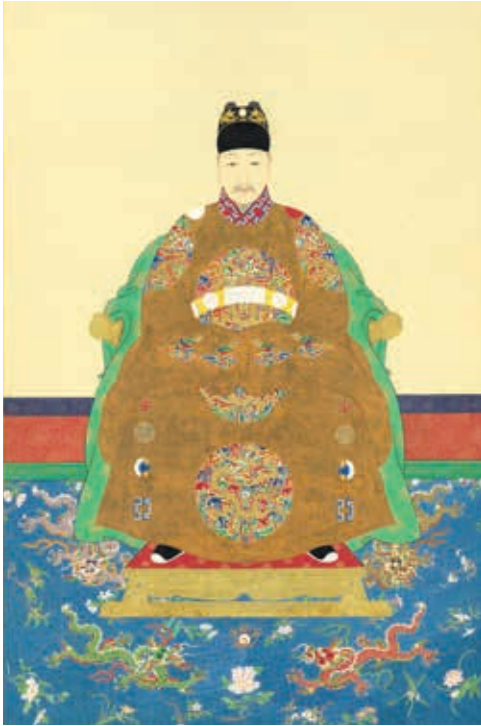
圖 14 明光宗坐像 國立故宮博物院藏 中畫000298