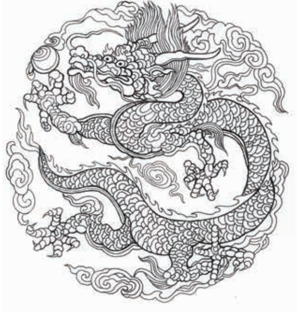
圖4-2 明仁宗坐像 龍紋線描圖 黃鴻琪繪