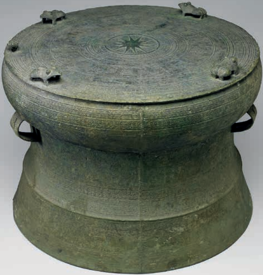
東漢末至六朝 立蛙紋鼓 國立故宮博物院藏