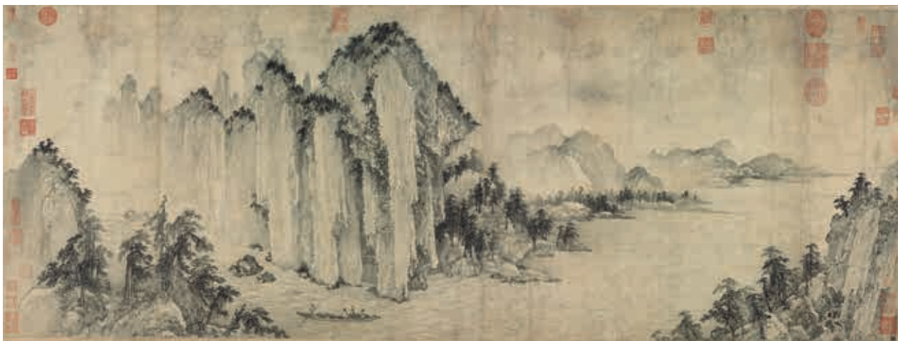
圖3 金 武元直 赤壁圖 卷 局部 國立故宮博物院藏