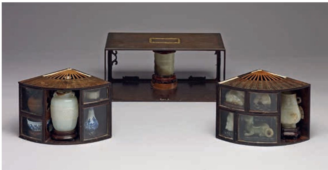
圖7 清 雙扇式長方匣 國立故宮博物院藏

研究顯示，雍正七年（1729）入宮的陳祖章，至乾隆二年起，支領最高工銀每月十二兩；或與當年陳氏製作〈雕橄欖核舟〉，獲得高宗賞識有關。 8 這件精巧的作品被收藏在乾隆八年（1743）內務府重裝的〈瑾瑜匣〉暗櫃內，〈瑾瑜匣〉與該年同時重裝的其它八組百什件，是清宮重要的收藏， 9 高宗對這件小舟的喜愛，由此可見一斑。此外，內藏〈果核雕小舟〉的〈雕犀角菊花小圓盒〉，亦存於〈瑾瑜匣〉內。該盒收納於一個雙扇式長方匣中，與多件玉器、瓷器一同貯放（圖7），匣外有詞臣董邦達（1699-1769）與張若靄（1713-1746）的圖繪裝