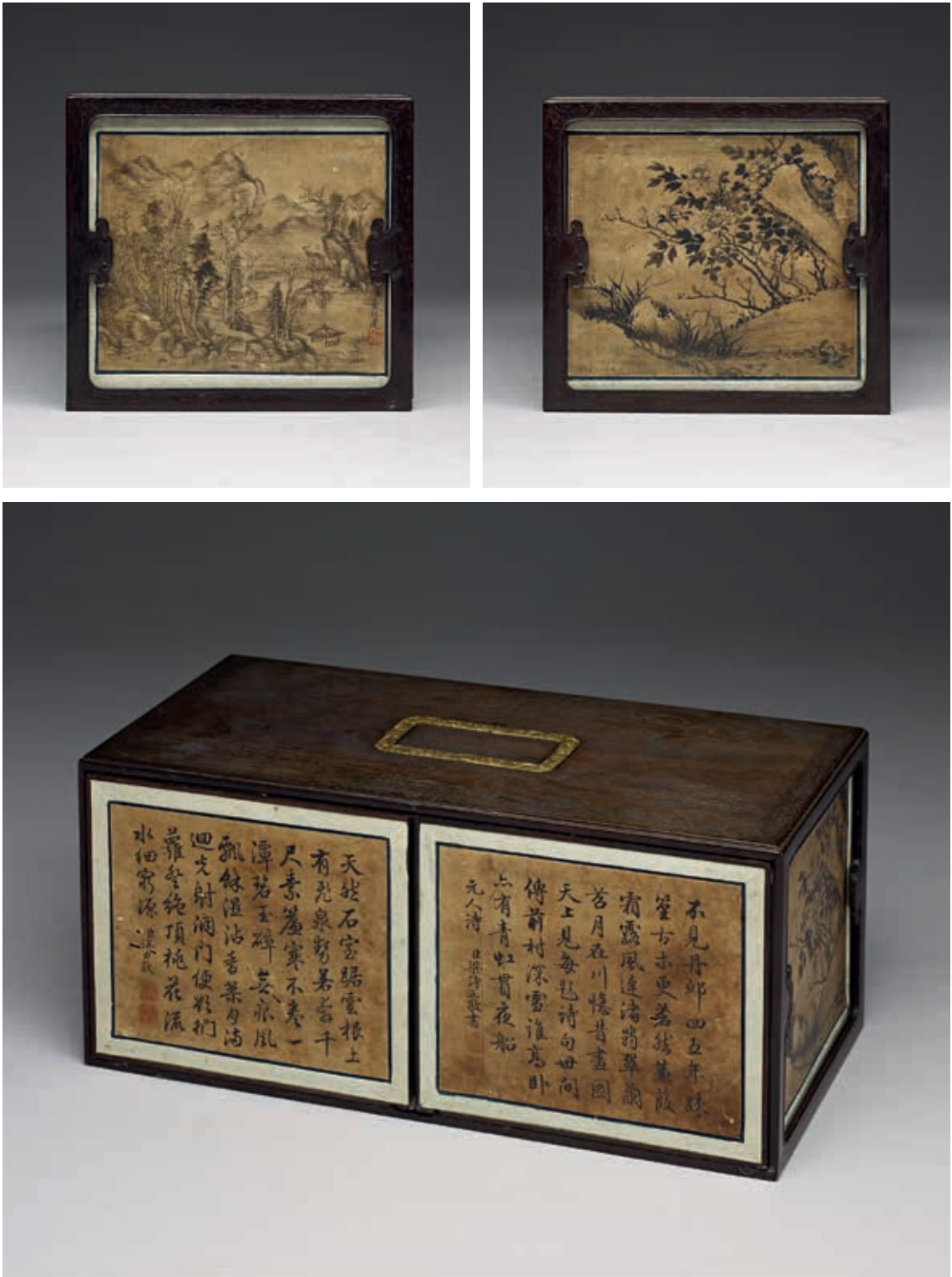
圖8 清 雙扇式長方匣 盒外裝飾 國立故宮博物院藏