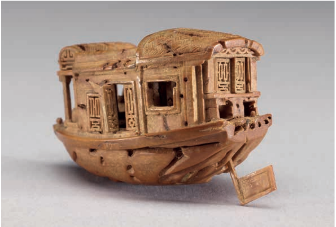
圖6 清 雕桃核小船 國立故宮博物院藏