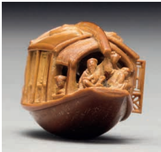
圖1 清 乾隆2年 陳祖章 雕橄欖核舟 國立故宮博物院藏

這件作品的舟底，刻有北宋大文豪蘇軾（1037-1101）所撰寫的〈後赤壁賦〉，全文共三百餘字，文末落「乾隆丁巳（1737）五月，臣陳祖章恭製」款。道出這件作品描繪的故事，