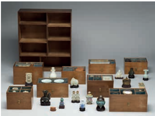
圖9 清 八屨木匣 國立故宮博物院藏

飾（圖8），頗富文人氣息。〈雕桃核小船〉盛裝於〈嵌玉蝴蝶式匣〉中，收藏在一箱八屨木匣內，與多件小型的玉器、瓷器、銅器一同儲放。（圖9）