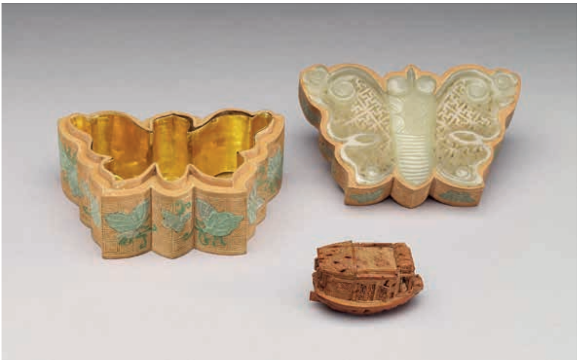
圖4 清 八扇木匣 第三匣內裝文物及嵌玉蝴蝶式盒內〈雕桃核小船〉 國立故宮博物院藏