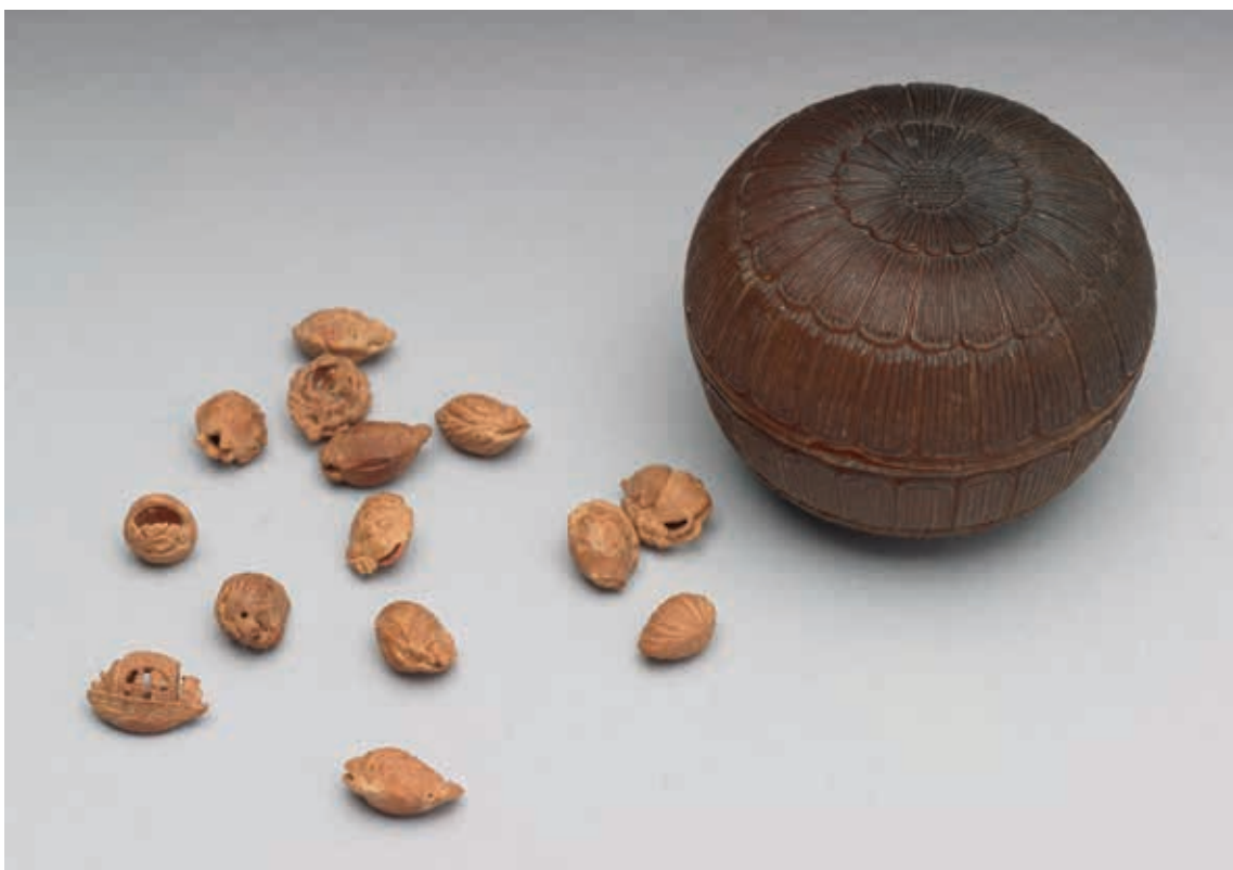
圖5 18世紀 雕犀角菊花小圓盒 果核雕19枚 國立故宮博物院藏

在《廣東新語》所記載，錫器製作時的俗諺：「蘇州樣，廣州匠」。 6 王叔遠與蘇州的地緣關係，驗證核舟之「樣」來自蘇州的事實。謂之蘇州「樣」，表示這類作品必然依循一定的格套生產。明末崇禎時期（1628-1644）出版的文獻曾道：「今之刻核舟者多，而未必盡出王叔遠手。真贗之間，巧拙大異，非識者，誰與解之？」 7 可見晚明雕核舟倍出，托名王叔遠者衆，品質精粗，並不一定。「蘇州樣」的果核雕小舟確切的面貌為何？文獻所描述，僅能提供今人遙想。藉由院藏文物，我們能具體重建晚明以來果核雕傳統的面貌。