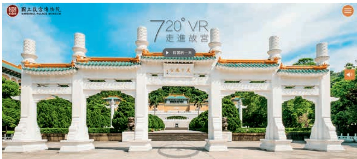
圖1 博物館以虛擬展廳等數位資源遠距服務觀眾 取自國立故宮博物院「720° VR」虛擬展廳： https://tech2.npm.edu.tw/720vr/index.html ，檢索日期：2021年3月30日。