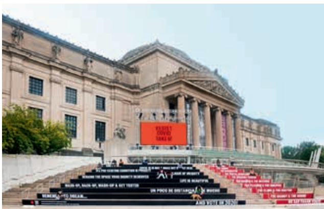
圖6 藝術家利用美術館臺階創作裝置作品《為了防疫請維持6呎距離！》 Installation view, Carrie Mae Weems: Resist COVID Take 6! , September 16, 2020 - November 8, 2020, Brooklyn Museum.

每年5月18日的國際博物館日是博物館界凝聚共識，討論與推動社會議題的契機，而今年各館的關切預料將涵蓋前文所述的數位發展與社會平權主題。在518博物館日前，同樣受到許多博物館矚目的三月「女性歷史月」(Woman's History Month)和三月八日國際婦女節，則是博物館界鼓吹性別平權的機會，以持續的倡議與行動，追求不同性別與性別認同者的平等待遇。美國國立女性藝術博物館(National Museum of Women in the Arts, 以下簡稱NMWA)已連續五年在三月時推出社群媒體挑戰活動(圖7-8)，請粉絲寫下五位女性藝術家的姓名並廣為分享，