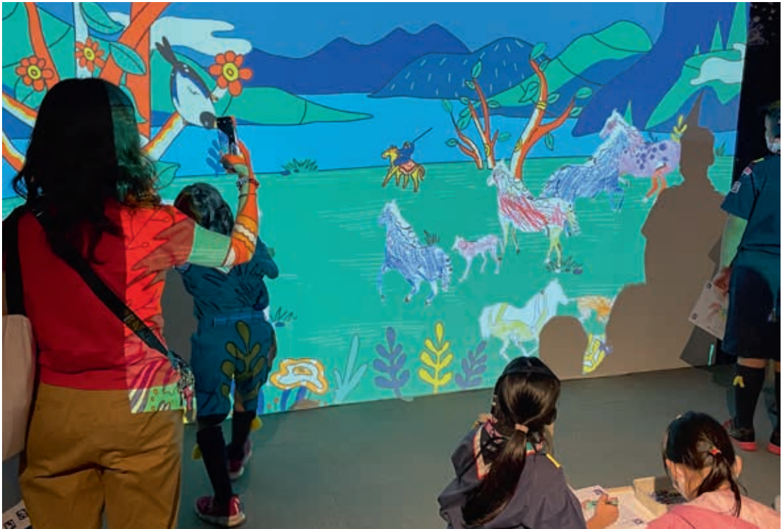
圖14 觀眾的創作融入數位展件內容中，獲得共創展覽之體驗。 數位資訊室提供