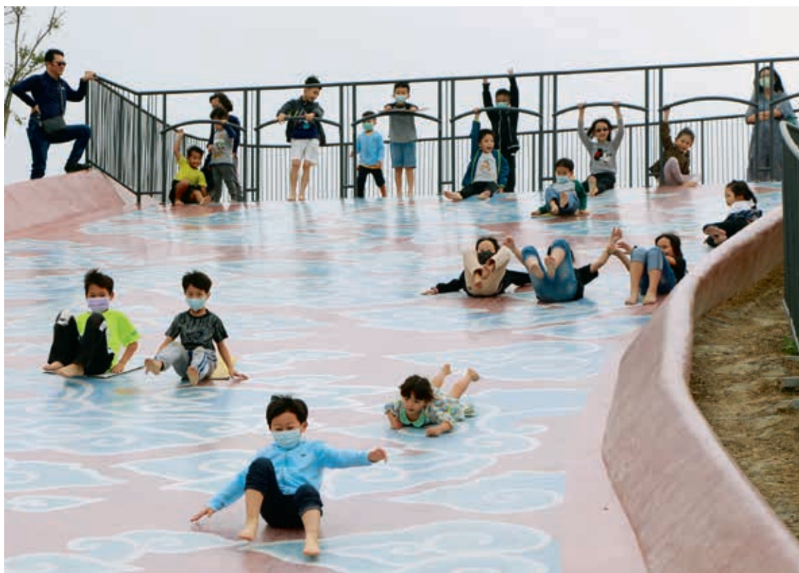
圖11 故宮南院園區提供休閒設施 南院處提供

而博物館未來究竟何去何從，雖然充滿了不確定性，Szántó 書中受訪的館長們卻提出了多元而開放的各種可能性，例如博物館所在場域可以不被一棟固定的建物所限，館外的園區也是博物館體驗的一部份（圖 11），或者將展覽外延至社區，分佈在城市的不同角落，也可以常態性地與在地的文化或節慶活動結合；博物館的型態與功能更豐富，可以參考新型態的圖書館（圖 12），成為觀眾日常休閒娛樂、教育文化體驗（圖 13、14）的重要場域。總之，為因應充滿變數的未來，博物館的自我定位應維持多元與開放，博