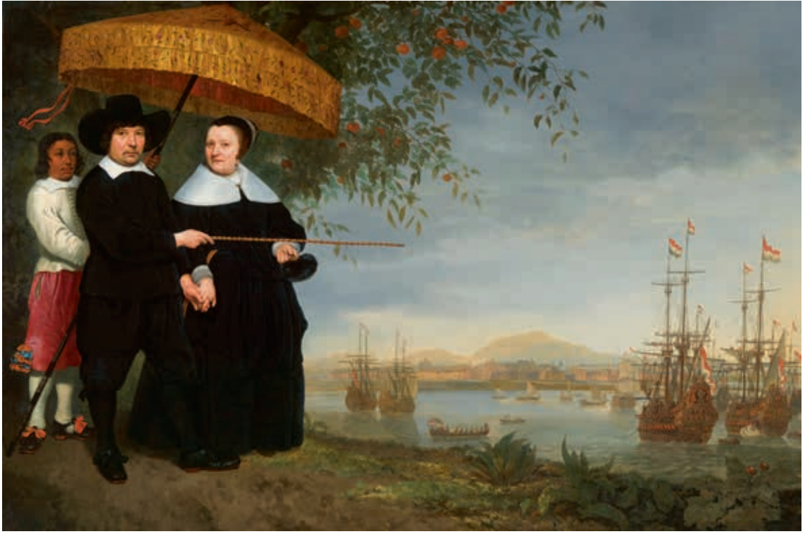
圖2 約1650至1655年 Aelbert Cuyp VOC Senior Merchant with his Wife and an Enslaved Servant (東印度公司商人夫婦及奴僕) 荷蘭國家博物館藏 取自該館官網： https://www.rijksmuseum.nl/en/my/collections/1851712--francois-bachelard/aelbert-cuyp/objecten#/SK-A-2350.2 (Public Domain)，檢索日期：2021年3月30日。 本圖描繪在荷屬東印度公司任職的商人及其妻，遠景可見東印度公司在印尼巴達維亞的巨大堡壘，兩位奴隸身後則有奴隸為其撐傘。

衝擊慘重，罹病與死亡率皆高於其他社區。亞洲地區也發生因為移工居住環境不佳及防疫資訊不足而導致的疫情傳播，凸顯社會地位影響個人獲得的醫療資源是否充沛。而少數族裔及第一線勞工受失業衝擊嚴重，顯示了就業機會的不平等與經濟資源的分配不均。即使是居家隔離工作，亦有貧富、族群與性別之差異，當白領勞工居家辦公時，許多藍領勞工仍需冒著罹病的危險，繼續在疫情第一線服務眾人生活所需，其中女性勞工佔多數。而當老老少少皆在家中隔離時，女性除了工作維持家計，尚需分身操持家務、照顧老幼、輔導孩童在家中學習等，凸顯了性別與家務分配不平等的關係。身心障礙者因無法取得相同的資訊與物資之情