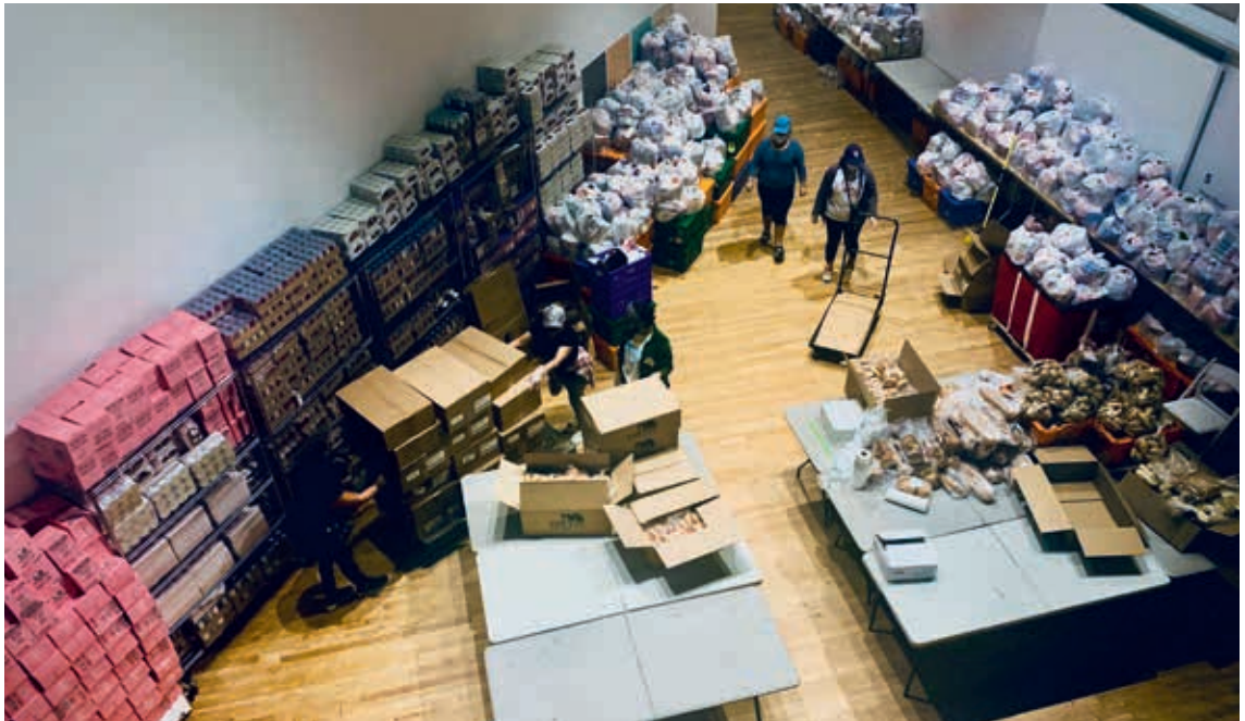
圖5 皇后區藝術博物館在疫情期間成為社區的救急食物供應站