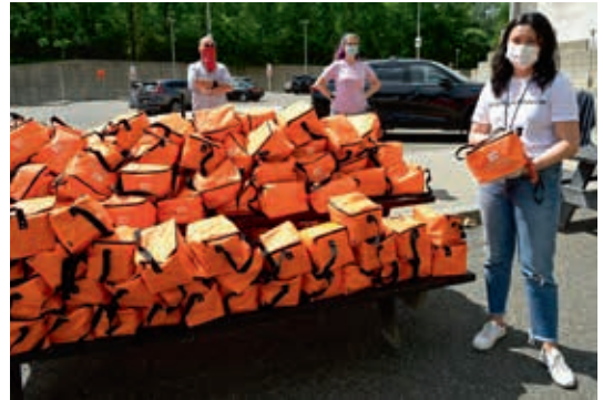
圖4 布魯克林美術館在疫情中提供救急食物 Brooklyn Museum staff and volunteers at Food Distribution with The Campaign Against Hunger. 06/01/2020. Brooklyn Museum.

因此二館積極伸出援手，與不同的公益團體合作，自2020年6月起每週固定提供救急糧食（圖4、5），在半年內至少供應了9,650個家庭之所需。供應食物自非博物館所長，須尋求外界奧援才能實踐，但是博物館擁有場地與人力，在緊急時仍能發揮功能。布魯克林博物館也同時