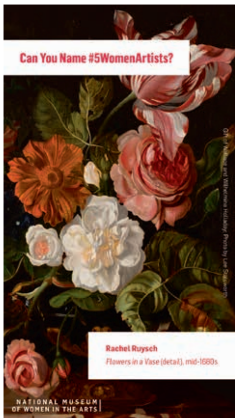
圖7 NMWA在推特上發起「認識五位女性藝術家」(Can You Name #5WomenArtists?)活動，取自該館官網： https://nmwa.org/support/advocacy/5womenartists/shareable-content/ ，檢索日期：2021年3月13日。