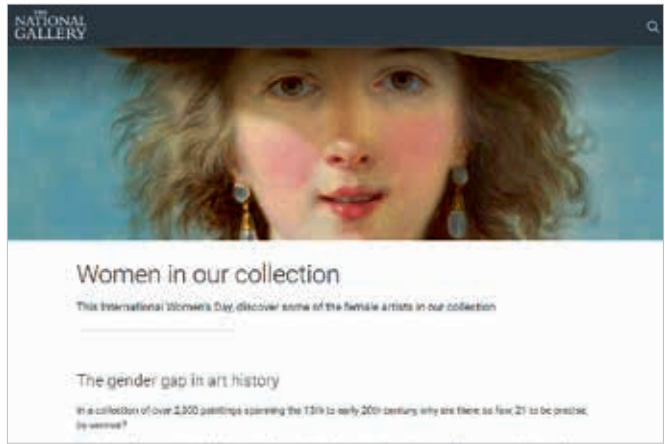
圖10 英國國家美術館以官網上的文字、圖片及影片，常態介紹典藏中的女性藝術家與贊助者。

以讓更多人認識女性藝術家。2020年時共有多達36國、675間博物館等文化機構響應此活動。該館也分享了針對全美美術館典藏的調查(圖9)，發現其中85%為白人藝術家的作品，顯示了族群果然是影響典藏決策的因素，而男性藝術家作品也高達87%，表示性別顯然也是影響決策的隱含盲點。該館藉此數據探討形成性別差異的最大障礙，其實是針對性別的盲點與成見，且其仍然主導著博物館的論述與觀點，繼續造成差異，因此博物館應自我檢視典藏與展覽政策中是否隱藏了對特定性別不利的因素與偏見。