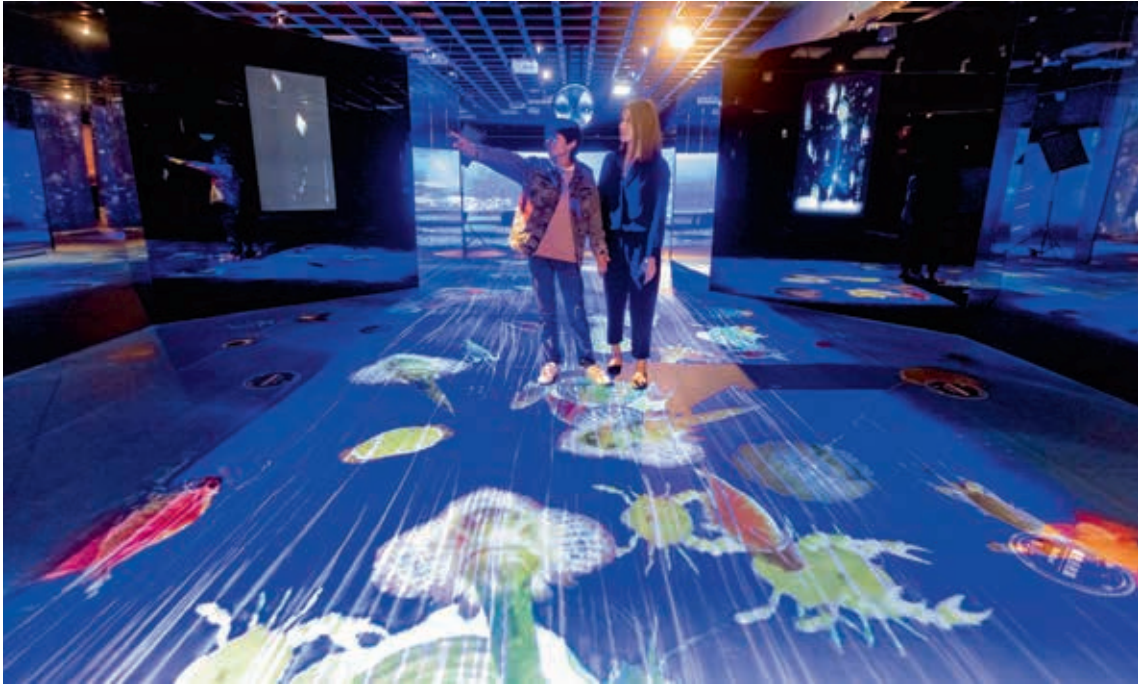
圖13 觀眾與數位展件互動，獲得全新的體驗。