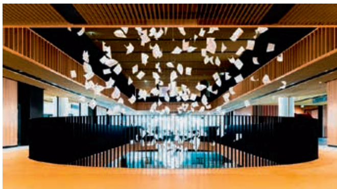
圖12 臺南市立圖書館內有展示空間、創客空間、烹飪教室、數位學習區、兒童五感探索區等多元活動空間。取自該館官網： https://www.tnpl.tn.edu.tw/u5418428796382949586/a1 ，檢索日期：2021年3月31日。

而博物館未來究竟何去何從，雖然充滿了不確定性，Szántó 書中受訪的館長們卻提出了多元而開放的各種可能性，例如博物館所在場域可以不被一棟固定的建物所限，館外的園區也是博物館體驗的一部份（圖 11），或者將展覽外延至社區，分佈在城市的不同角落，也可以常態性地與在地的文化或節慶活動結合；博物館的型態與功能更豐富，可以參考新型態的圖書館（圖 12），成為觀眾日常休閒娛樂、教育文化體驗（圖 13、14）的重要場域。總之，為因應充滿變數的未來，博物館的自我定位應維持多元與開放，博