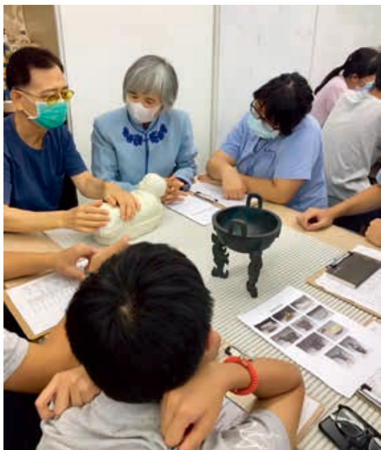
圖4 學生從旁觀察故宮進行視障導覽服務