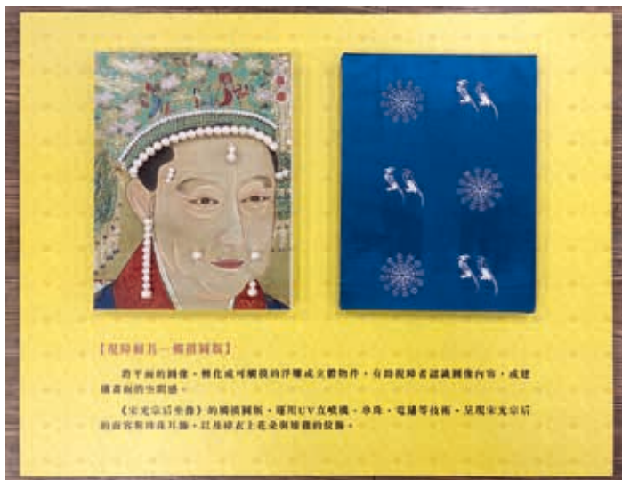
圖7-2 宋光宗后視障輔具

為了讓視障觀眾能夠感受畫中皇帝馬上英姿，學生嘗試設計觸摸式立體圖板，將該立軸作品轉化為2.5D的觸覺畫作，不僅還原圖畫內容，亦將畫中描繪的主體明宣宗樣貌進行拆解，利用不同材質堆疊及雷射切割等方式，將局部內容獨立繪製說明，加強視覺障礙者對畫作人物與空間表現的理解，更進一步瞭解畫中呈現的重要細節。