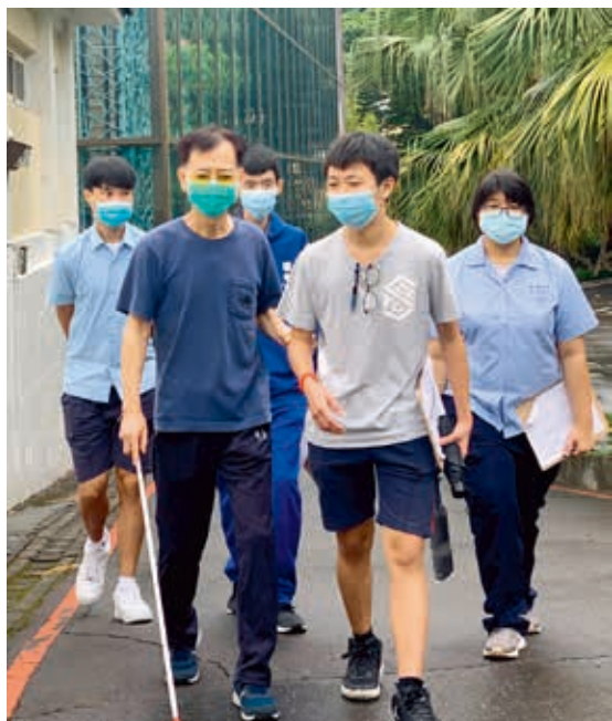
圖3 學生實際體驗引導視障觀眾服務