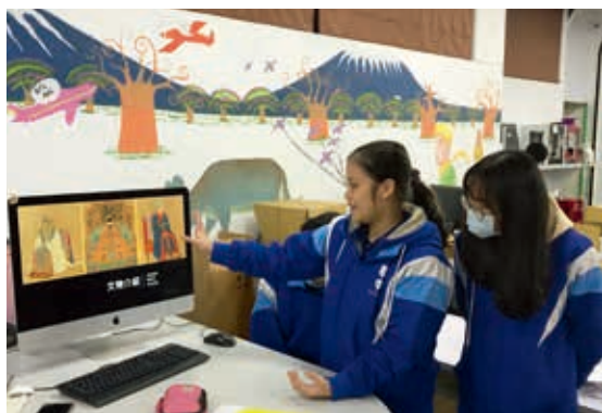
圖2 學生於課堂中熟悉南薰殿特展展件作品

課程以故宮收藏南薰殿帝后像為素材，畫作中，利用帝后精細的描繪與圖騰，展現出無形且抽象的「權力」。因此，在課程安排上，首先引導學生探討什麼是「權力的形狀」？權力該如何「具像」？（圖2）如何感受帝后的權力？作為學生進行視障觀眾輔具規劃建置的基礎。