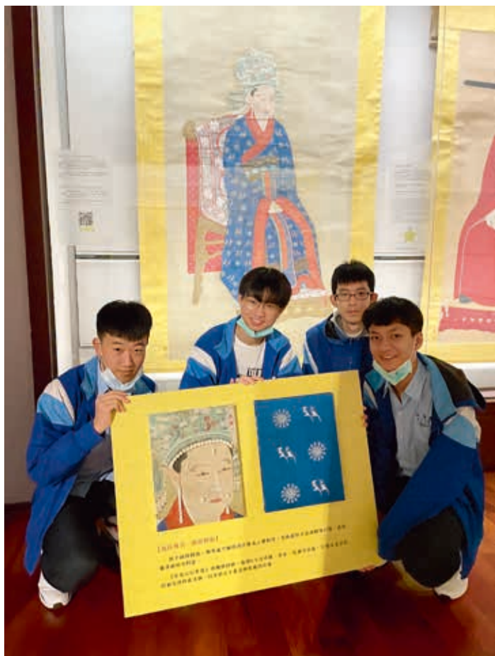
圖7-1 學生作品——〈宋光宗后坐像〉視障參觀輔具