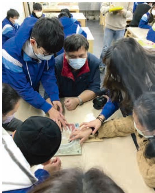
圖6 視障觀眾於展前進行學生作品體驗

該組選定以特展展出之〈明宣宗馬上像〉為素材（圖9），畫中宣宗騎著馬，手臂上架著鷹，徜徉在草原上，極富動態感，是特展中少數的「皇帝生活像」，在畫家筆下可感受到，努力想表達出皇帝在馬上的樣貌，對於視障者而言，藉由觸覺導覽，能以觸覺代替視覺，實際體會物件的大小、材質、紋理及溫度等。更可以讓視障參觀者在腦海中構築出物件的輪廓。 3