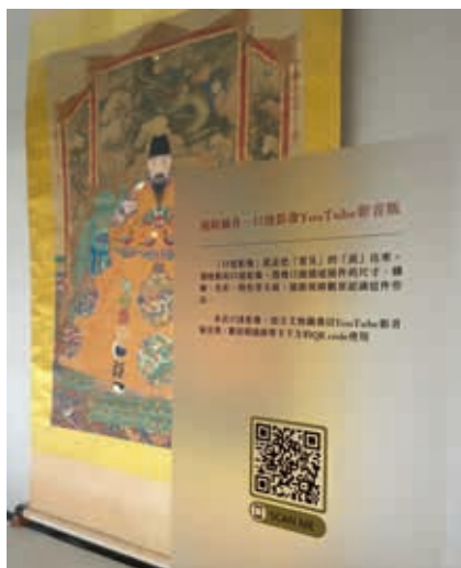
圖8 展場中掃QR Code, 可聽取學生錄製之口述影像語音導覽內容。