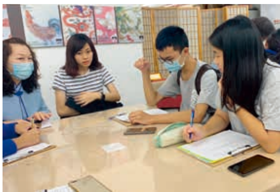
圖5 學生針對視障觀眾需求進行訪談

另一方面，為使學生瞭解視障者在生活中的不便，課堂特別安排視障體驗，包含「白手杖使用」及「人導法」（圖3）、視野缺損打球測試以及口述影像體驗等，藉由實際體驗，讓學生在未來規劃方案時，能以換位思考的方式，設身處地的為視障觀眾設計輔具設施，達到讓視障者同樣能體驗故宮書畫的細緻與美感的目標。此外，亦安排學生觀摩故宮既有之視障觀