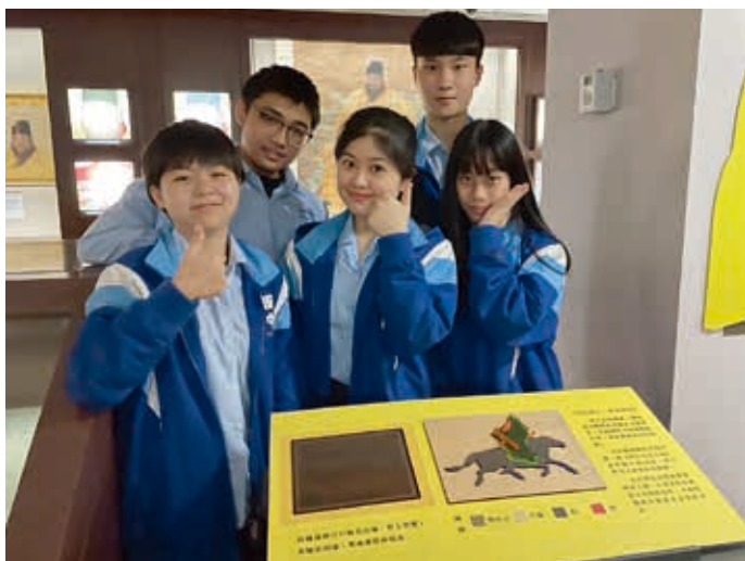
圖9 〈明宣宗馬上像〉觸摸圖版設計

包含藝術人文、生活與科技等學科，學生作品在特展期間共同展出，亦是故宮的首次嘗試。在課程發展及學生學習歷程中發現，當博物館與學校共同合作，協助學生認識展覽文物，利用課堂教學進行詮釋轉譯，再由學生進行轉化設計，提高了學生對於參觀博物館的意願，強化「自主學習」的教育目標，讓學生針對特展設計視障輔具，並在展覽期間同時呈現於觀眾面前，對於學生而言，更是難能可貴的機會。這樣的課程規劃，亦希望學生在進行專案期間，