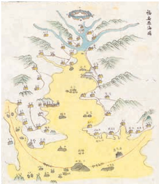
圖12 清 張景祁等 《福安縣志》附件 《福安縣海圖》 清光緒十年刊本 國立故宮博物院藏 故志003259~003270