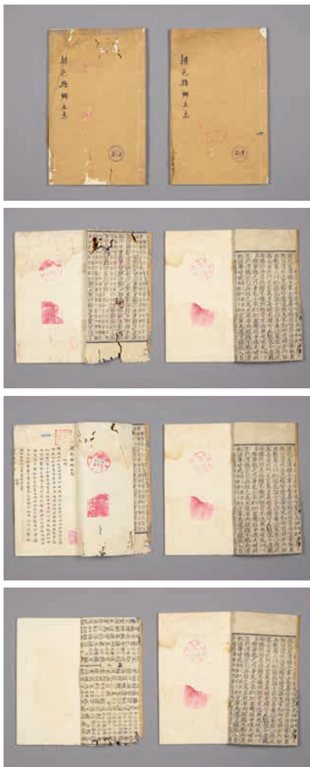
圖13 不著撰人 《朝邑縣志》 舊鈔本 國立故宮博物院藏 贈善019220、019221