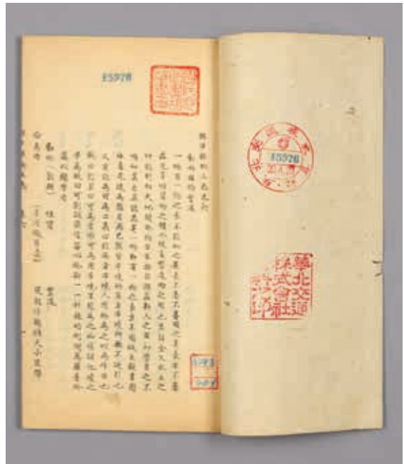
圖8 清 張元際 《興平縣鄉土志》 清光緒三十三年刊本 國立故宮博物院藏 贈善019037~019042