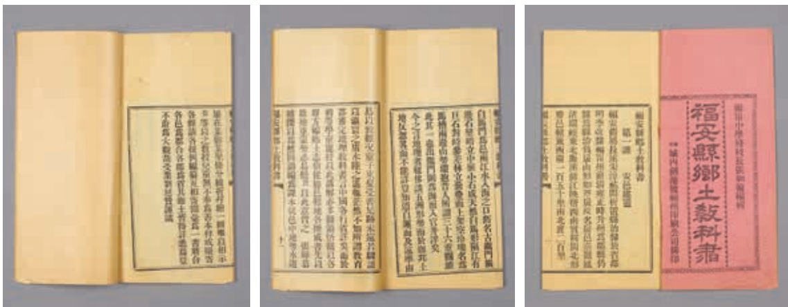
圖4 清 張景祈等 《福安縣志》附件 《福安縣鄉土教科書》 清光緒十年刊本 國立故宮博物院藏 故志003259~003270

比對近來出版收錄相對完整之《中國地方志集成—鄉土志專輯》目錄所列，以及《中國地方志總目提要》，院藏鄉土志稀見者不少，其中河北省《新安鄉土志》、福建省《福安縣鄉土教科書》兩種更僅見藏於本院。（圖3、4）