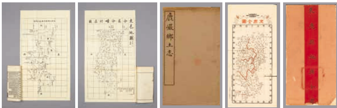
圖5 清 李文耀修 《束麓縣鄉土志》 清乾隆二十七年刊本 國立故宮博物院藏 故志012953