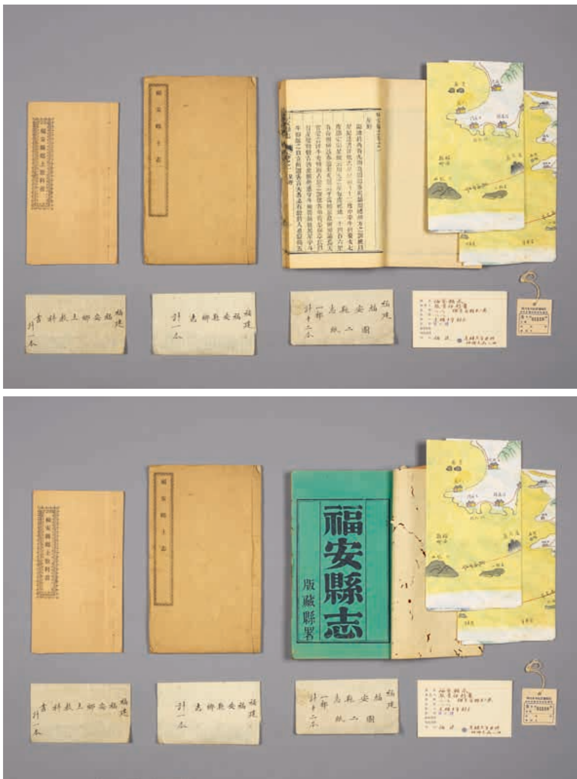
圖2 清 張景祁等 《福安縣志》卷首及清史館小簽 附《福安鄉土志》、《福安縣鄉土教科書》 清光緒十年刊本 國立故宮博物院藏 故志003259~003270