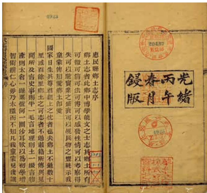
圖1 清 王學曾 《惠民縣鄉土志》 清光緒三十二年刊本 國立故宮博物院藏 贈善016336、016337

本院典藏鄉土志總72部（含「風土志」、「鄉土教科書」）， 6 主要來自國防部史政局 7 1983年捐贈的18,047冊舊籍之中，其次是北平故宮壽安宮圖書館1929年9月，「從清史館提入之書」，前者乃日軍佔領華北期間，向各地徵集所得， 8 後者則是清史館為籌辦地理志向地方徵集而來。 9 除鈔、刊本兼具之外，