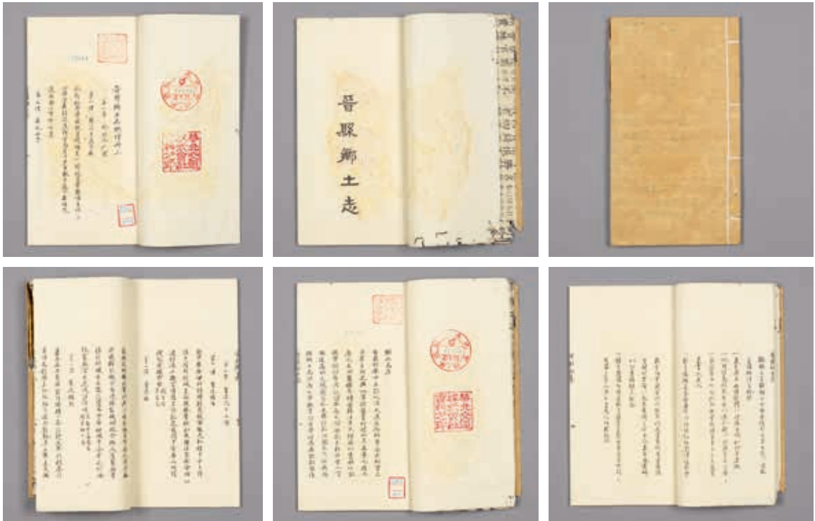
圖14 清 李驥程 《晉縣鄉土志》 舊鈔本 國立故宮博物院藏 贈善015447、015448