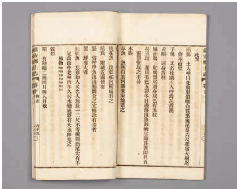
圖9 清 李麟圖修 《鎮安鄉土志》 清光緒三十四年鉛印本 國立故宮博物院藏 贈善019618、019619