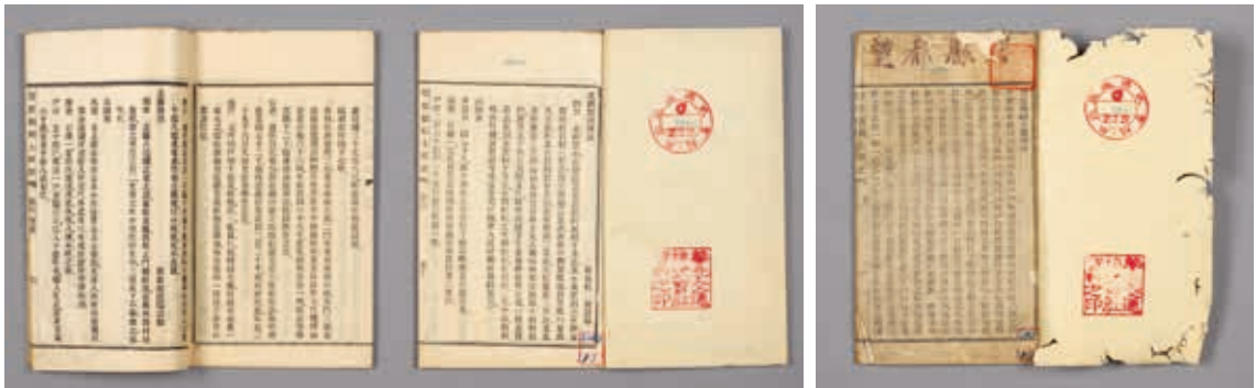
圖15 清 陸保善編輯 《望都縣鄉土圖說》 清光緒三十一年鉛印本 國立故宮博物院藏 贈善014646~014649

要途徑，河北《望都縣鄉土圖說》在每個章節列出採訪者姓名，例如「城垣圖說」是教員楊兆麟、麻鑑本二人採訪撰稿，「北關圖說」是教員趙廷瑞採訪撰稿等等。（圖15）還有，河北《雄縣志》卷前記錄採訪者「高等小學堂董事增生郭乃文」，謄錄者「高等小學堂司事童生王俊清」等13人，採訪兼謄錄者高等小學堂