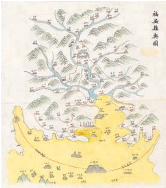
圖11 清 張景祁等 《福安縣志》附件 《福安縣輿圖》 清光緒十年刊本 國立故宮博物院藏 故志003259~003270