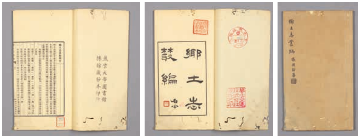
圖7 民國 燕京大學 《鄉土志叢編》 民國二十六年 國立故宮博物院藏 贈善018744~018753