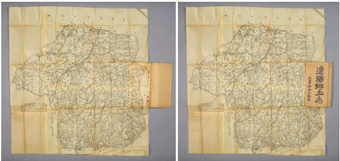
圖 10 清 洪汝冲修 《遼陽鄉土志》 清光緒三十四年鉛印本 國立故宮博物院藏 故志012552