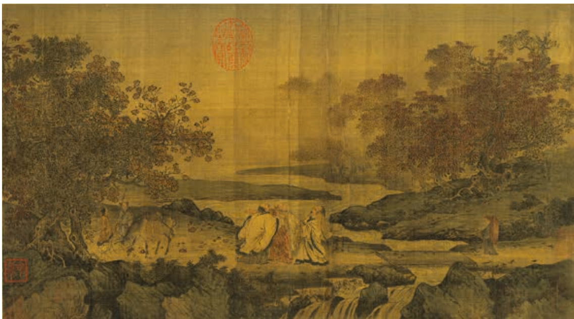
圖1 宋人 虎溪三笑圖 《藝林集玉冊》第1開 國立故宮博物院藏

「翰墨空間——故宮書畫賞析」為國立故宮博物院南部院區書畫例行展，展品挑選首要跨越朝代，書法講求各體兼備，繪畫則以山水、花鳥、人物三大領域為輔。上述原則之外，繪畫作品在挑選時，也以若有似無之宗教元素串聯作品，提供畫科發展之外的觀覽角度。