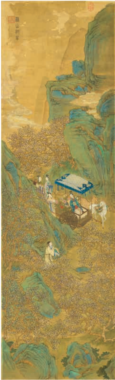
圖5 明 張翀 蓬山迎龔 國立故宮博物院藏