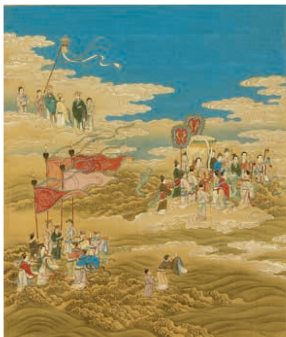
圖11 清人 天后安瀾 《天開壽域南極圖冊》第11開 國立故宮博物院藏