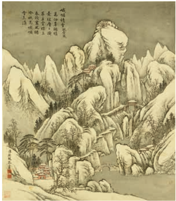
圖10 清 周鯤 倣李成峨嵋積雪 《仿古山水冊》第12開 國立故宮博物院藏