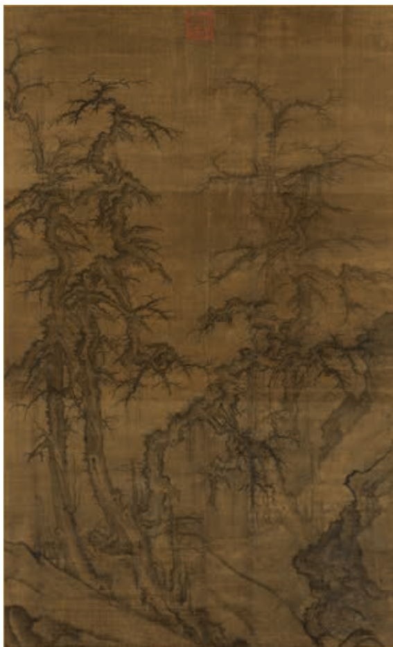
圖15 傳宋 許道寧 喬木圖 國立故宮博物院藏

〈喬木圖〉（圖 15）為一件以雙縑拼接的絹本作品，描繪冬日寒林。畫中數株古木聚生於陡峭坡石間，姿態虯蜷，藤蔓纏繞垂掛，枝桠伸展如蟹爪，襯托出挺立的新枝。墨色濃淡運用靈活，變化微妙，彷彿籠罩於煙嵐之間。喬木交互掩映，在冷冽的氣氛裡，增添向榮的