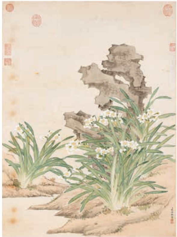
圖9 清 關槐 洞天仙聚 國立故宮博物院藏