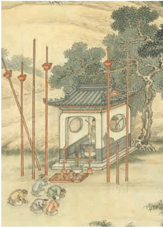
圖4-2 清 楊大章 仿宋院本金陵圖 局部 國立故宮博物院藏

畫作上署款完成於乾隆五十六年（1791），製作時間長達四年，為清代宮廷長卷人物風俗畫的代表。