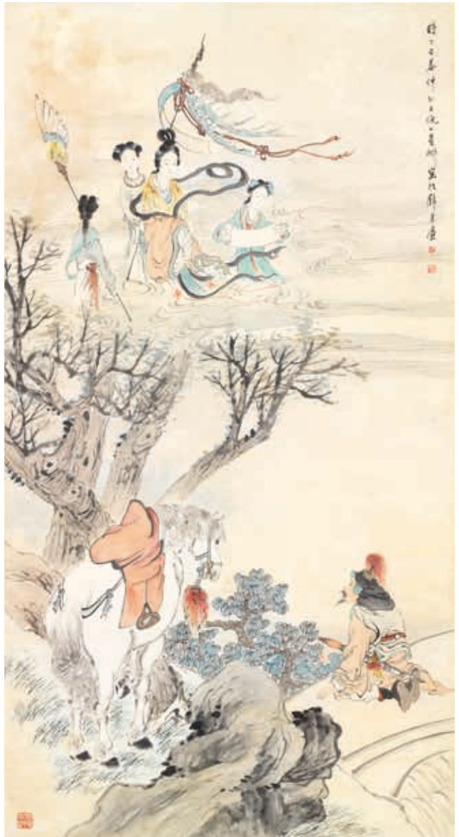
圖6 清末民初 倪田 汾陽遇仙 國立故宮博物院藏

〈秋山蕭寺〉（圖8）為雍正五年（1727）進士的詞臣畫家鄒一桂（1686-1772）所作。鄒一桂，字元褒，號小山，江蘇無錫人。本幅繪於乾隆庚午年（1750），畫紅葉蒼松，水秀山清的秋天景致，深林古刹，肅穆莊嚴。山徑獨行的文士，拄杖回望山谷，吸引注意力的或許