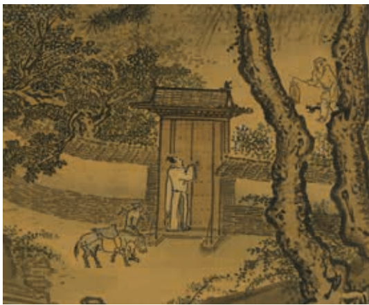
圖2 明 戴進 春遊晚歸 國立故宮博物院藏