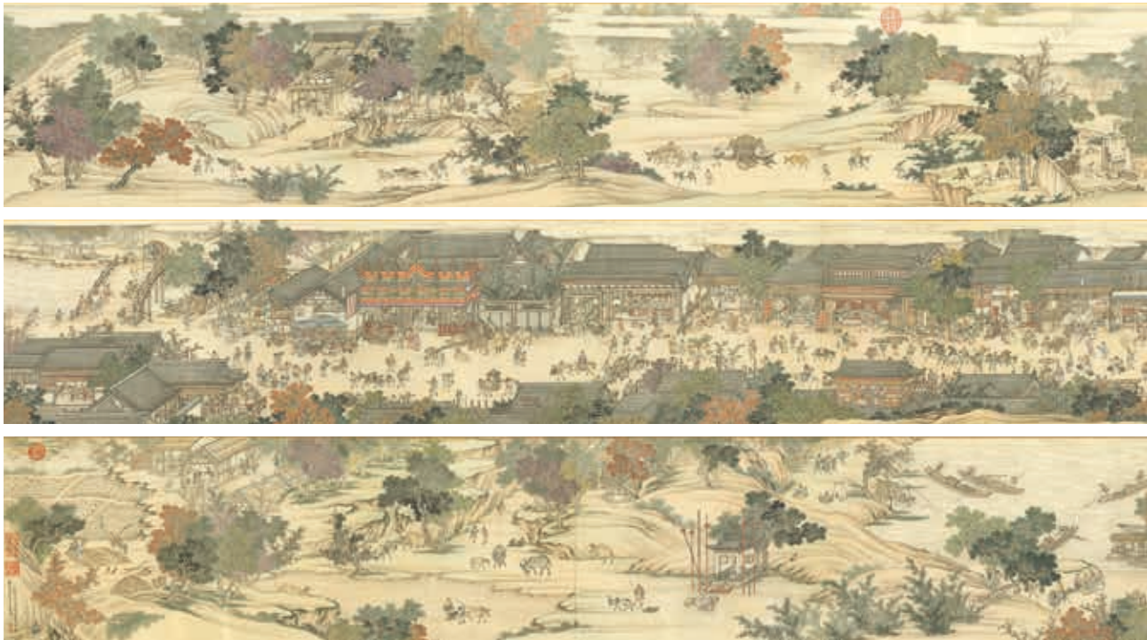
圖4-1 清 楊大章 仿宋院本金陵圖 國立故宮博物院藏