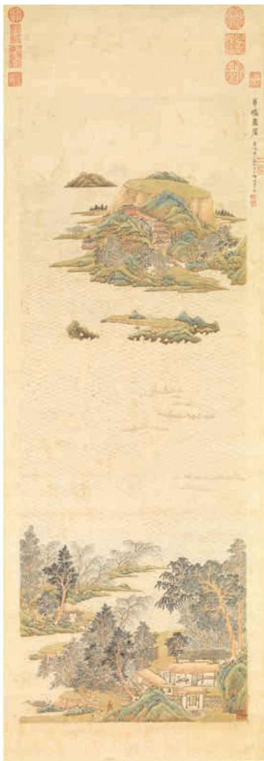
圖13 明 文伯仁 圓嶠書屋圖 國立故宮博物院藏

土之意，清晰地指出此冊的祝壽用途。配置採右圖左文，左幅題詩以泥金書寫，邊框飾以多色的泥金纏枝紋，光彩煥然。右幅以乘坐輦車、隨從簇擁的媽祖為中心，一旁有仙人作揖相迎，全幅使用色彩鮮明的礦物性顏料，恰到好處的金彩更凸顯富麗典雅的效果。畫中輦車行經處風平浪靜，對比周圍洶湧波濤，呼應題詞「海不揚波」，彰顯天后媽祖之海洋守護神形象。