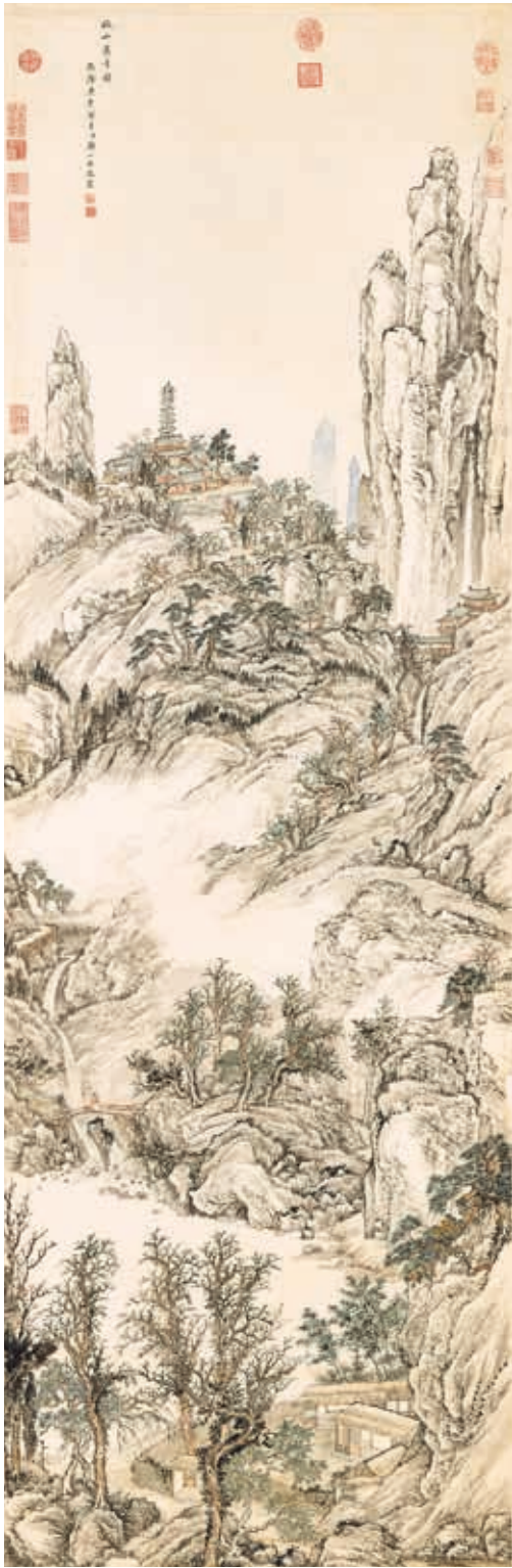
圖8 清 鄒一桂 秋山禪寺 國立故宮博物院藏