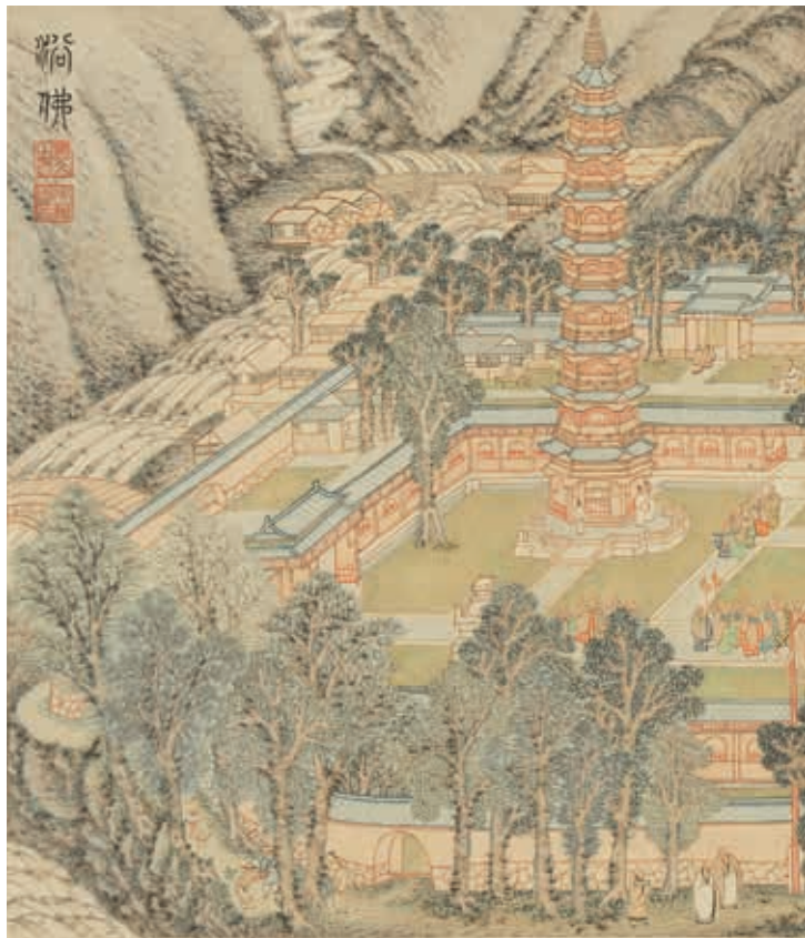
圖3 明 吳彬 浴佛 《歲華紀勝圖冊》第4開 國立故宮博物院藏

是一件以春日出遊踏青歸來為題材的作品，畫上並無名款，研究者據畫風推測為戴進手筆。 1 戴氏乃浙江錢塘人，字文進，受薦擔任明代宮廷畫師，畫風承襲李郭與馬夏畫派，為浙派先聲。本幅繪傍晚時分，農人荷鋤返家，士人出遊歸來，僕役提燈來應，點出晚歸的畫意。畫中處處可見盛開的桃李花樹，呈現春日氣息。筆墨效果豐富，靈活而變化多端，為戴氏風格的代表作。