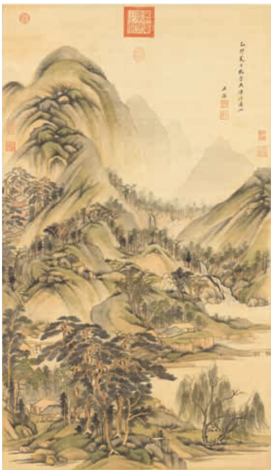
圖14 清 王鑑 倣黃公望煙浮遠岫圖 國立故宮博物院藏

為全真教道士。此畫主景偏於左側，以扭動、崢嶸的山勢連貫畫面近、中、遠三景，用溼潤的皴染配以赭石、花青、汁綠，賦予畫面清雅明亮的氣息。畫中綿延堆疊的山勢與茂密的樹木，凸顯出大地蓬勃旺盛的生命力，與黃公望山水「山川渾厚，草木華滋」的意趣相合。