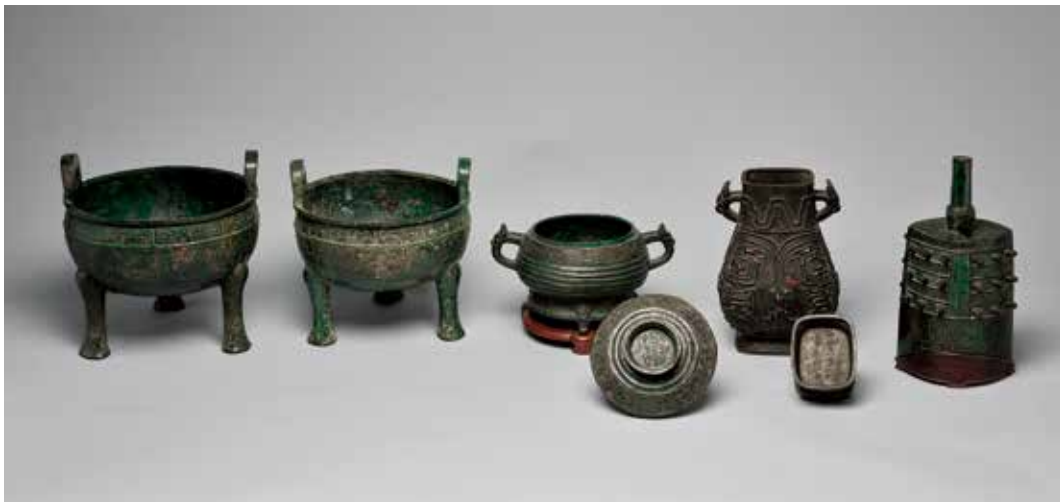
圖 21 | 春秋早期 芮公器群 國立故宮博物院藏

地認識典藏於博物館的銅器，除了探究原器承載的時空訊息，每一件器物的傳世經歷，亦是關鍵的拼圖，現代科技和數位人文則幫助我們一步一步的重建過去可能發生的故事。