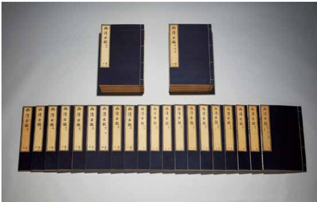
圖9 | 清 梁詩正等奉敕編 《西清古鑑》 清乾隆二十年武英殿刊本 國立故宮博物院藏