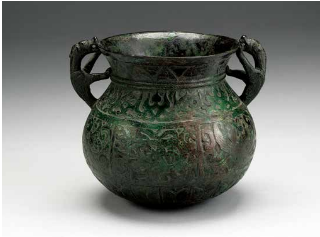
圖4 | 北魏 神獸蓮花紋壺 國立故宮博物院藏

現觀察此器為圓口、細短柄、盤形圈足。器腹可見波浪式的聯珠紋帶交會，間隔填滿花葉紋，圖塊以銀片鑲嵌。口緣及圈足上各有一周庫發體（Kufic）銘文，是伊斯蘭文化中常用於抄寫可蘭經的古體文。銘文內容為向真主阿拉祈求人世名利的祝願之語。經比對，此器可能來自伊朗東部呼羅珊，年代約為十三世紀。 2 雖然乾隆時期釋文未果，但藉由考述回鶻國的地域、文化，以及和中國交