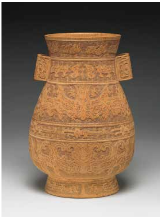
圖11 | 清 竹雕獸面紋貫耳壺 國立故宮博物院藏

透過銅器的分類和記錄，每一類銅器皆各自擁有專屬名稱，而隨著對於器物認知或銘文隸釋的改變，名字也會跟著變動。因此器名的改易，往往反映著銅器知識史的進程。