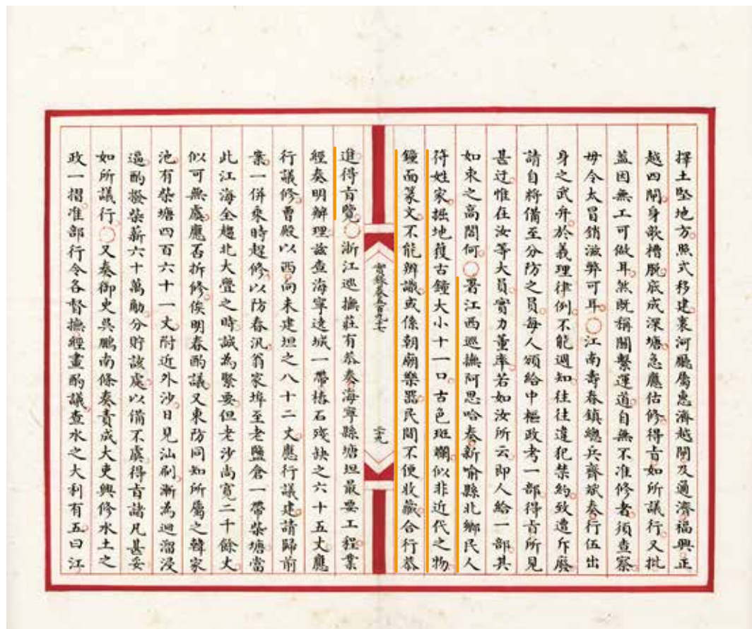
圖2 《大清高宗純皇帝實錄》 乾隆二十四年九月下 卷597頁29 國立故宮博物院藏