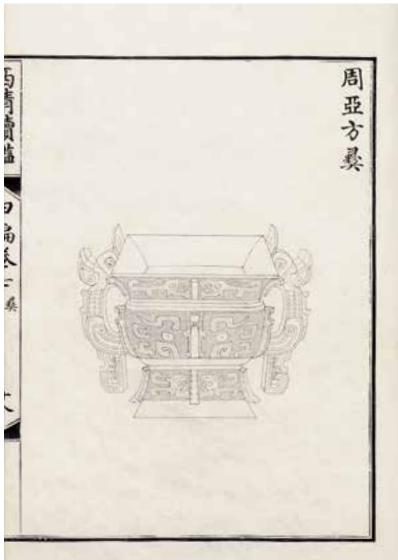
圖 20 清 王杰等奉敕編 《西清續鑑·甲編》 卷七頁 18 周亞方彝 清乾隆五十八年內府圖繪寫本 國立故宮博物院藏

亞形，第二層為殘片，可見「姁以」及「彝」字，最上層的是現肉眼可視的「亞醜」銘文。由銘文經拼接的線索，可知此〈亞醜方簋〉應當與〈亞醜者姁方尊〉屬於同組器物。由者姁作器的規格，可見當時亞醜族氏的地位非比尋常，在商王朝的東方經略中佔有重要位置。