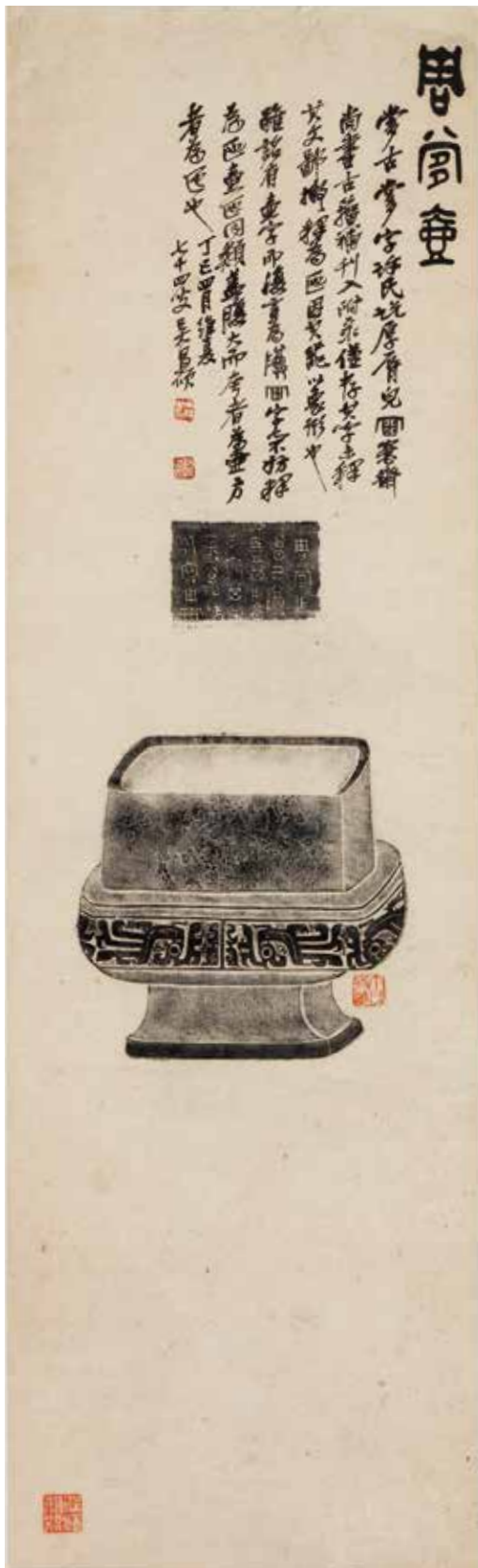
圖 16 民國 吳昌碩 周夔壺 軸 國立故宮博物院藏

器組合探尋作器者的身分和背景，也有了考古資料帶來的地理資訊。以乾隆時期的宮廷銅器收藏為例，透過銘文，可以找到來自相同族氏，甚至是同一位作器者的銅器，藉由出土材料的聯繫，以及科技檢測的幫助，三代銅禮器的更多面向逐漸浮現。