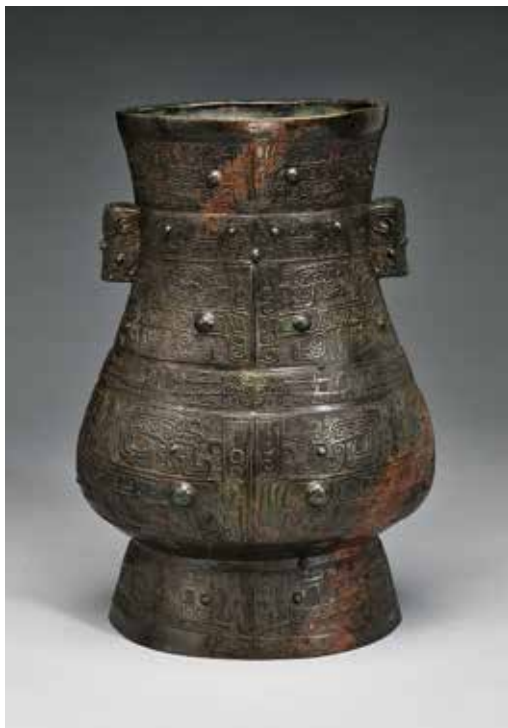
圖10 | 商晚期 獸面紋貫耳壺 國立故宮博物院藏

了單足在前，因此足部作獸面紋飾的器形，獲得正視且五官立體。 5 於銘文方面，雖為摹本，且形態多失之千里，卻仍以黑底白字，達到拓本的效果，頗費周折的表現形式，可見摹篆者追求的金石精神。