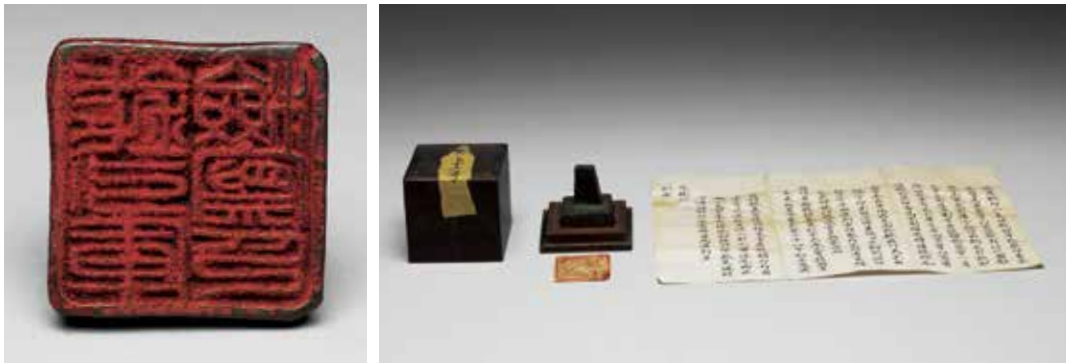
圖7 | 西夏 錢引庫檢察印 附清代呈文及木盒 國立故宮博物院藏