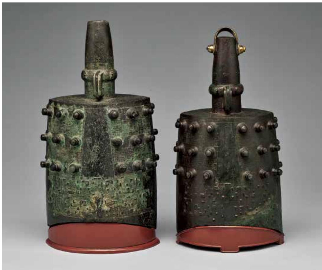
圖3 春秋晚期 者減鐘 國立故宮博物院藏

在乾隆時期的清宮之中，銅器的收藏主體除了所謂的「三代青綠」之外，亦兼及漢唐時器。以現在的眼光來看，部分的漢唐銅器反映著中古時期的政權和文化因素，如院藏北魏〈神獸蓮花紋壺〉（圖4）為北燕系工匠在平城的作品，此腹壁由上至下共三層紋