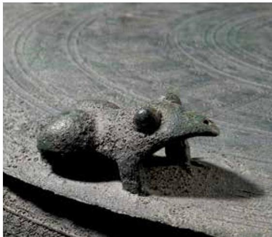
圖8 | 東漢末至六朝 立蛙紋鼓 國立故宮博物院藏

據《西清古鑑》〈漢銅鼓一〉圖說，考銅鼓多出於兩川、百粵等地，並記載漢代馬援、諸葛亮軍用遺製，及唐代嶺南節度使鄭綯獻於寺廟之說。可見清宮連結出土地域和史事傳說，理解銅鼓與南方地區的民俗器用文化。