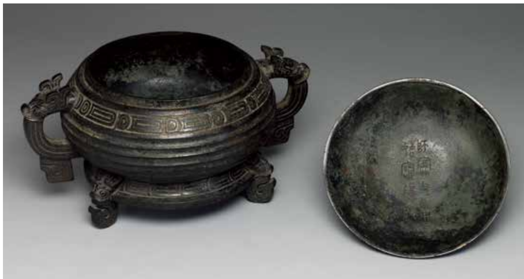
圖13 | 西周晚期 師夔父簋 器蓋對銘 自名為「簋」 國立故宮博物院藏