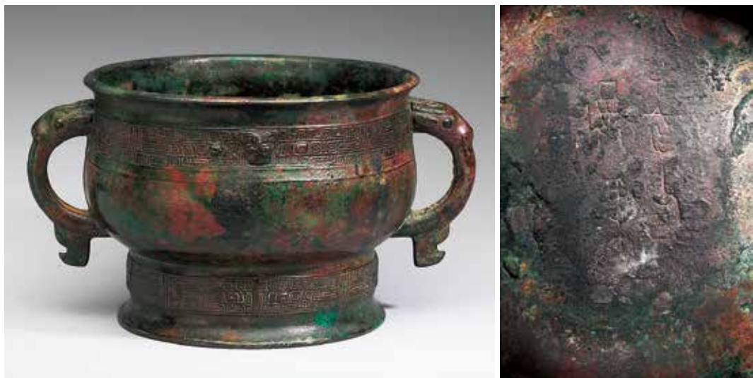
圖12 | 西周早期 作父己簋 器內底銘文 自名為「彝」 國立故宮博物院藏

清末民初著名畫家吳昌碩（1844-1927），曾收藏〈周蓼壺〉其中之一的壺蓋全形拓（圖