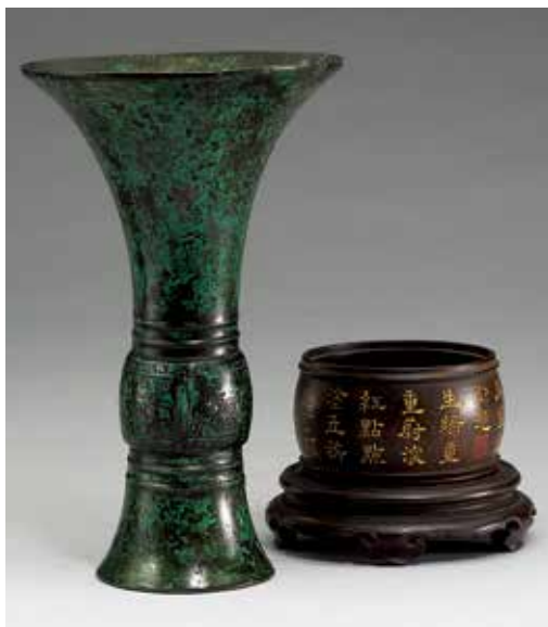
圖1 商晚期 亞旋觚 附清代乾隆時期木箱與木座 國立故宮博物院藏