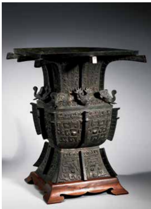
圖 18 | 商晚期 亞醜者姁方尊 國立故宮博物院藏

臣醜」之活動記錄，推測商王為防禦東邊的人方，故而命其率領族人前往戍守， 13 是為該族活躍於蘇埠屯地區的前因。其後，陸續有多位學者發表關於此族氏與歷史上的古國對應，透過文獻比對，有夏遺民 14 、齊國 15 、九侯 16 等不同的說法。