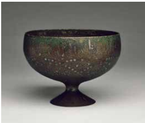
圖5 | 13世紀 伊斯蘭回文豆 國立故宮博物院藏