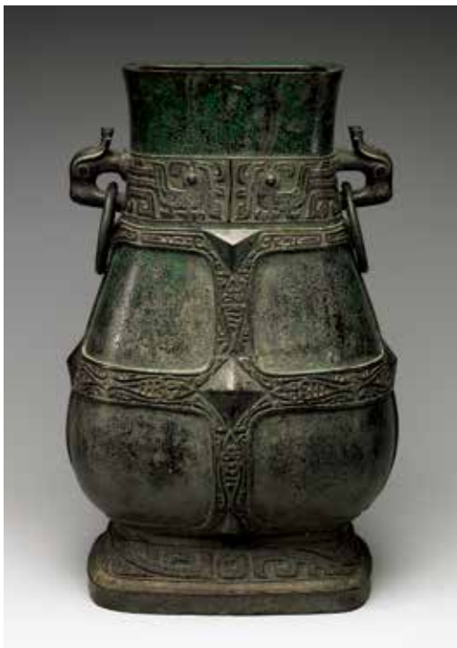
圖 14 | 西周中期 周夔壺 國立故宮博物院藏

16)，現藏於本院。據吳氏七十四歲時所作題記，其時對於此器自名為壺，器形卻未與壺相類而感到困惑，於是將銘文中的最後一字釋作「匜」，以作為對此蓋的分類判斷。又此拓為求銘文正行的角度，蓋身倒置，鳳鳥紋飾上下顛倒。然而拓片的留存，卻為失傳的〈周夔壺〉器蓋形影留下珍貴紀錄。