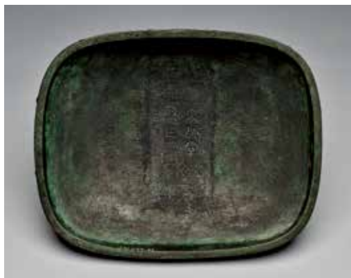
圖 17 | 南宋至明 大師望簋、蓋銘 國立故宮博物院藏

自《宣和博古圖》的〈周太師望簋〉。雖然《西清古鑑》力圖更新《宣和博古圖》的考訂舊說，但是在器物年代的辨識方面卻顯然深受影響。