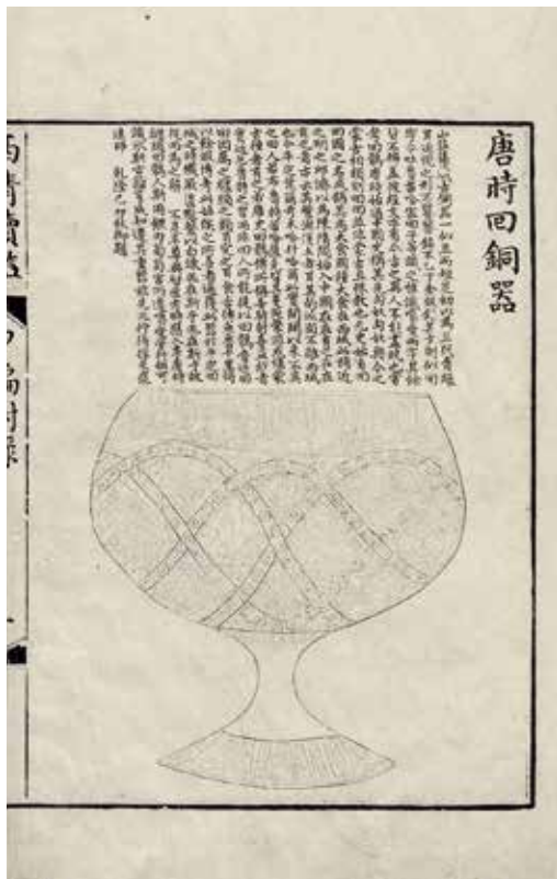
圖6 | 清 王杰等奉敕編《西清續鑑·甲編》附錄1 唐時回銅器 清乾隆五十八年內府圖繪寫本 國立故宮博物院藏

同樣在三代銅禮器範疇之外，乾隆皇帝的南方銅鼓收藏也顯得獨特。明清時期的方志已有不少銅鼓於華南地區出土的紀錄。乾隆皇帝曾作〈銅鼓歌〉，詩中吟詠的銅鼓，為雍正八年（1730）於廣西出土。 3 乾隆三十一年（1766），阿桂舉兵緬甸，途經雲