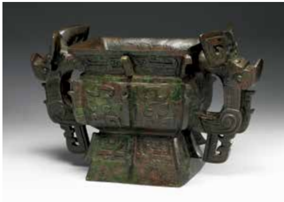
圖 19 商晚期 亞醜方簋 國立故宮博物院藏

值得注意的是，本院另藏有一件〈亞醜方簋〉（圖 19），此器著錄於《西清續鑑·甲編》卷七頁十八，名〈周亞方彝〉。（圖 20）此件方簋經由 X 光攝像，可見器底有三塊銘文拼接覆蓋，最底層為一中間有字的大