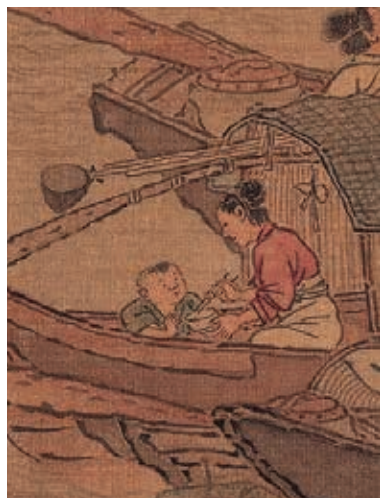
圖2-6 | 母親餵食小童