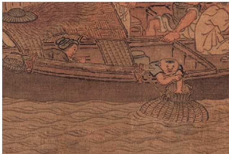
圖2-5 | 頑皮的小孩