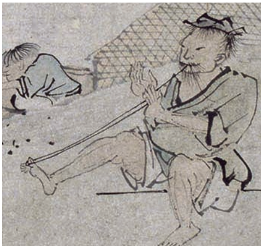
圖10-3 〈漁樂圖〉口、手、足併用理線的漁人