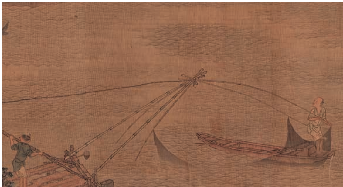
圖3-1 | 以「罾」捕魚的二人組