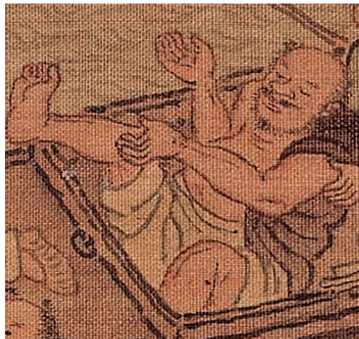
圖10-4 〈漁邨圖〉跌醉船艙者

件「漁樂圖」畫作，皆出自兼善眾體的周臣之手。這件品質絕佳〈漁邨圖〉，可以幫助我們更全面探究周臣的風格面貌。