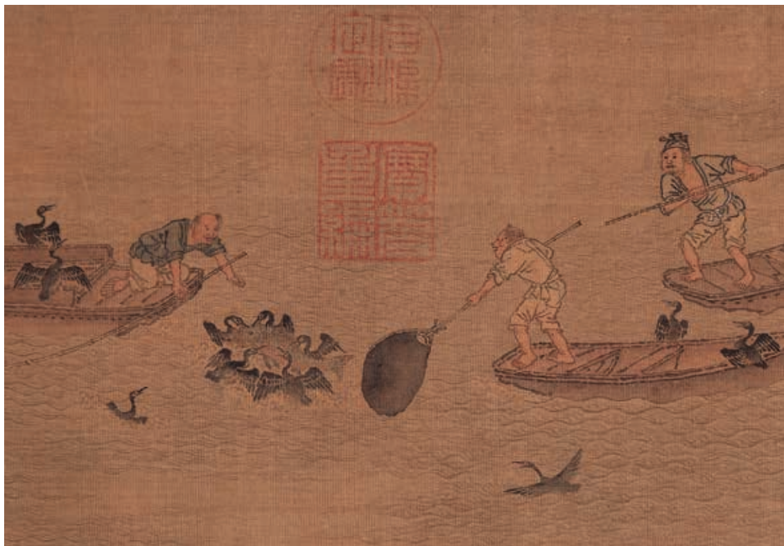
圖3-3 鸕鷀聯合捕捉大魚