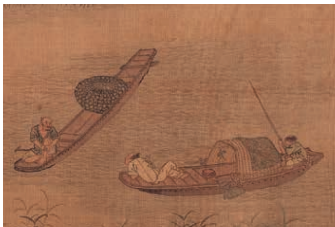
圖2-1 | 〈漁邨圖〉開場的兩條小舟

再朝畫面左方不遠處，五艘漁舟泊聚，漁父們歡聚飲食。一人擲酒壺為另一艘船上的友伴注酒（圖2-2）；其後還可見酒酣醉倒者，閉著眼揮舞手腳等有趣情狀。（圖2-3）五艘漁舟除了斜倚在白色酒罈上男子的小船