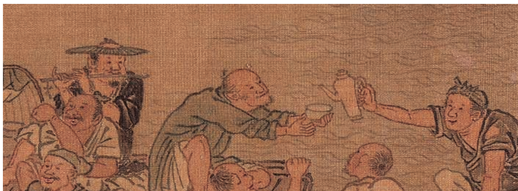
圖10-2 | 〈漁邨圖〉高舉酒碗的漁翁與後方抿唇吹笛者