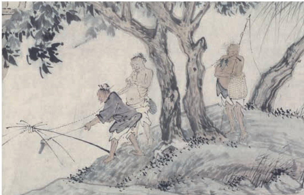
圖10 | 明 周臣 漁樂圖 局部 北京故宮博物院藏

臣畫作的年款，維持周臣可能生於 1450 年前後，卒於 1535 年以後的推測。