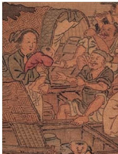
圖2-7 | 想投入爺爺懷抱的小娃