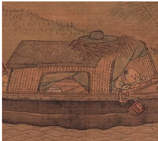
圖7 | 〈漁邨圖〉中各式船篷