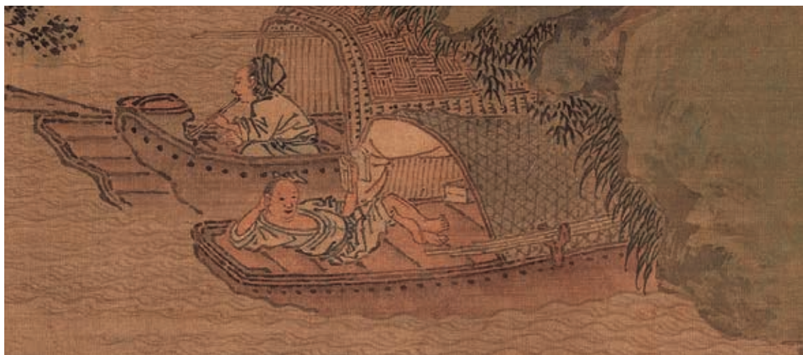
圖2-8 翹腳讀書的悠哉文人

外，其他幾艘都伴隨著眷屬。畫中這些婦女孩童的活動與互動也十分細膩精彩。如光著屁股被抱到篷頂的小娃，正摸著母親的臉頰，而船尾幼童則停下遊戲回望探視（圖 2-4）；又如左下方船上的小童，趁著母親在艙內進食之際，將手探進船邊竹簍，正調皮地要撿出些魚蝦來耍玩（圖 2-5）；鄰船尾端，另一位母親用筷子夾起一口飯食餵著小童（圖 2-6）；前艙奶奶手上的小娃，則前傾地想投入爺爺的懷抱。（圖 2-7）這幾艘船不但像相熟的友伴，更像水上的好鄰居，親密照看著