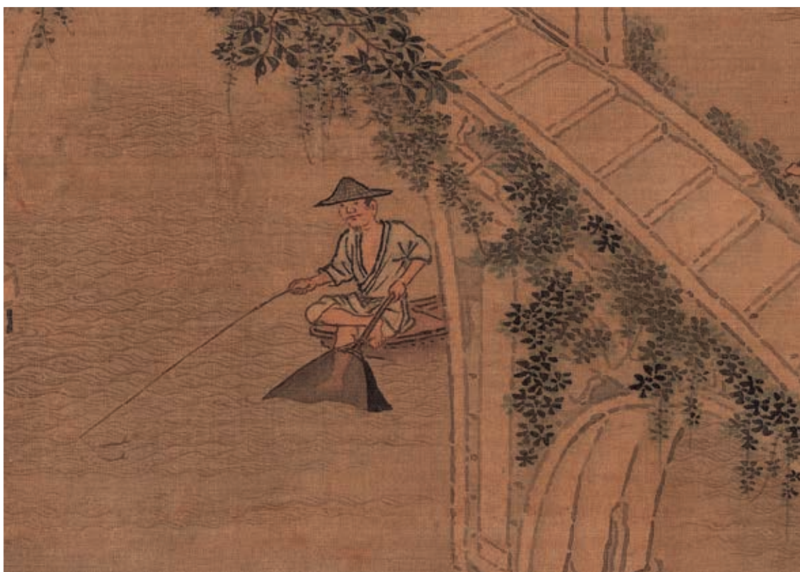
圖3-2 | 一次釣到兩條魚的漁夫