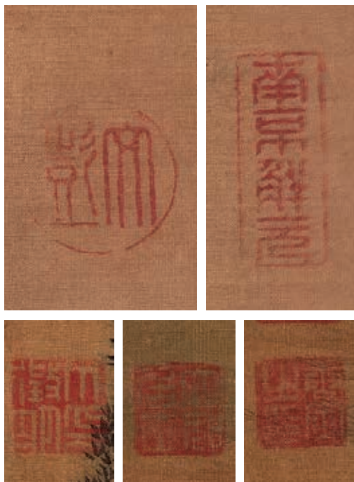
圖9 | 〈漁邨圖〉上的唐寅、文徵明與文彭印記

如同王時敏指出的「題跋俱已割裂」，目前只剩王時敏及更後期的清高宗（1711-1799）兩人的題跋。本幅亦無作者簽款，倒是邊緣處可見「南京解元」、「六如居士」、