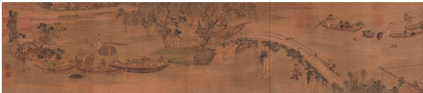
圖1 | 明 周臣 漁邨圖 國立故宮博物院藏