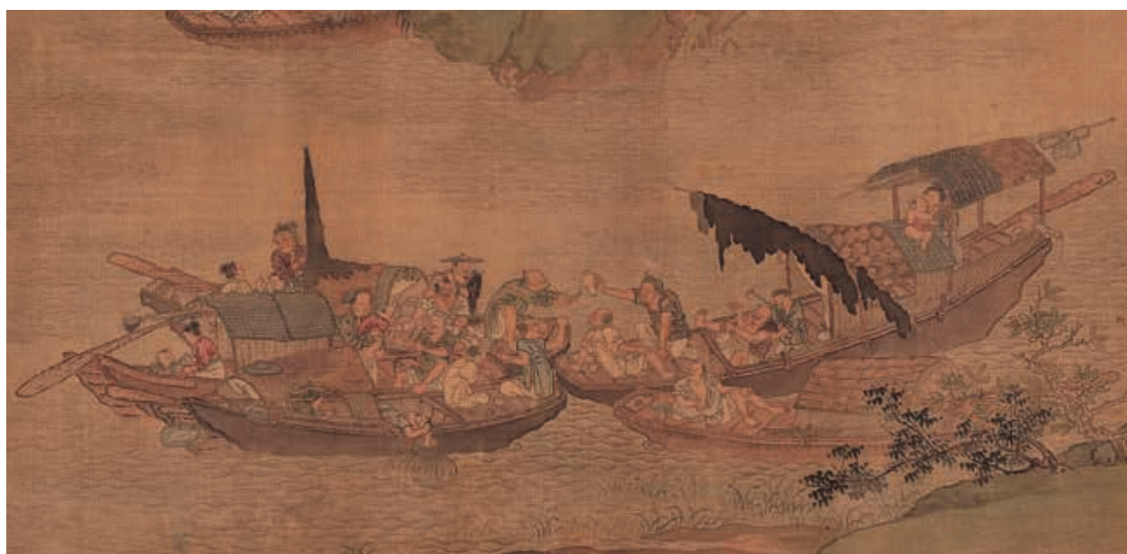
圖2-2 | 五艘漁舟泊聚，漁父們歡聚飲食。