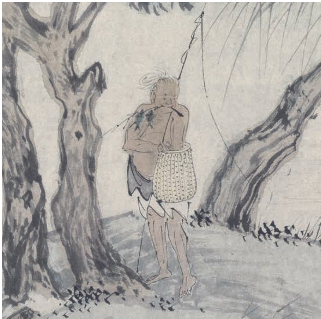
圖10-1 | 〈漁樂圖〉中口啣雙魚的人物