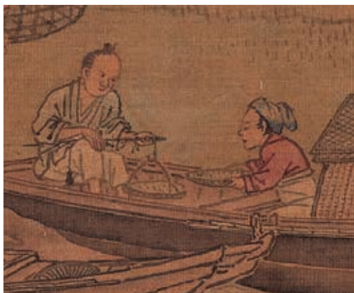
圖5-2 婦人與上船的商販交易

(圖 5-1) 水岸後方不遠處就是連綿的田地，遠處可見數間茅舍。此處或許不僅讓沿岸居民買魚，漁民也可向農民買米糧。例如穿著紅上衣的船上婦人，似乎並非買魚，而是拿著盤子與上船的商販交易白米。(圖 5-2)