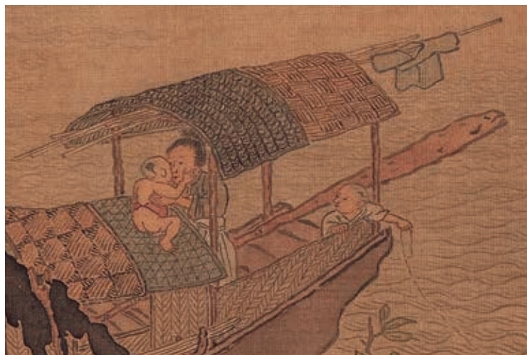
圖2-4 | 光著屁股的小童與母親