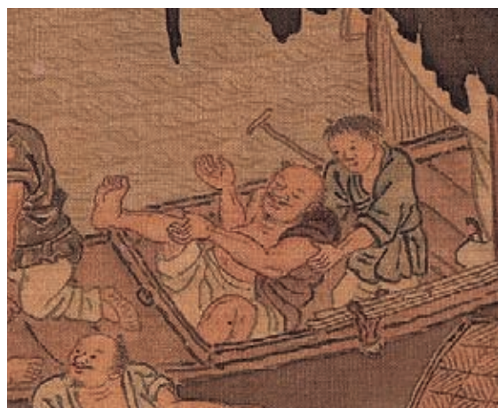
圖2-3 | 酒酣醉倒者