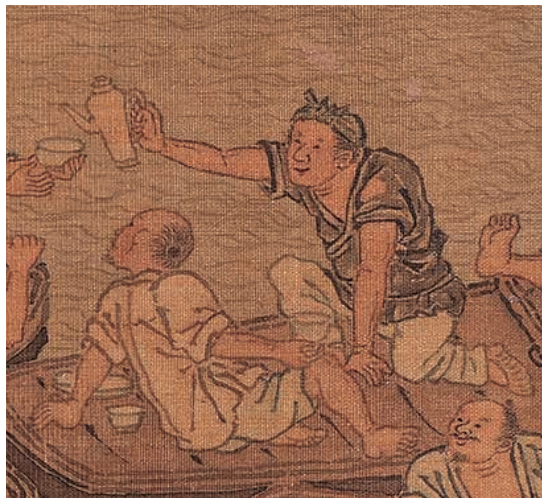
圖6 | 多變的姿態與身體細節的描繪