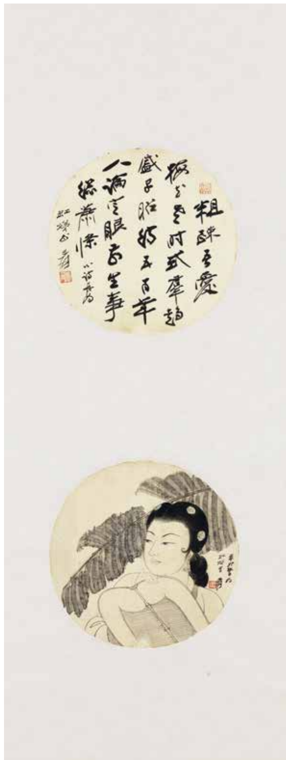
圖6 | 民國 張大千 團扇集錦 軸 國立故宮博物院藏

除了兩件精彩絕妙的高士圖，1951年為其義弟張目寒（1900-1980）妻朱紫虹所作〈團扇集錦〉（圖6），也堪稱仕女畫之精品。繪一仕女執扇於蕉葉前，彎眉鳳眼，鼻嘴勾勒精細，面容嬌美，舉止安詳，神情內斂。蕉葉用筆自然灑脫，柔和中見骨力，再以細線勾出葉筋，畫出了芭蕉葉的嬌嫩欲滴與生意盎然。上幅自書詩：「粗疎吾愛梅花老，時式羣趨盛子昭。待五百年人論定，眼前生事總蕭條。」用筆圓勁，結體敬側，搭配顛筆使用，饒富金石氣味。