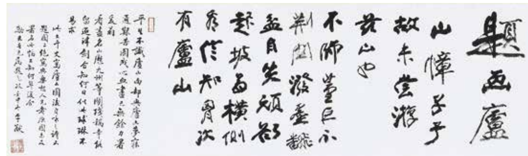
圖 1-1 民國 張大千 行草書廬山詩三首之一 軸 國立故宮博物院藏