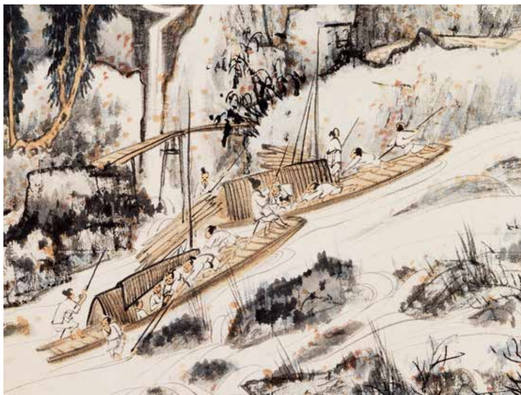
圖3-2 | 〈新安江之景〉局部

全畫設色以花青為主調，赭石為輔，是大千淺絳法之特色。筆法則仍然看得出來，係屬石濤、石谿一路，但由於此畫得於他曾親臨觀照其景的體驗和想像，以致章法亦出乎尋常蹊徑，而擺脫受制於某一家的侷限，顯示大千神遊萬里、寄寓丹青的境界。 6 此作也於「巨匠的剪影——張大千 120 歲生日紀念大展」（展期 2019 年 4 月 1 日至 6 月 25 日）中展出。