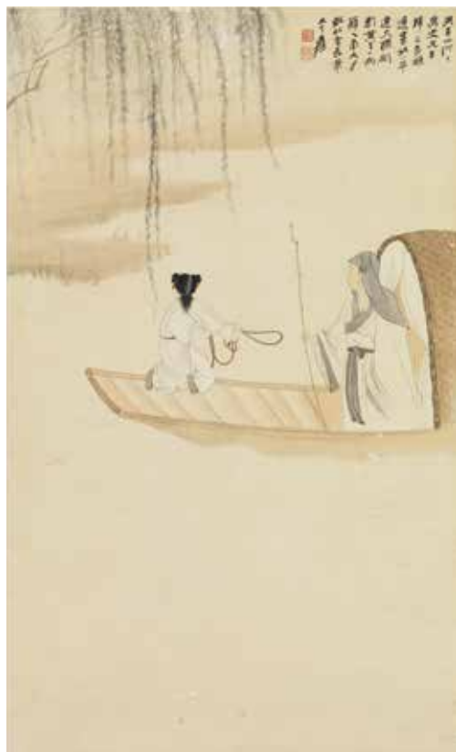
圖5 | 民國 張大千 寄奴小草連天線 軸 國立故宮博物院藏