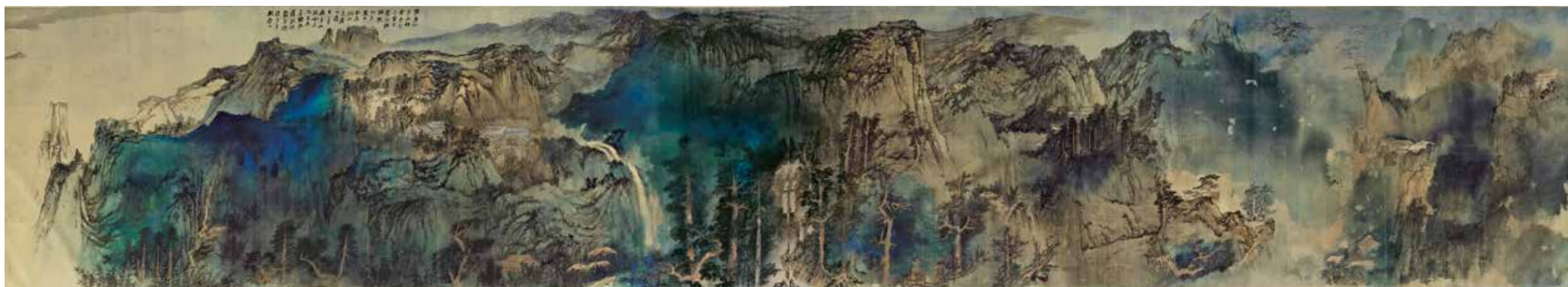
圖2-1 民國 張大千 廬山圖 卷 國立故宮博物院藏