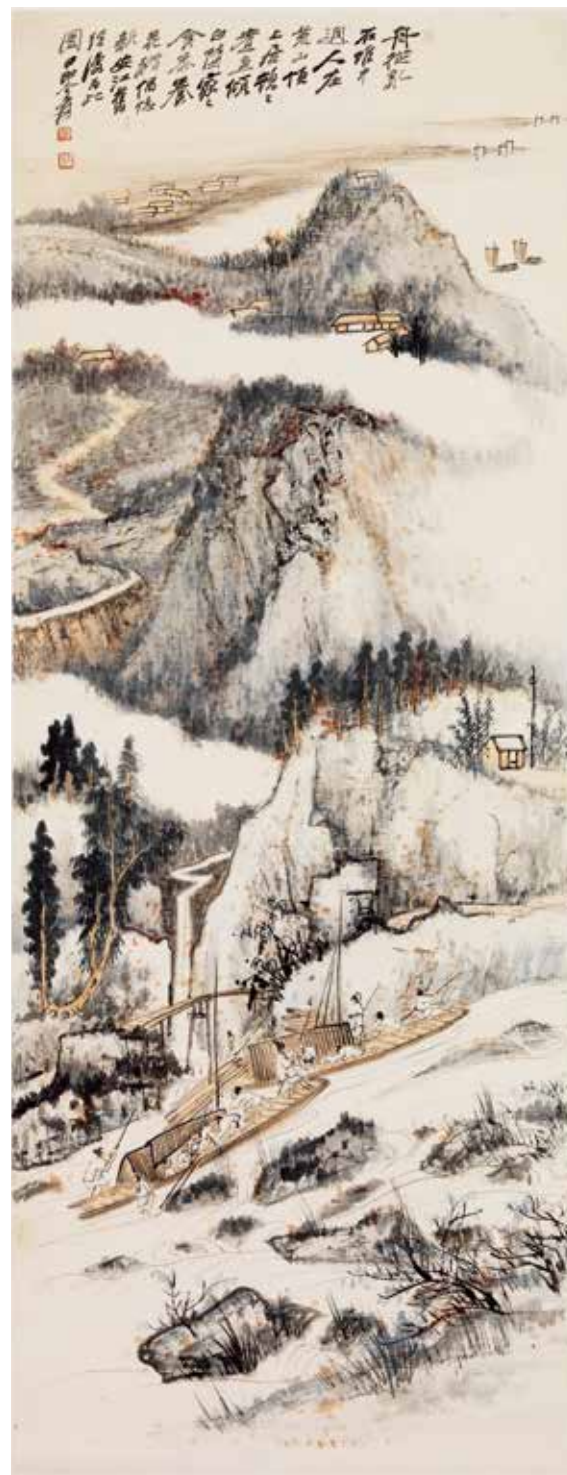
圖3-1 | 民國 張大千 新安江之景 軸 國立故宮博物院藏

從《幸福家庭書畫選集》看來，除了大千以外，齊白石、徐悲鴻、溥心畬、傅抱石（1904-1965）等， 4 都是雙桐書屋當年的收藏重點。1997年臺北淑馨出版社出版《海外遺珠——齊白石篆刻自藏印》，含陳師曾（1976-1923）為齊白石所刻五方印共五十方