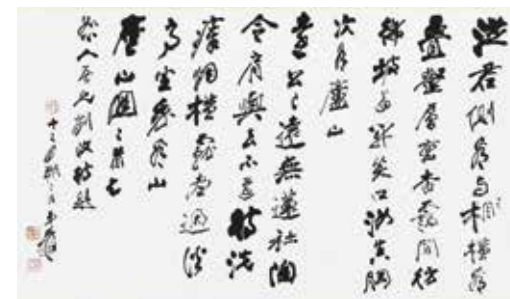
圖 1-2 民國 張大千 行草書廬山詩三首之二 軸 國立故宮博物院藏

1993年，張大千逝世十週年忌辰前一日於本院舉行捐贈儀式，院長秦孝儀（1921-2007）致詞：「張大千逝世時，張岳公（張群）