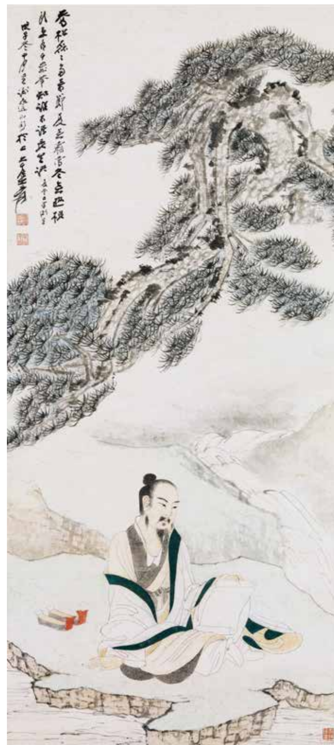
圖4 | 民國 張大千 喬松磊磊多奇節 軸 國立故宮博物院藏

〈寄奴小草連天綠〉（圖 5）據大千自云乃仿趙孟頫（1254-1322）筆意，畫於 1945 年，錄沈周（1427-1509）題〈趙子昂畫淵明像卷〉詩句：「典午山河已莫文，先生歸去自嫌遲。寄奴小草連天綠，剛刺黃花一兩籬。」繪陶淵明（365-427）歸舟圖，主人翹首盼望的神態，小童準備拋繩靠岸的身體姿態，及岸邊