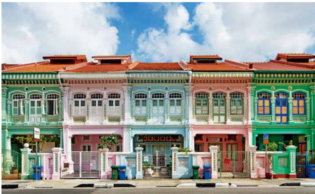
圖8 | 加東娘惹文化區之土生華人街屋