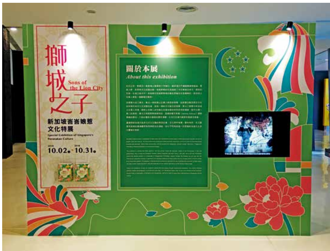
圖3 「故宮亞洲藝術節——新加坡月」活動特展希望凸顯文化的開放性、包容性及認同議題。

（Peranakan Culture）談的是外來移民所帶來的祖籍文化（如華人文化）如何與在地文化交流整合後，成爲一個新文化誕生的故事。特展從「誰是土生？」、「娘惹美食」及「娘惹時尚」三面向切入，希望在呈現娘惹文化繽紛豐富的內涵時，也凸顯文化的開放性、包容性及認同議題。（圖3）作爲一個獨立建國方滿五十週年的年輕國家，又歷經了1964年種族衝突事件，現在的新加坡格外重視多元族群間的和諧，甚至將每年的7月21日訂爲「種族和諧日」，並在新加坡國家信約中誓言「不分種族、言語、宗教」的團結。特展主標題「獅城之子」即是由此而生，亦即不論外來移民的原生地在哪處，在新加坡落