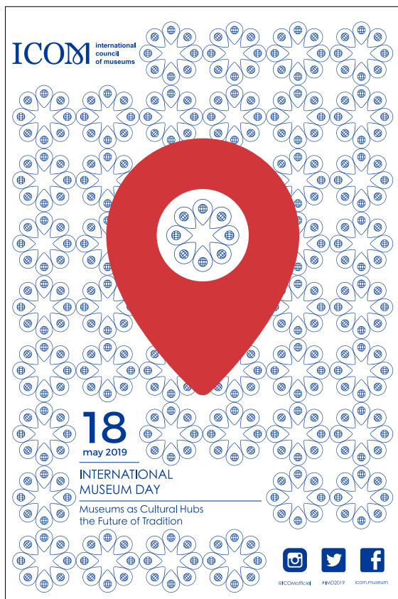
圖1 國際博物館日2019年主題海報 © International Council of Museums