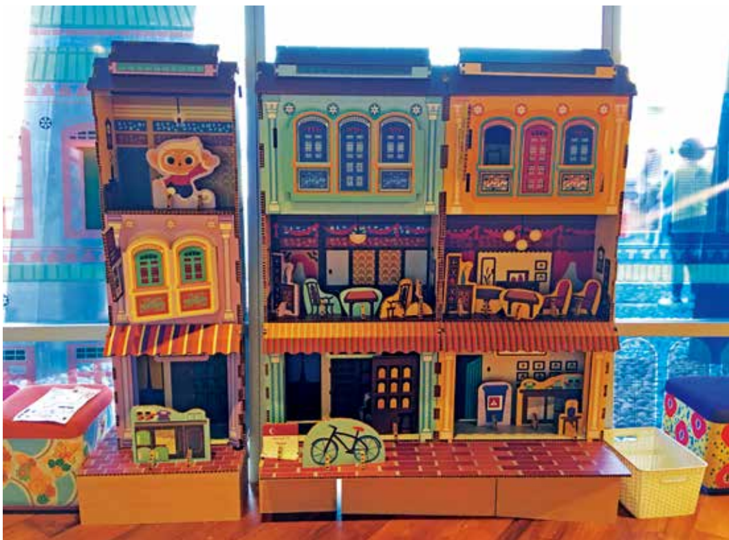
圖9 | 南院兒童創意中心的土生華人街屋展示，設計成可讓孩子們動手操作的娃娃屋。