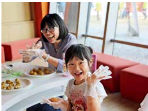
圖6 | 親子觀眾共同製作椰絲糖球 南院處提供

娘惹文化的另一代表為融合中華、馬來、印度、泰國以至西方殖民料理傳統的娘惹菜，並加入蝦醬、檸檬葉等南洋風味十足的當地食材調味，形成色香味俱足的料理。特展中的「娘惹美食」單元，輔以情境佈置、影音介紹及香料試聞罐等方式呈現。而呼應本單元主題之文化體驗活動，考量博物館內無法使用明火的安全規範及觀眾體驗課程之難易度，規劃以親子共同製作點心方式進行互動體驗，選用的點心為馬來語中稱為