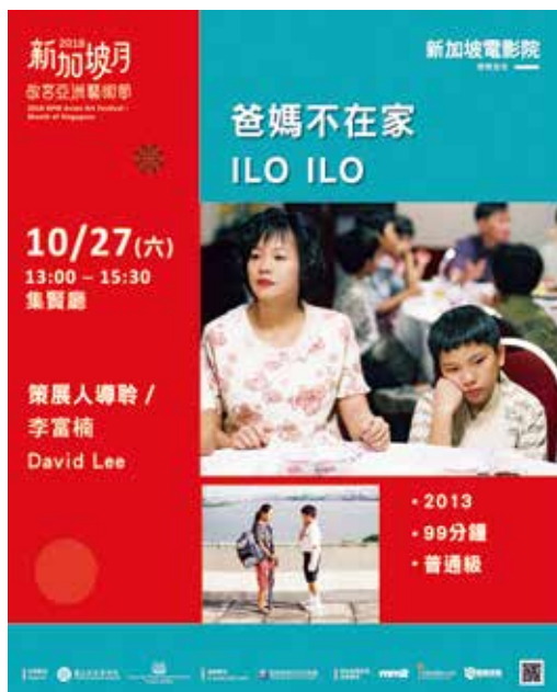
圖12 新加坡電影院精選九部電影，《爸媽不在家》為其中一部得獎佳作。

「新加坡家庭」、「新謠電影」及「得獎佳作」四大主題，呈現了新加坡時代的變遷、大環境下小人物的故事，以及值得思索的議題——如死刑等。每場電影均邀請到策展人或導演進行導聆及映後座談，讓觀眾得以在欣賞之外，透過對談互動，更深入地認識、理解「何為新加坡」。(圖12、13)