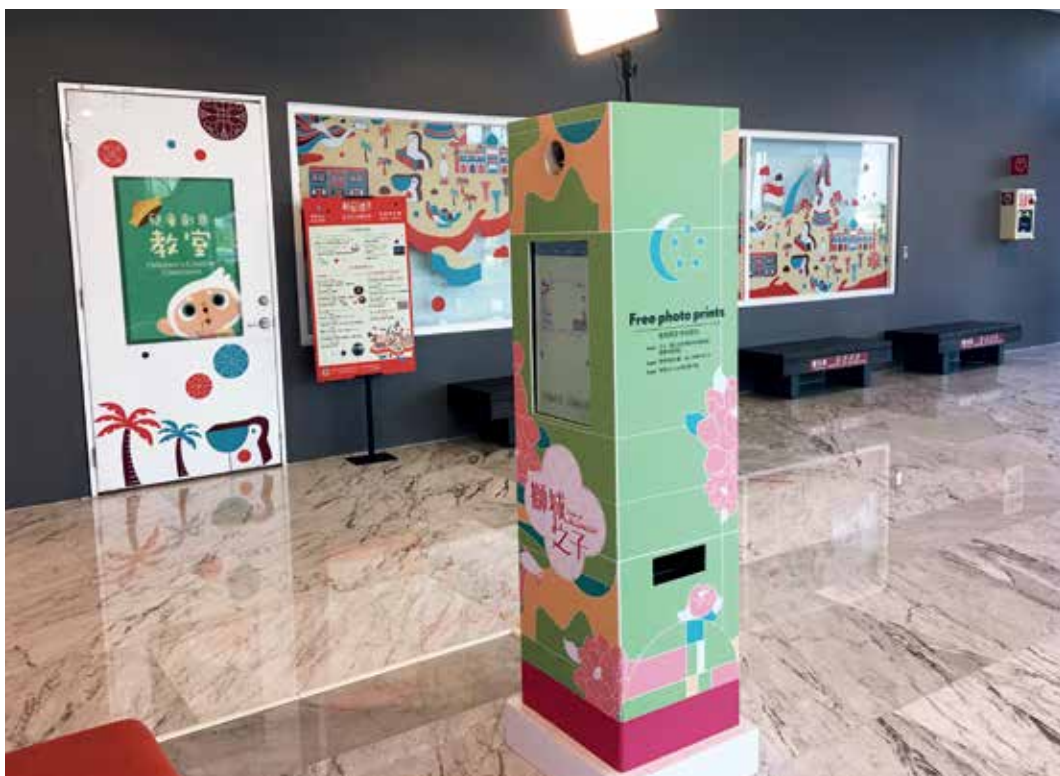
圖5 | 提供觀眾合影留念之主題拍貼機

惹服飾繽紛多姿的時尚美學。本次提供大小觀眾體驗的娘惹服飾共計二十套，均自新加坡當地採購，觀眾可一同試穿並利用展場旁的拍貼機合影，留下與家人、朋友同行出遊的美好紀念。（圖4、5）