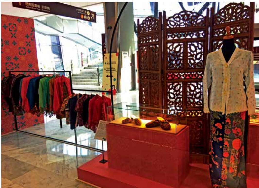
圖4 「娘惹時尚」展區即提供觀眾體驗之娘惹服飾

配合「獅城之子——新加坡峇峇娘惹文化特展」，當月份共推出十場主題導覽及服飾體驗活動。娘惹服飾及精湛的珠繡工藝係體現娘惹文化內涵的重要代表，活動透過對紗籠可峇雅（Sarong Kebaya）服飾的導覽及試穿體驗，讓觀眾得以進一步認識、欣賞娘