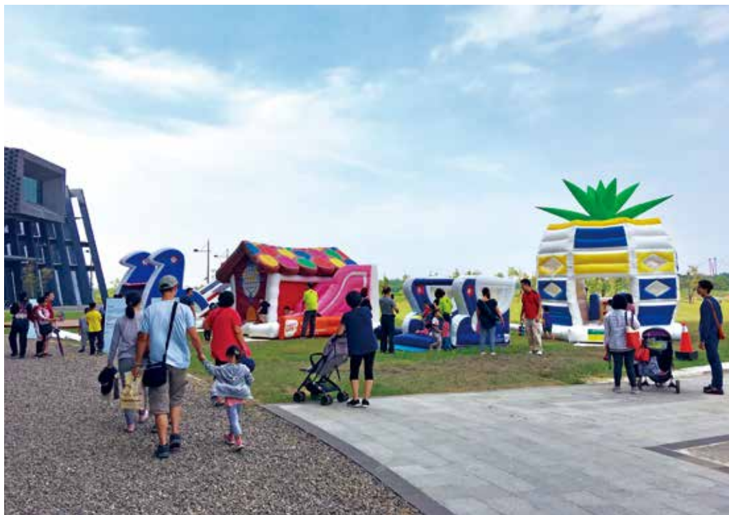
圖10 | 「新加坡兒時回憶」氣墊遊樂場藝術裝置，造型取材於新加坡社區中經典遊樂場形象。

另一專為孩童們引入國內的是「新加坡兒時回憶」氣墊遊樂場藝術裝置。四組獨特造型（鴿、鸚鵡、時鐘及鳳梨）係取材於新加坡社區的經典遊樂場形象。（圖10）新加坡有超過80%以上的國民居住在政府組屋，其中遊樂場因而成為新加坡人共有的兒時回憶。本項裝置由新加坡國家博物館慷慨允借，活動期間計有超過七千位的孩童觀眾體驗參與。