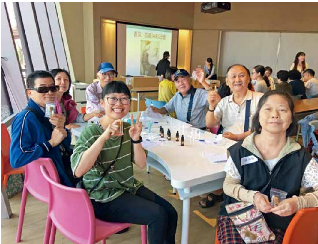
圖 11 「甘榜格南伊斯蘭香水調香體驗」邀請視障團體及民眾共同參與，認識新加坡多元文化。