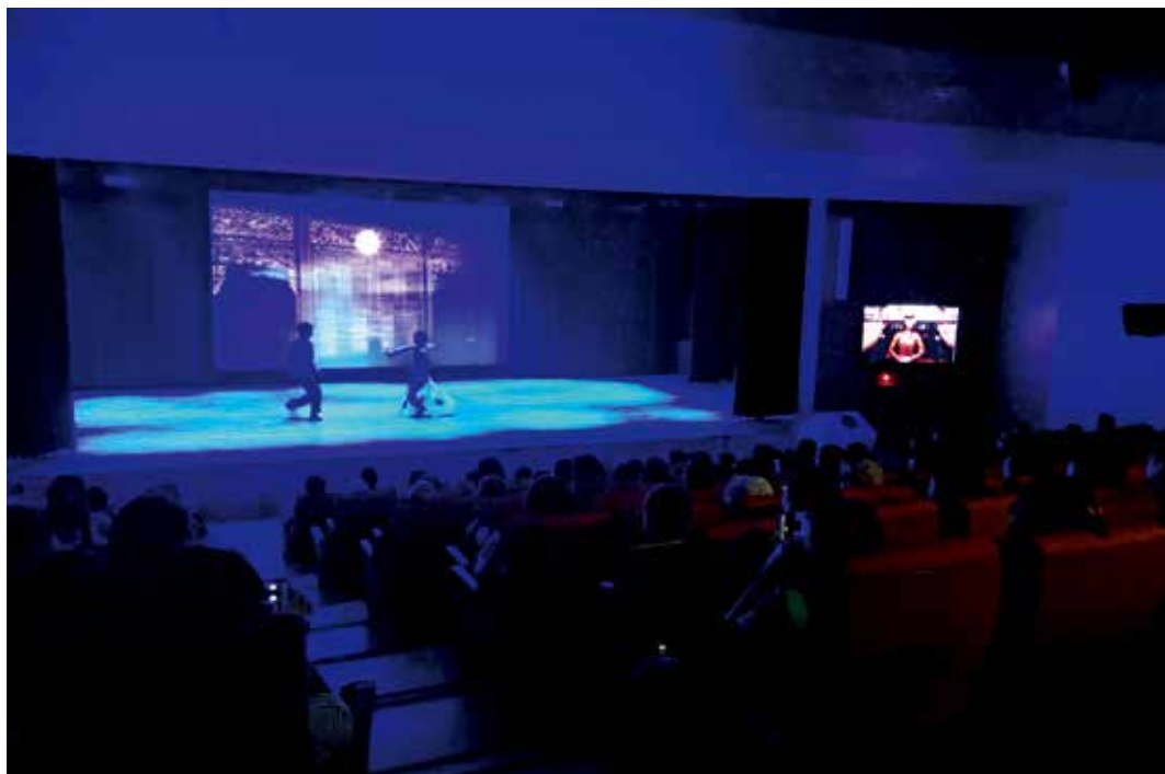
圖7 | 土生華人舞劇《婚禮》於南院集賢廳演出，故事、服裝、背景呈現濃濃的「娘惹風」。

色彩繽紛鮮明的街屋，是典型多元文化的混合體，呈現土生華人將自身傳統與在地馬來、西方殖民文化風格揉合一體、接納開放的態度。（圖8）土生華人街屋可看見傳統中式、飽含吉祥寓意的圖騰（如鳳凰、牡丹、蝙蝠等）、歐式百葉窗及壁柱與馬來式的矮門。本活動特別以此為題，在南院兒童創意中心設計了讓孩子們可動手操作的土生華人建築風格娃娃屋，搭配親子導覽與DIY活動，引領親子觀眾共同探索繽紛多樣的土生華人文化。（圖9）