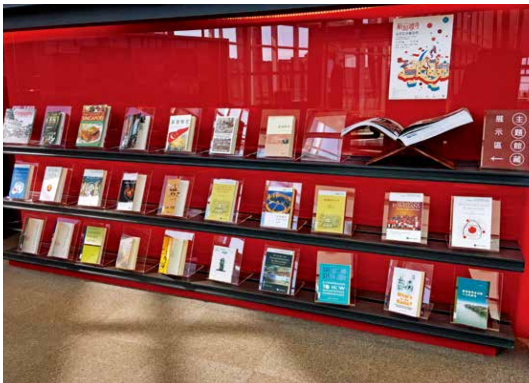
圖13 「故宮亞洲藝術節」每年均配合國家主題選書，並於南院「亞洲藝術文化資料中心」辦理主題書展。

每年國際博物館日均會訂定一個主題，以彰顯博物館界最新關懷的核心議題，如2019年思考「博物館作為文化樞紐——傳統的未來」，2020年預定為「多樣性及包容 (Museums for Diversity and Inclusion)」，2021年「博物館啟發未來 (Museums Inspiring