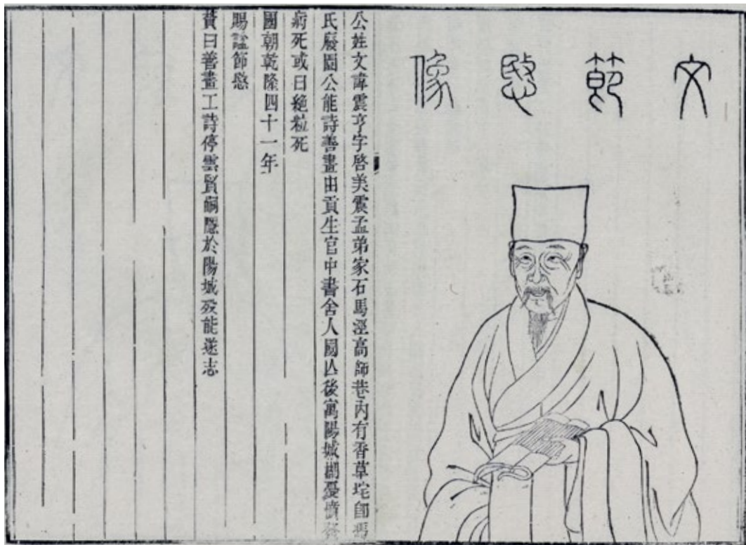
清 顧沅 文震亨像、傳贊 《吳郡名賢圖傳贊》 清道光年間（1820-1850）顧氏家刻本 國立故宮博物院藏