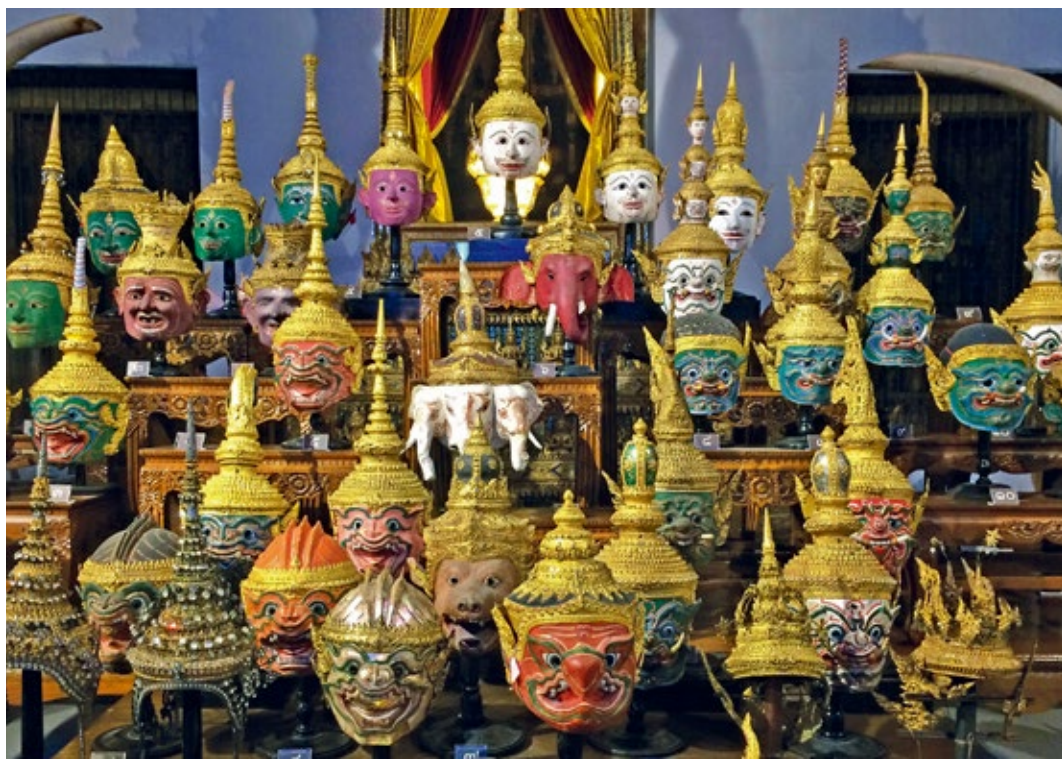
圖 10 | 曼谷國家博物館內展示孔劇《羅摩堅》(Ramakien)中各種角色的面具

織品、衣飾、珠寶、錢幣、樂器、戲偶、孔劇 (Khon masked dance theater, 泰國傳統面具舞劇) 表演用的面具 (圖 10)、兵器、交通工具、皇家禮器與服裝等，透過琳瑯滿目的物件，呈現出泰國文化中更加貼近人們生活的面貌。