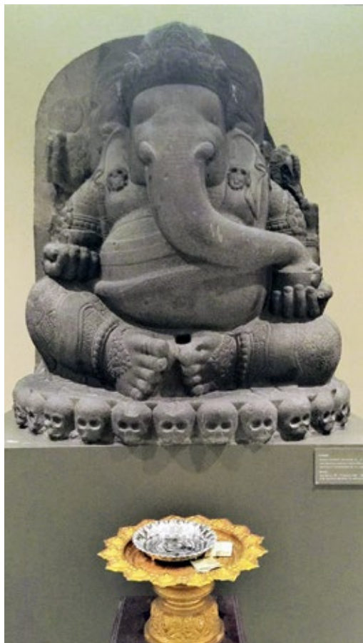
圖 4 1896 年荷屬東印度總督贈予朱拉隆功王的象頭神像，製作年代為 10 至 11 世紀，出土自印尼爪哇信訶沙里神廟，目前典藏與展示於曼谷國家博物館。

1926 年，位於前宮建築群的皇家博物館正式改名為曼谷博物館（Bangkok Museum），開始以國家博物館的身分對公眾開放。1933 年，泰國的藝術司（Fine Arts Department，簡稱 FAD）在歷經多次組織與任務變更後重新成立，主管該國文化遺產保存與博物館事務。1934 年，「古蹟、藝術品、古物與國家博物館法案」（Act on Ancient Monuments, Objects of Art, Antiquities, and National Museums）正式通過，為藝術司提供了基礎法律架構，也規範了國家博物館的營運方式。經過政府