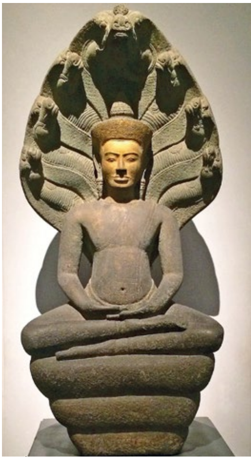
圖7 12世紀 華富里時期 龍王護佛像 曼谷國家博物館藏

室利佛逝（又稱三佛齊）是大約於西元七世紀中葉時發跡於蘇門答臘島東南部的古代王國，主要信仰大乘佛教及印度教，強盛時期曾控制整個馬六甲海峽上的國際海洋貿易，影響力一度擴及今日泰國南部的馬來半島地區，曼谷國家博物館典藏一件來自該國南部猜耶（Chaiya）的九世紀青銅菩薩像（圖6），造型優美自然，具有高度裝飾性，反映出爪哇及蘇門答臘風格的影響，被視為室利佛逝藝術的經典之作，也是該館名聞遐邇的巨星級文物。十一至十二世紀時，由高棉人所建立的吳哥帝國（約九至十五世紀）勢力達到鼎盛，幾乎涵蓋整個東南亞大陸部分，今日泰國的中部、東部及東北部皆曾屬於其勢力範圍，中部的華富里更是當時的統治重鎮。該時期遺留下許多深受高棉藝術影響的佛教及印度教造像與建築（圖7），被稱為華富里風格或泰國古代的高棉風格，是泰國藝術發展中相當重要的一環。 14