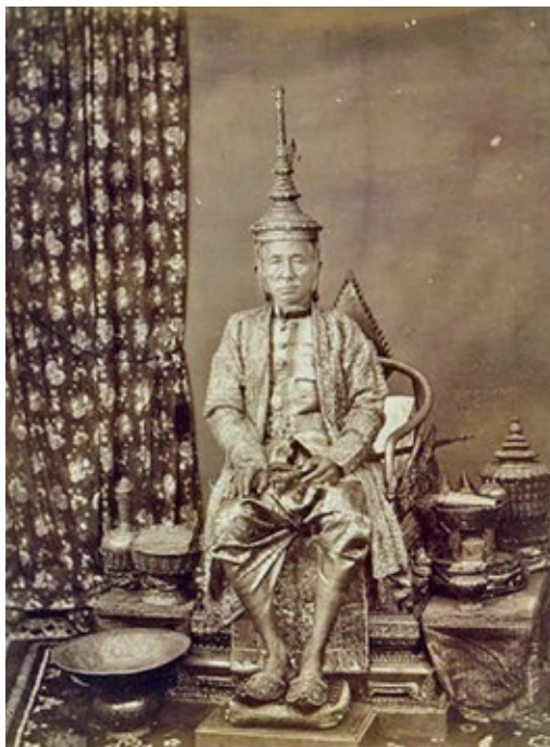
圖2 1851 蒙固王著皇室禮服肖像

泰國博物館事業的萌芽，最早可追溯至卻克里王朝的第四代君主——蒙固王（King Mongkut，1804-1868，在位時間 1851-1868），史稱拉瑪四世（Rama IV）。（圖2）他是拉瑪二世之子、拉瑪三世的異母兄弟，在 1851 年正式繼承王位以前，曾經出家為僧長達二十七年。在蒙固王統治泰國（時稱暹羅）的期間，