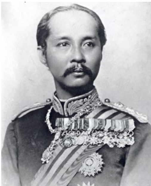
圖3 朱拉隆功王肖像

括大量佛像、歐洲雕塑、中國陶瓷、古董服飾、金銀器物、珠寶配飾、牙雕與木雕、造型奇特的犀牛角及象牙、西方的科學機械裝置，以及其他來自世界各地的珍奇物件。 4 1859年，隨著蒙固王個人收藏的規模日益擴大，他略作整理並在曼谷大皇宮內闢室陳列，這批藏品被稱之為「Phiphitapan」，意指包羅萬象的物件，後來演變為泰語對於「博物館」一詞的翻譯。 5