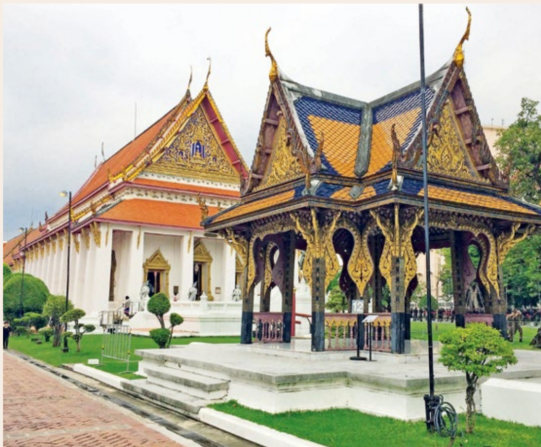
圖1 | 曼谷國家博物館外觀

國立故宮博物院於2019年10月舉辦「故宮亞洲藝術節——泰國月」活動，結合展覽、講座、電影、體驗、表演、市集等，希望透過豐富有趣的方式，推廣泰國的多元文化。博物館，經常是我們認識一個國家歷史軌跡與藝術成就的重要場域，本文淺談泰國曼谷國家博物館的創建歷程、典藏特色與特殊地位，做為探索泰國文化的另一取徑。