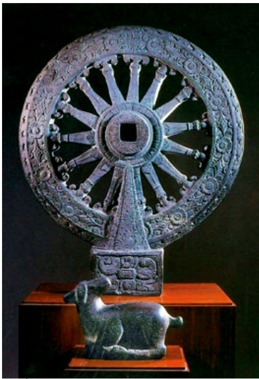
圖5 7~8世紀 墮羅鉢底時期 法輪與臥鹿 泰國佛統出土 曼谷國家博物館藏

組織與相關法律的調整後，曼谷博物館從此歸屬於藝術司管轄，並更改為目前的名稱——「曼谷國家博物館」，負責蒐集、保存與研究古物、藝術品及民族學文物，並向社會大眾進行教育推廣工作。 11 發展至此，這座泰國境內歷史最悠久的博物館，已經從最初的皇家私人收藏與展示，正式轉變為現代國家文化治理機制的一環，持續發揮其展現國家文化榮耀、保存文化遺產，與提升民眾藝文素養的功能。