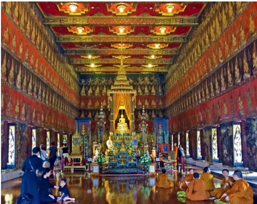
圖 11 | 曼谷國家博物館內的皇家佛殿一隅