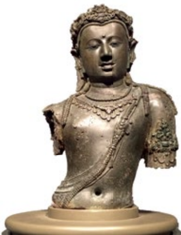
圖6 9世紀 室利佛逝時期 菩薩像 泰國猜耶出土 曼谷國家博物館藏