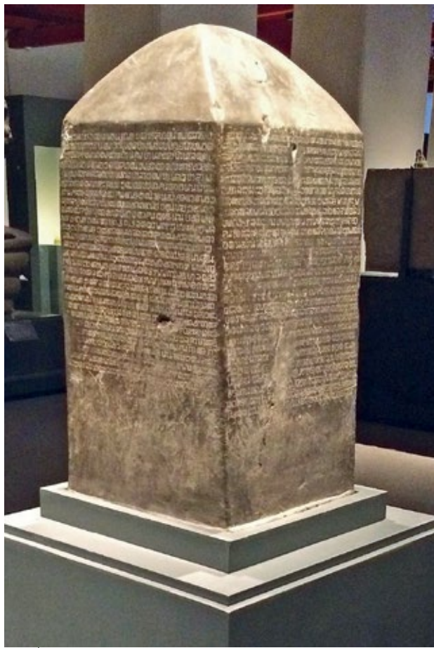
圖8 1292 素可泰時期 蘭甘亨王石碑 泰國素可泰出土 曼谷國家博物館藏

在以宗教造像為主的藝術品與考古文物之外，曼谷國家博物館同時收藏有各式各樣的裝飾工藝及生活器用，這些物件多半與宮廷或寺院文化息息相關；館方則依據不同材質或功能進行展示，其中包括了陶瓷器、琺瑯器、金銀器、漆器、螺鈿工藝、牙雕、石刻、木雕、