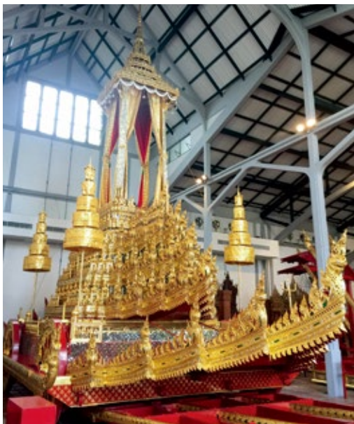
圖 12 | 1795 勝利號皇家靈車 曼谷國家博物館藏

的博物館機構，其中多半屬於西方殖民活動下的產物，唯獨泰國或許因始終保持著相對獨立的地位，且政治統治菁英對於西方文明抱持積極開放的態度，其博物館事業的萌芽與初期發展，遂與該國皇室成員自主性推動有著密切關係。尤其泰國境內歷史最悠久的曼谷國家博物館，藏品源自於十九世紀後期卻克里王朝皇室的珍奇收藏，館舍也屬於皇宮建築群的一部分，該館從皇家私人收藏走向國家文化教育機構，記錄了泰國博物館發展的重大歷程，也可以視為該國由傳統邁入現代社會的一個縮影。