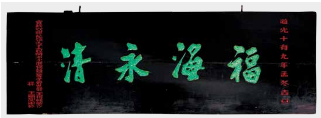
圖 15 「福海永清」匾維護後。