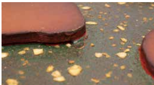
圖 25 「聖慈母德」匾彩繪漆層局部剝離狀況修護前。