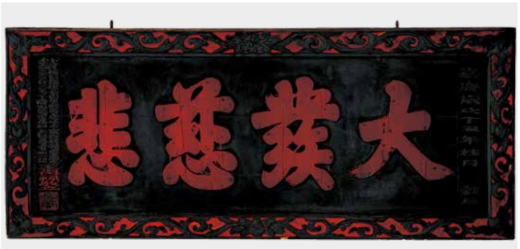
圖12 「大發慈悲」匾修護後。