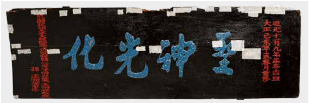
圖16 「聖神光化」匾彩繪漆層及木材蟲蛀狀況暫時性加固處理。(修護前)