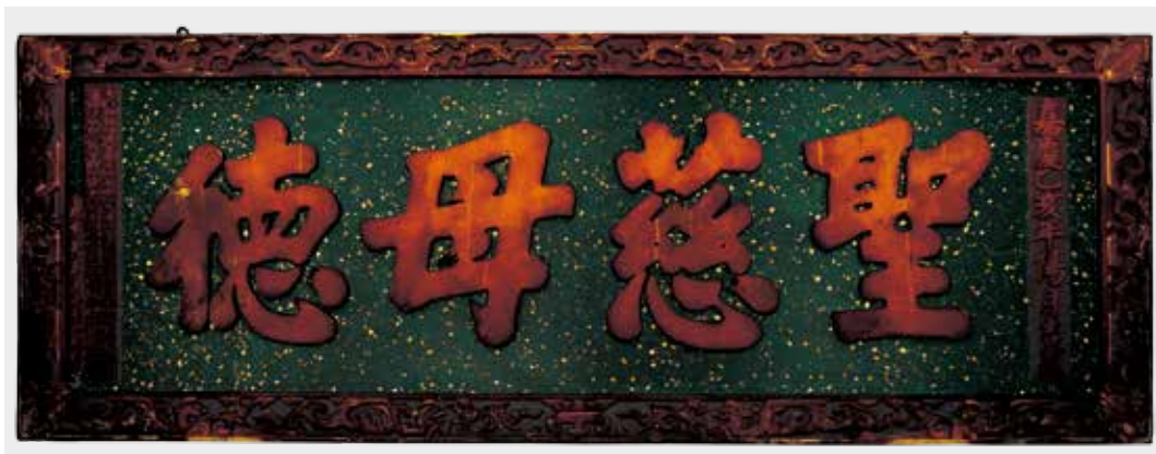
圖 27 「聖慈母德」匾修護後。 作者攝