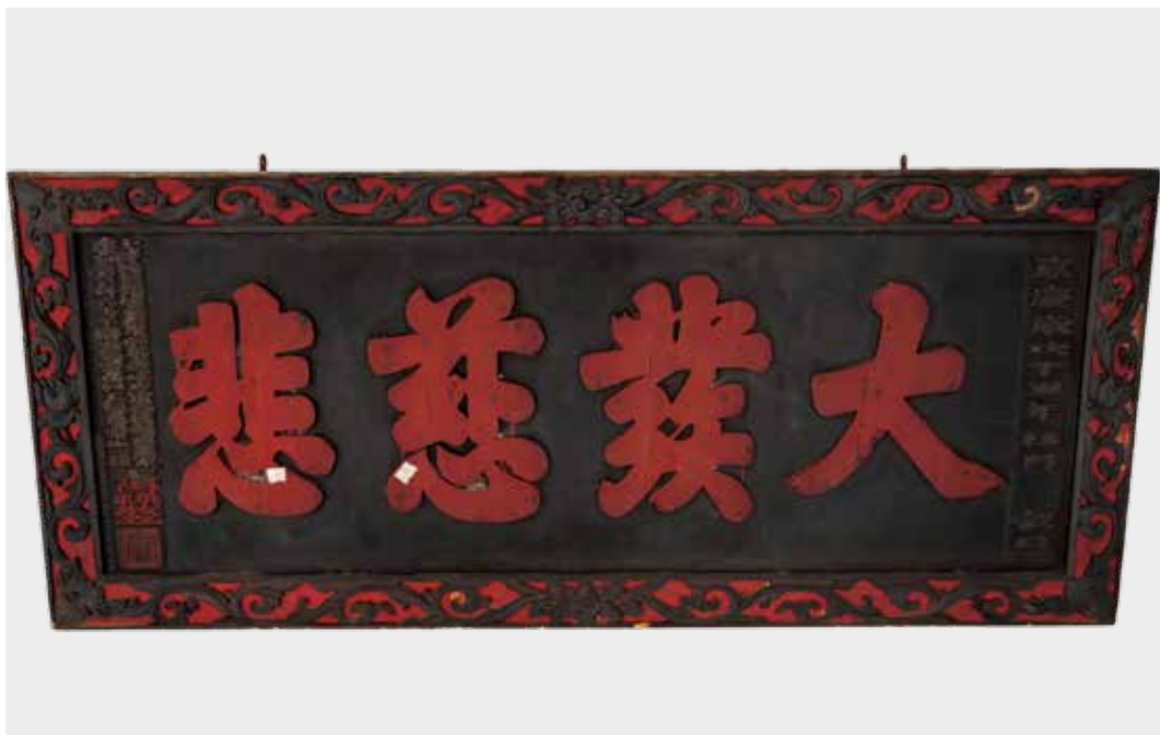
圖6 | 「大發慈悲」匾修護前彩繪漆層暫時性加固處理。