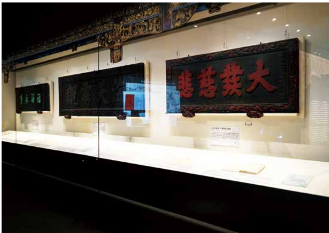
圖1 「蔡牽與王得祿」特展第一檔展出匾額。

展文物進行相關的維護措施，主要包括文物除蟲處理及必要之維護（修護）處理，以確保借展文物於包裝運輸及展出期間的安全，更重要的是透過預防性的除蟲處理確保博物館環境的安全無虞。