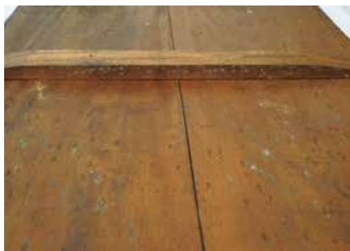
圖 13 「福海永清」匾背面霉斑狀況。(維護前)

一般如果是博物館與博物館之間的借展，通常由相關的典藏維護人員或研究人員評估展品狀況，如對其展出安全性有疑慮時，可能會不同意借出；或者先於館內由館方修護