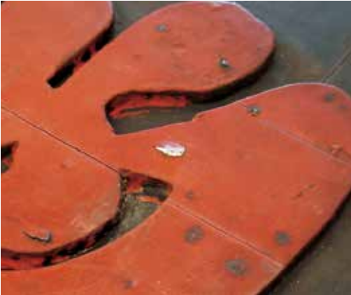
圖10 「悲」字上彩繪層剝離狀況以壓克力乳劑Plextol®D498與玻璃微泡調配的填料進行填充支撐。