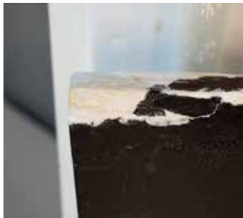
圖20 「聖神光化」匾左上角彩繪漆層及木材蟲蛀狀況修護中。