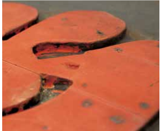
圖11 「悲」字上彩繪層剝離狀況填充支撐後以壓克力顏料全色處理後。