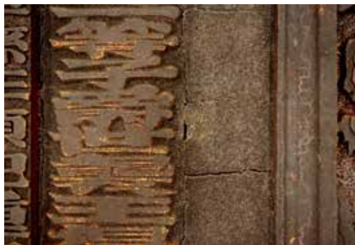
圖4 「海天靈祝」匾漆層剝離部位移除暫時性加固後，進行漆層加固處理。(修護後)