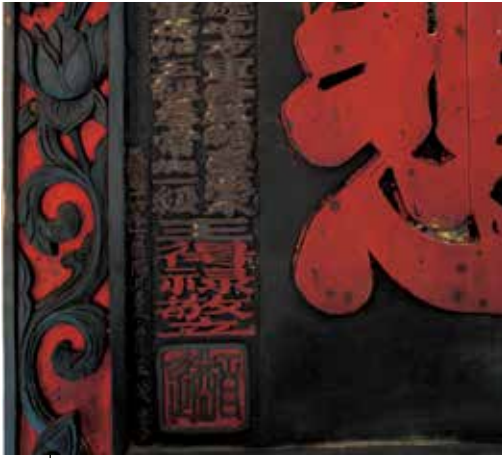
圖8 「悲」字上有土蜂巢泥黏附。(修護前)