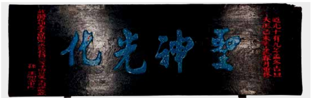
圖22 「聖神光化」匾修護後。作者攝