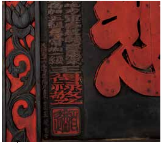
圖9 「悲」字上有土蜂巢泥黏附移除後。