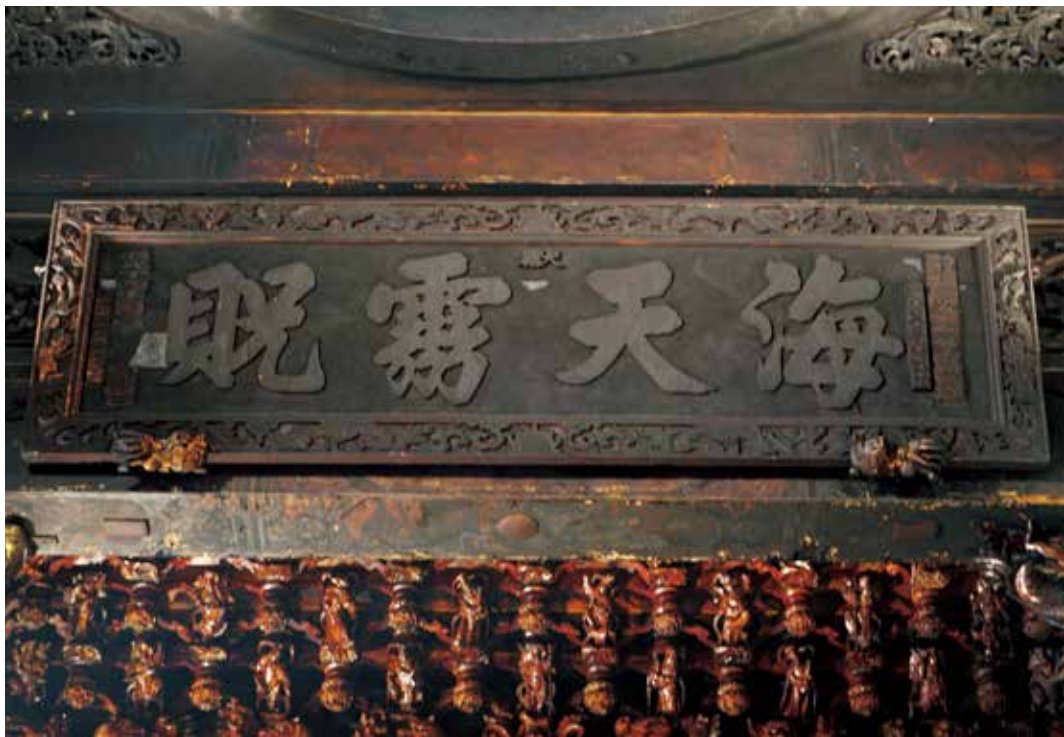
圖2 | 北港朝天宮正殿右側「海天靈祝」匾。