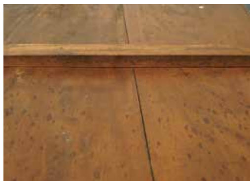
圖 14 「福海永清」匾背面霉斑狀況以 75% 乙醇水溶液移除清潔。(維護後)