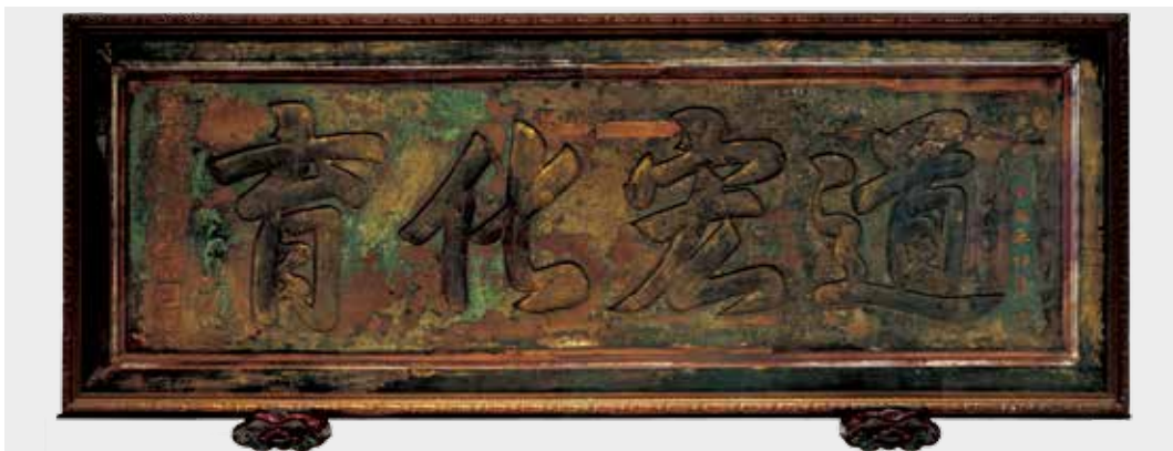
圖 23 「道宏化育」匾前人修補後裝飾有壓克力罩之油畫畫框。(清潔維護後)