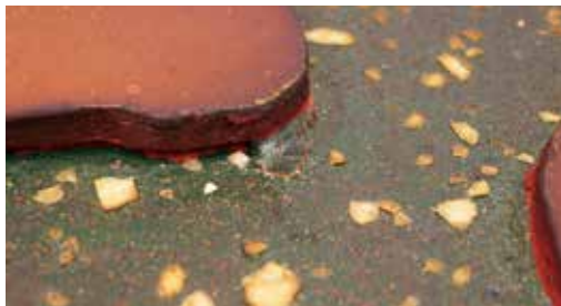
圖 26 「聖慈母德」匾彩繪漆層局部剝離狀況修護後。