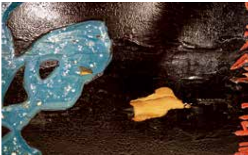
圖17 「聖神光化」匾彩繪漆層及木材蟲蛀狀況修護前。作者攝