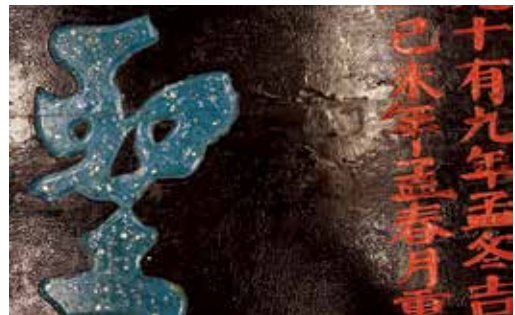
圖18 「聖神光化」匾彩繪漆層及木材蟲蛀狀況修護後。