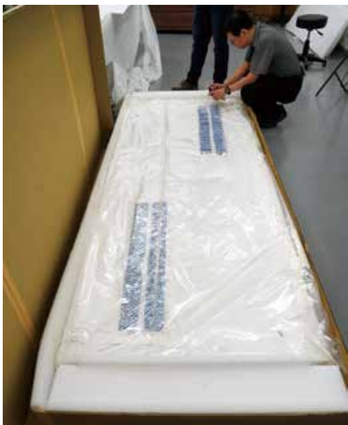
圖 24 「聖慈母德」匾低氧除蟲處理後運送至南院修護室進行後續維護處理。