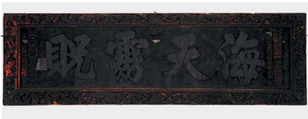
圖5 「海天靈祝」匾維護後。

表面漆層剝離或空鼓狀況，為避免處理過程造成漆層脫落，須先施予暫時性加固處理。處理方式為使用長纖維皮料紙覆於加固部位，再於其上面輕刷 1% 甲基纖維素 (Methyl cellulose) 溶液，待乾後方能繼續執行後續處理步驟。