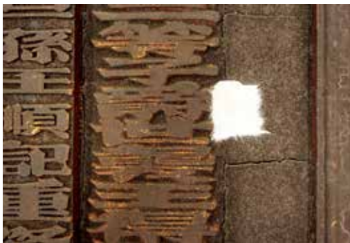
圖3 「海天靈祝」匾漆層剝離部位暫時性加固處理。(修護前)