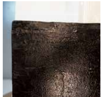
圖21 「聖神光化」匾左上角彩繪漆層及木材蟲蛀狀況修護後。