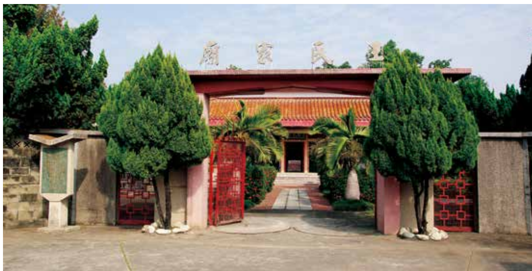
圖 9 王家廟入口處景況。

王氏家族在地方上本就有相當的影響力，更遑論王得祿任要職後成為清代臺籍官員中獲最高榮銜者，太子太保之名廣為人知，更加拓展了王家的影響力，甚至太保之名後來還成取代了其故鄉的原名。而王得祿兄長王得嘉為貢生，王家後人亦是各有專精，於政