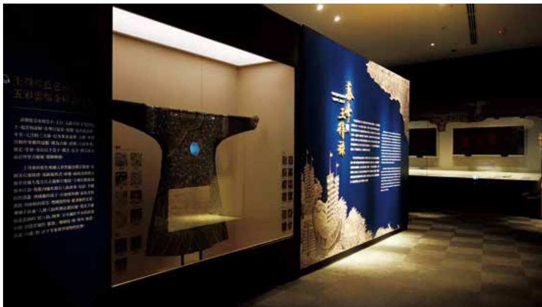
圖3 「蔡牽與王得祿」特展中展示的王得祿袍服與海洋意象的總說明牆。

而自2019年7月25日至2020年2月10日，於故宮南院S302展廳所推出「蔡牽與王得祿」特展，在兩個檔期的展覽當中，匯聚了故宮典藏王得祿與蔡牽兩位歷史人物相關的清代善本古籍、檔案奏摺，更有王氏家族所藏的珍稀王得祿袍服、嘉慶朝誥封王得祿曾祖父母誥命（滿漢文書）（以下簡稱「五