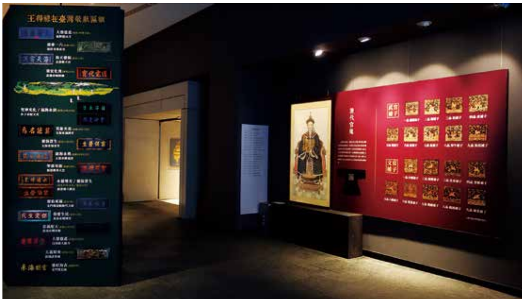
圖4 「蔡牽與王得祿」特展展場一隅，策展人詳細的介紹了王得祿歷年贈匾之分佈情況及清代官服補子樣貌。

色誥命」)，及部分臺灣寺廟內現存珍貴的王得祿捐贈匾額等文物。當中的亮點，莫過於首次進入故宮展示的王得祿家族之誥命，及已多次配合本院展示的王得祿冬季蟒袍等。這些文物本是家族歷代典守的珍寶，現則藉由故宮這個開放博物館場域，共同呈現臺灣歷史的吉光片羽，可謂是故宮與地方對話難得的嘗試成果。（圖3、4）