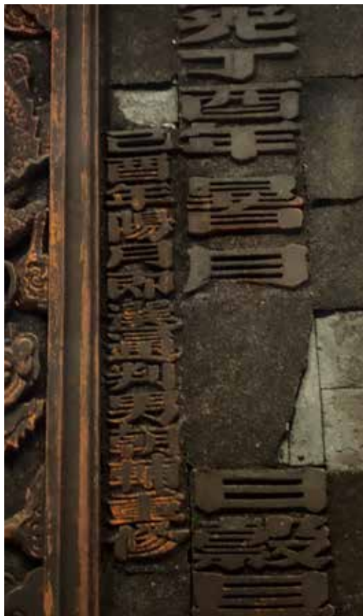
圖 13 | 《海天靈脫》匾左側之「己酉年陽月即選通判男朝輔重修」字樣。

嘉義玉山鐘秀，地靈人傑，為開臺媽祖天后聖母顯聖跡揚名譽聖地，為先賢顏思齊拓殖葬身之處，為鄭氏父子移民開墾營盤故……太子太保王得祿，高官顯爵之鄉，由山川靈氣所鐘，代出聖賢，理所必然。 3