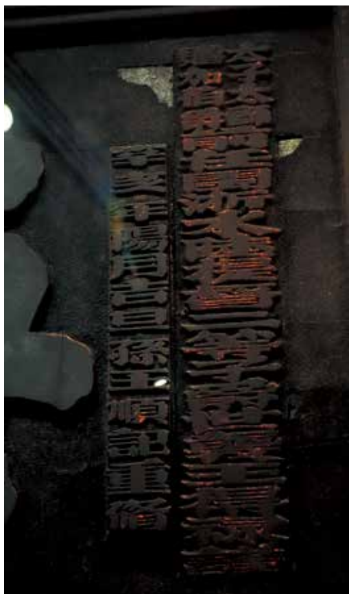
圖 14 《海天靈祝》右側之「辛亥年陽月吉旦孫王順記重修」字樣