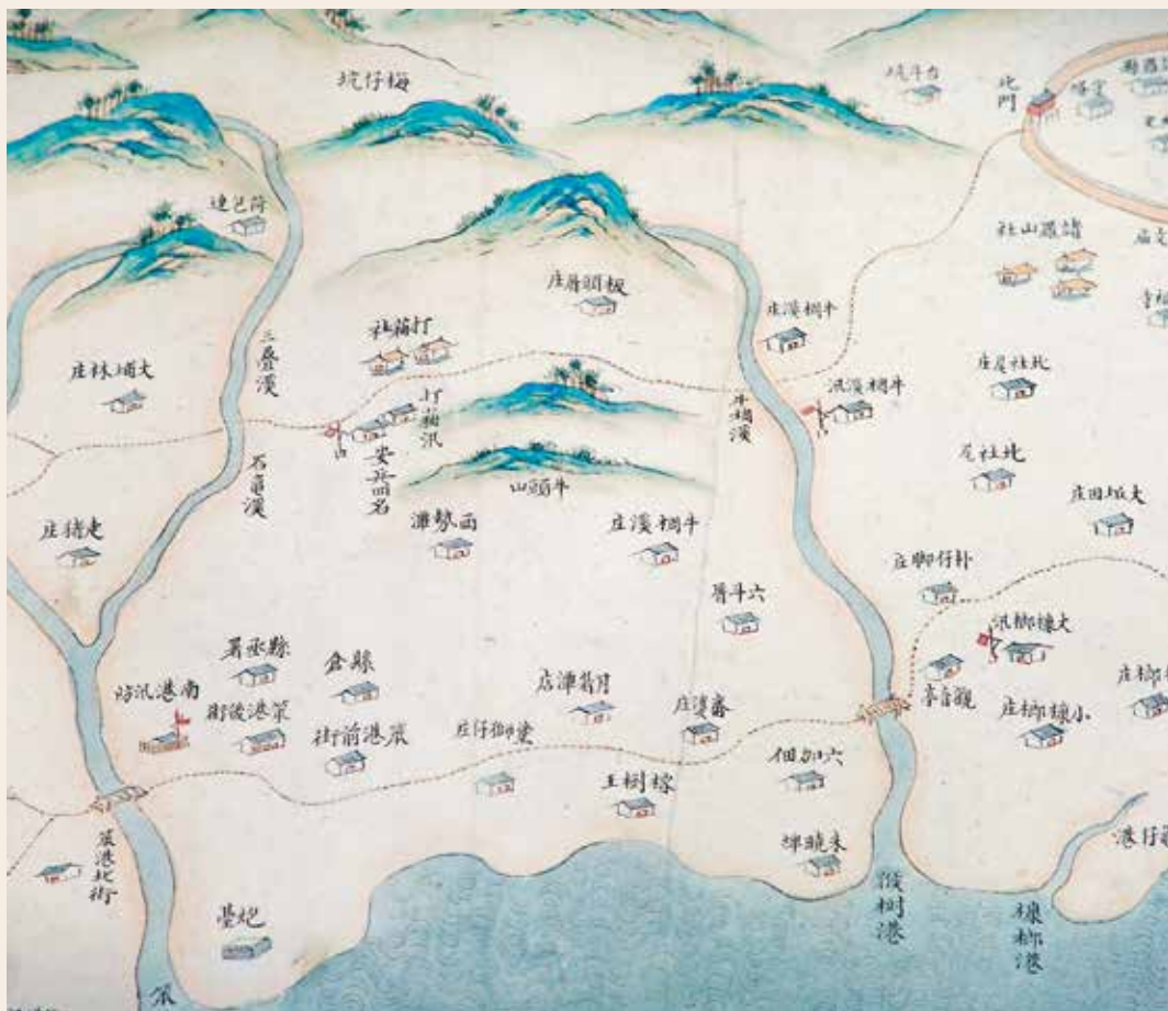
圖1 | 清 乾隆朝 臺灣地圖 國立故宮博物院藏 平圖020795 嘉義為王得祿的故鄉，亦是現今故宮南院的所在地。

因緣際會獲自宮廷頒贈的貴重賞賜，對於受賞家族的早期成員而言，係以作為見證風華榮耀的重要象徵而予以珍藏，並由各代子孫透過繼承，持續珍管以延續家族記憶。過往，這些物件多僅在先祖的重要祭典或是新年節慶方得以一見，其餘時刻多深藏於秘密之處。然隨大環境的改變，這些獲賞珍品被添附了作為見證臺灣歷史的象徵，在各式重要公共活動內，甚至於博物館這個場域內，得以呈現更多元的意義。