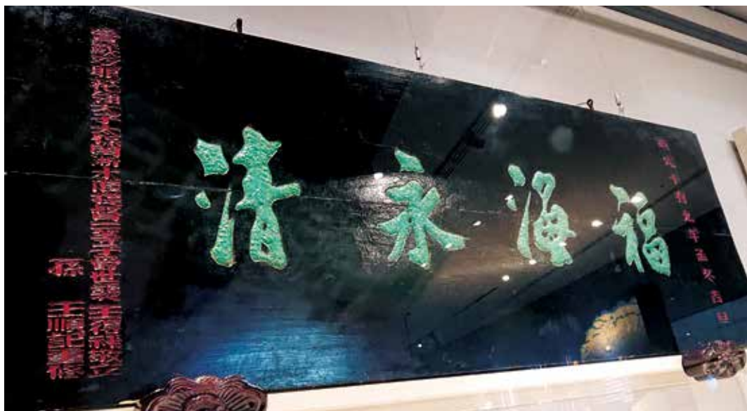
圖 15 《福海永清》匾左下方之「孫 王順記重修」刻文。