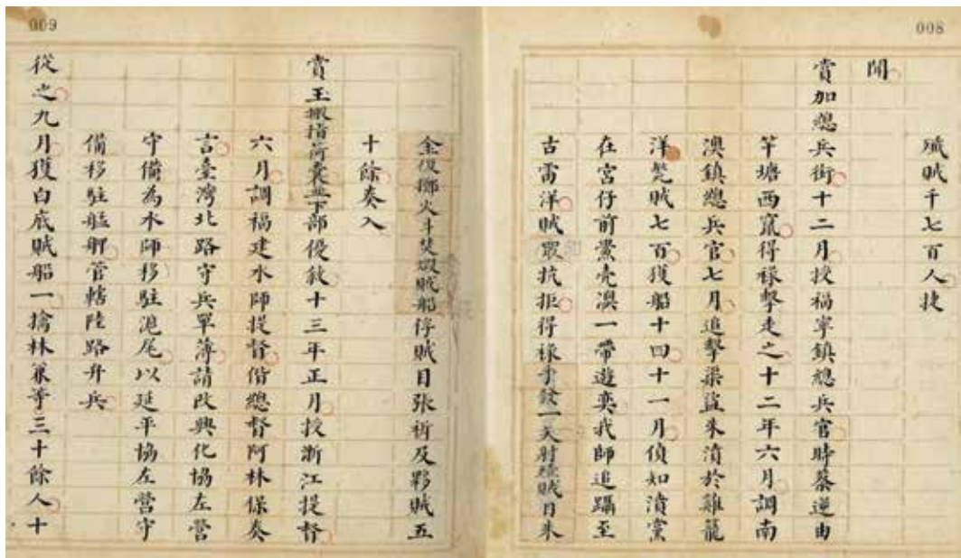
圖8 清 李道生纂輯，倉景恬覆輯 王得祿列傳 清國史館本 國立故宮博物院藏 故傳001838