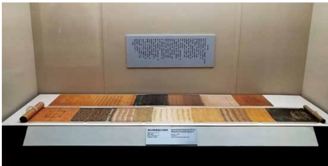
圖6 五色誥命於「蔡牽與王得祿」特展內展示樣貌。