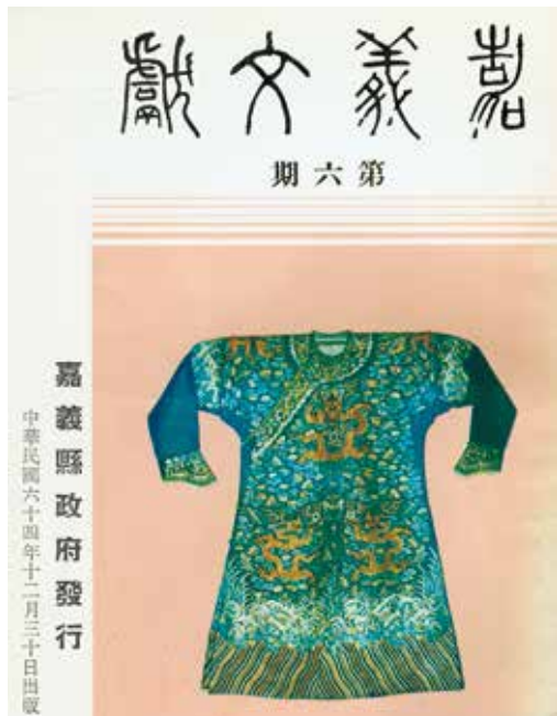
圖10 | 以王得祿袍服為封面的《嘉義文獻》第六期。 作者翻攝

故王得祿嘉義廳太保庄人。前清嘉慶時。閩浙海盜猖獗。王由軍功歷陞太子太保。晉受子爵。召見時，荷蒙優渥。御賜皇家物甚多。臺南市內總爺街王乞食者。是其六世孫也。某母某氏女耐苦孀居。珍藏數件。雖糊口無資。不忍提出變賣。同市北勢街某甲與有親誼。時常周給之。素酷愛珍奇。此次提出以備玩賞。一磁器五龍瓶。地淡紺色。將近篆化。繪有五爪青龍。中燦無數靈芝草。鑄有文字。係大明嘉靖皇帝御瓶。一三龍碗。碗內青龍