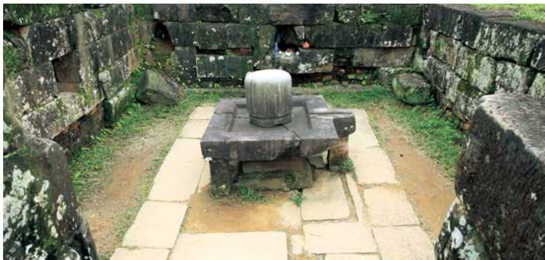
圖 1 | 越南美山（My Son）遺址B1神廟中心的石製林迦祭壇