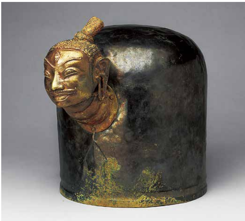
越南 占婆王朝 10世紀 林迦罩 金銀合金（濕婆頭像）、銀（罩體） 總高29.5公分；罩體徑24公分 國立故宮博物院藏