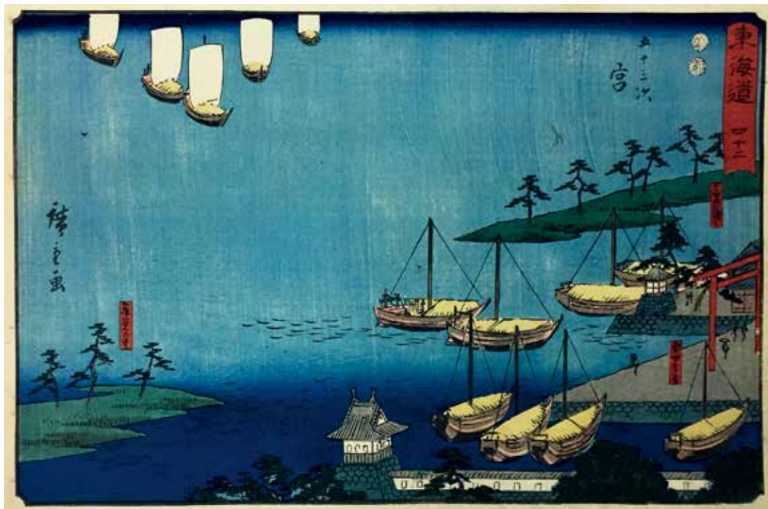
圖6 | 1847 歌川廣重 隸書版 東海道 四十二 五十三次 宮 南購畫0052 國立故宮博物院藏