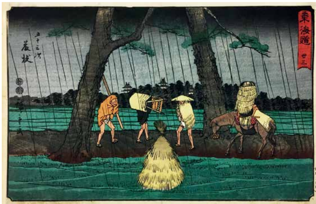
圖4 1847 歌川廣重 隸書版 東海道 廿三 五十三次 藤枝 南購畫0033 國立故宮博物院藏