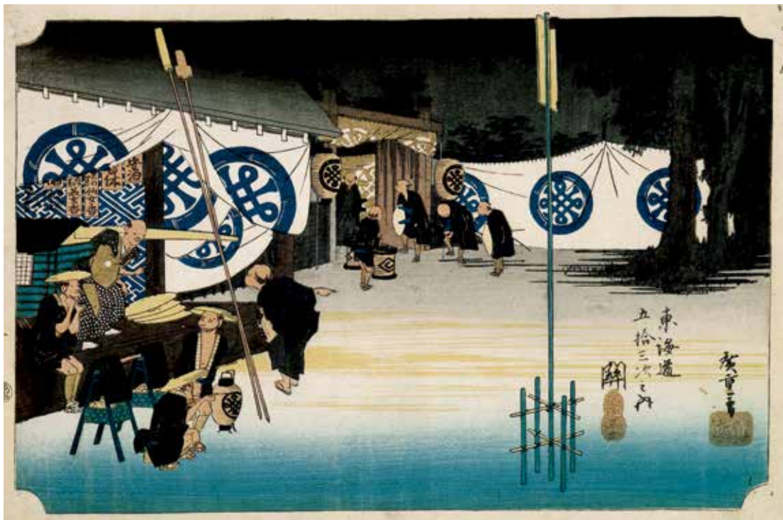
圖 10 | 1833~1834 歌川廣重 保永堂版 東海道五拾三次之内 關 本陣早立 東海銀行貨幣資料館藏

東海道旅行的交通方式，以步行為大宗，身分較高或富有者也有騎馬或搭坐駕籠。值得一提的是過河的方式，在「隸書版東海道」中，有許多渡河的場景，除了搭船過河外，「嶋田宿」（圖 12）附近的大井川，德川幕府因為軍事因素，不設橋也不設擺渡口，要過河只能僱請過河卒，旅客由「過河卒」或扛或揸，人、貨或駕籠也可以用特殊台架渡河，不同渡河方式或不同水深，亦有不同的收費標準。 6