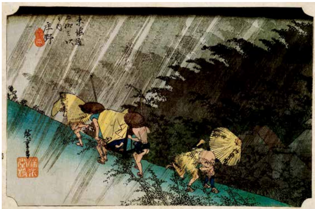
圖3 1833~1834 歌川廣重 保永堂版 東海道五拾三次之内 庄野 白雨 東海銀行貨幣資料館藏 取自日本アート・センター編集，《名品揃物浮世絵廣重III》，東京：ぎょうせい，1991，圖版46。