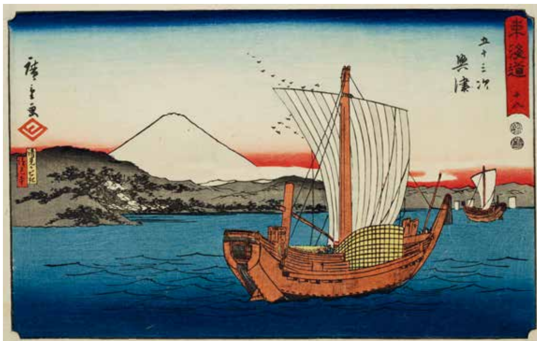
圖5 | 1847 歌川廣重 隸書版 東海道 十八 五十三次 興津 南購畫0028 國立故宮博物院藏