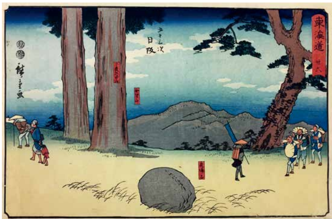
圖8 | 1847 歌川廣重 隸書版 東海道 廿六 五十三次 日辰 南購畫0030 國立故宮博物院藏