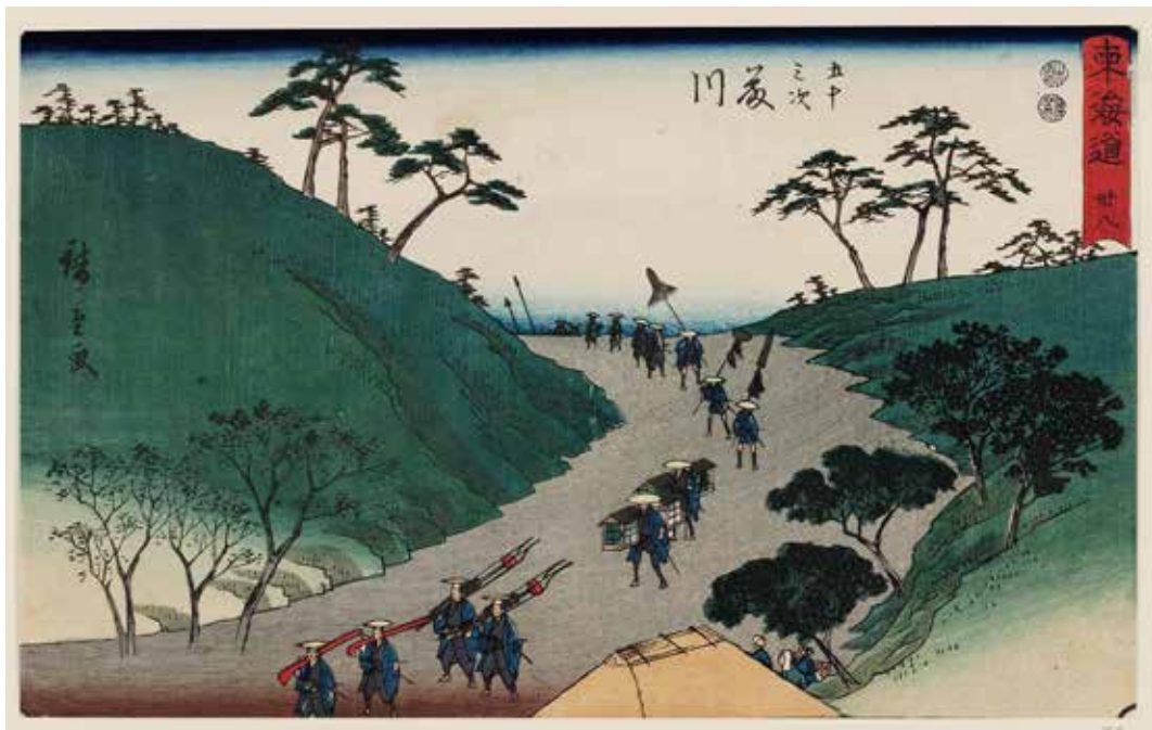
圖7 1847 歌川廣重 隸書版 東海道 卅八 五十三次 藤川 波士頓美術館藏

然而，東海道路上並非一路平安，常有強盜情事發生，〈東海道 廿六 五十三次日坂〉（圖8）畫面中間的「夜泣石」就是傳說有位孕婦夜間趕路遇害，而化為石頭，因思念其嬰兒，每晚都會聽到哭泣聲自石頭中傳出。而提到摸黑趕路，就不得不提〈東海道 十一 五十三次 箱根〉（圖9）畫面行旅七人集中在左下角，一行人在陡峭的山路由下往行走，有兩人手持「松明火把」在隊伍前頭和中間提供照明，兩個轎夫扛著駕籠，駕籠中坐著一身份較高的商人或武士，隊伍後方另有一人挑著貨物。畫中描繪的可能是約在凌晨四點時離開，翻過箱根山的情景，而非真的夜間趕路。歌川廣重將「夜泣