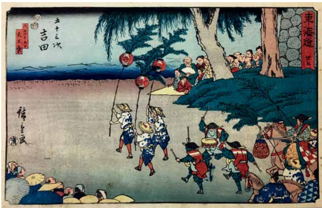
圖 15 | 1847 歌川廣重 隸書版 東海道 卅五 五十三次 吉田 南購畫0045 國立故宮博物院藏