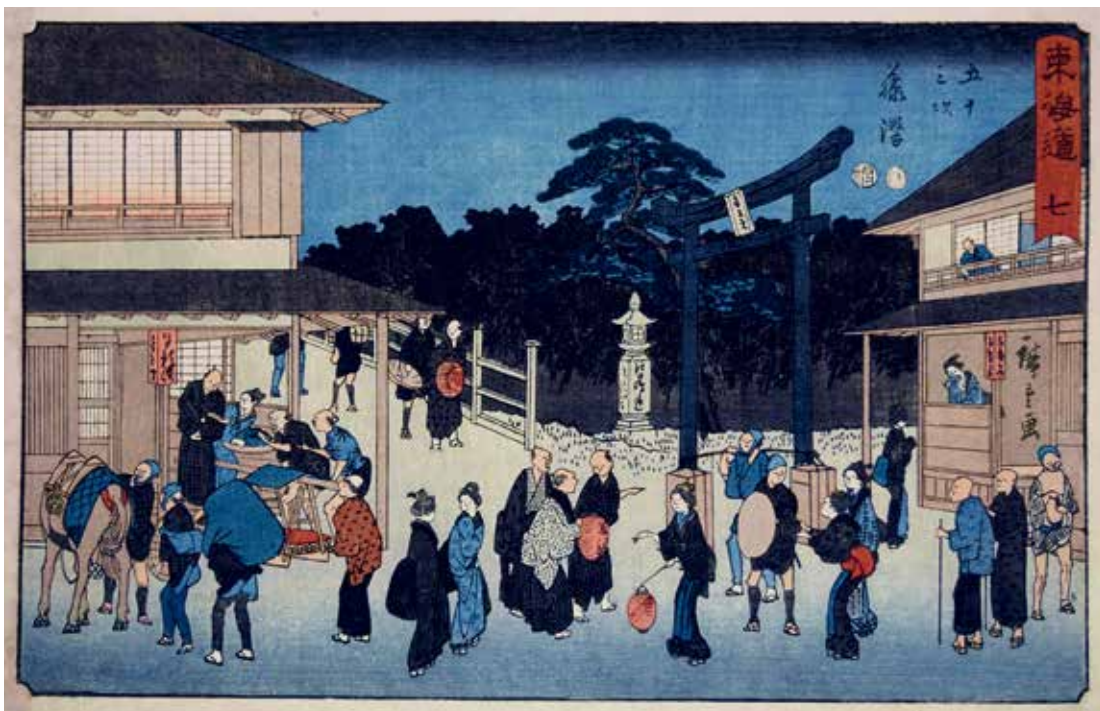
圖 11 | 1847 歌川廣重 隸書版 東海道 七 五十三次 藤澤 南購畫0017 國立故宮博物院藏