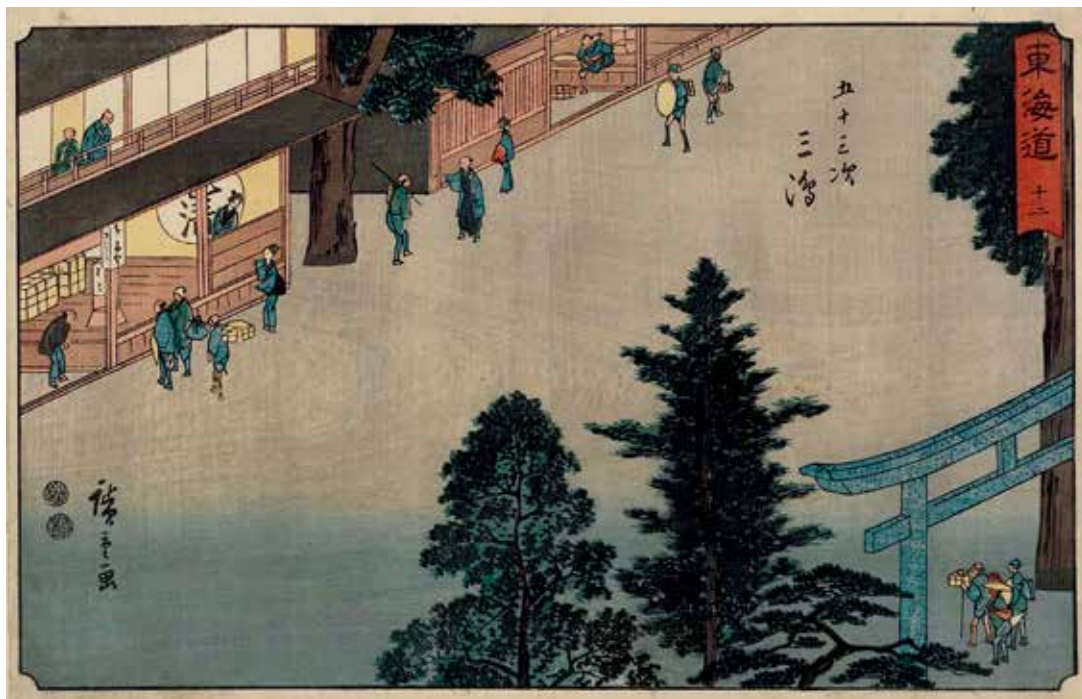
圖 13 1847年 歌川廣重 隸書版 東海道 十二 五十三次 三島 波士頓美術館藏

除了前述事物外，「隸書版」也有許多呈現地方特色的作品，例如〈東海道 廿八 五十三次 袋井〉（圖 14）中的風箏，可追溯日本戰國時代用於測量敵陣或秘密通信的「橫須賀風箏」，今日袋井每年二月仍舉辦「遠州橫須賀放風箏大賽」。另外，〈東海道 卅五 五十三次 吉田〉（圖 15）是本作唯一描繪祭典的一幅，畫中的「六月十五日天王