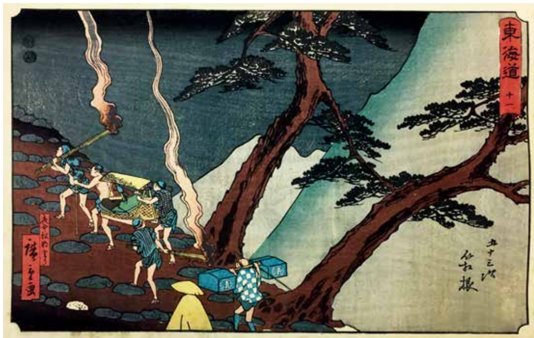
圖9 | 1847 歌川廣重 隸書版 東海道 十一 五十三次 箱根 南購畫0021 國立故宮博物院藏