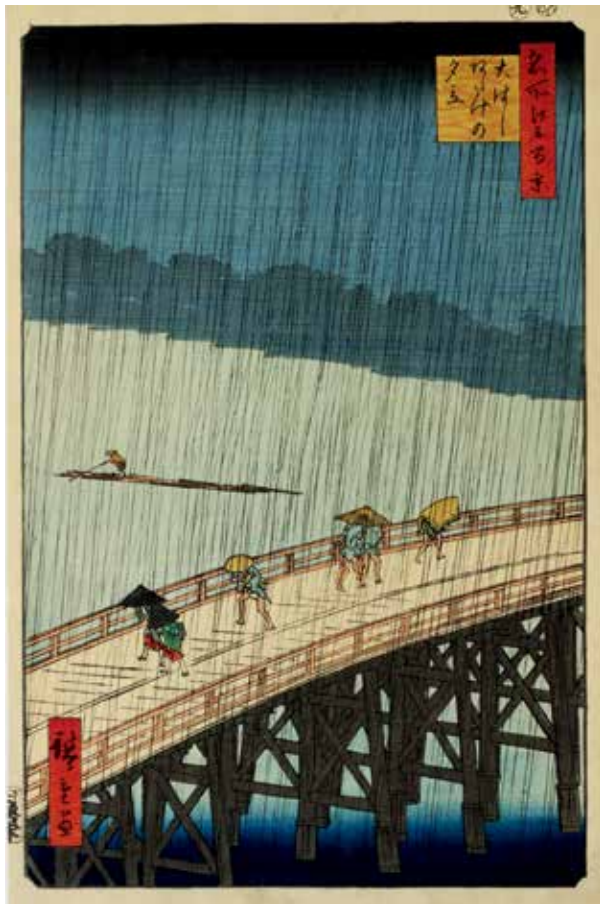
圖2 1857 歌川廣重 名所江戶百景 大橋安宅驟雨 南購畫0068 國立故宮博物院藏

隸書版《東海道五十三次》，於弘化四年（1847），由丸屋清次郎經營的「壽鶴堂」發行販賣，故此版本又稱「丸清版東海道」。歌川廣重最著名的就是在版畫中表現自然天氣，因梵谷臨摹而舉世聞名的〈名所江戶百景 大橋安宅驟雨〉（圖2）便是代表，隅田川對岸的安宅町籠罩在一片迷濛中，橋上的行人因為突然的驟雨而紛紛撐起傘、拉起蓑衣，自橋中央向兩側加速離去。河面上則有船夫搖著小舟經過。除人物和雨絲是動態外，其餘的景物都在廣重的安排下，顯得穩定而安靜。全作呈現出動與靜的對比，背景的藍則和橋面的黃形成對比，最後再將這些對比用細刻的雨絲和天空暈染的氤暈之氣，將整幅畫作統合在一片朦朧中。正因擅於描繪天氣，歌川廣重有「霧、雪、雨、風之繪師」的稱號，在「保永堂版」中，共有七幅描繪天氣，其中保永堂版〈東海道五拾三次之內 庄野 白雨〉（圖3）以疏密不同的斜線表現