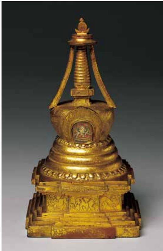
銅鎏金尊勝佛塔（塔高 19.7 公分，寬 11.1 公分）

嚴城（毗舍離）思量壽處所造之塔，是指阿舍、涅槃等經典提及佛在毗舍離城允諾魔王波旬的請求，於三個月後入涅槃的事迹。這組作品原貯放於承德避暑山莊，不僅說明蒙古在藏傳佛教傳播中所扮演的角色，尊勝佛塔與《五福德經》的組合更充分展現皇家祈求福慧長壽的信仰特色。