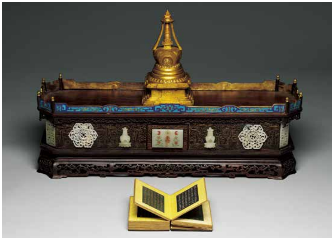
清 銅鎏金尊勝佛塔、《五福德經》玉冊頁及嵌玉木座 國立故宮博物院藏 中銅 002012

一世哲布尊丹巴（1635-1723），俗名札那巴札爾，不僅是宗教家同時是一位重要的藝術家，開創蒙古金銅造像的典範，稱為札那巴札爾風格，康熙三十年（1691）之後他長駐北京，與皇室往來甚密。（宋）法賢譯《八大靈塔名號經》記載尊勝塔是紀念釋迦在廣