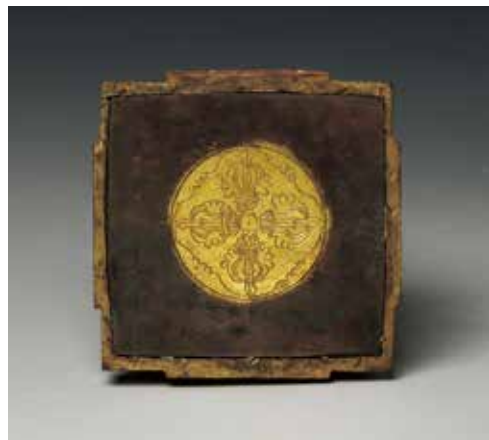
銅鎏金尊勝佛塔（底部）