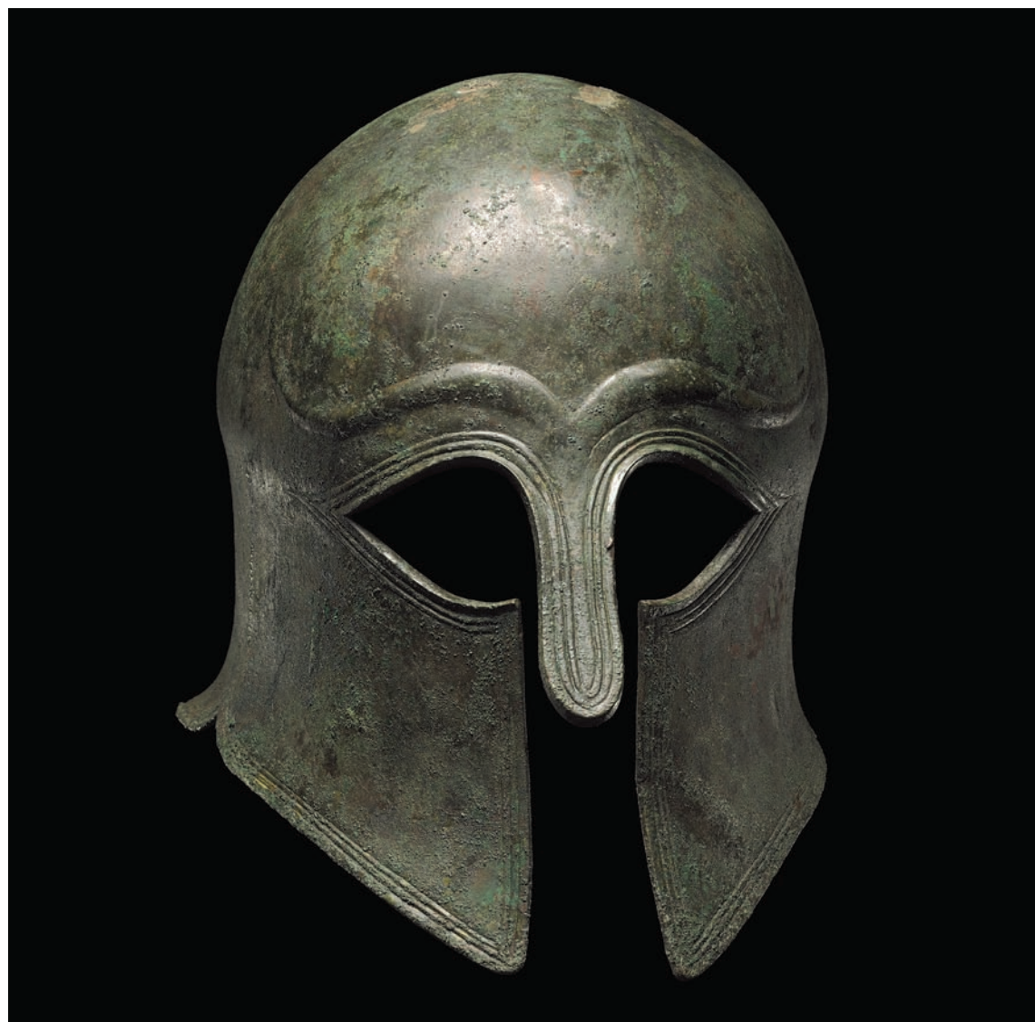
柯林斯式青銅頭盔 約西元前510年希臘時期 250×190×285 mm GR 1865,0722.1 (Bronze 2838)

柯林斯式(Corinthian)頭盔可覆蓋配戴者大部分的臉龐，發揮最大範圍的保護作用。在西元前六世紀的希臘，參與戰爭者包括稱作「甲兵(hoplite)」的重裝備戰士，徒步進行近距離作戰。此一狀似面具的哥林斯式頭盔不僅能保護戰士的臉，亦可遮蓋容貌，使其失去人性。