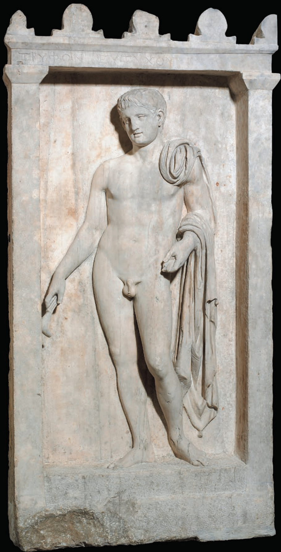
彭特利大理石墓碑浮雕 西元前四世紀希臘時期 頭部重刻於西元一世紀早期 1790 × 895 × 265 mm GR 1839,1102.1 (Sculpture 626)