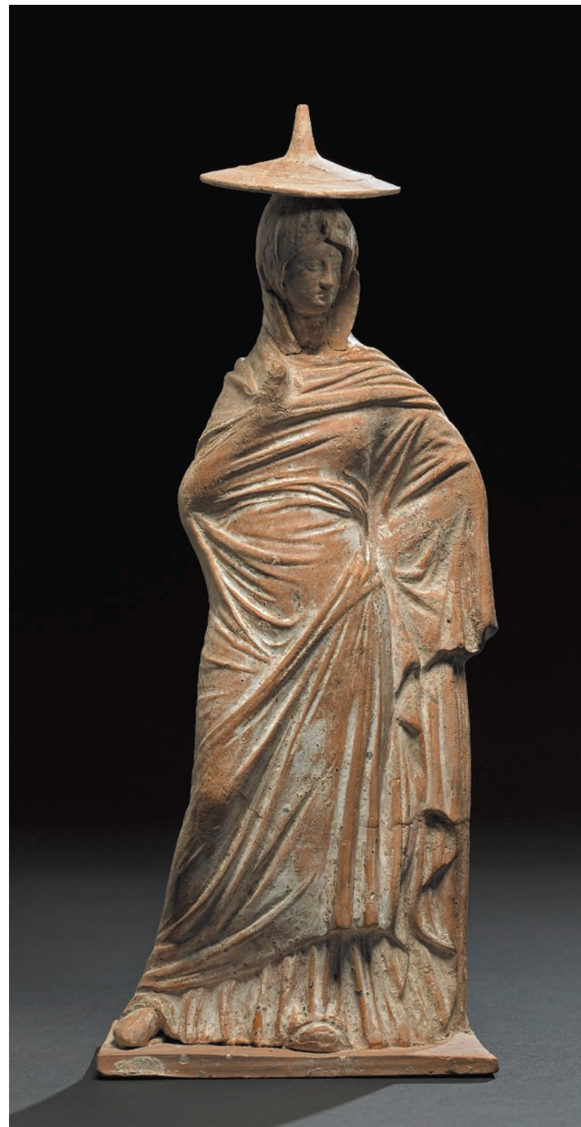
女性赤陶塑像 西元前300至200年希臘時期 (或更晚) 280×110×70 mm (height incl. mount) GR 1875.1012.9 (Terracotta 2047)

女性赤陶塑像 古希臘女子雖多足不出戶，富裕女性仍可伺機參與宗教慶典活動，或出席家族喪葬儀式。類此場合正使她們有盛裝打扮的機會。此座赤陶塑像女子身著長袍披肩，頭部罩以幔布，