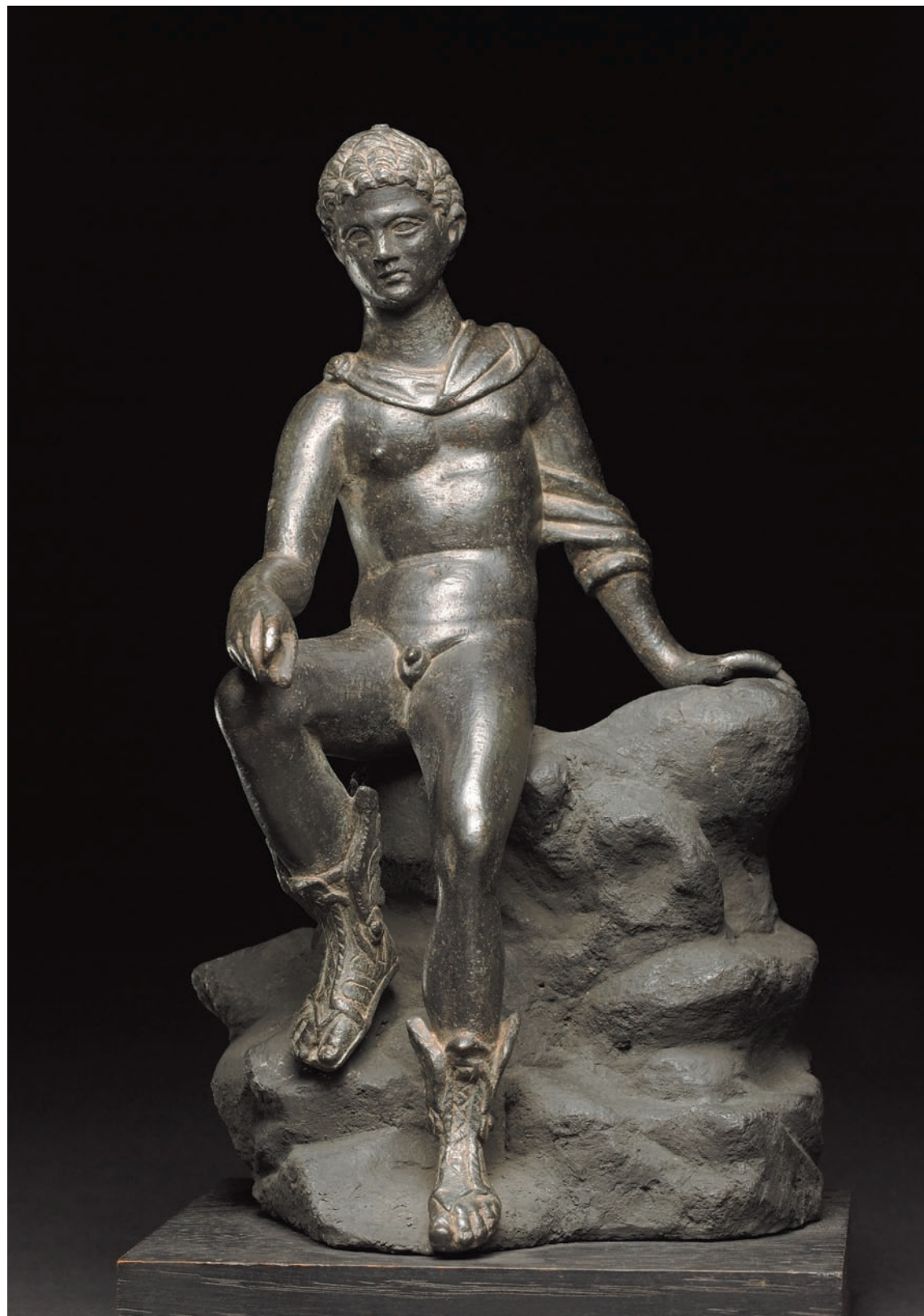
墨丘利青銅小雕像 西元一世紀羅馬時期 215×130×117 mm GR 1772.0302.41 (Bronze 1220)

彭特利大理石墓碑浮雕 此座墓碑浮雕中的青年全身赤裸，僅於左臂與左肩覆蓋披風。他手持刮身板 (strigil)，可見其運動員身分。浮雕為典型的希臘墓穴雕刻作品，刻畫一位被時光凍結的俊美男子。