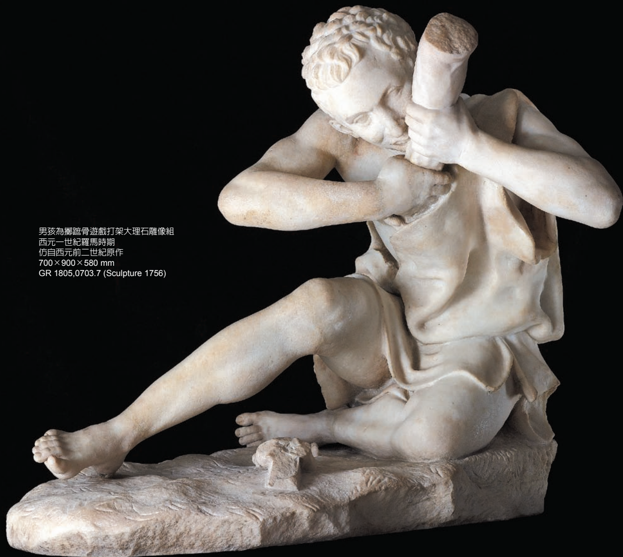
男孩為擲蹠骨遊戲打架大理石雕像組 西元一世紀羅馬時期 仿自西元前二世紀原作 700 × 900 × 580 mm GR 1805,0703.7 (Sculpture 1756)

愛芙羅黛蒂帕羅斯大理石雕像 約莫西元前三百六十年，位於土耳其西南部的希臘城市克尼多斯 (Knidos) 購入一座由雕刻家普拉克西特利斯 (Praxiteles) 所作之女神愛芙羅黛蒂 (Aphrodite) 裸體雕像，並將之置於城內神殿，繼而成爲熱門遊觀景點，亦曾激發許多仿製與改造作品。此處，正欲寬衣沐浴的愛芙羅黛蒂令觀衆有身爲偷窺者之感，好似自己使之受到驚嚇。下巴小凸出物顯示女神或會抬手，以指尖觸摸臉龐。