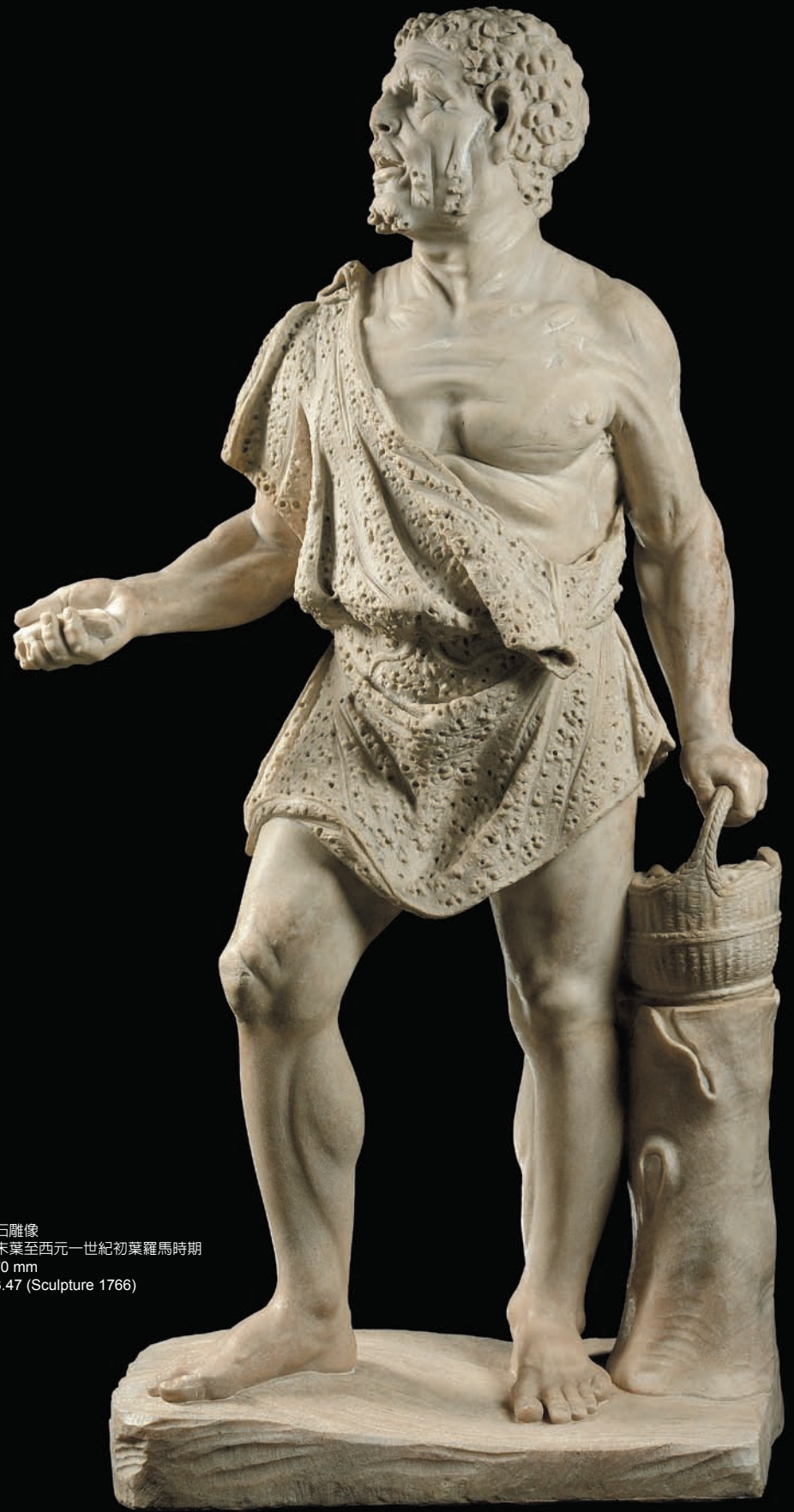
漁夫販貨大理石雕像 西元前一世紀末葉至西元一世紀初葉羅馬時期 840 × 420 × 270 mm GR 1805.0703.47 (Sculpture 1766)

活貼近大自然。他張嘴叫賣，似在推銷手中的魚；另一隻手則握持盛有鰻魚、牡蠣，以及其他小魚的籃子。