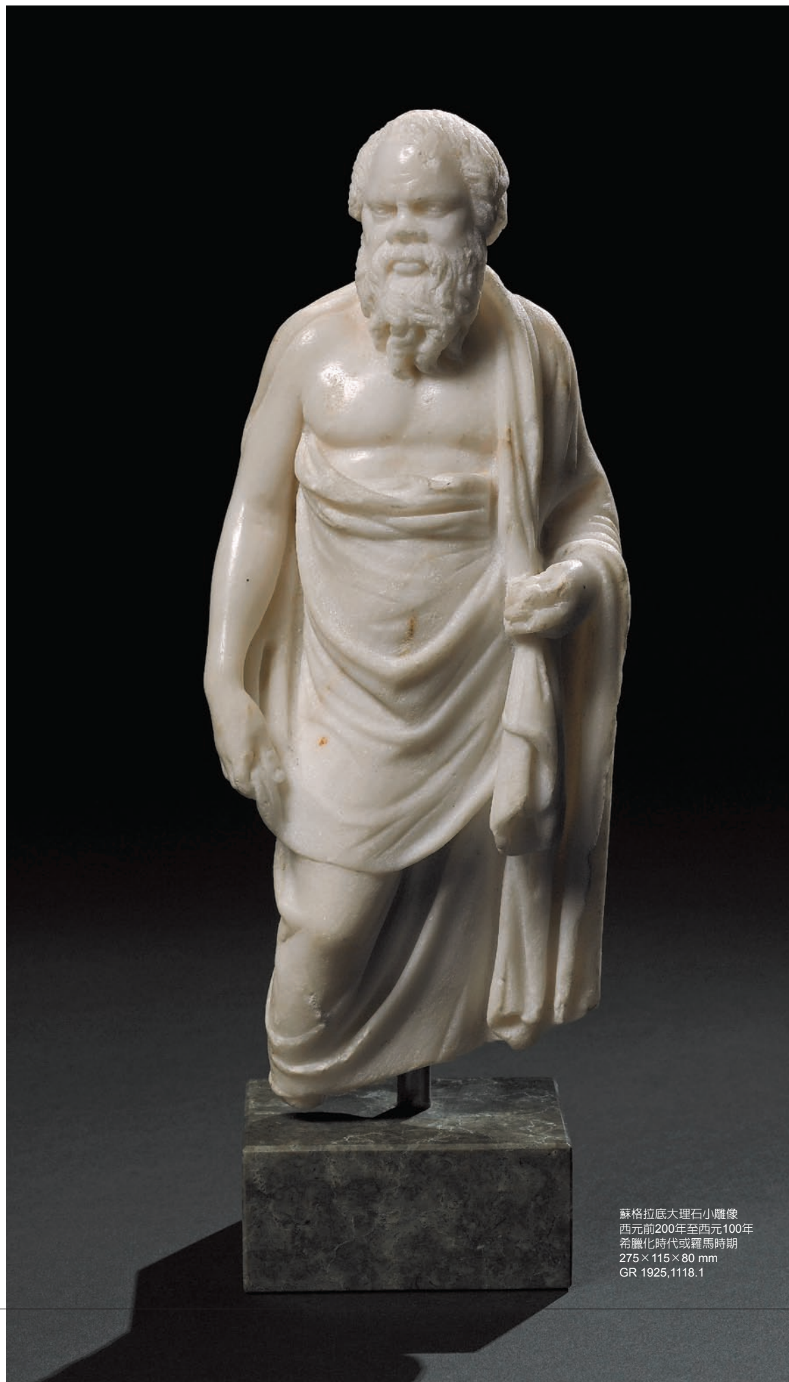
蘇格拉底大理石小雕像 西元前200年至西元100年 希臘化時代或羅馬時期 275×115×80 mm GR 1925,1118.1