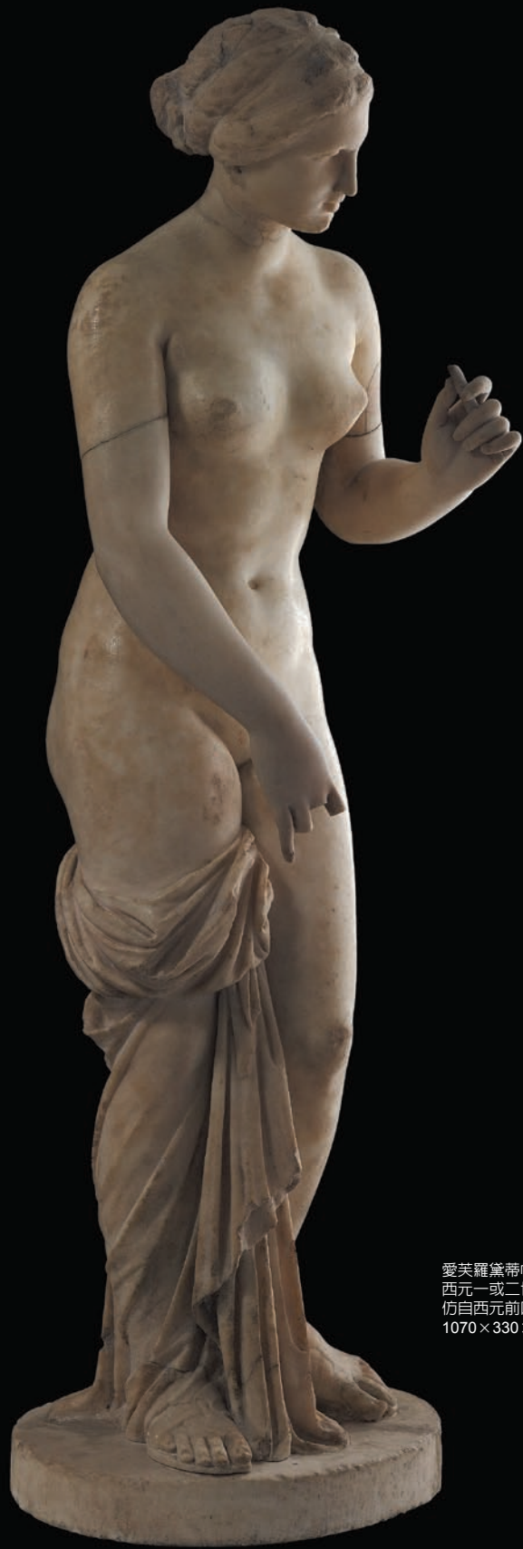
愛芙羅黛蒂帕羅斯大理石雕像 西元一或二世紀羅馬時期 仿自西元前四世紀希臘原作 1070 × 330 × 350 mm