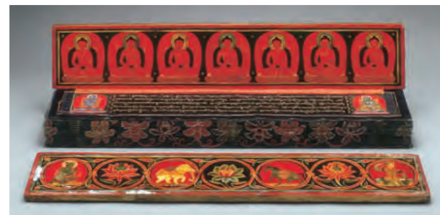
圖二五 《時輪續》 西藏 十四世紀 藍紙金書彩繪 木質經夾板 拉薩西藏博物館藏

時輪續除了對前此發展的密續兼容並蓄，並發展出一套獨立於前代的系統。從中期密教、瑜伽部的《金剛頂經》等經典為基礎發展出來的五部對應地、水、火、風、空等五元論，到了時輪密續加上金剛薩埵部，司「智」，成為六部、六元論。而前述