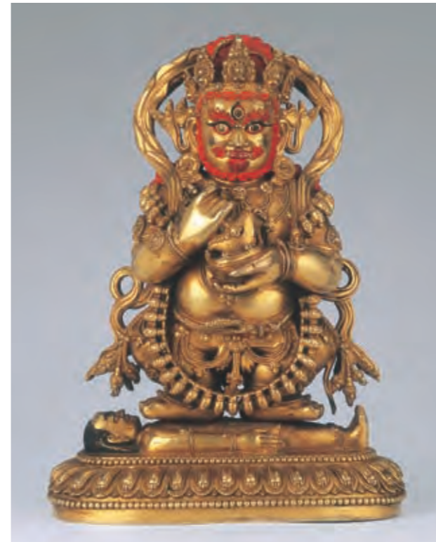
圖九 大黑天像 明代 永樂時期 青銅鎏金 局部彩繪 日喀則薩迦寺藏

尊造像流行 (圖十二、十八)。另外, 梵文沒有此用法, 但存在於藏文的「守護尊」(yidam) 出現, 常是多面多臂的憤怒父母佛姿態, 以雙蓮