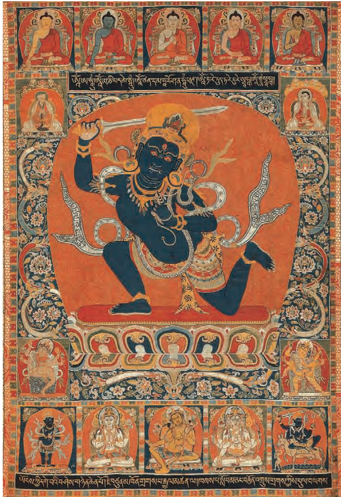
圖十一 不動明王唐卡 元代 絳絲 拉薩西藏博物館藏

明 (vidya, 智慧), 是「咒」的另一名稱, 咒中之王即為明王。因為強調絕大的威力, 所以明王多以怒髮衝冠、裂嘴瞋目、多首多臂的憤怒形象