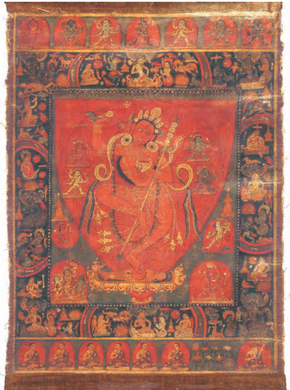
圖十二 金剛亥母唐卡 西藏 十三世紀後半 棉布彩繪 拉薩西藏博物館藏

代表「悲智合一」、「樂空不二」，是後期無上瑜伽密續的本尊（圖十三、十四、二二—二四、二六）。此外，最具代表性的是將複雜的教理具像化、聖眾井然集會的曼陀羅（圖