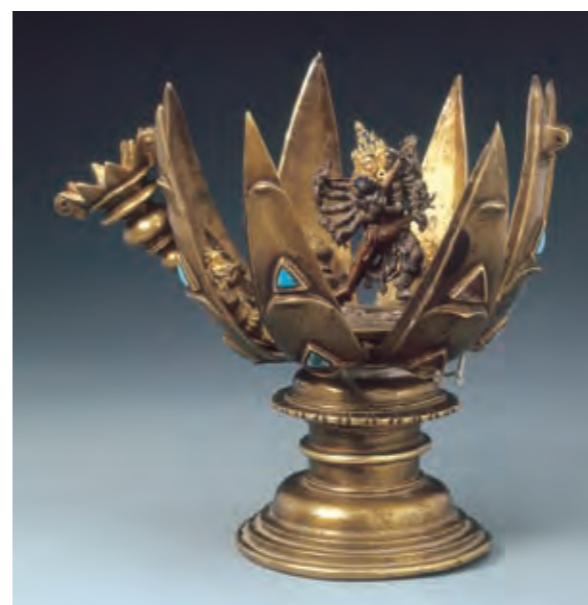
圖二三 八瓣蓮花勝樂金剛曼荼羅 西藏 十五世紀 銅鑲金 局部泥金彩繪 布達拉宮管理處藏