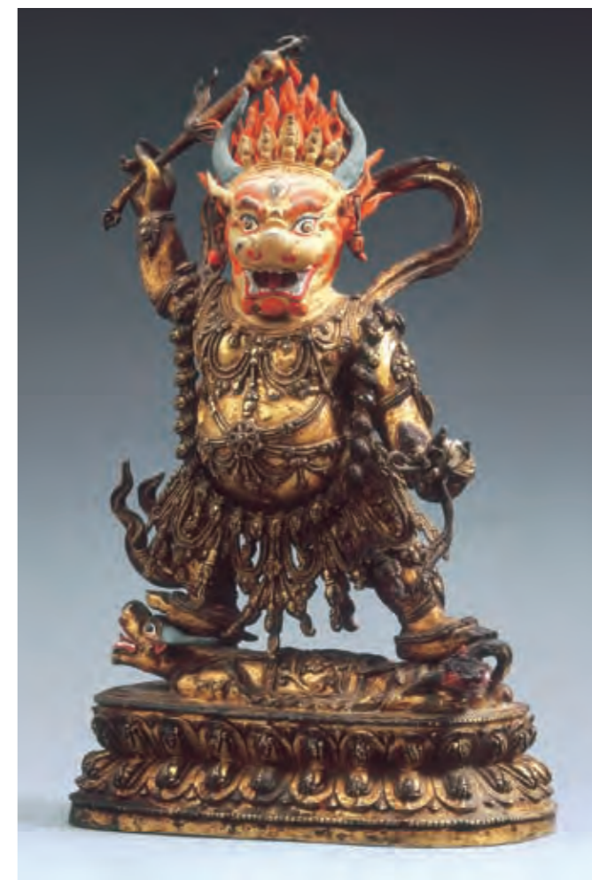
圖二四 閻摩像 明代 十六世紀 青銅鑲金 局部泥金彩繪 布達拉宮管理處藏

典《吉祥最勝本初佛續》(圖二五)並非佛教史上最後完成的聖典，但可說是佛教一千五百年來在印度發展到最後期，所產生的集大成、劃時代的壯大密教體系。博大精深，今日熟悉時輪密續總體體的學者，屈指可數。此密續的產生，應在中亞地區，為佛教徒面對一波波回教勢力入侵的前線，也是彼此文化交流的前哨站。時輪密續中所述人們憧憬、沒有戰亂的烏托邦「香巴拉王國」，以及經典中複雜的伊斯蘭曆算知識，反映了該續成立的時空背景。