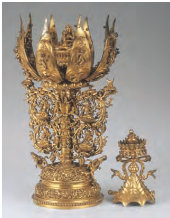
圖十四 八瓣蓮花立體雙荼羅 明代 永樂時期 (1403-1424) 青銅鑲金 拉薩布達拉宮管理處藏