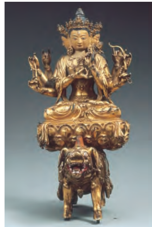
圖十 摩利支天 明代 永樂時期 青銅鎏金 局部泥金彩繪 布達拉宮管理處藏