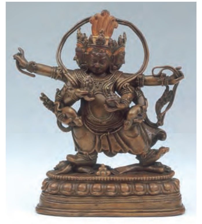
圖八 紅財神像 內蒙或西藏 十七至十八世紀 紅銅鎏金 局部泥金彩繪 承德市文物局藏