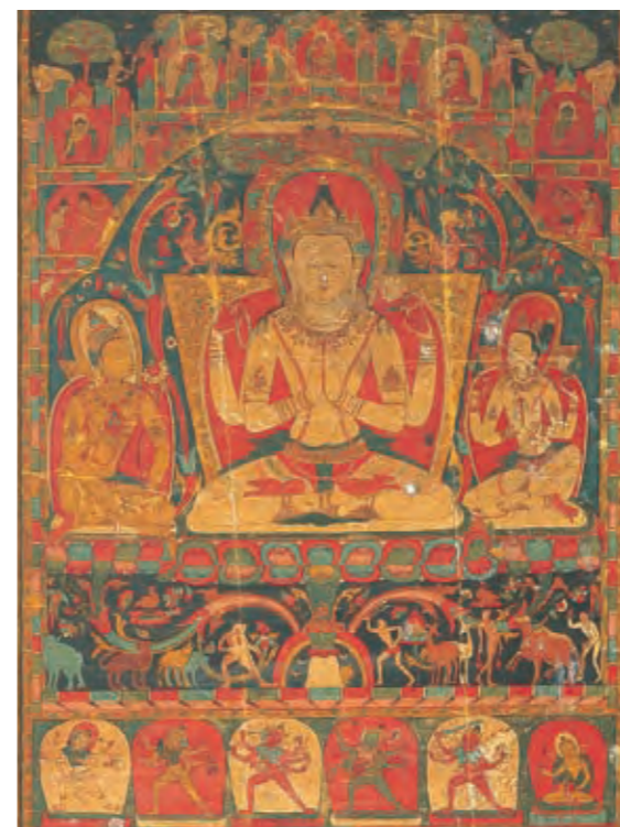
圖六 四臂觀音菩薩唐卡 西藏 十三世紀前半 棉布彩繪 拉薩布達拉宮管理處藏

例。而代表性的菩薩有慈悲化身的觀世音菩薩（圖五、六）、智慧化身的文殊師利菩薩（圖七）、及大願大行的普賢菩薩等。 到了密教時期，除了大乘佛教本來存在的尊格，更吸納、創造了許多神祇，其中最具特色的是憤怒尊的出現。除了某些由印度教導入之神祇，憤怒尊主要是具有強大力量的陀羅尼（咒語、真言）之擬人化形象，在中國、日本等國習稱明王，