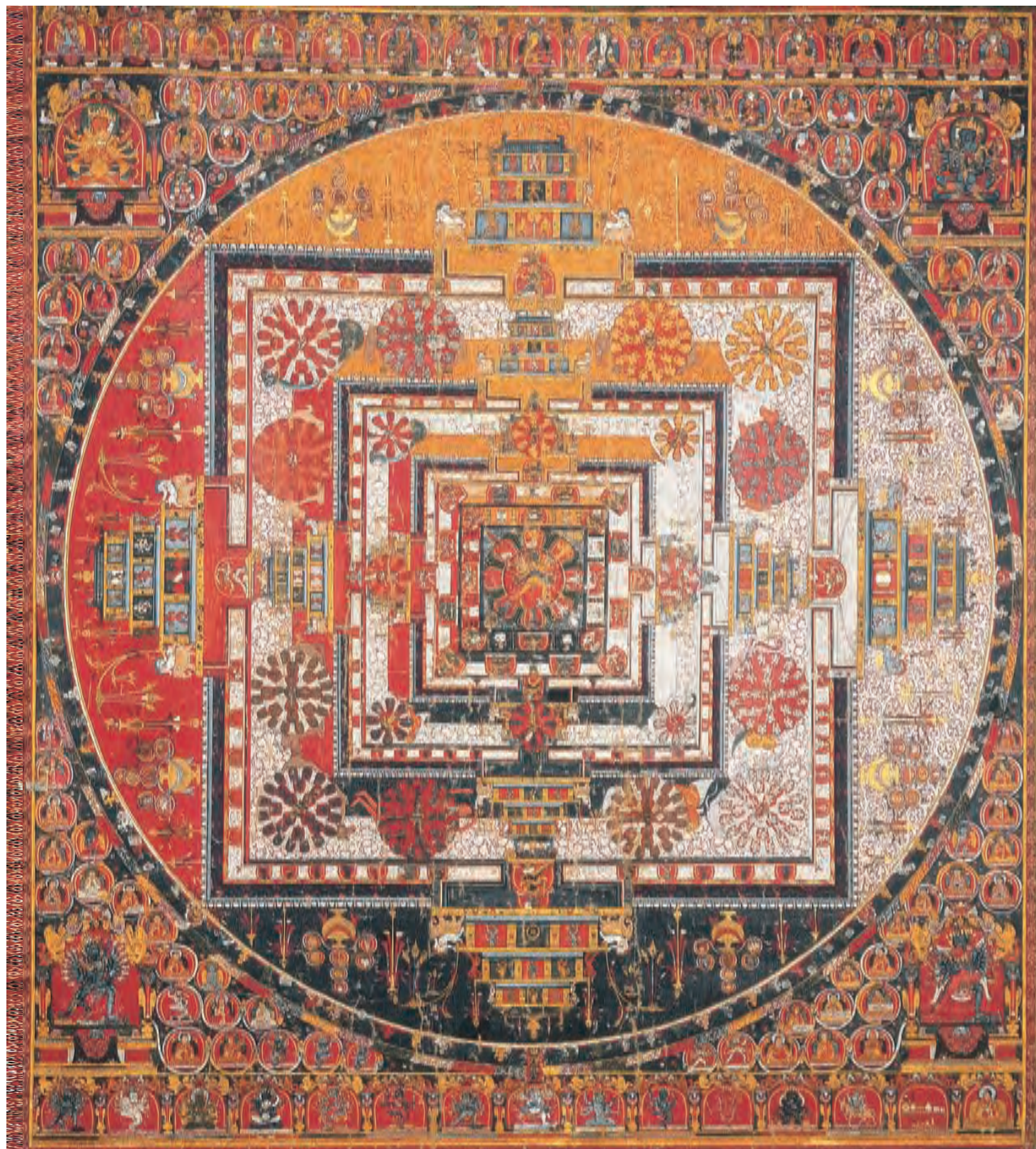
圖二六 時輪壇城唐卡 西藏 十七至十八世紀 棉布彩繪 拉薩西藏博物館藏