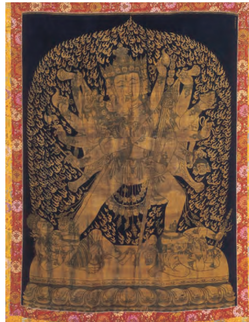
圖二四 勝樂金剛雙身唐卡 明代 永樂時期 絳絲 山南雅魯歷史博物館藏