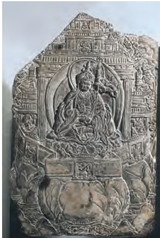
圖十五 蓮花生像 西藏 十七至十八世紀 石 拉薩西藏博物館藏