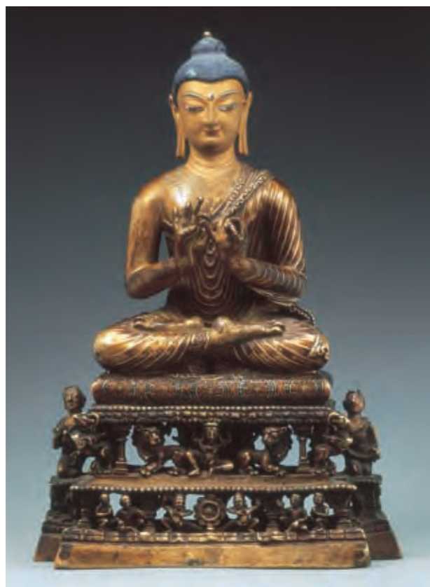
圖二 釋迦牟尼佛像 克什米爾 八世紀 銅鑄金 局部泥金彩繪 拉薩布達拉宮管理處藏