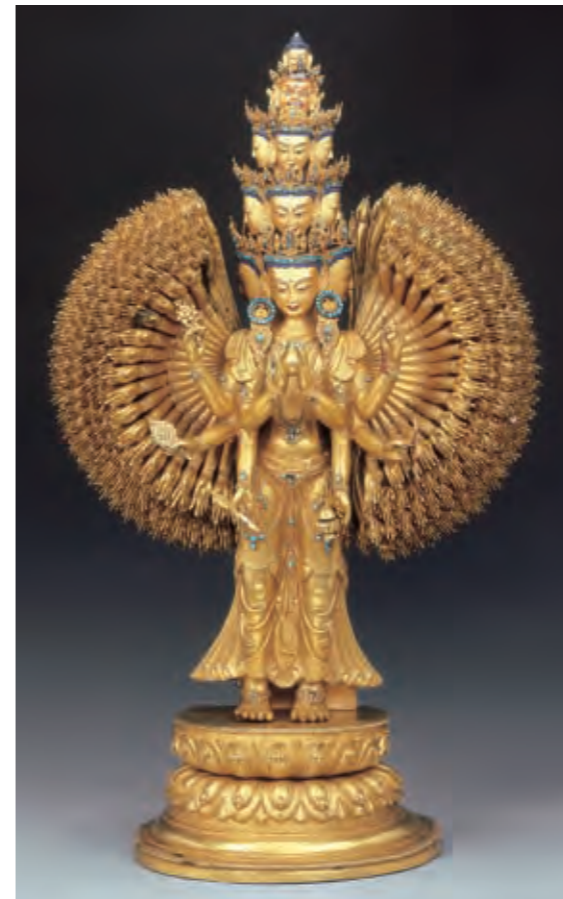
圖五 十一面千手千眼觀音菩薩像 西藏 十七至十八世紀 銅鑲金 局部泥金彩繪 鑲嵌綠松石 拉薩羅布林卡藏