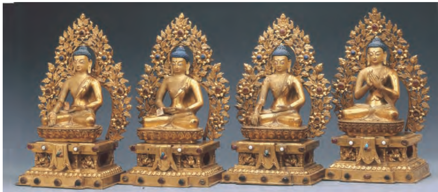
圖四 八大藥師佛像 西藏 十八世紀 銅鑲金 局部泥金彩繪 拉薩羅布林卡藏