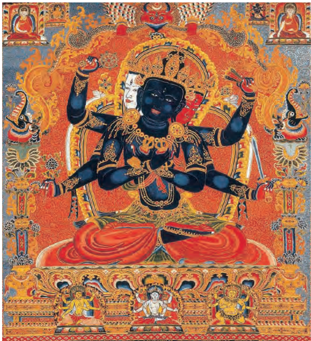
圖十九 密集金剛刺繡唐卡 明代 永樂時期 絹本刺繡 拉薩布達拉宮管理處藏

紀以降，母續經典凌駕了父續經典，取得爆發性的流行。其中最具有代表的是喜金剛和勝樂金剛系密續。