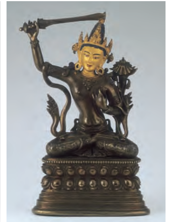
圖七 文殊菩薩像 西藏 十七至十八世紀 黃銅 局部泥金彩繪 拉薩西藏博物館藏