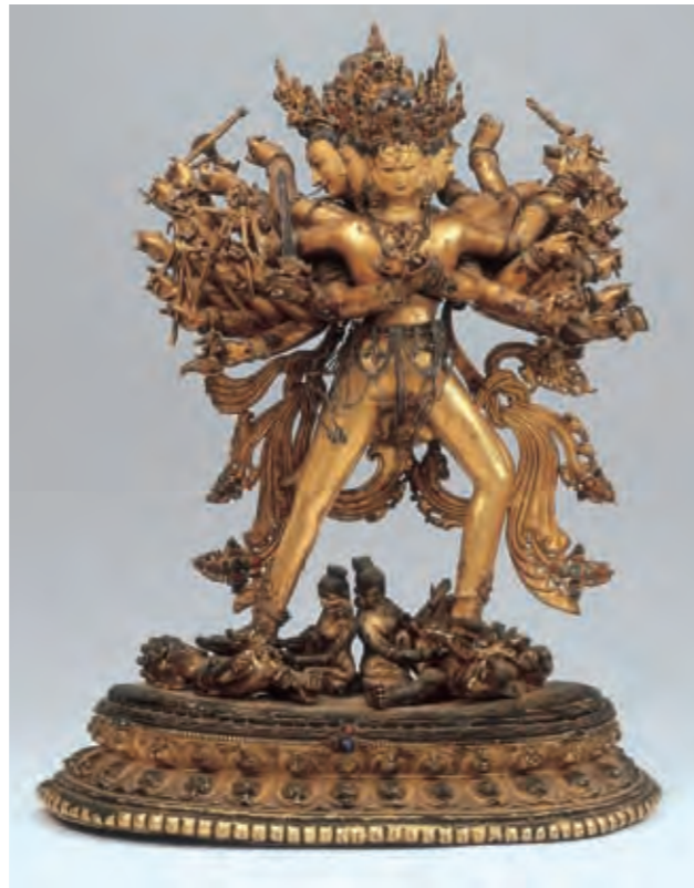
圖十三 時輪金剛雙身像 西藏 十四世紀 銅鑲金 局部泥金彩繪 鑲嵌綠松石、珊瑚、寶石 日喀則夏魯寺藏