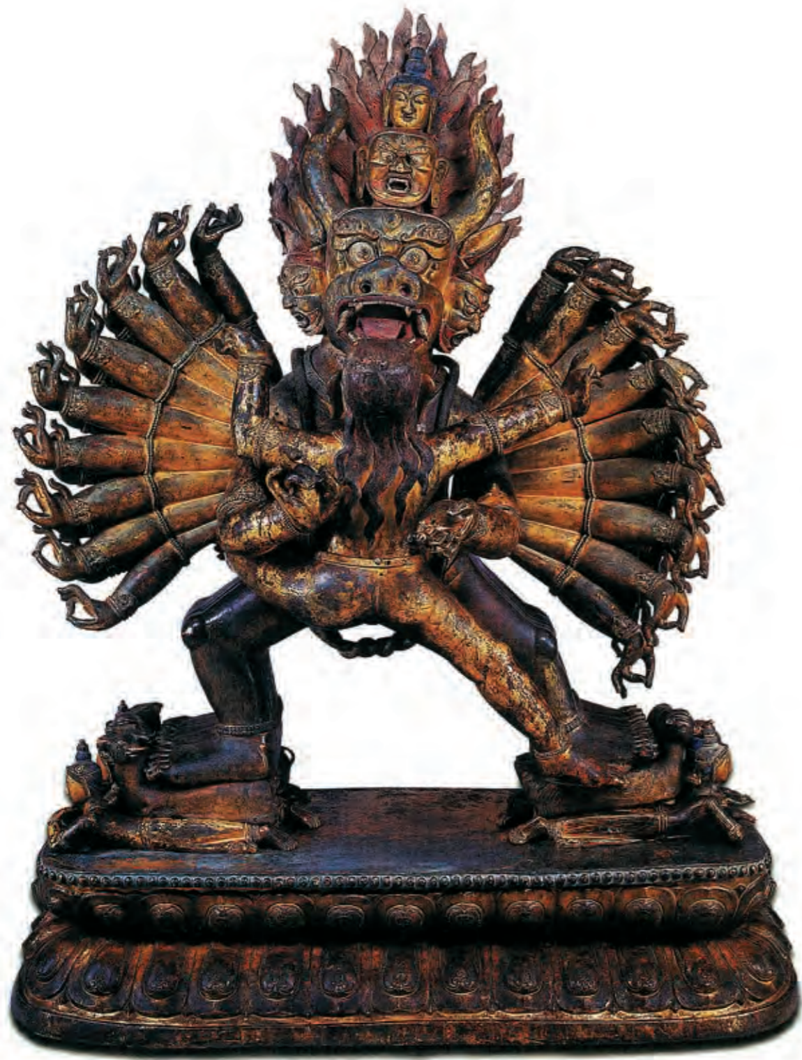
圖二一 大威德金剛雙身像 西藏 十八世紀 紅銅鑲金 局部彩繪 承德市外八廟管理處藏