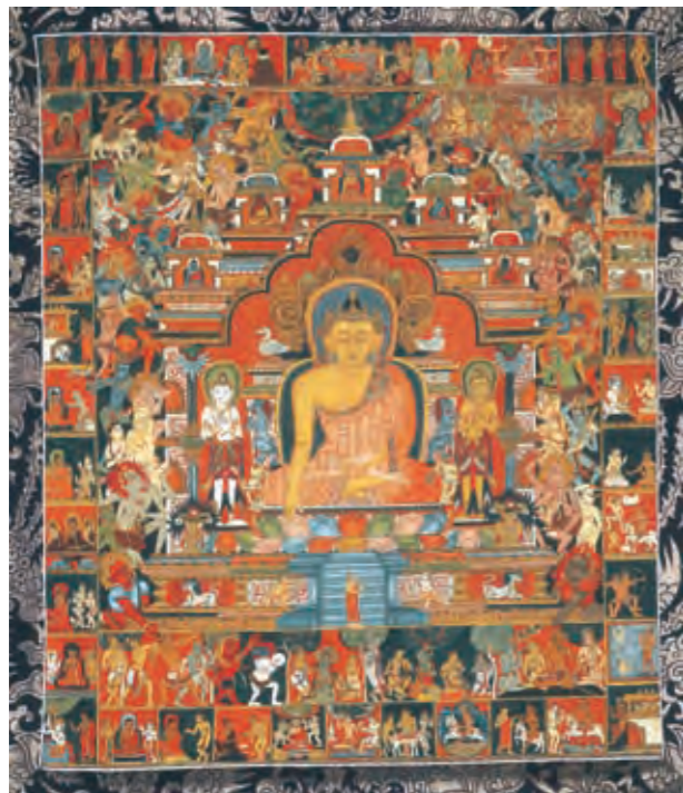
圖一 釋迦牟尼佛降魔成道唐卡 尼泊爾 十四世紀 棉布彩繪 拉薩西藏博物館藏