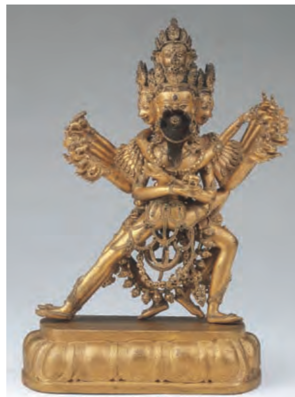
圖二二 喜金剛雙身像 西藏 十八世紀 銅鑲金 鑲嵌綠松石 承德市文物局藏