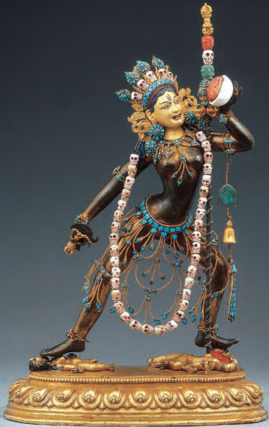
圖十八 空行母像 西藏 十七至十八世紀 銅鑿金 局部泥金彩繪 拉薩羅布林卡藏

喜金剛或稱呼金剛，梵文為 H evajra，有說是 He 與 vajra 的組合，或為 He ru ka（赫魯葛）與 vajra 組合。