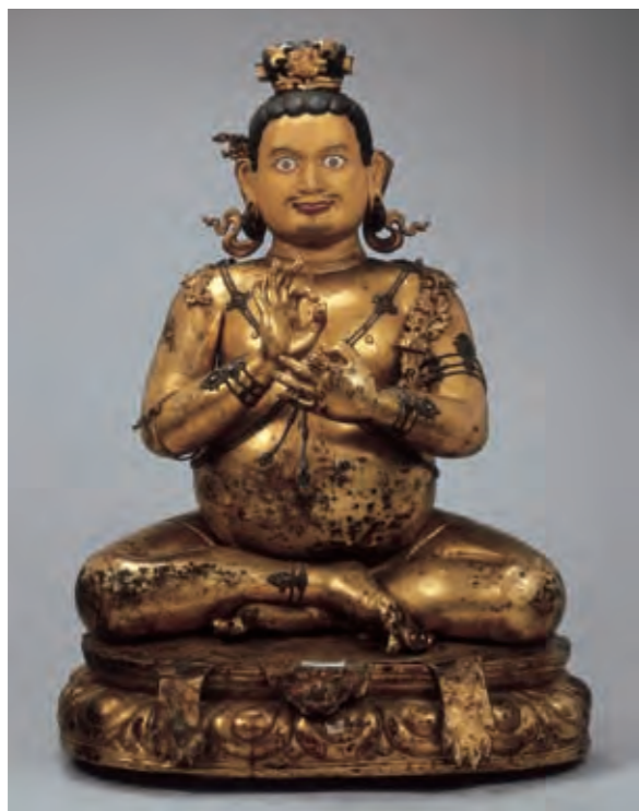
圖十六 昆瓦巴像 西藏 十六世紀前半 銅鑲金 局部泥金彩繪 山南扎囊敏竹林寺藏