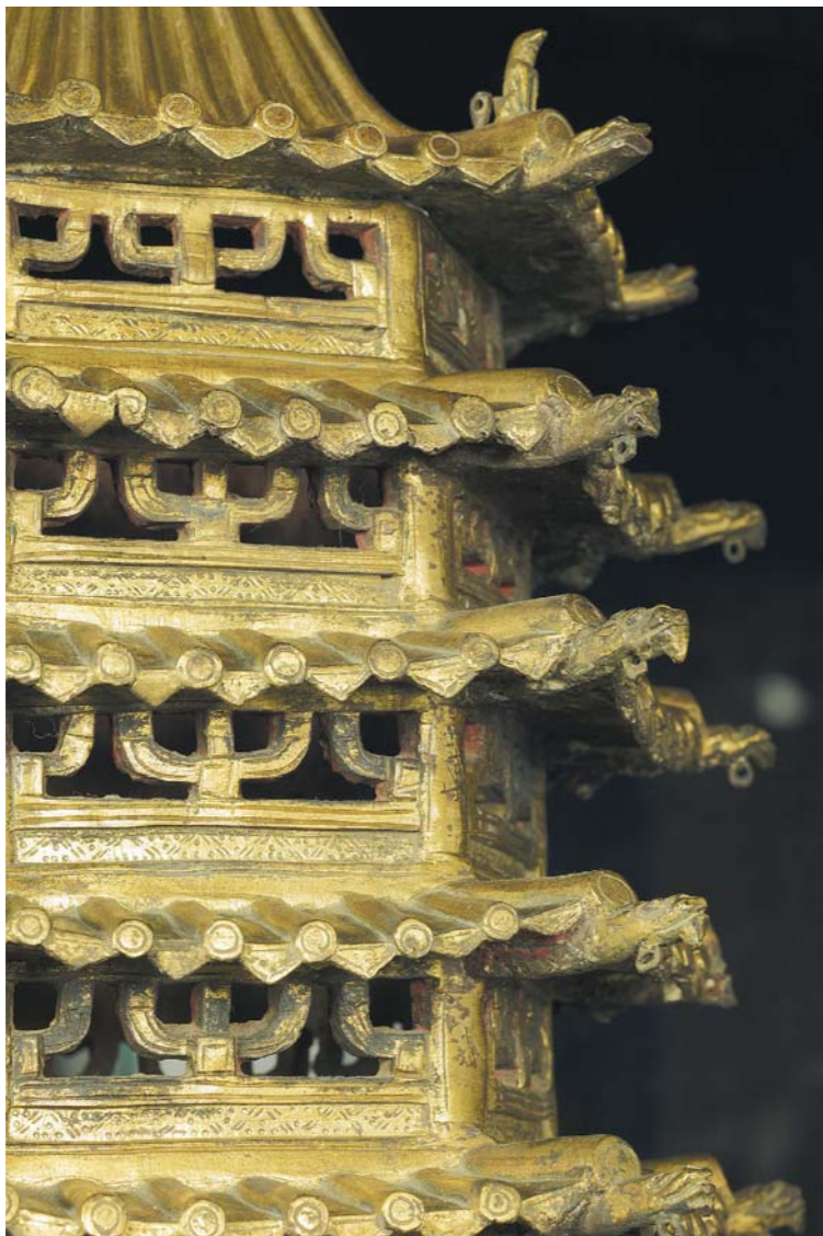
圖五 塔檐 塔身局部

法賢翻譯的《佛說布施經》說：「若以上妙飲食供養三寶，得五種利益：身相端嚴、氣力增盛、壽命延長、快樂安隱、成就辯才。如是南瞻部洲一切眾生——父母、妻子、男女眷屬——如上布施，隨願所求，無不圓滿。」著《釋迦如來應化錄》「目連救母」項