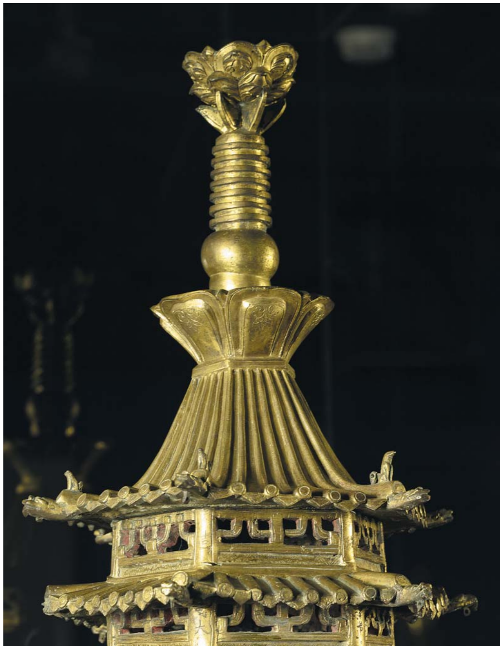
圖四 塔刹 塔頂局部

（一五七六）在北京阜城門外八里莊建慈壽寺，今寺廟已毀，寺塔仍存。慈壽寺塔仿北魏天寧寺塔的式樣，作八角形，密檐式磚砌，高三十三層。塔基的中層作斗拱護欄，斗拱下有力士扛塔，勇猛壯碩，再下層爲天王守