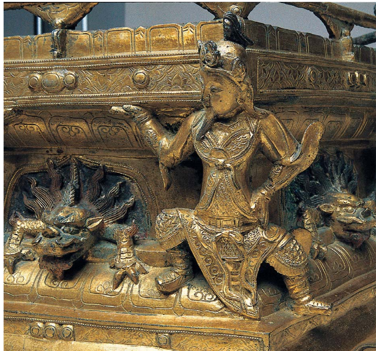
圖二 天王 塔基局部

寶冠，塔基正、背兩面的天王，兩足作三七步跨立，一手插腰一手托塔，側面四面的天王作馬步，雙手撫膝，袖尾高揚，裙襠飛舞，神氣威武。自龕內攀附匍匐而出似龍形的怪獸，頭上雙角矗立，頭形厚重，雙眼圓瞪，跨龕而出的足爪，結實的踏在蓮瓣上，頭頸之間長鬚向四方放射，彩繪猶存。台座結構層次清晰，結體份量渾厚，為全塔奠定穩固的基座。 塔身最下層比例最高，前後兩面開門，四面刻窗形，每一轉角力士守護，六根塔柱柱上刻「唵嘛呢叭吽」，以順時針方向排列。十三層塔以斗拱組成，塔內中空，斗拱鏤空，剔透流通，塔檐挑出深遠，獸首收尾，尾端穿孔可繫鐸。塔身由下而上漸高而漸小，收高聳入雲之感，斗拱層層挑空，使原本厚重的塔身又不失靈巧之氣。 塔刹由下而上為蓮座、寶珠、七層相輪、受花（露盤）與複層蓮瓣相疊而成，最頂端的收頭已失。六片三角形的受花，角端有孔可與塔檐以寶鎖相繫，層層塔檐銅鐸垂掛，塔檐底