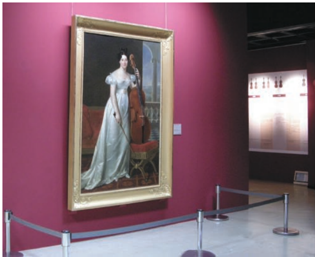
展覽重現18世紀室內樂演奏場景，左為里耶茲奈畫作〈女士肖像〉