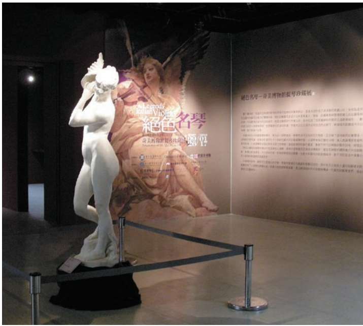
展覽入口處以法國藝術家Afred Bouher的作品〈傾聽海貝的女神〉來邀請觀眾一同聆聽名琴美聲

Orehill指出，當觀眾參與示範、觸摸及討論展品、運用互動式展示，以及戲劇性呈現等方式，觀眾的學習記憶會高達百分之九十。反之，僅是靜態的觀看，一般人能記住的部分只有百分之十（註四）。因此，運用多感官呈現的展覽，遠比只訴求單一感官者更能讓觀眾驚喜，並加強對新事物的記憶。