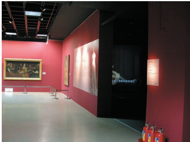
展場內以250吋投影呈現「克里蒙納三大名琴PK演奏」