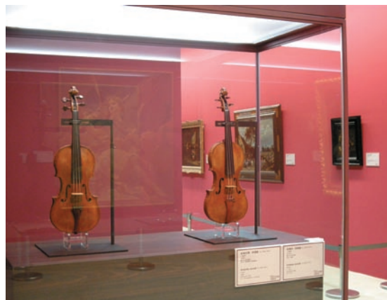
「絕色名琴」展場

透過解說瞭解每把提琴的故事、歷史、製作、材質等，並能聆聽名琴的音色。此外，更進一步結合奇美集團旗下奇美科技的觸控顯示器生產技術，以及國立台灣師範大學的數位典藏音樂資料庫與3D技術，將原本靜態的展覽化為具多重感官享受的音樂盛宴。