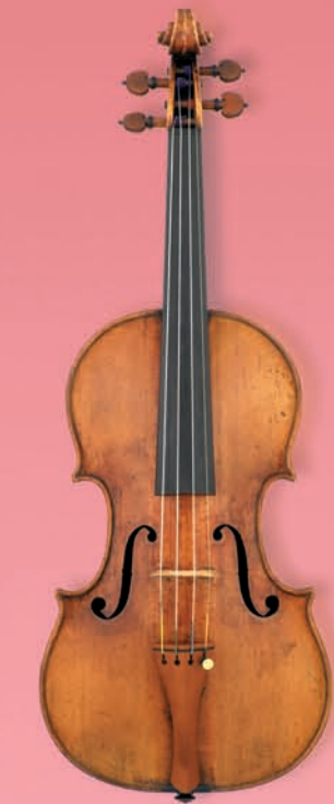
本提琴圖片由奇美博物館提供