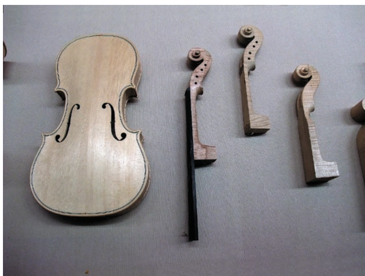
「提琴的奧秘」展示區

的樂音，亦能在3D虛擬博物館中享受親自把玩、翻轉提琴的樂趣。 然而，此種高度運用科技輔助展示的展覽，使用的科技設備是否能於近四個月展期維持正常運作，以及故障時工作人員是否能立即排除問題，都是必須特別留意的面向，以避免觀眾僅見「故障」告示後敗興而歸。