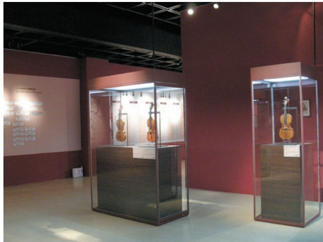
展場以大圖輸出呈現製琴學派所在的地理位置與其製琴師關係圖，以及音樂提琴大事紀，和人類歷史重要事件並列