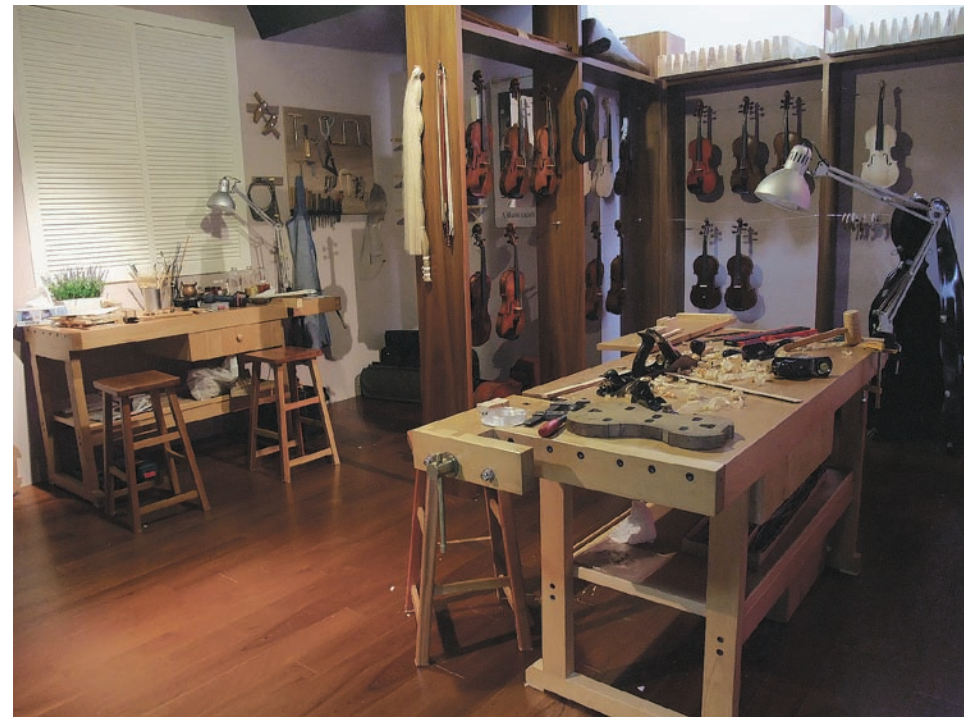
提琴工作坊展示區

解構，讓觀眾一窺這個看似簡單卻充滿無限爆發力的小木盒所擁有的魔法秘笈。奇美本身雖有第一流的提琴收藏，卻無製琴過程各階段可展示的物