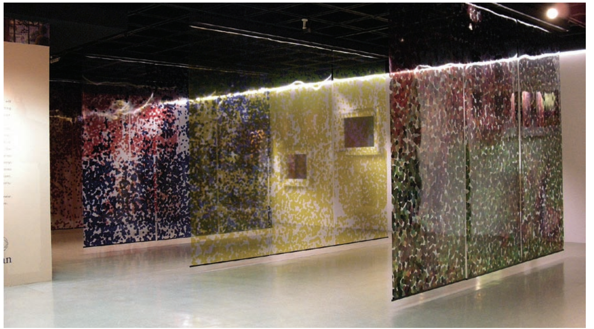
「印象畢沙羅」特展入口展示三元色布幕

目的 (Purpose)——為什麼我們要說這些？(一) 觀眾 (Audience)——我們要對誰說這些？(二) 主題內容 (Subject)——我們要說什麼？(三) 策略 (Strategy)——我們要如何說？策展團隊以「與生命相遇」的主要訊息貫穿故事主軸，於每幅作品右側陳列扣合展覽核心的問句，引領觀眾藉由對問題的思考進而與作品產生互動，並建立關聯性。展覽最後的生命樹留言區，設計引導觀眾思索生命意義與價值的話語，鼓勵觀眾寫下感言，代表觀眾對展覽核心訊息的呼應與共鳴（註三）。 此外二〇〇八年五月於國立故宮博物院展出的「印象畢沙羅—英國牛津大學美術館珍藏展」，即被故宮定位為「教育展」，特邀國立台北教育大學藝術學系教授加入策展團隊，製作印象派畫家表現自然光影變化的展示媒材與互動區。展場入口另特別設置紅、黃、藍三原色半透明布幕與明鏡，讓觀眾穿梭其中，在色點與倒影中體會印象派描畫派的創作精神。 博物館學專家 Eilean Hooper-