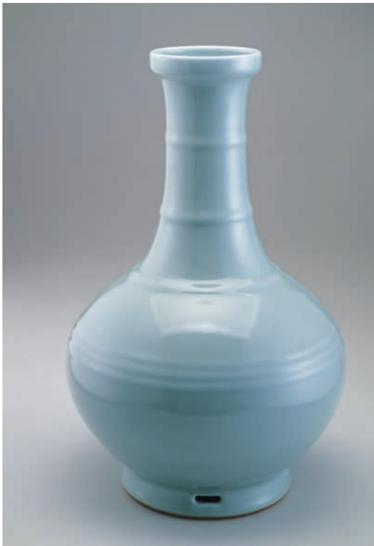
圖十 雍正窯仿汝釉弦紋瓶 國立故宮博物院藏