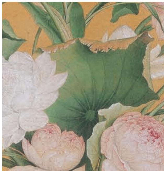
圖三 枯黃凋謝荷葉