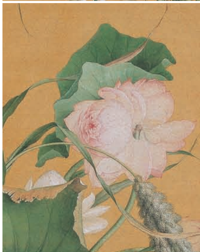
圖二 雙蓮並蒂蓮荷

皇上御極元年符瑞疊呈分岐合穎之穀實於原野同心並蒂之蓮開於禁池 臣郎世寧拜觀之下謹彙寫瓶花以記祥應 雍正元年九月十五日海西 臣郎世寧恭畫