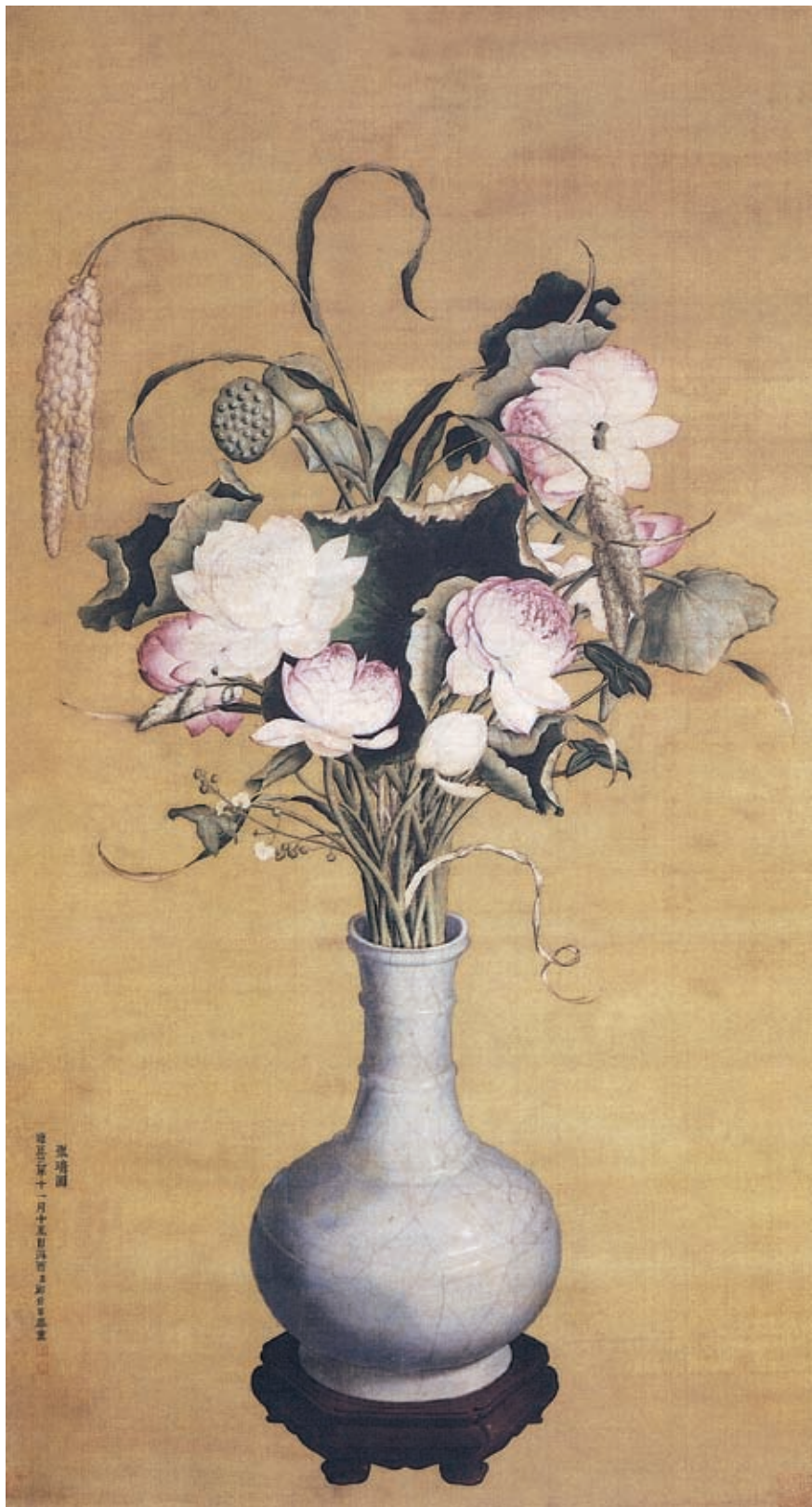
圖十三 郎世寧《聚瑞圖》上海博物館藏

光影效果及立體感,採用西方透視法,物體具有明暗層次與立體感。《聚瑞圖》在花瓶描繪上受到西洋油畫技法的影響,瓷瓶與木座皆按其透視比例,以光影明暗變化與色彩深淺,表現出瓷瓶與木座的體積和立體感。瓶肩部位,通過高光強調瓷器表面圓潤柔和的光澤,及釉色晶瑩閃亮的質感。(圖九)此軸應是按照宮廷