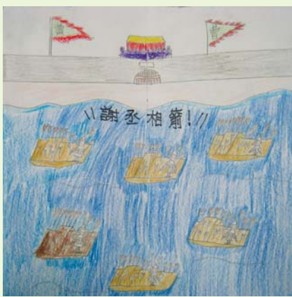
士林國小學生繪本創作《草船借箭》

認為學生觀眾的博物館經驗建構於參觀前、參觀過程、參觀後等三個階段，且學生對於展品的理解與個人的前備知識息息相關。因此，此次赤壁特展館校合作透過教師和故宮人員的合作，結合故宮教育人員到校服務，將事前準備學習、故宮赤壁特展參觀、事後延伸教學及評量納入整體學校教學之中。 四、館校合作課程及教案設計 自赤壁特展前置期，本院教育人員便開始到各校舉辦到校服務課程共九場。到校服務課程運用了赤壁特展兩件重點展品——武元直的赤壁圖、趙