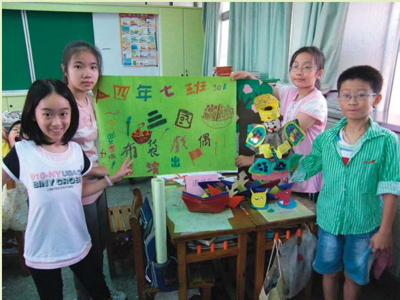
石牌國小學生展示三國布袋偶戲佈景、道具及戲偶的集體創作