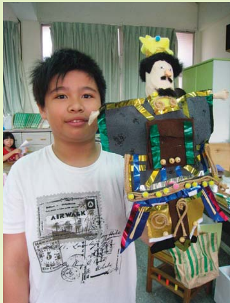
石牌國小學生所創作的布袋戲偶：曹操