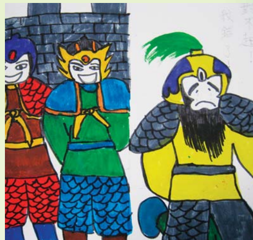
士林國小學生所創作的繪本〈大意失荊州〉，人物造型詼諧生動，童趣十足。

認為學生觀眾的博物館經驗建構於參觀前、參觀過程、參觀後等三個階段，且學生對於展品的理解與個人的前備知識息息相關。因此，此次赤壁特展館校合作透過教師和故宮人員的合作，結合故宮教育人員到校服務，將事前準備學習、故宮赤壁特展參觀、事後延伸教學及評量納入整體學校教學之中。 四、館校合作課程及教案設計 自赤壁特展前置期，本院教育人員便開始到各校舉辦到校服務課程共九場。到校服務課程運用了赤壁特展兩件重點展品——武元直的赤壁圖、趙