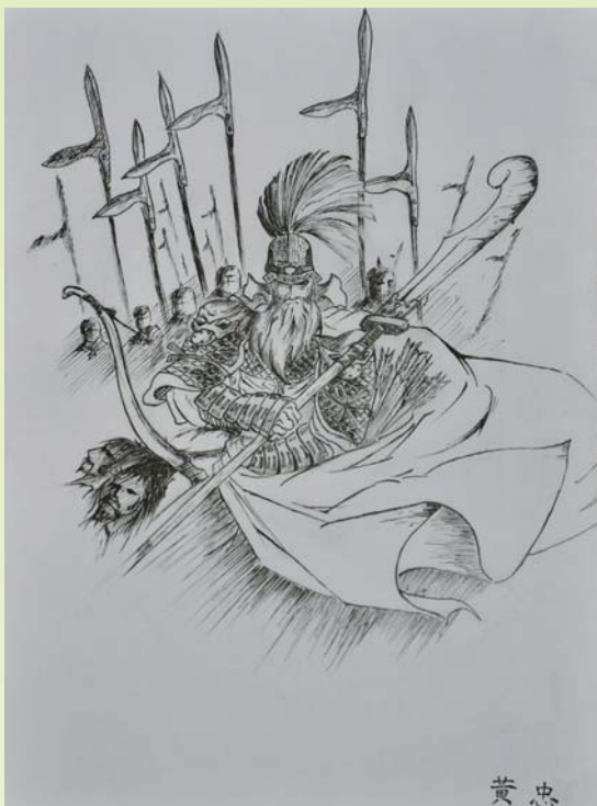
臺北高中美一甲學生的手繪創作，呈現青少年對於三國人物的多元詮釋觀點，左圖：呂布 右圖：黃忠