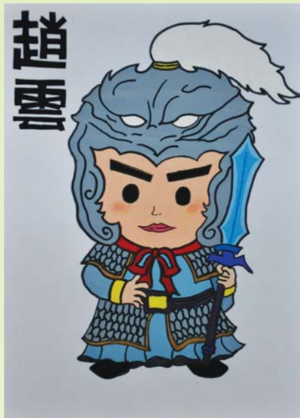
臺北高中三國人物的手繪創作：趙雲