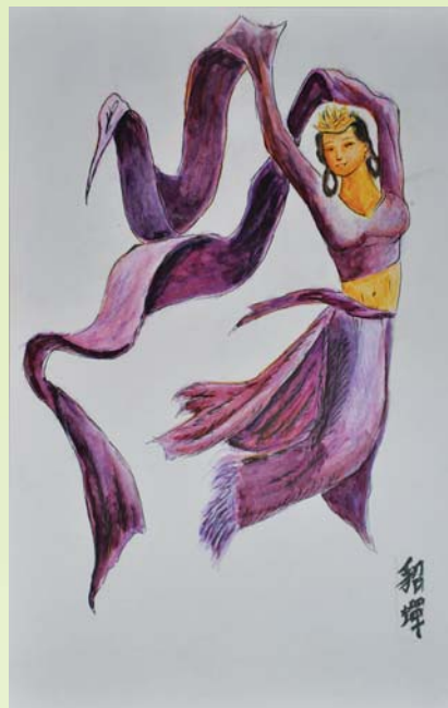
臺北高中三國人物的手繪創作：貂蟬

本展覽以文物、藝術的角度出發，展出赤壁戰爭前後相關人物的文物資料及作品，另以後世歌詠赤壁的藝術繪畫、書法及明清時期的三國小說、戲曲插畫，完整描述赤壁及赤壁之戰在歷史、藝術、文學上的影響。