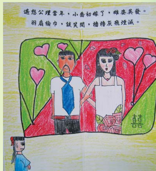
士林國小學生的繪本創作，對於蘇東坡〈念奴嬌赤壁懷古〉的詮釋十分有創意。

展覽資訊與教學資源，協助教師利用故宮既有的博物館數位資源進行教案設計及開發。 3. 賦予學校教師充分自主權 學校教師擁有充分的自主權，可以依據其專長、教學需求及學生特性，針對赤壁特展相關主題及展品，延伸開發出各具特色的主題教學。 4. 學生在「參觀前」、「參觀過程」、「參觀後」的學習經驗之整體規劃 福克和迪爾金 (Falk & Dieking)