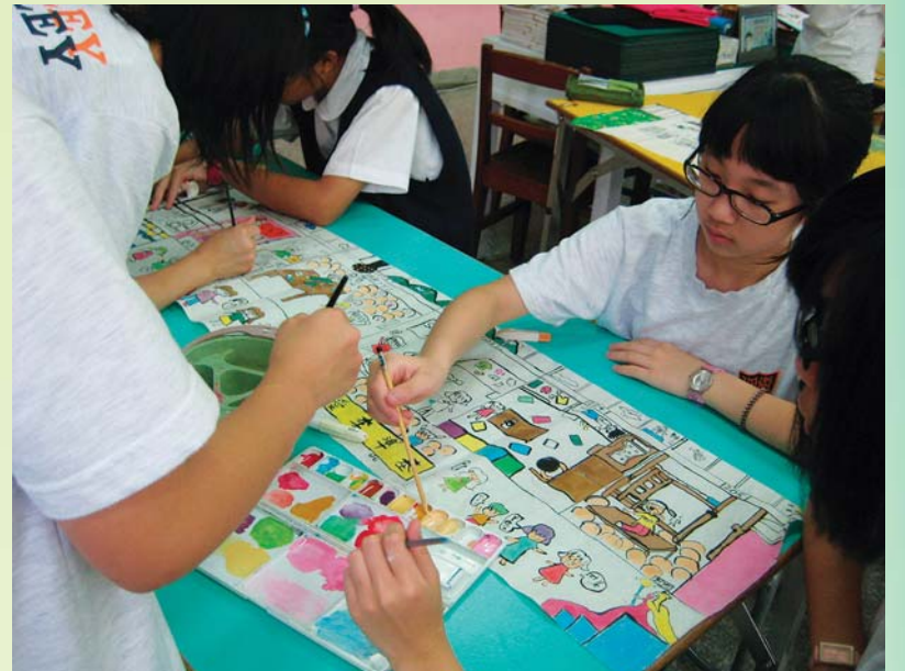
衛理女中學生將校園生活點滴，以手卷的形式表現出來

作等任務。小朋友製作出來的布袋戲偶當然比不上專業戲偶的精緻，演出技巧也比不上專業布袋戲的純熟，但是背後的學習歷程卻是深具意義的。 4. 結合青少年的視覺文化經驗：從館校合作的過程中，觀察到赤壁之戰及三國人物深受許多青少年的喜愛，尤其是男生對於這個特展主題非常熱衷。有些小學四年級的男生，學校課本雖然尚未介紹到中國歷史，但已經對於許多三國人物及關鍵戰役如數家珍。因此在到校服務課程中，學生的回應十分熱烈，甚至超乎學校老師所預期的投入。許多學生也表示，透過學校教師的閱讀計畫，如白話文版三國演義等書籍的閱讀，以及實際參觀故宮赤壁特展的導覽解說後，讓他們對於三國及赤壁之戰的歷史有更完整、深入的理解，也澄清了過去來自於電玩遊戲等管道某些片面甚至不正確的認知。