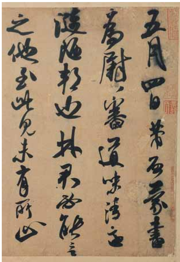
圖四 米芾〈葛德枕帖〉局部 國立故宮博物院藏

以看出米芾早期書法風格中那種略帶欹側的結字應是源於歐陽詢，甚至通篇斜側的體勢，都可以看出米芾筆法源於歐字的明顯痕跡，事實上，不僅是米芾早期書蹟，即便中期的〈葛德枕帖〉（圖四），乃至後期的〈戲成詩帖〉（圖五）都可以看到歐陽詢行書的筆法與結字對米芾行書風格上的影響。所謂「莊若對越，俊若跳擲」是米芾對歐陽詢行書的讚譽，說明歐體行書中獨特的動態，如今確定米芾曾