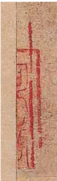
圖六 〈卜商讀書帖〉左下角殘印

「九一二」黨羽，《舊唐書》以「嬖吏」稱之，朱溫曾欲以此人爲太常卿，爲當時唐宰相裴樞所反對，而朱溫於是記恨，不久釀成「白馬之禍」，唐朝政府的勢力因此被剝平。故米芾稱張廷範「唐賊」，又據《書史》，米芾嘗爲此帖作跋：「唐弘文館學士歐陽詢書，唐人所摹」，帖上有「清河張廷範印」。察看〈卜商讀書帖〉左下有部分朱文篆字（圖六）殘留，其中能辨識者爲「可」，或許爲「清河張廷範印」之「河」字存留。 精於鑑藏的米芾對收藏印有獨到的見解，認爲「印文須細，圈須與文等」，爲的是鈐印印記要不損書畫，而「米姓之印」印文，如米芾所言圈文皆細。此外，對於所收古書畫上收藏印的用印方式，根據藏品等級不同而有分類，絕品鈐白文玉印，最上品書畫則列舉多方印記，其中有「用姓