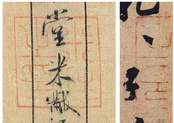
圖三 《卜商讀書帖》與《蜀素帖》上「米姓之印」比較

朱文圓印、「儀周鑑賞」白文印，兩方安氏收藏印。後入乾隆內府，並刻之於《三希堂帖》，由清內府流存至今。