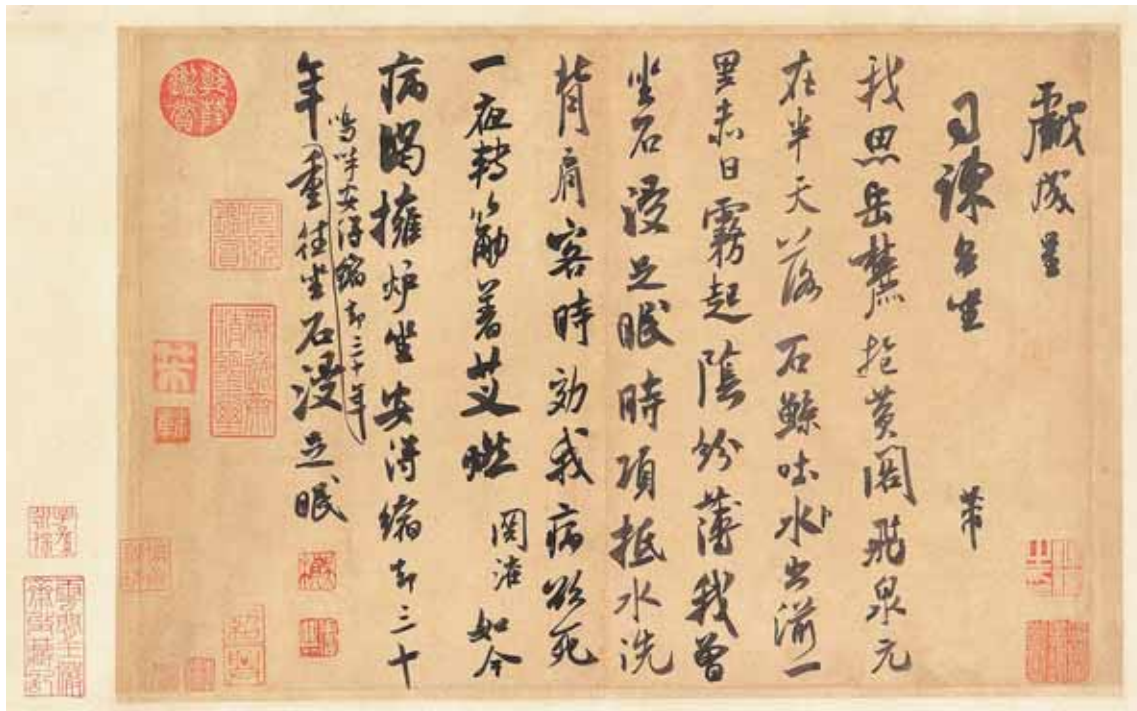
圖五 米芾〈戲成詩帖〉局部 國立故宮博物院藏