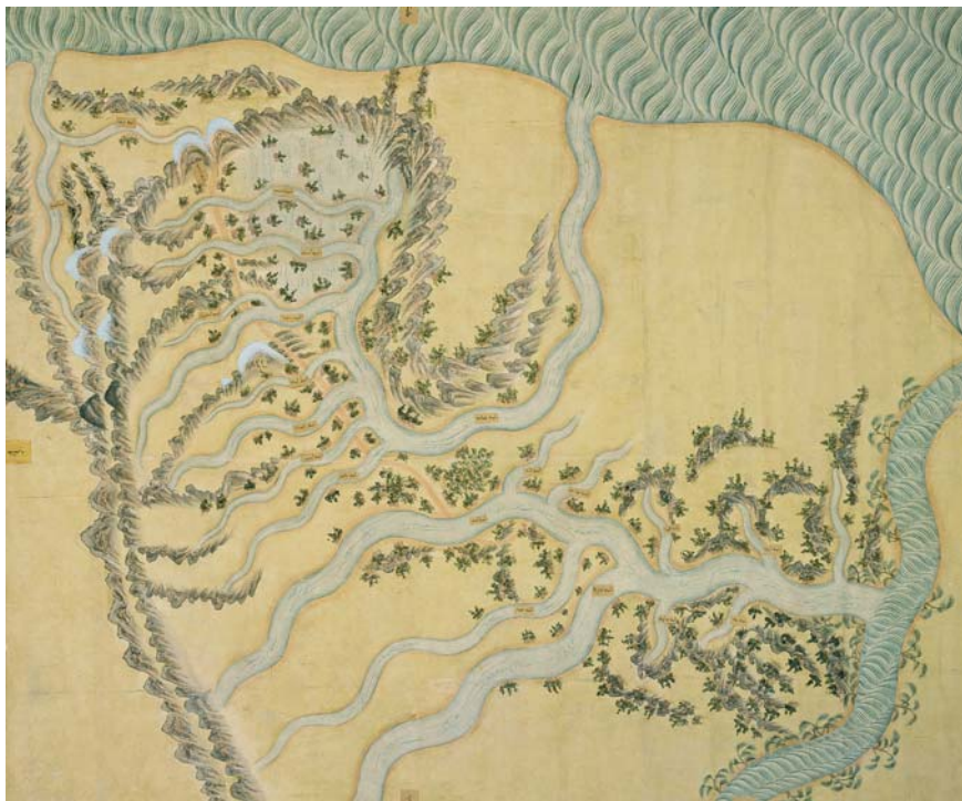
烏喇等處地方圖 平圖021456 130x111cm

物價值為傳世絕少的明彩繪邊防圖珍本，在史料價值上可以補充河西地區之衛所、驛遞、城堡、墩臺、邊牆以及西域地區的土地人物等文獻記載。三篇文章分別就明清時期的明清地圖