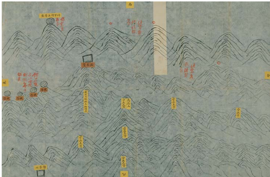
石峰堡一帶地形圖 故宮074089 40x59公分 國立故宮博物院藏