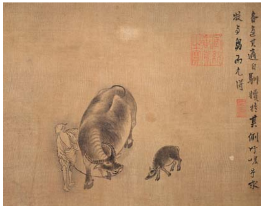
8-7 第七幅。各適其適。自馴橫於其側。吁嗟乎。求牧與芻而允得。