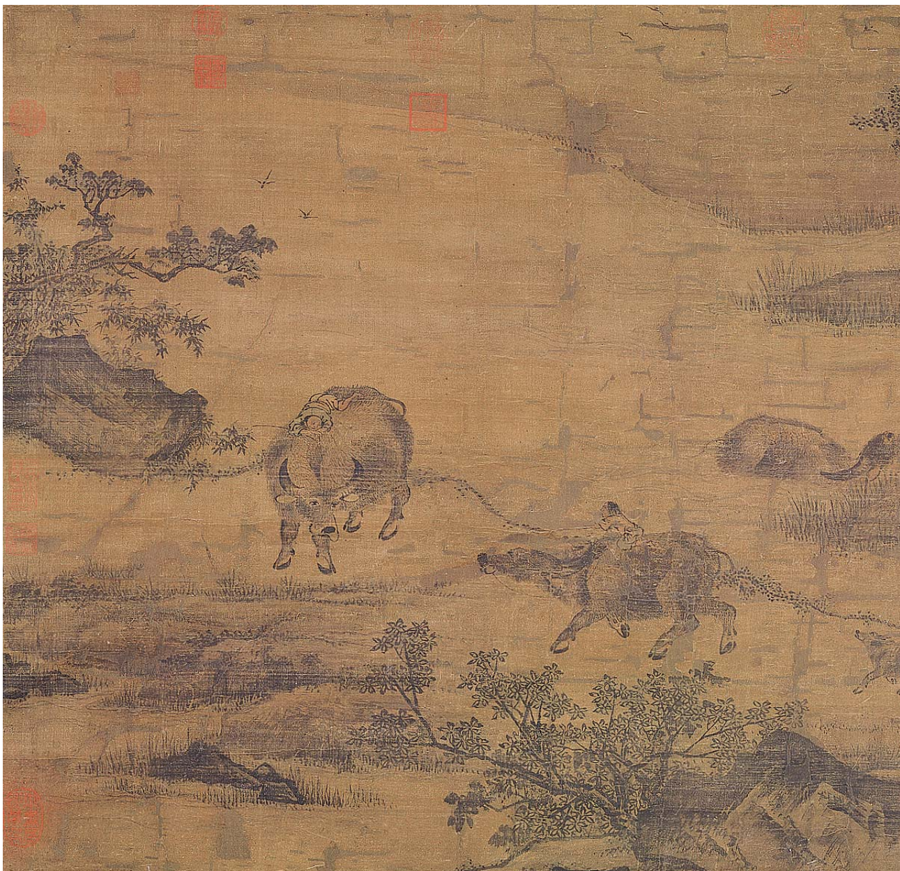
圖十 傳 宋人 牧牛圖 國立故宮博物院藏

童與牛作息相處之道的描寫最為完整並且意味深長。十二牧圖敘述了牧童餵牛（圖八之十一）、為牛穿鼻牽牛外出（圖八之二）、照顧牛的時候連帶讓小牛在耳濡目染中習慣和人相處（圖八之七）、天熱帶牛泡水消暑（圖八之十），還有帶牛回家（圖八之八）等工作內容。