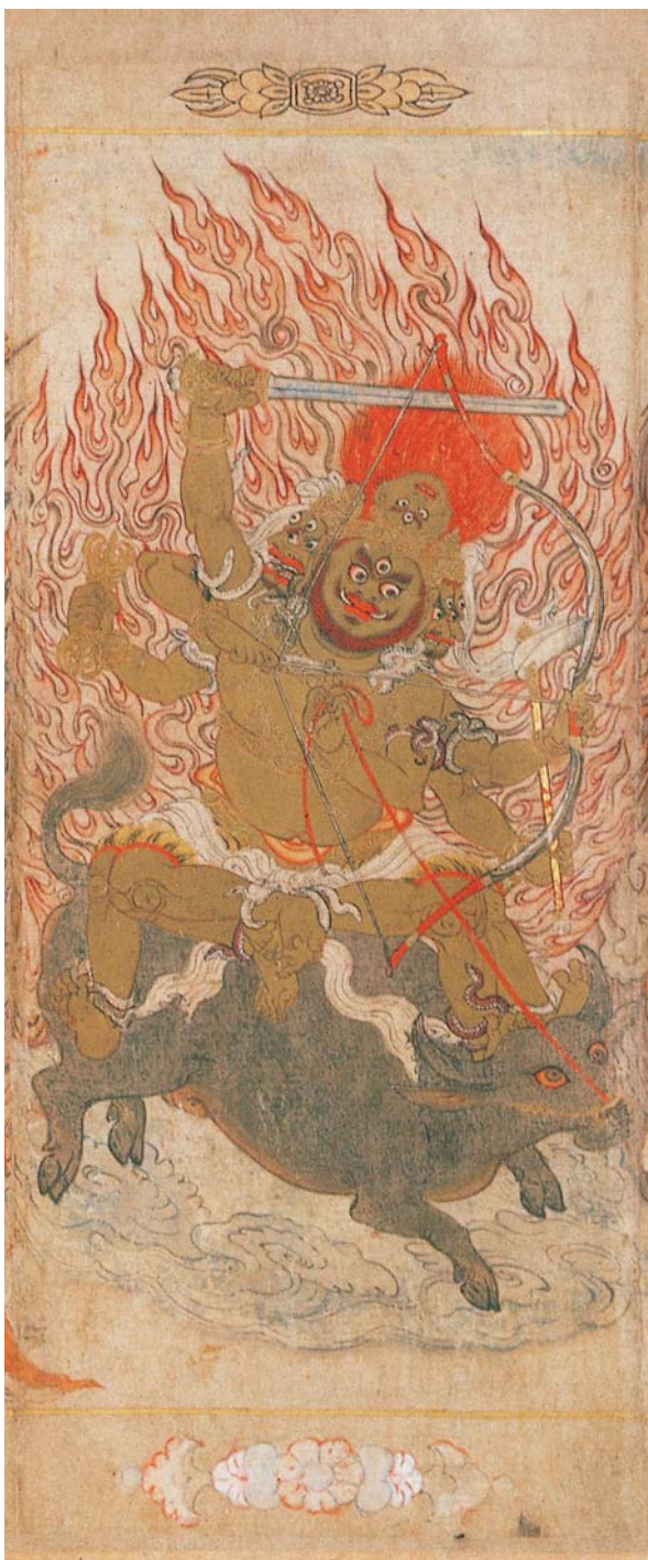
圖十一-1 宋時大理國描工張勝溫畫梵像 局部 國立故宮博物院藏

明、清兩代有很多和牛有關的笑話，例如《笑林廣記·古艷部》有一篇〈哭麟〉：「孔子見死麟，哭之不止。弟子謀所以慰之者，乃編錢掛牛體，告曰：『麟已活矣。』孔子觀之曰：『這明明是一隻村牛，不過多得