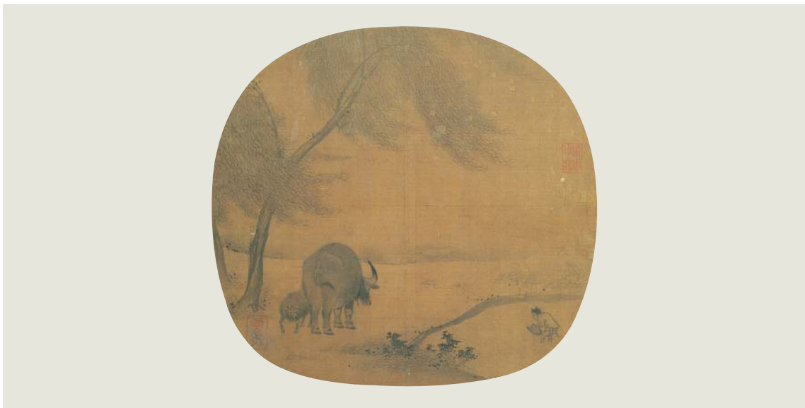
圖四 無款 風林散積 《紈扇畫冊15》 國立故宮博物院藏