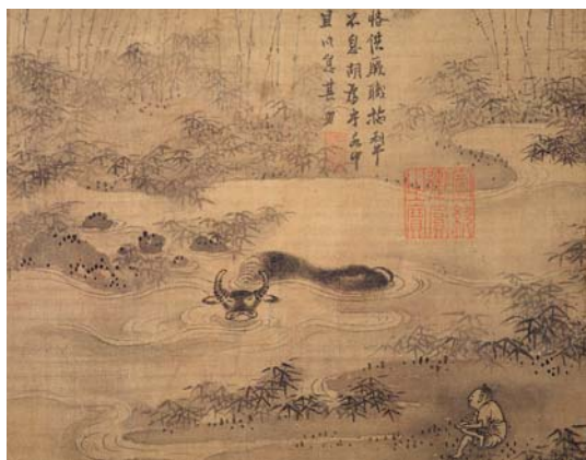
8-10 第十幅。恪供厥職。拖犁不息。胡為乎水中。且以息其力。