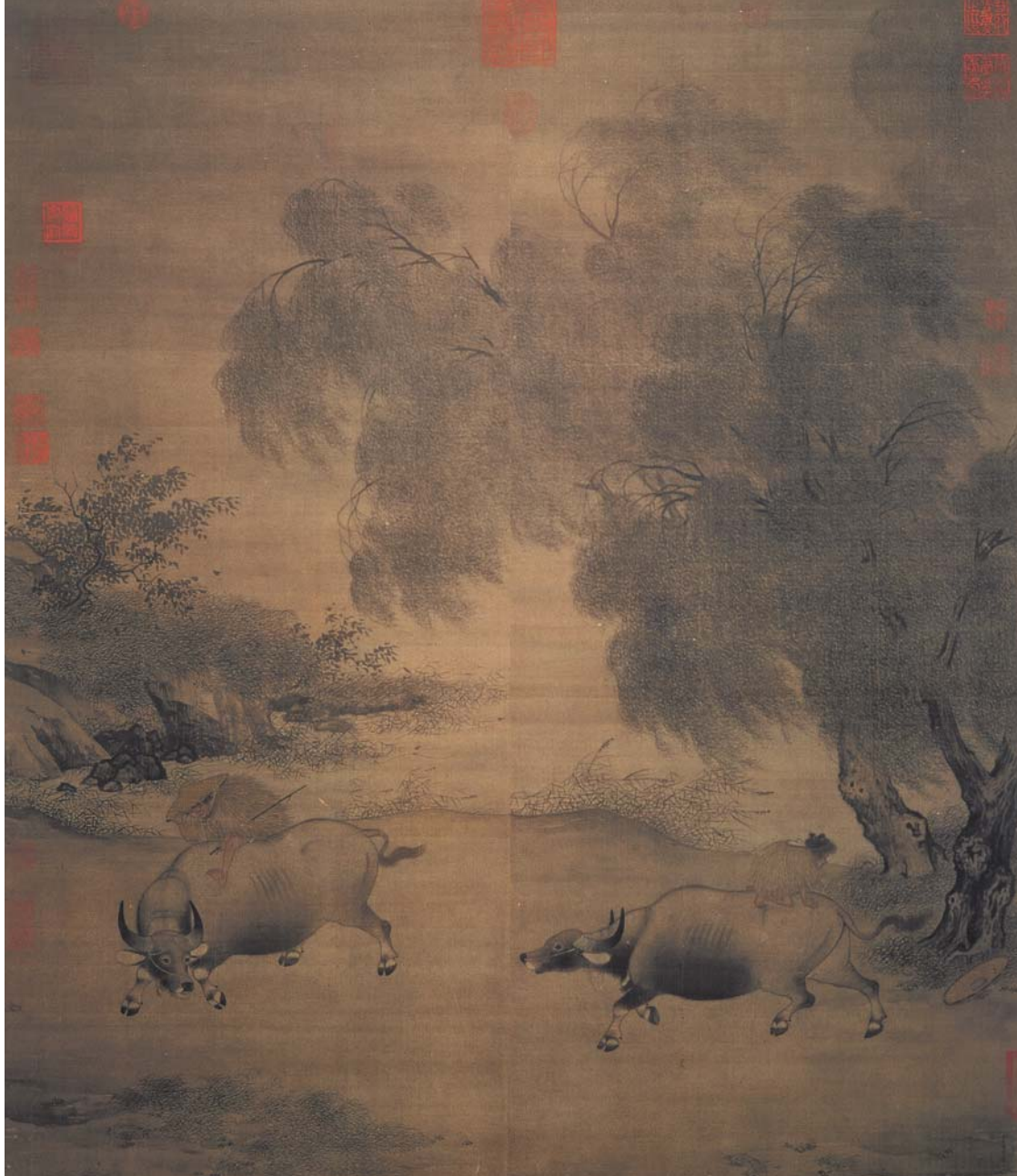
圖一 宋 李迪 風雨歸牧 國立故宮博物院藏

最高的祭品，以牛祭祀可感神靈，而祭祀用牛的選得挑過。《論語》：「子謂仲弓曰：犁牛之子，騂且角，雖欲勿用，山川其舍諸？」《禮記·曲禮》稱：「天子以犧牛，諸侯以肥牛，大夫以索牛，士以羊豕。」古代用來形容牛花色的字彙很多，「騂」指牛的毛色純紅，純白的牛稱「犧」。祭祀以純色的牛為上，而不用毛色駁雜，頭角不端正對稱的牛。《康熙字典》對於毛色不同的牛也有不同的稱呼：黃牛帶虎紋的叫「徐」、黑嘴唇的叫「惇」；稱其他顏色的牛黑嘴唇的為「桴」、黑耳朵的為「羴」、腹部黑色的叫「牧」；白脊梁的牛叫「犗」或「犗」，白黑雜毛的牛則稱作「犗」。