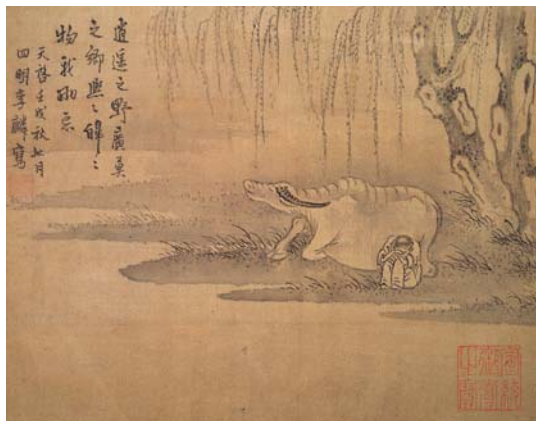
8-12 第十二幅。逍遙之野。廣莫之鄉。熙熙皞皞。物我兩忘。天啓壬戌（1622）秋七月四明李麟寫。