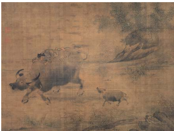
圖六 宋 李唐 乳牛圖 國立故宮博物院藏