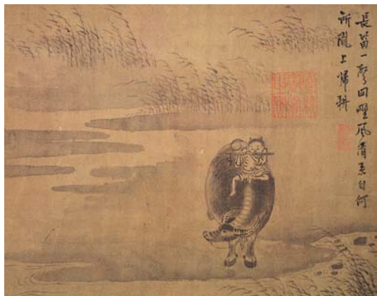
8-8 第八幅。長笛一聲。回野風清。來自何所。隴上歸耕。