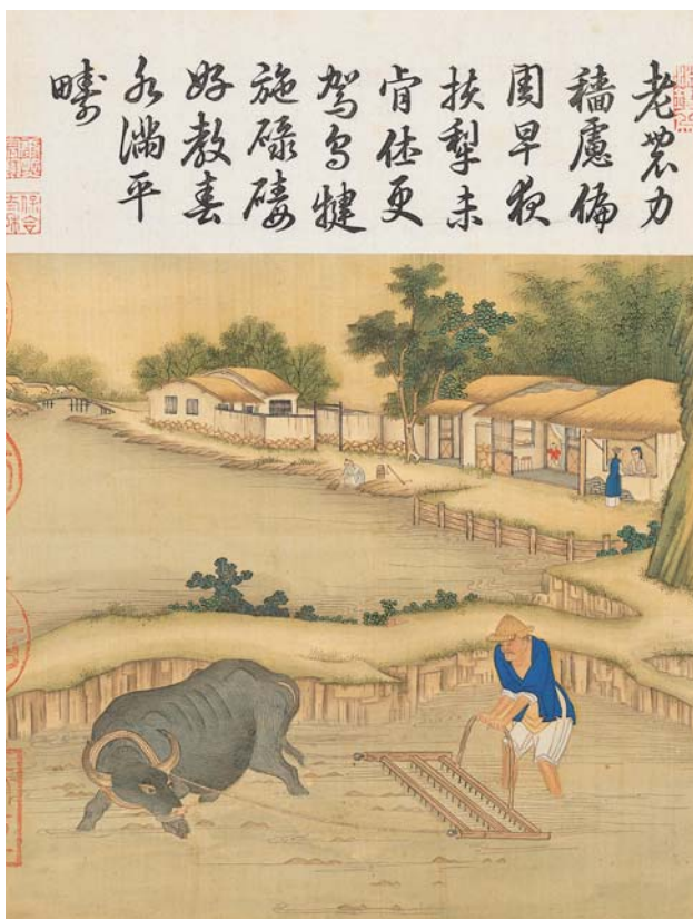
圖三 清 冷枚 耕織圖 碌碡 國故宮博物院藏