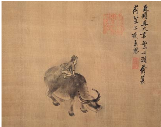
8-4 第四幅。既碩且大。亦繁以滋。荷簍荷笠。爾牧來思。