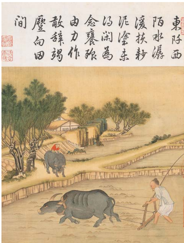
圖二 清 冷枚 耕織圖 紗 國故宮博物院藏