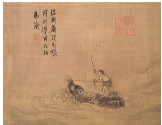
8-5 第五幅。深則厲。淺則揭。用以涉川。非汝弗濟。