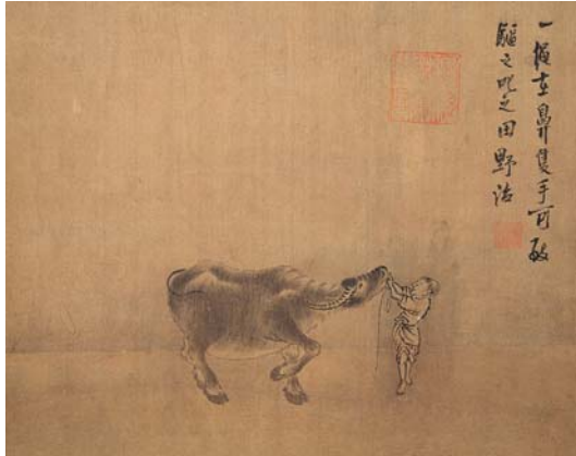
8-2 第二幅。一繩在鼻。隻手可致。驅之叱之。田野治。