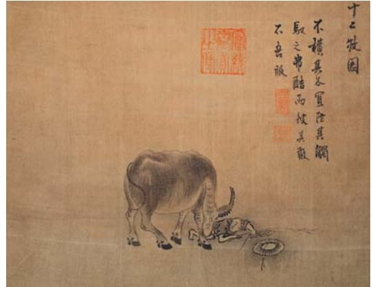
8-1 第一幅。不橫其木。宜防其觸。馭之弗酷。而彼其敢不吾服。