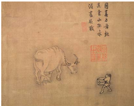
8-11 第十一幅。用其力。毋缺其食。山澗水湄盡厥職。