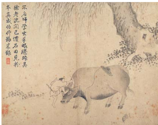
圖五 明 錢穀 牛牧 《雜畫冊4》 國立故宮博物院藏

動力，幾乎各朝各代都有法令禁宰耕牛，因此章回小說《水滸傳》裡面只有「黑店」才敢賣牛肉。吃草的牛從不和人爭食米穀，照顧起來也不花太多功夫，可種田有牛幫忙，從耕、耙、耨、耖（圖二）、碌碡（圖三）、到收成運穀，都可節省大量人力，因此對古早時代的農民來說，養條牛來助耕實在划算無比！