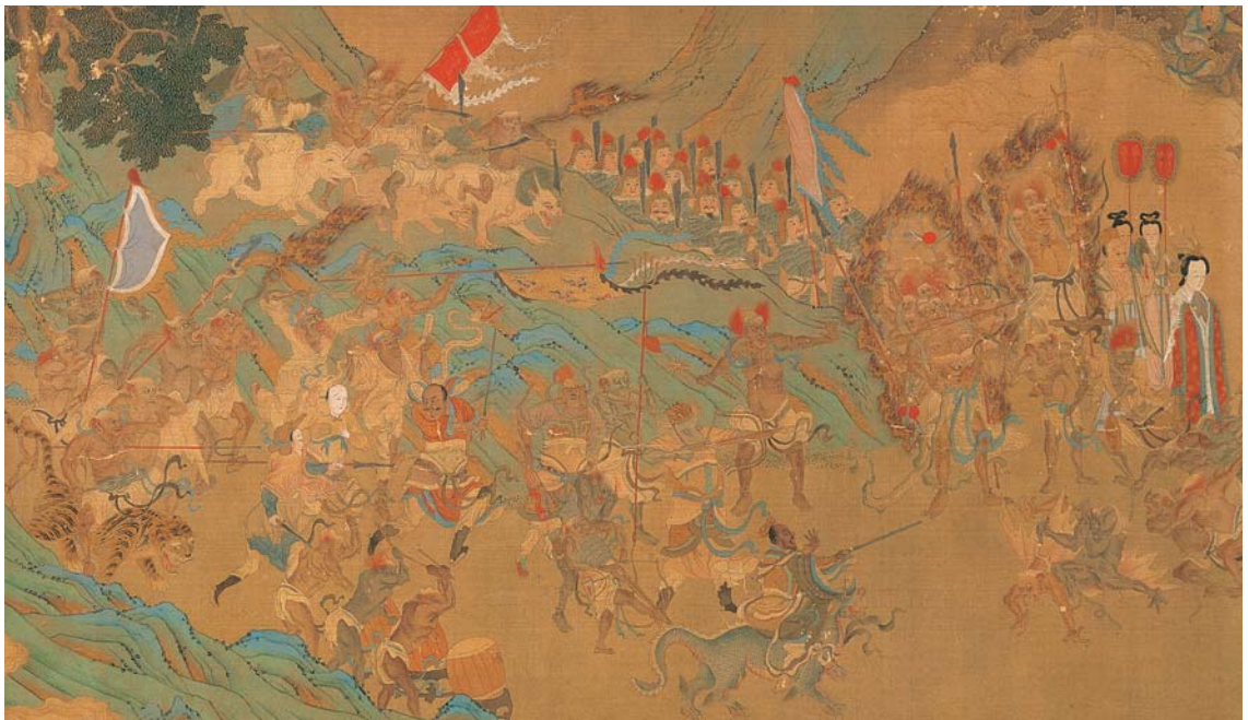
圖十二 明 仇英 揭鉢圖 局部 國立故宮博物院藏