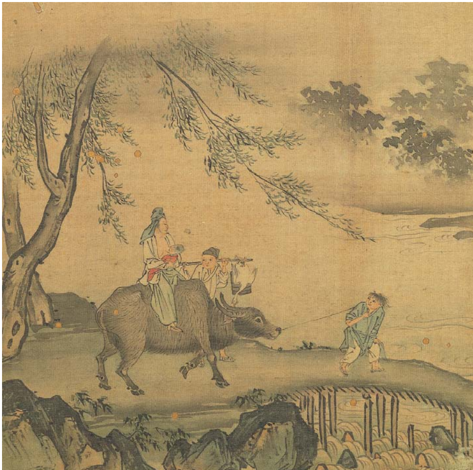
圖十 明 戴進 太平樂事 騎牛 國立故宮博物院藏

隻手還拿了個包子意猶未盡的吃著，應該是村中哪裡請客席散之後的一景。同冊第二幅作品「騎牛」（圖十），描繪的似乎是全家騎牛出門探