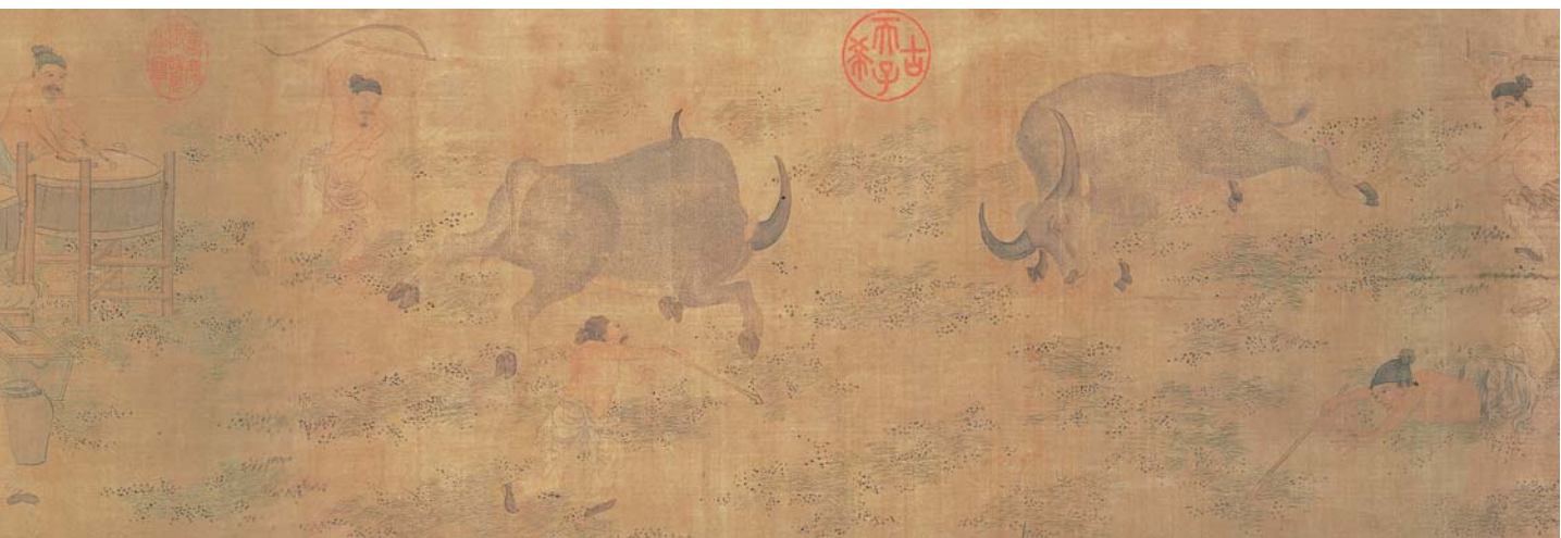
圖十四 傳宋 劉松年 鬥牛圖 局部 國立故宮博物院藏