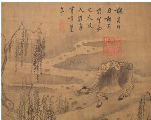
8-9 第九幅。聽其自然。相安於無事之天。牧人乃夢。實唯豐年。