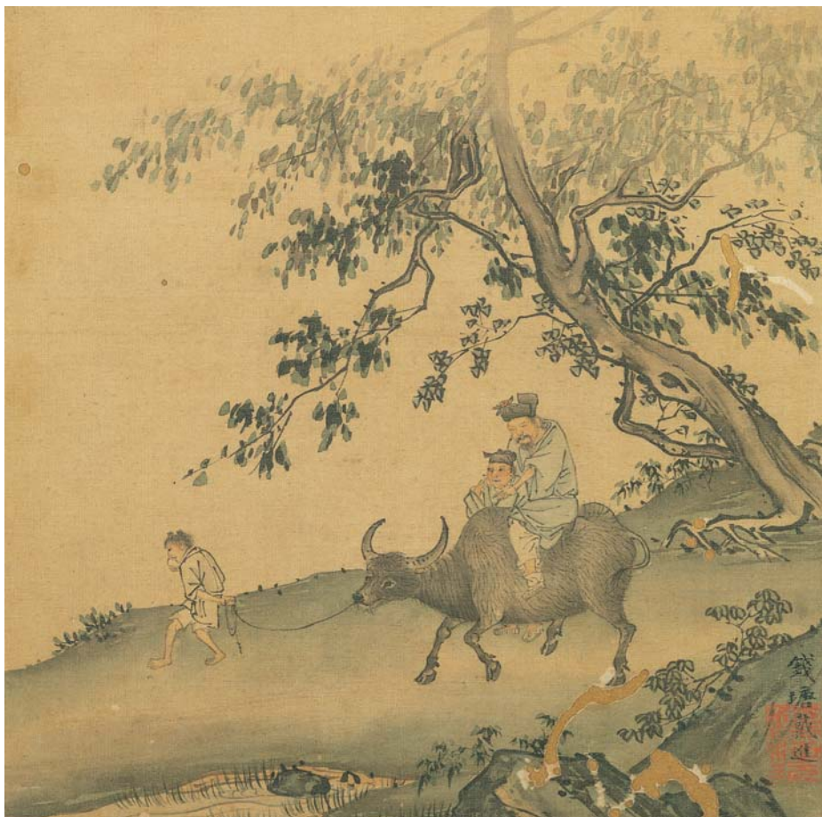
圖九 明 戴進 太平樂事 牧歸 國立故宮博物院藏

第五幅「非汝弗濟」(圖八之五)畫的是人與牛同心協力的合作渡河。圖中起伏的水紋與激起的波濤暗示著此處水域的湍急洶湧，但儘管流急水