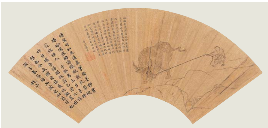
圖十五 明人 力大如牛 《明人書畫扇》 國立故宮博物院藏