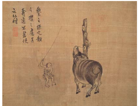
8-3 第三幅。繫之維之。鞭之撲之。慮其奔逸。不若使之以時。