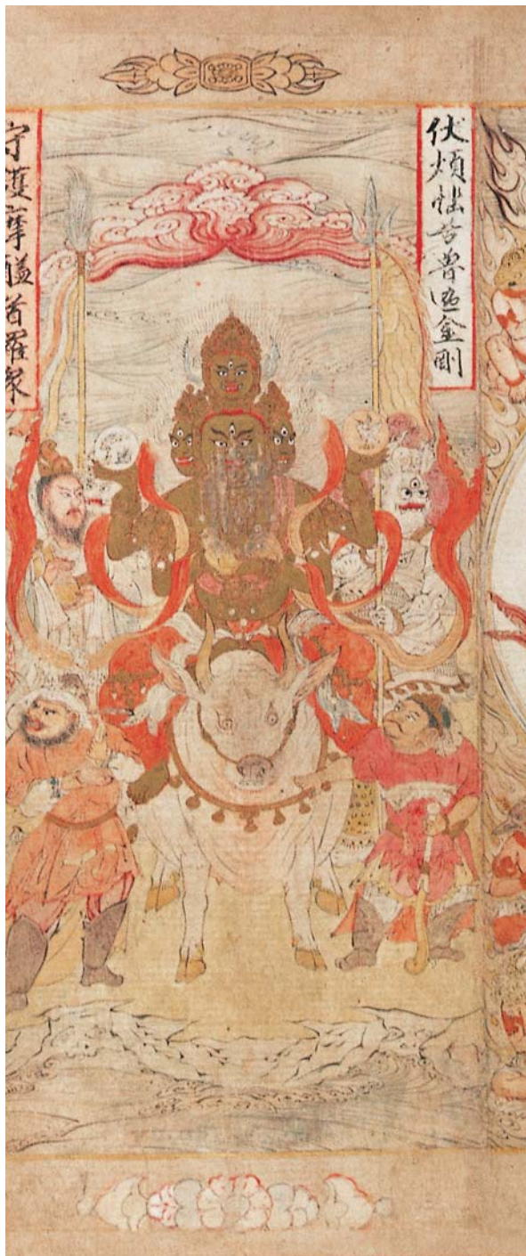
圖十一-2 宋時大理國描工張勝溫畫梵像 局部 國立故宮博物院藏

曰：『此啓南幼時作也。家居相城，村野荒濱，人多橫逆，因作此自慰。』歸而撫其意，形頗似之，寫於箒頭，以待龐然者贈之。甚可。時嘉靖二年（一五二三）四月也。晉昌唐寅。」 祝允明的題則是：「傳寫何如太逼真，筆精墨妙實堪珍。偶然醉寤朦朧覩，恍若桃花塢裡人。予與君三月未晤。昨自橋李歸，聞採薪已愈，心始慰也。今承贈佳搖，展玩難置，因