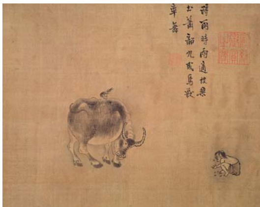
8-6 第六幅。時雨時雨。適彼樂土。簫韶九成。鳥獸率舞。