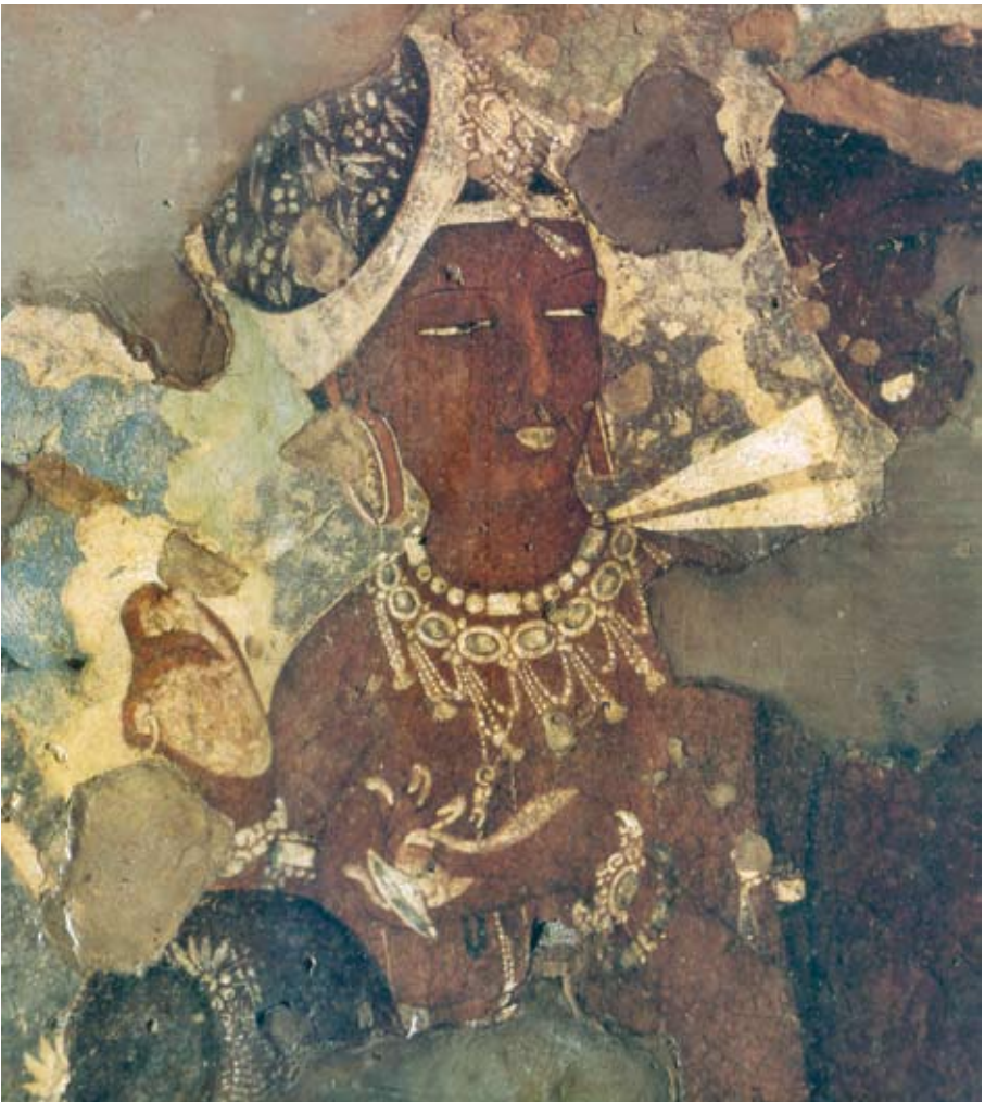
圖十 有著細長眼睛、珠寶裝飾一身的天女，印度阿姜塔石窟第17窟