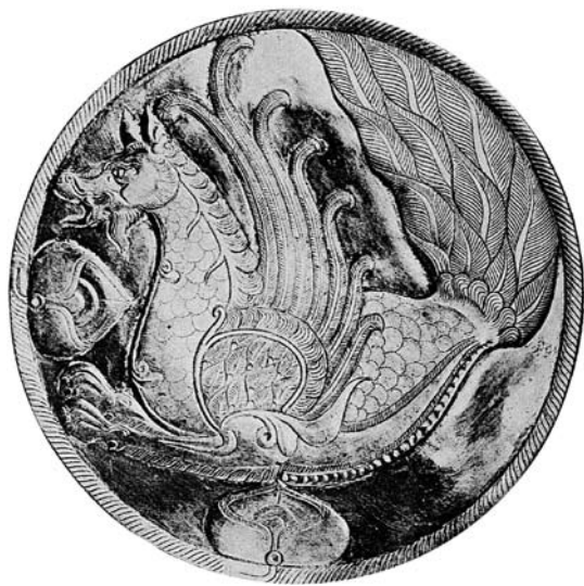
圖四 薩珊銀盤，列寧格勒冬宮博物館收藏。

通達三個天界，另一方面與農業文化有關，它四處撒播宇宙樹的種子而使大地富饒豐收，總之人們相信此怪獸擁有摧毀邪惡大蛇的力量。由於森姆獸是想像出來的，所以藝術表現上並沒有固定的造型，如薩珊銀盤的森姆獸（圖四）有狗的耳朵與鼻嘴，下顎長著麝香鹿的鬍鬚，翅膀彎翹上揚，身體像鳥也像鹿，前肢粗壯如獅爪，又有碩大而美麗的孔雀尾巴。而六、七世紀薩珊