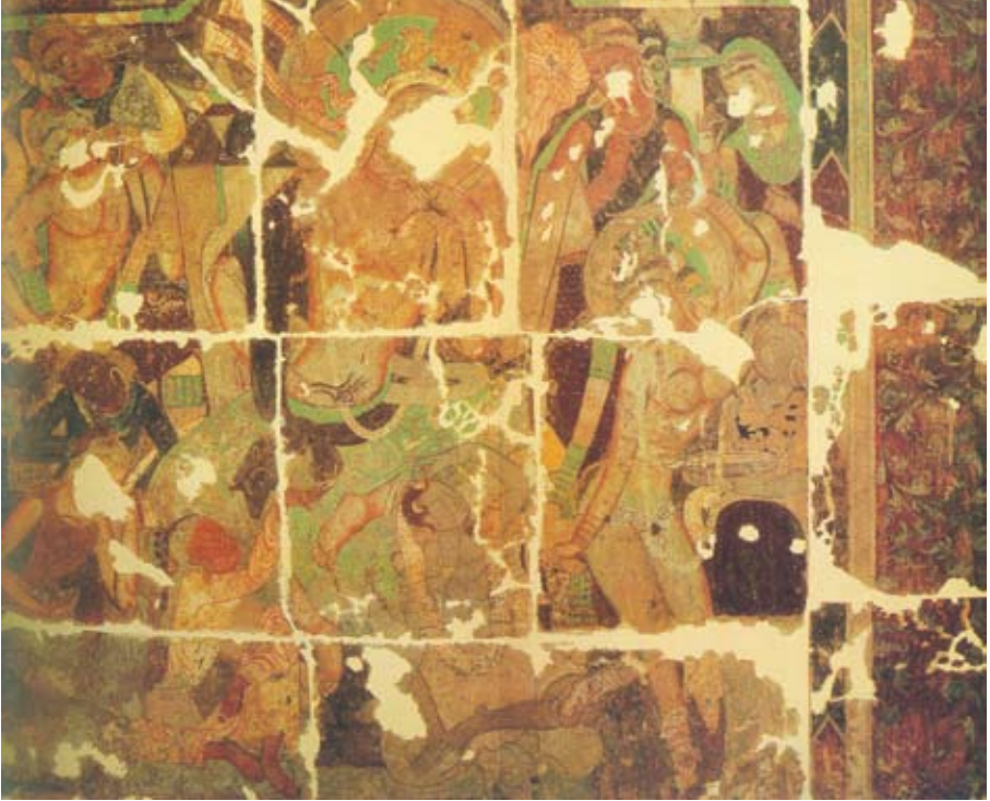
圖九 仙道王與王后故事壁畫中美好腰身的女性造型，新疆庫車克孜爾石窟第83窟。德國柏林印度藝術博物館藏