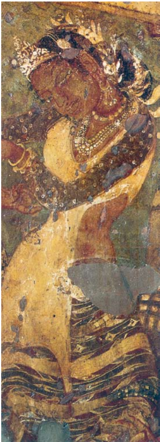
圖十一 強調細長眼睛、美好腰身、珠寶裝飾一身的印度美女造像，阿姜塔石窟第1窟壁畫。