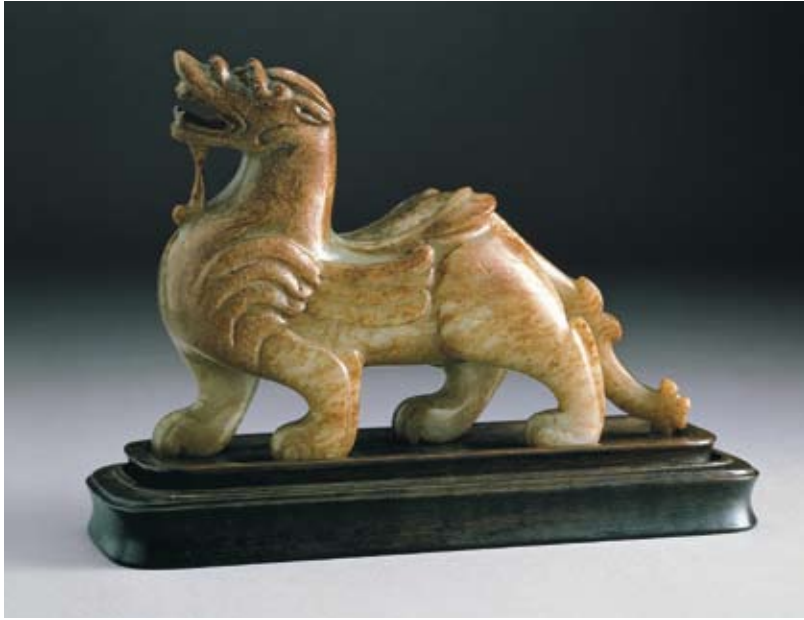
圖一 漢代 玉辟邪 國立故宮博物院藏

易、信仰傳播、版圖兼併、軍事戰爭，彼此接觸、衝突與學習，終至各文化間呈現出你中有我，我中有你的交融現象。雖然有些民族與文化現已消失或式微，但考古出土與文獻資料，留下不少見證交流的點點