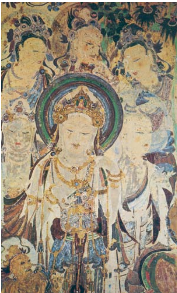
圖八 有著細長眼睛、美好腰身、珠寶裝飾一身的敦煌菩薩造像，敦煌莫高窟第57窟壁畫。