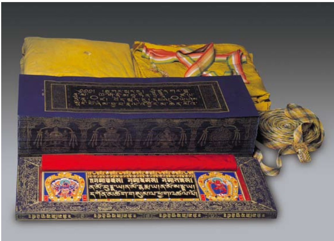
圖十二 康熙朝藏文《龍藏經》 國立故宮博物院藏

女，而在講求禪定寧靜的印度卻以連天神的心都被擾亂來形容，可見其美麗。而這樣的美女除有著吉祥天女般細長的眼睛外，其動人的身材、美好的腰身，更是特別被歌頌的：