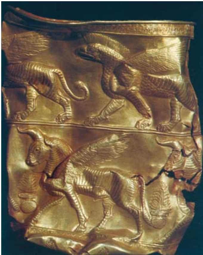
圖二 西元前兩千年裝飾以鷹獅造型之波斯古金器，伊朗Gilan省Marlik墓葬出土

易、信仰傳播、版圖兼併、軍事戰爭，彼此接觸、衝突與學習，終至各文化間呈現出你中有我，我中有你的交融現象。雖然有些民族與文化現已消失或式微，但考古出土與文獻資料，留下不少見證交流的點點