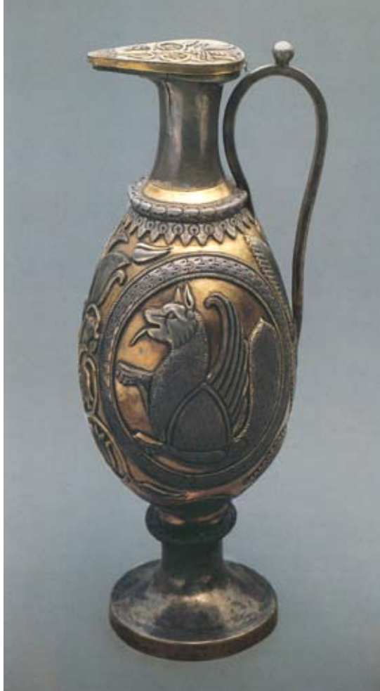
圖五 薩珊（或粟特）水罐 西元六至七世紀，列寧格勒冬宮博物館收藏。