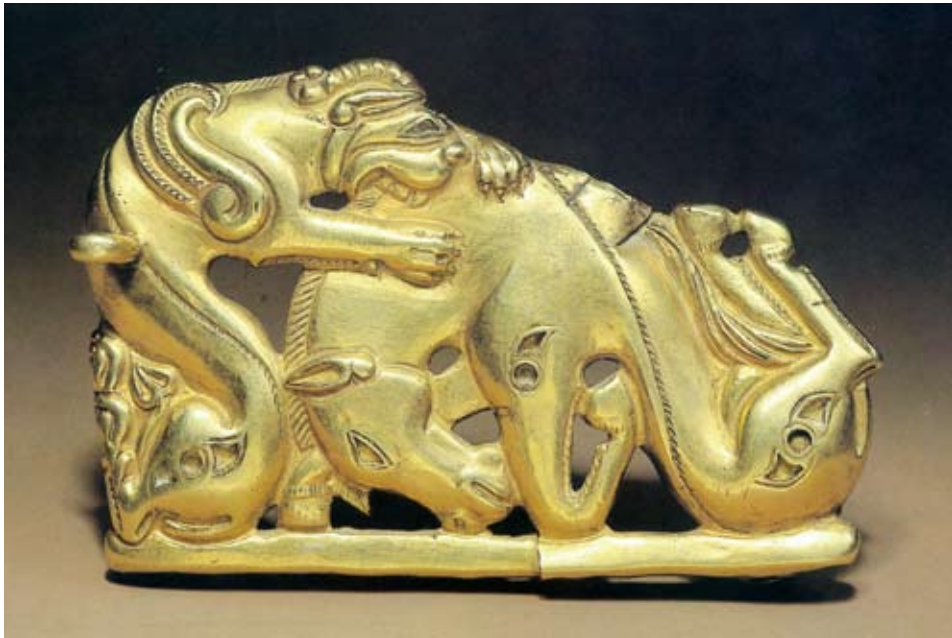
圖三 斯基泰—西伯利亞動物風格造型的金飾片，裝飾中的鷹獅造型頭上長角並帶翅膀，西元前四世紀，列寧格勒冬宮博物館彼得大帝西伯利亞收藏。

種造型最早更可溯源埃及古王朝（約B.C.2649-B.C.2150）的皇室雕刻藝術。鷹獅雖然在各地區呈現出不同的造型，但