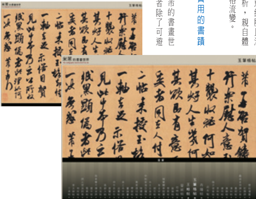
以互動伸縮方式隱沒在視窗下方的作品選單

的入口在主頁面的右上方，以泛光的型態來吸引著觀者進入窺究。進入書蹟資料庫中，首先映入眼簾的是具大器的作品展現，頁面中的作品選單以互動伸縮的方式，隱沒在視窗下