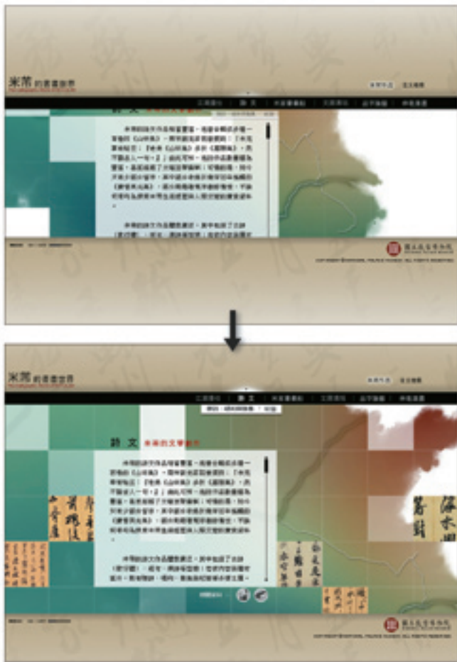
運用「開啟」的視覺效果，展開了米芾世界