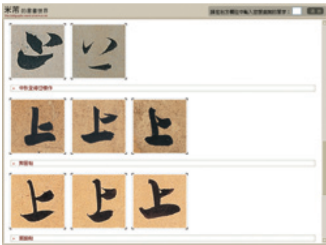
「字跡排比」功能，可同時比較欣賞米芾字跡的多種樣貌