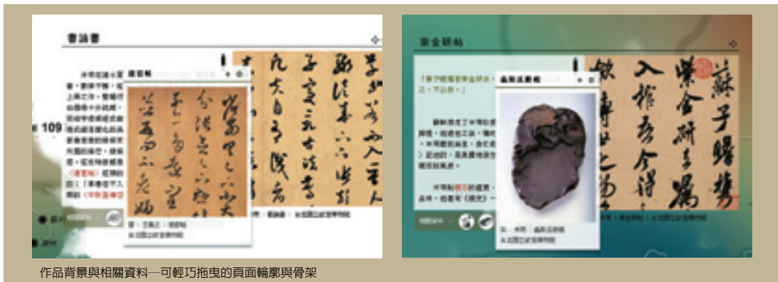
作品背景與相關資料—可輕巧拖曳的頁面輪廓與骨架