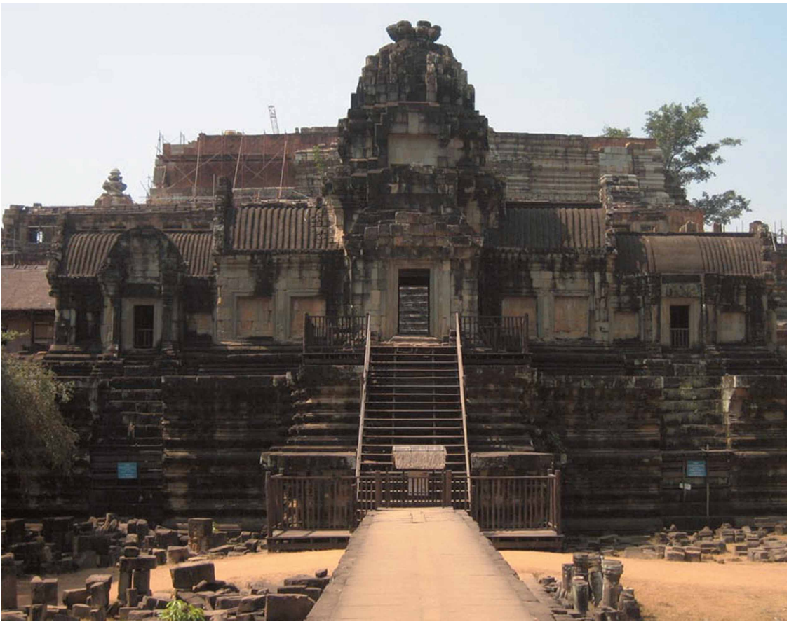
正進行整修中的巴芳寺（Baphuon）