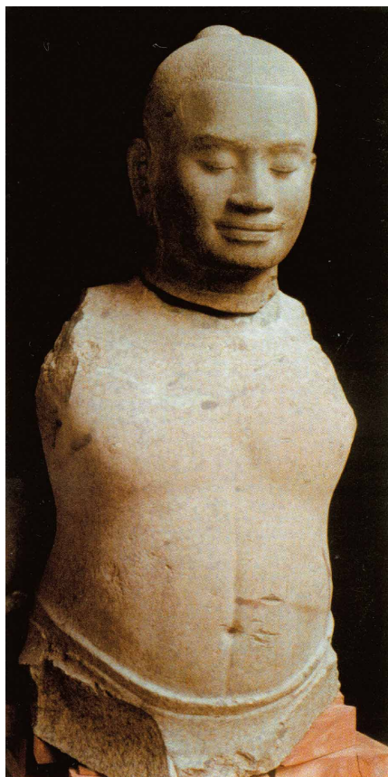
金邊國立博物館修復工作坊修復完成後的闍耶跋摩七世像雕像。

對於文明的殘酷，人類靠自己 的力量創造燦爛輝煌的文明， 也在彼此的惡鬥下摧毀一切。 為保存過去的記憶，人們得花 更多的心思去修補、拼湊歷史 的片段。望著已修復的闍耶跋 摩七世的雕像，那段未填補的 刻痕，不僅是修復師依據修復 原則所留下足以辨識的痕跡， 似乎也意在提醒世人，在歷史 的洪流中，記憶或許會隨時間 消逝，但文物卻會忠實紀錄每 一個歷程。