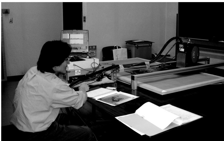
圖二 手提式X光螢光分析儀應用於繪畫顏料組成元素分析上

文物內在可能蘊含豐富的人類文明發展的證據，此外可能因為自然或人為因素的影響產生內部的損傷，X光攝影對於判讀文物的內部訊息有相當大的助益。東文研近來應用工業用富士電腦放射線攝影系統（Fuji Computered Radiography, FCR），不必再像傳統一樣使用X光底片，改採塗上特殊螢光體的感光片進行攝影，照完X光後，將感光片插入一特殊插槽，細微的雷射光束照在螢光體上，就會發射對應X光的螢光，並可以馬上列印出底片或數位圖像，若是大件文物分次攝影，也可以使用後續的電腦處理，將數次攝影的圖像組成一張完整的影像，因此後置處理或複製作業變方便了，當場亦可以將圖像分送給物件擁有人或共同研究者，不過在智慧財產權的管理上則要更加謹慎。此放射線攝影系統，大大提高X光攝