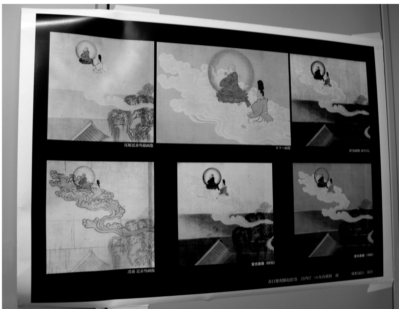
圖一 多波域光源應用於繪畫分析上，不同的光源處理可獲得不同影像

過濾磷光，不同的材質如紙張、顏料等，可能因為質與量的差異得到不同的螢光反應，顯現材質的差異性（如圖一）。過去紅外線攝影對於油畫的攝影分析應用較多，但是因為油畫的繪畫層較厚，僅能使用反射性紅外線攝影，但是東方繪畫顏料層較薄，所以使用透射性紅外線攝影可以有特殊的解析效果。