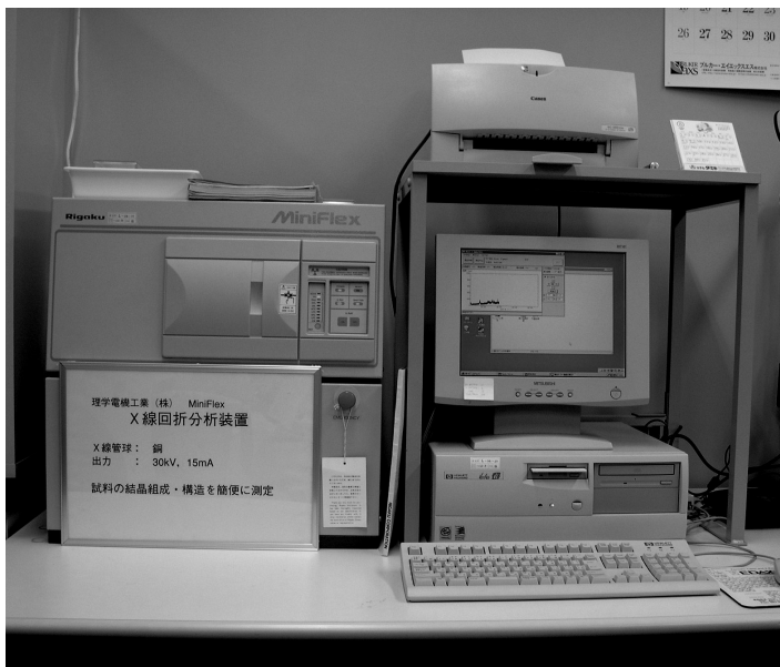
圖四 桌上型X光繞射分析儀，正在分析礦物性顏料

非破壞檢測仍是保存科學家優先的選擇。近年來非破壞檢測儀器解析度大大提高，保存科學家們躍躍欲試。東文研在五年前開始嘗試使用非破壞性手提式X光螢光分析儀（XRF），此儀器可以分析分子量大於鉛的元素，所以礦物性顏料富含的元素，可以作為材質成分鑑定的初步判斷（如圖二、三）。近來重要的研究案例如「源氏物語」顏料的科學分析，在作品上發現的白色顏料竟然有四種之多，有含鉛、含鈣、含汞者，還有一種白色顏料無法以螢光分