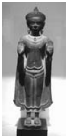
圖十 裝飾佛立像 青銅 十二世紀 柬埔寨 吉美博物館藏品

十三世紀中葉泰族中的一支擺脫吉蔑人統治，建立素克泰王國（一四三二八）。錫蘭上座部的高僧曾至素克泰王國開戒傳法，十四世紀時，素克泰的僧侶也曾赴錫蘭朝聖，大乘和密教逐漸為人所遺忘，錫蘭與泰國素克泰佛教關係密切。十四、十五世紀素克泰美術發展成熟，常見結跏趺坐佛作觸地降魔印，肉髻頂上有火焰式飾物，螺髮緊密，臉呈鵝蛋形，下頷