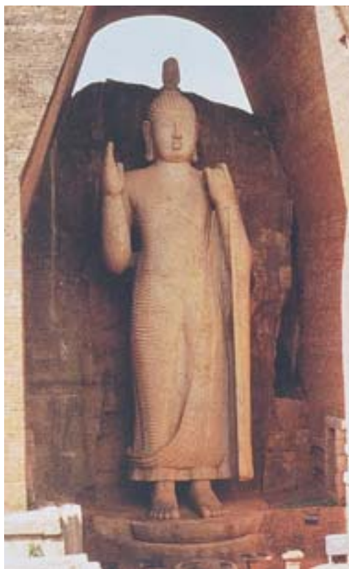
圖二 佛立像 石 八世紀 Avukana, Sri Lanka