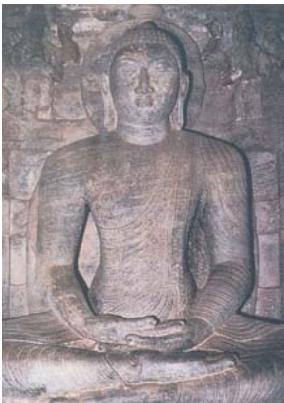
圖三 佛坐像 石 十二至十三世紀 Gal Vihāra, Sri Lanka

分裂時期 (Divided kingdom period, 1111-1159) 由於沒有統一的強大勢力，各地也沒有統一的風格，出現一種模仿阿梵堪那 (Avukana) 大佛的樣式，但是對於平行衣褶下的身體質感描寫不多，較方形的臉和彎曲的右手，顯得強悍有