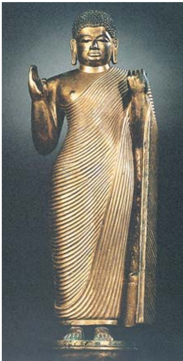
圖四 佛立像 青銅鍍金 十五世紀 高53公分 Sri Lanka