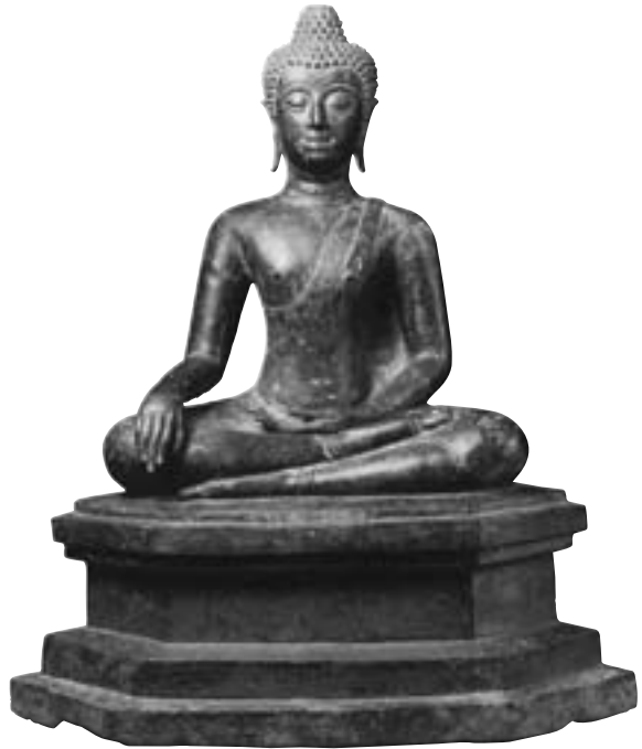
圖十一 釋迦牟尼佛坐像 青銅 高60.5公分 十三~十四世紀 泰國 何忠雄先生收藏

十)，除了鼻子較為秀氣，鼻翼較窄，臉部神情線條較柔和。十三世紀中葉泰族在長期遷徙後，終於佔據吉蔑人在泰國的原居地，十三世紀末又把居住在泰國北部的蒙族趕走，泰國的歷史進入以泰族文化為主導的新階段。