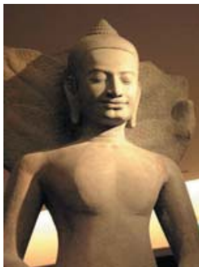
圖八 龍王護佛坐像 石 十二至十三世紀 柬埔寨 吉美博物館藏