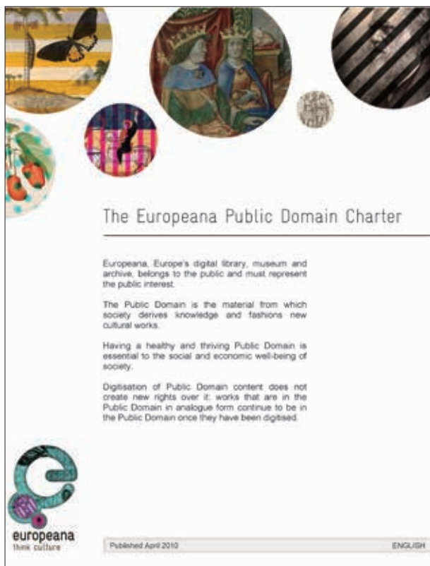
圖2 Europeana公共領域憲章封面 取自 https://pro.europeana.eu/post/the-europeana-public-domain-charter ，檢索日期：2018年6月12日。