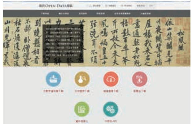
圖1 故宮Open Data專區首頁 取自 https://theme.npm.edu.tw/opendata/ ，檢索日期：2018年6月14日。

權法保護期間之作品即應進入公共領域，而不應再享有著作權法保護，且進入公共領域之作品，原則上不會因單純科技方法或契約條件的附加而重新受到著作權保護，任何人皆可自由地再為利用，並認為如此才能使公共領域真正發揮公共及開放的功能。以擁有超過 300 間歐洲典藏機構為成員的歐盟數位典藏平臺 Europeana 為例，其於 2010 年制訂的「公共領域憲章」（Public Domain Charter）即揭示此一概念，而隨著 Europeana 的會員數增加，此種價值亦逐漸成為歐洲典藏機構的共識。 13 （圖 2）而在美國方面，司法實務普遍認為攝影者若就真跡的拍攝被要求與真跡準確相符（absolute fidelity），亦即忠實且完整地複製真跡時，在拍攝角度、光影呈現等方面即無太多自行決定的空間，也難以對照片的呈現有任何增添、修補、轉化等其他出於攝影者本身的貢獻，在此情況下所拍攝的照片即欠缺原創性，因而不受著作權法保護。就法律角度而言， 14 此一立場之明確，較容易促使美國典藏機構釋出不受保護之典藏品照片。