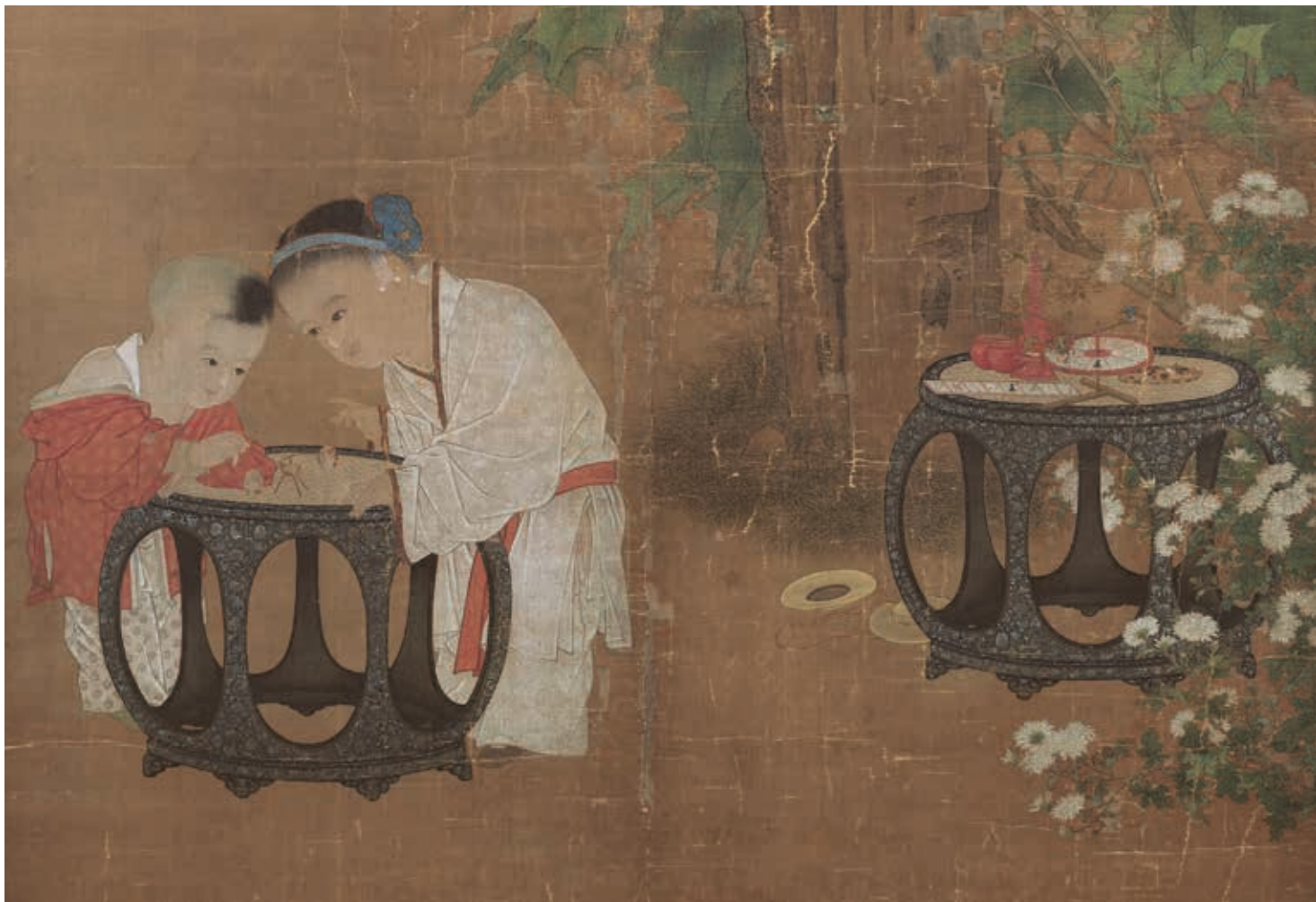
宋 蘇漢臣 秋庭戲嬰圖 軸 局部 國立故宮博物院藏 國寶 故宮暫行分級