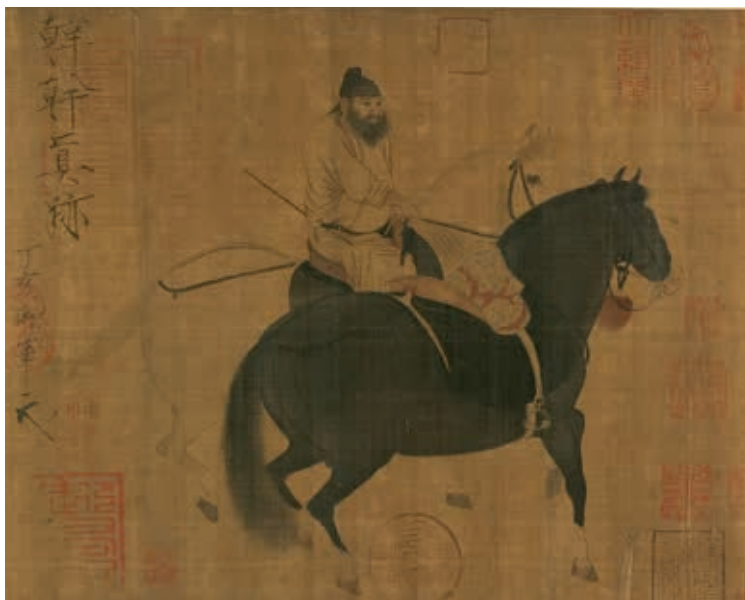
唐 韓幹 牧馬圖 冊頁 國立故宮博物院藏 國寶 故宮暫行分級