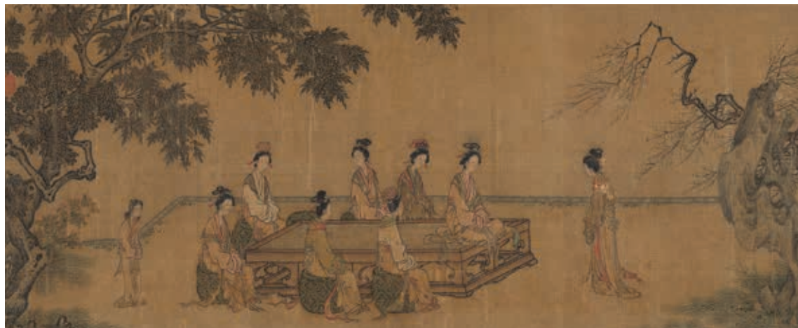
宋 高宗書女孝經 馬和之補圖 卷 局部 國立故宮博物院藏 國寶 故宮暫行分級

畫轉型時期的發展。 宋代宗教繪畫的成就，立基於唐代的傳統而續有發展，流傳作品中，不乏令人驚嘆的傑作。宋人畫〈如來說法圖〉，為