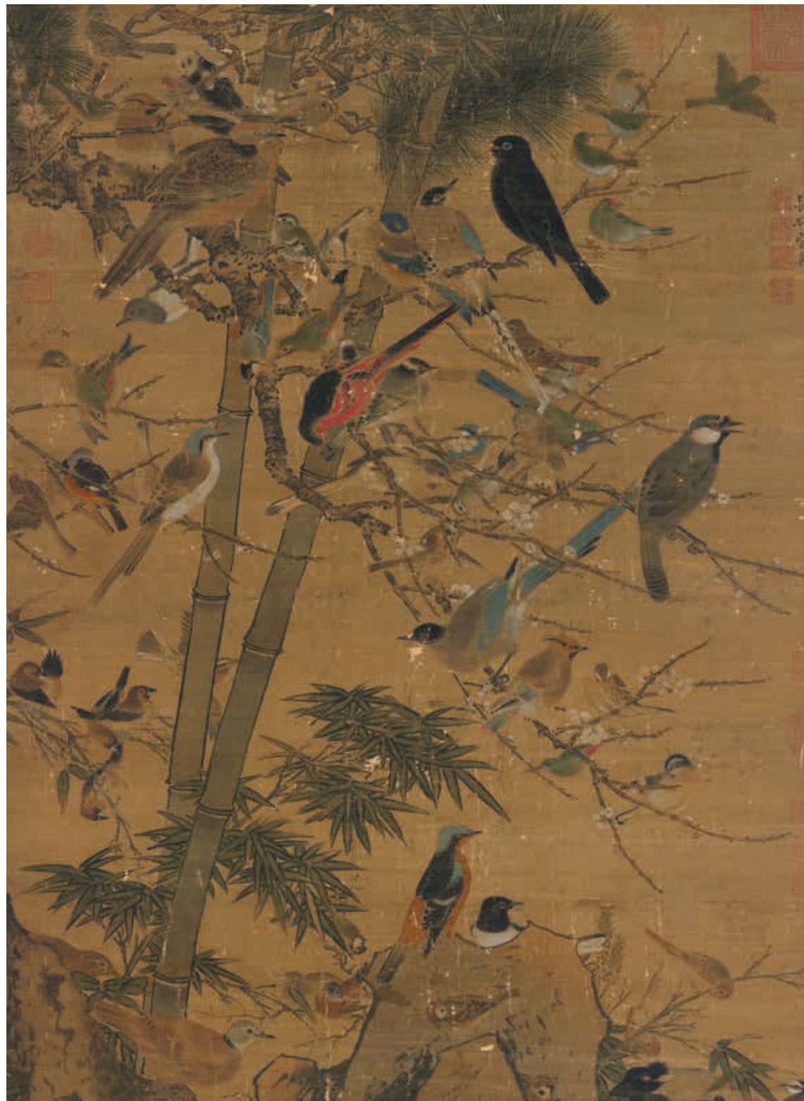
明 邊文進 三友百禽圖 軸 局部 國立故宮博物院藏 國寶 故宮暫行分級