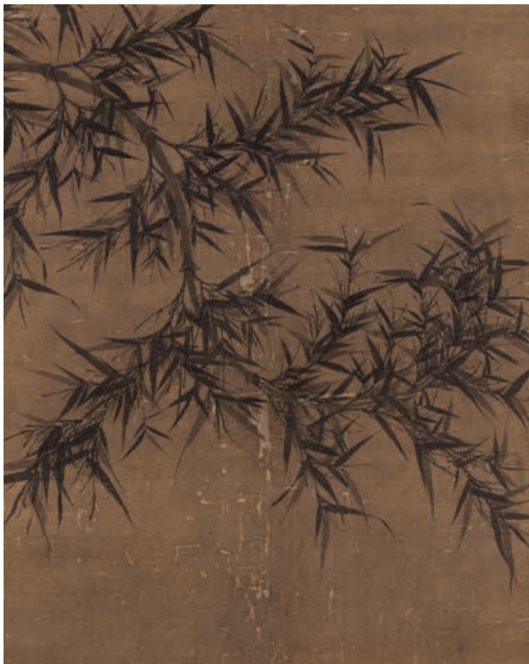
宋 文同 墨竹 軸 局部 國立故宮博物院藏 國寶 2012年3月核定公告

式。題籤是徽宗（一一〇〇～一一二五在位）的瘦金書，作品四周並鈐有宋、金及元明清重要收藏印。本件雖係唐代的雙鉤填墨本，但仍保有用筆縱放與連綿順暢的特質，是理解王字草書的佳例。 本展中，時代最早的繪畫為唐人〈宮樂圖〉，原本在《石渠寶笈》和《故宮書畫錄》均被列為元人，爾後經過幾次的考訂，於二〇一二年報文化部的資料中，已改定為唐代，較諸初始的地位大大提昇。