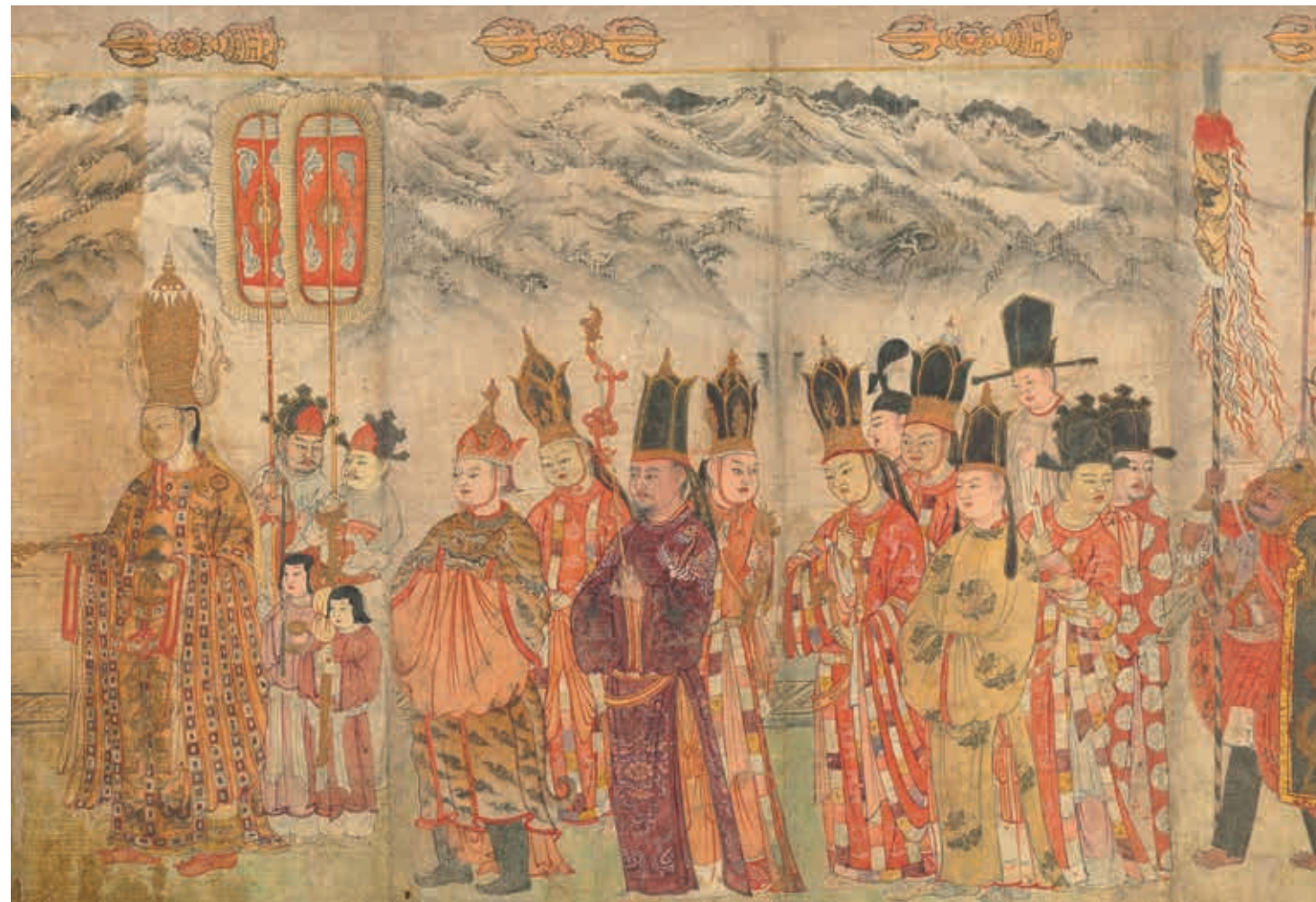
大理國 張勝溫 畫梵像 卷 局部 國立故宮博物院藏 國寶 2012年3月核定公告

高克恭〈雲橫秀嶺〉是其過世前一年所繪，足以反映其山水畫純熟階段的面貌。畫幅格局恢宏、主山堂堂，延續北宋巨障山水的傳統。中景假雲嵐烘染，將畫面分隔為二，搭配前景曲折的河道，展現一派米家山水溫潤的氛圍。作者巧妙融合五代董、巨及兩宋諸家的風格特質，形塑出元代復古式青綠山水畫的風致，此作堪稱典