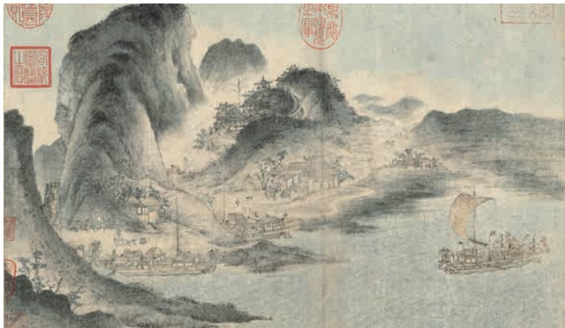
宋人 江帆山市 卷 局部 國立故宮博物院藏 國寶 故宮暫行分級

功的作品。 宋代宗教繪畫的成就，立基於唐代的傳統而續有發展，流傳作品中，不乏令人驚嘆的傑作。宋人畫〈如來說法圖〉，為