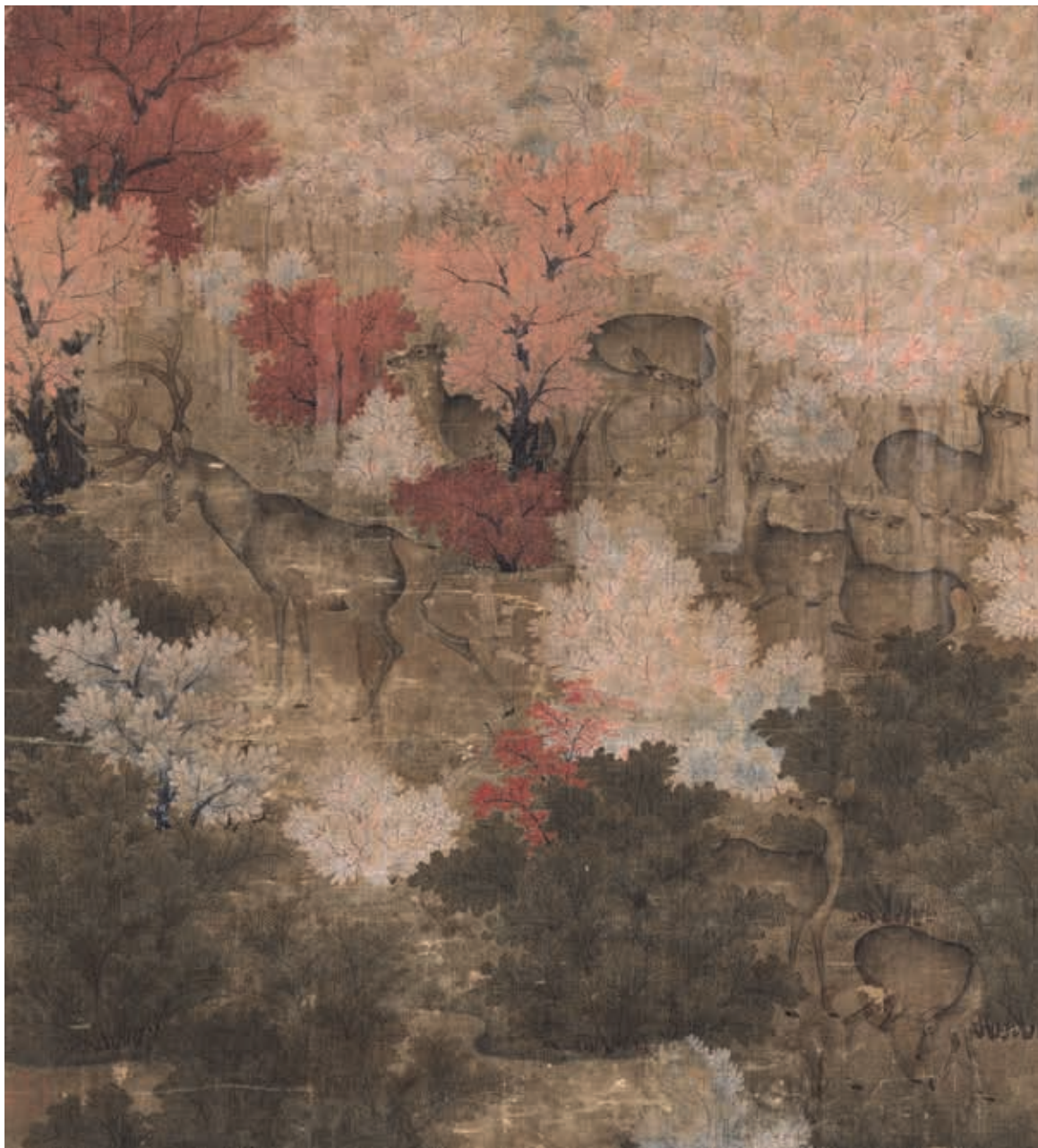
五代人 秋林群鹿 軸 局部 國立故宮博物院藏 國寶 故宮暫行分級

寶數量也最多。〈牧馬圖〉舊傳為唐玄宗（七一～七五六在位）時期的畫馬名家韓幹（八世紀）所作，黑白雙駿與奚官的造型精絕，但因筆致、用色的特點已與唐畫稍異，反而近似於徽宗時代的仿古風格，故推斷應出自北宋末期宣和畫院所摹。 文同〈墨竹〉是早期墨竹畫的名蹟。本幅因右上方有兩方文同印記，而確定作者。上方詩塘另有明代王直、陳循跋語，其中且引述宋人詩文，對文同畫藝多所推