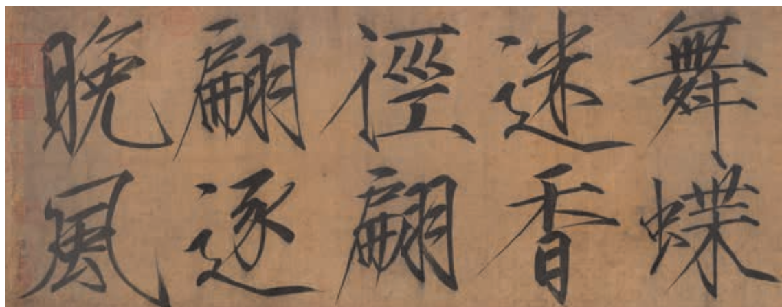
宋 徽宗 詩帖 卷 局部 國立故宮博物院藏 國寶 2012年3月核定公告

重。畫中的一杆倒垂竹，雖純假水墨沒骨畫成，惟對竹子的各種生態，體察入微，於端整規矩中，不失造型與墨色的生動變化，足以代表北宋文人畫家對寫生精神的高度實踐。 宋人〈秋塘雙雁〉為雙拼大軸，時代可置入風格精緻寫實的徽宗畫院，畫中雙鵝憩息在池塘坡岸間，一低首整羽，一引頸翹望，舉凡翎毛、殘荷、蘆葦的描寫，無一不工，極得秋涼蕭瑟的自然生意。 宋代的國寶書法選件，是以〈四家法書〉和徽宗〈詩帖〉二卷為代表。前者包含蔡襄（一〇二二—一〇六七）〈海隅帖〉、蘇軾（一〇三六—一一〇一）〈書次韻三舍人省上詩〉、黃庭堅（一〇四五—一一〇五）〈致明叔同年尺牘〉、米芾（一〇五一—一一〇八）〈道味帖〉等四家名蹟。其中三幅紀年明確，是研究蘇黃米蔡書風的重要標竿。清代將四帖合裝為一卷，益顯珍貴。〈詩帖〉卷是徽宗存世的僅見大字瘦金書法，書五言律詩一首，字字下筆勁利，宛如鐵劃銀鉤，極具視覺的美感。 本次選展的兩宋人物畫，涵括宗教神祇、兒童、宮嬪仕女等，不惟形象多元，也風格互異，足可據以追索宋代人物畫演變的梗概。