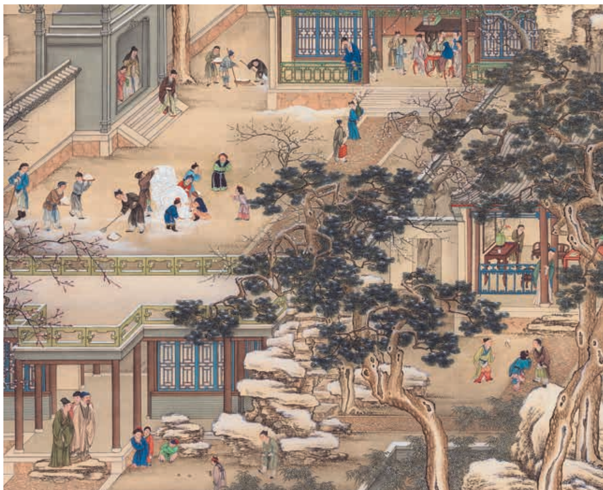
清 畫院十二月月令圖 十二月 軸 局部 國立故宮博物院藏 國寶 2013年12月核定公告