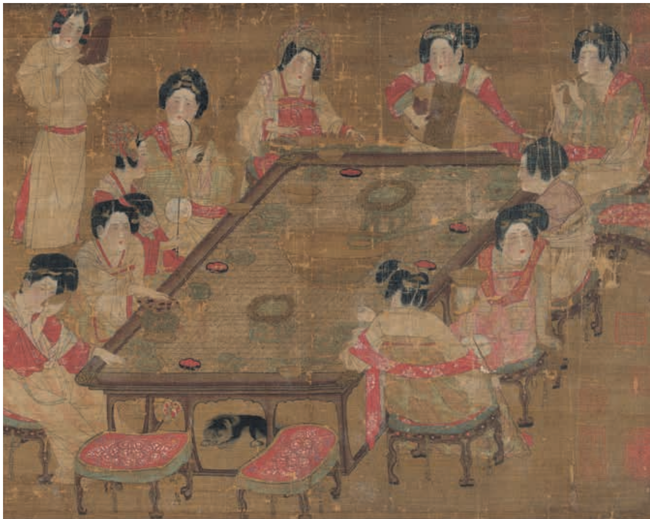
唐人 宮樂圖 軸 局部 國立故宮博物院藏 國寶 2012年3月核定公告

本次展出的精品當中，有廿四件已通過古物審議委員會的審查，並經文化部核定公告。另外廿一件院內暫行分級的名作，由於展出機會較少，迄未進行提報審議。這批作品，將利用本次展期安排古物審議會，以完備指定公告的程序。在展覽說明卡片上，也會根據現行的審查結果，清楚標示出「國寶」、「重要古物」、「故