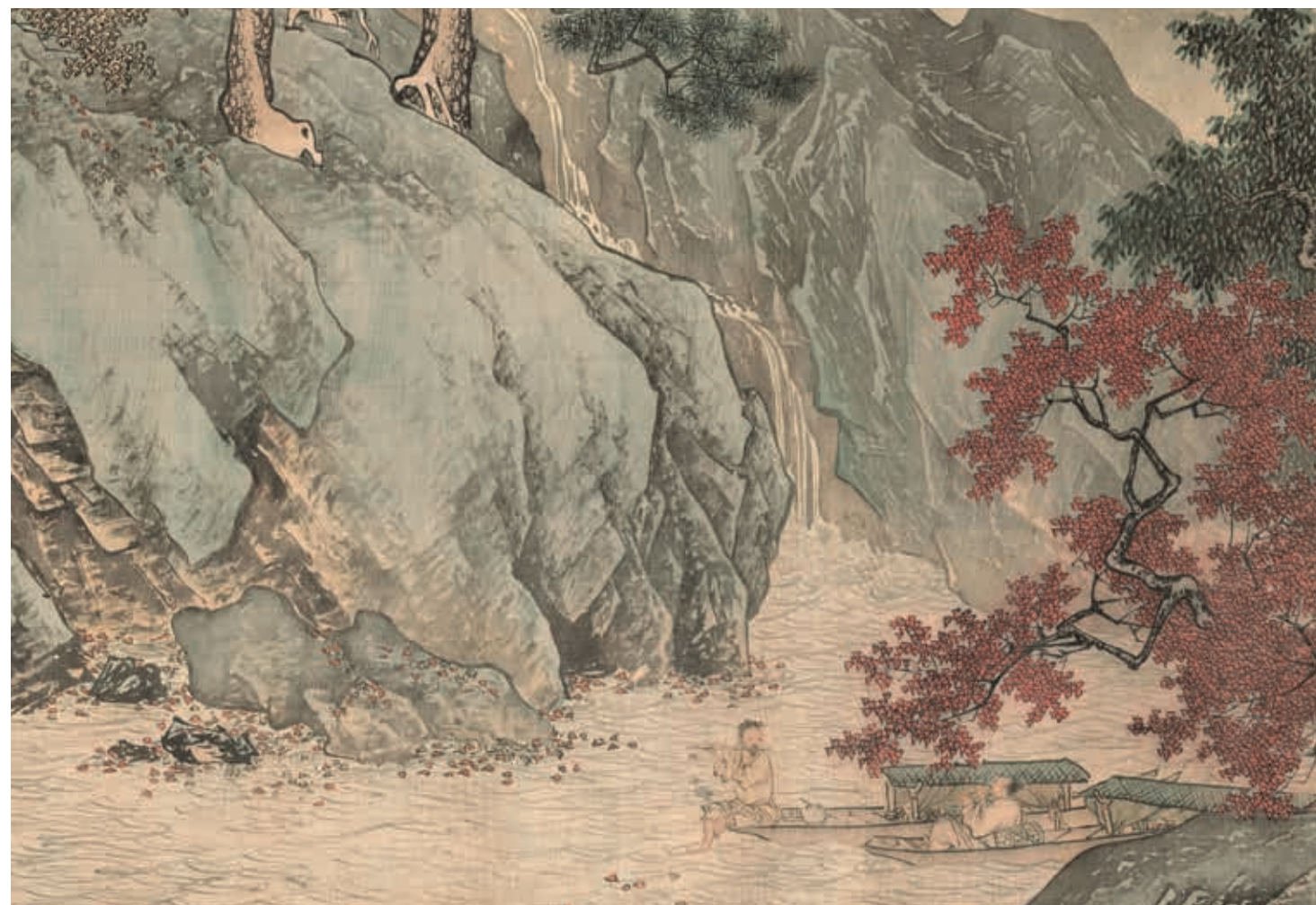
明 唐寅 溪山漁隱 卷 局部 國立故宮博物院藏 國寶 2015年1月核定公告

南宋院體與元代的文人畫，並續作變革。活潑跳擲的行筆，充分展露出畫家汲古創新的個人特質，也蔚為明代浙派之首。