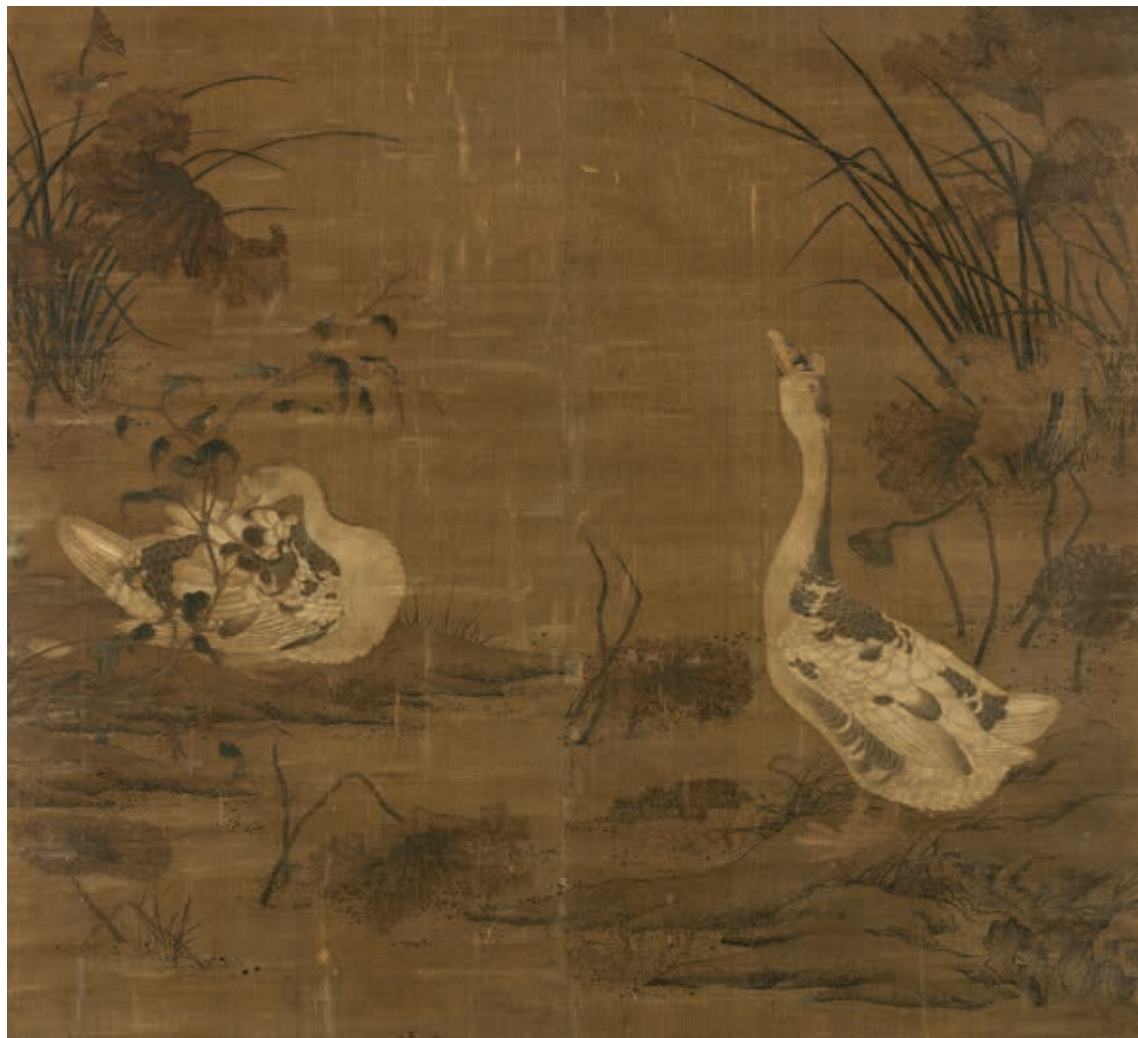
宋人 秋塘雙雁 軸 局部 國立故宮博物院藏 國寶 2012年3月核定公告