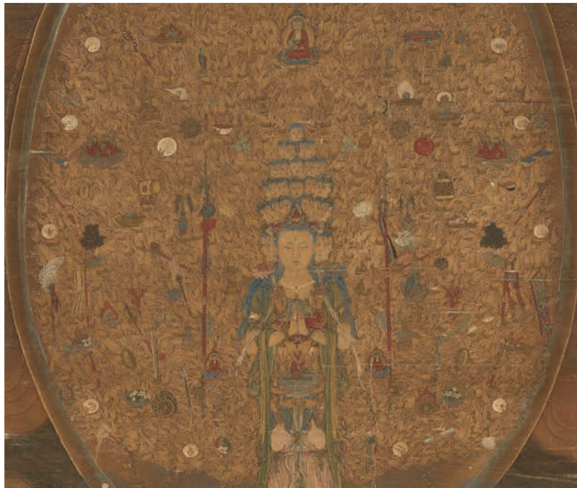
宋人 國寶 千手千眼觀世音菩薩 軸 局部 國立故宮博物院藏 2011年4月核定公告