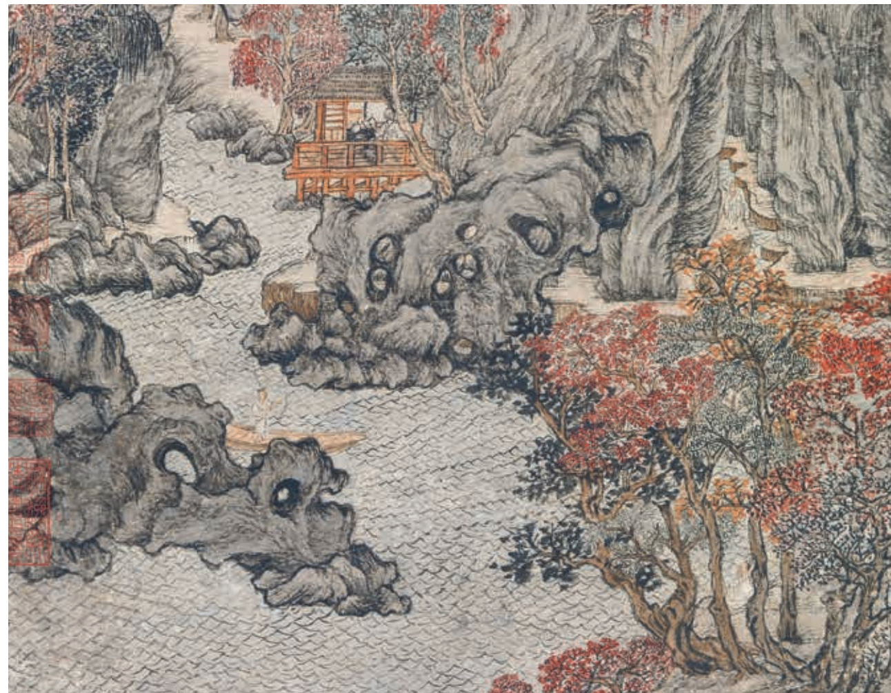
元 王蒙 具區林屋 軸 局部 國立故宮博物院藏 國寶 故宮暫行分級