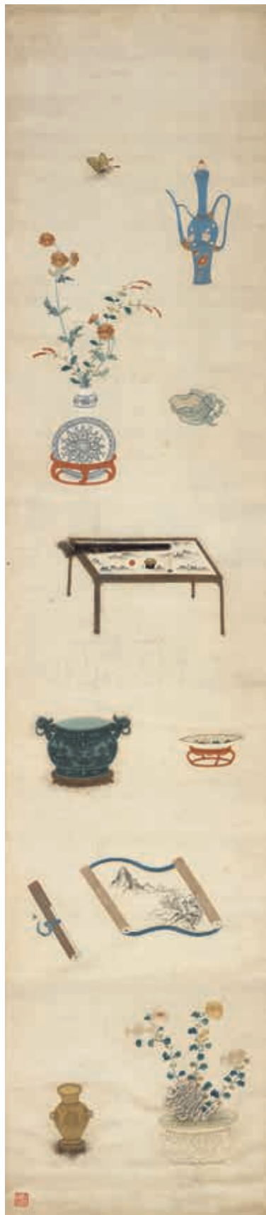
圖9 明 粵繡博古圖屏（三）軸 國立故宮博物院藏