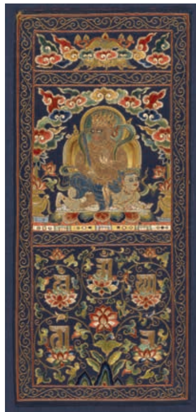
圖17 明 世界之神刺繡片幅 國立故宮博物院藏