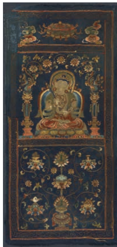
圖14 明 文殊菩薩座像繡幅 國立故宮博物院藏