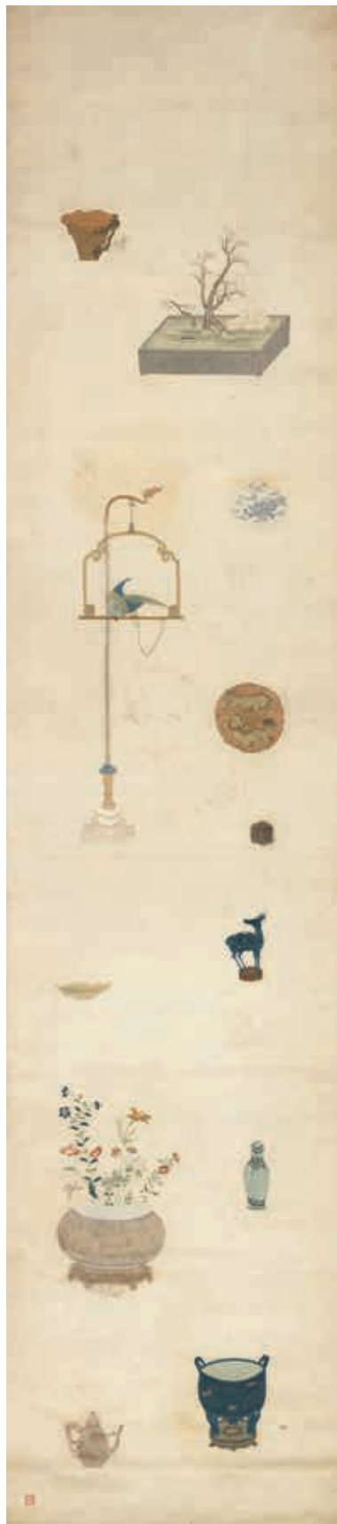
圖10 明 粵繡博古圖屏（七）軸 國立故宮博物院藏