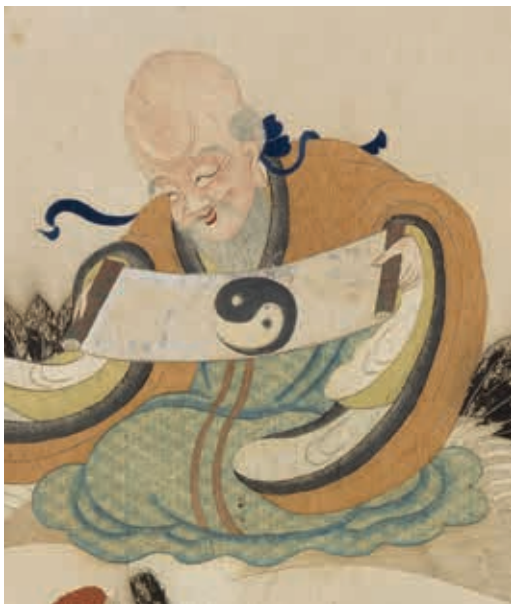
圖2 明 顧繡八仙慶壽掛屏（一）南極仙翁 局部 軸 國立故宮博物院藏

此外，從許多小地方的處理也可看出這種對細節的講究。和合二仙之合仙（圖三），頸項處隱約有兩道突起，在底下先墊上二條線，再進行繡製，以模擬該處的摺紋；仙人腳趾每根都清晰分明，指甲甚至另以水平走向的橫線繡出，以別於採縱