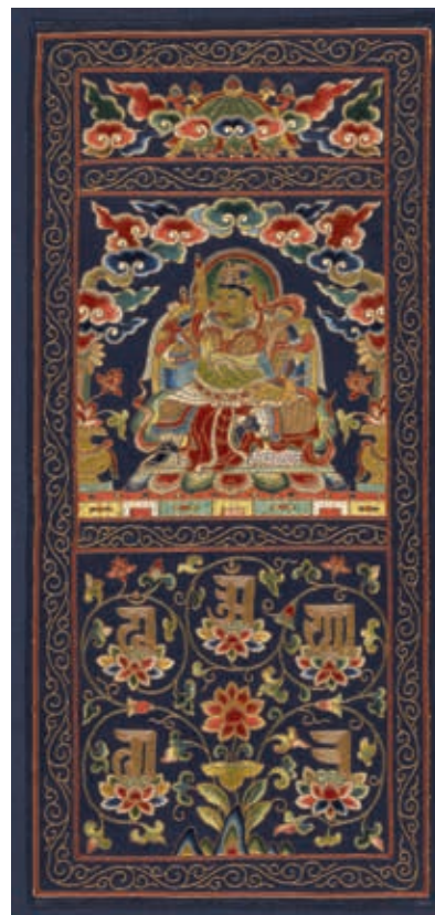
圖16 明 多聞天座像刺繡片幅 國立故宮博物院藏