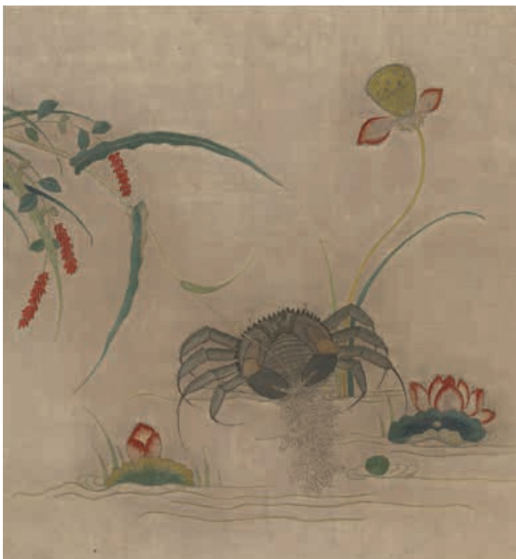
圖21 傳宋 繡黃至畫花鳥（一）蓮蟹／紅流草 冊 國立故宮博物院藏

的內容；二則是因應顧客的實際需求，在數量上增革損益，製作各種等級的產品，以供不同財力的買主選擇。無論何種模式，這些都恰恰見證了明清時期因高度商業化所引發的刺繡製作變化。作坊因應不同顧客需求，發展出客製化的生產策略。