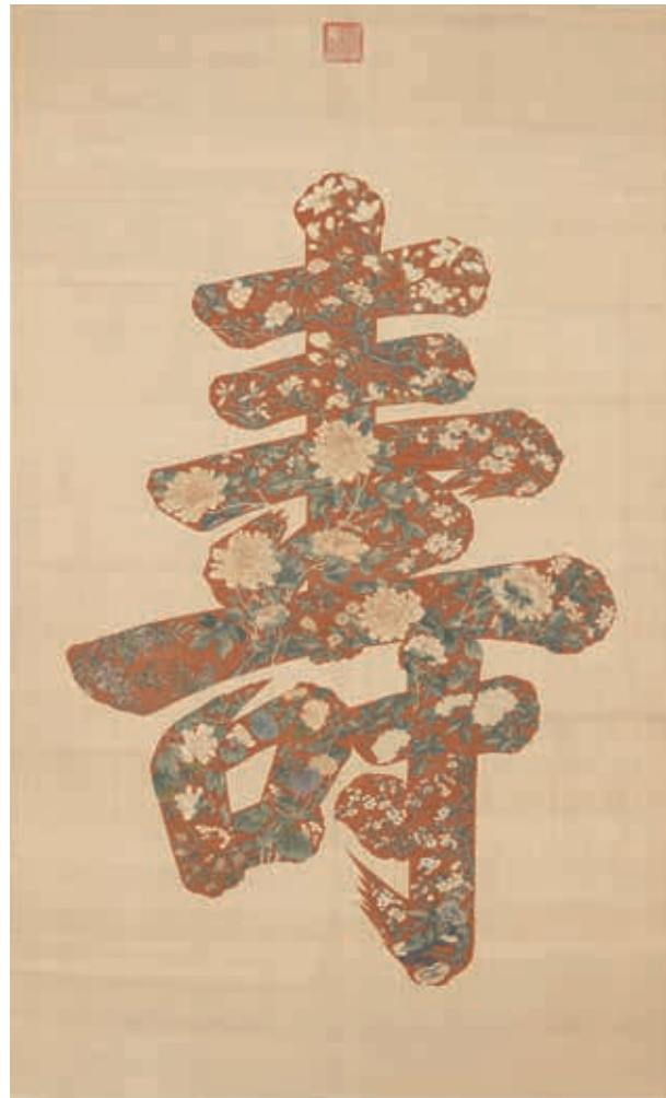
圖7 清 繡絲大壽字 軸 國立故宮博物院藏