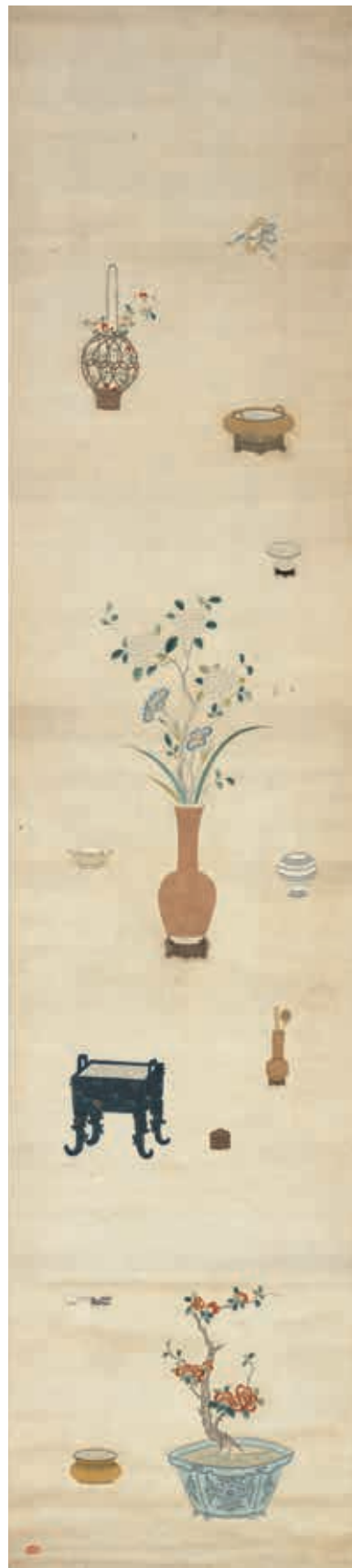
圖8 明 粵繡博古圖屏（二）軸 國立故宮博物院藏

製，絳絲添染加繪也融合無礙。繡工此時掌握了各式技巧，能夠以絳絲細膩表現種種物象，就連花瓣吹彈可破的柔嫩質感也能表現得恰如其分。但製作者並不以此為限，更進一步以筆墨丹青點染花蕊、苔點等處，枝幹明暗，暈色過渡益發自然，整體效果更加渾然天成而別具韻味。