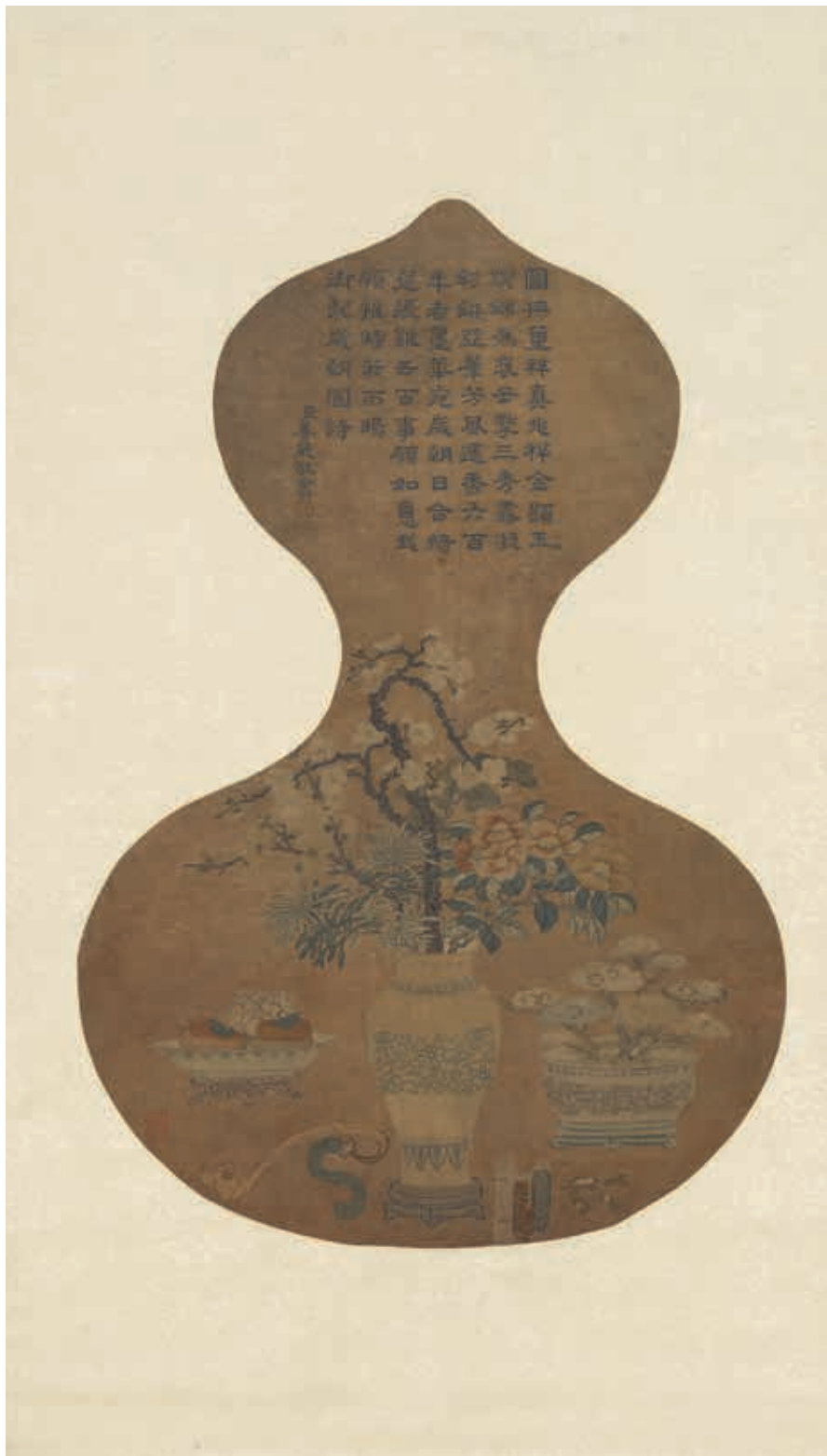
圖13 清 乾隆 絳絲歲朝圖(二) 軸 國立故宮博物院藏

出於宗教需要而製作，之後才出現更接近一般書畫形式的作品。這批展件承繼了早期傳統，惟技法更加繁複，可以據此窺見織繡書畫早期樣貌。