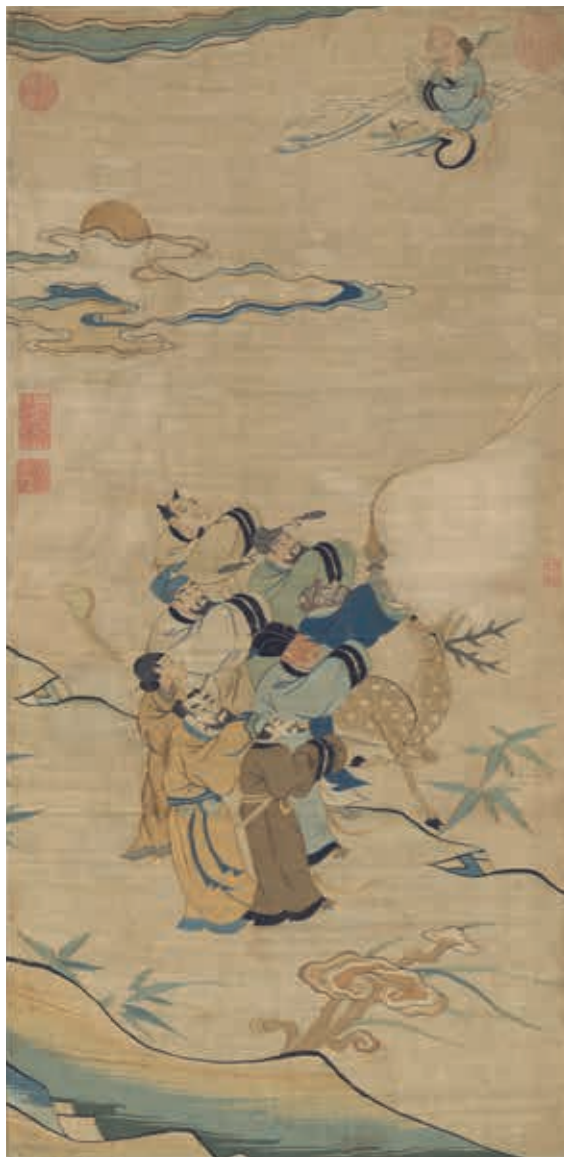
圖1 傳宋 絳絲八仙拱壽 軸 國立故宮博物院藏

絳繡書畫製作費時耗工，「終歲方成」，彌足珍貴。本院承清宮遺緒，典藏兩百餘件，品質精美。早在二九三〇年代，故宮文物首次赴倫敦展出，就已包括這類作品。一九七〇年代，學研社會在國內和日本出版大型圖錄介紹。至於專題展覽方面，一九八〇年代曾舉辦絳絲特展和刺繡特展，此後少有專門展出。時至二十一世紀，先後有二〇〇九年「絳織風華：宋代絳絲花鳥展」以及二〇一五年「十指春風：