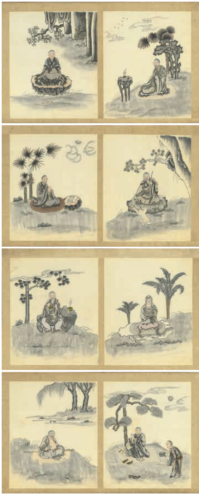
圖19 清 繡佛齋羅漢冊 國立故宮博物院藏

羅漢之外，本次還展出另一套冊頁，〈繡黃筓畫花鳥〉（圖二十、二十一），雖然傳稱為宋繡，實際上應屬顧繡系統，和許多已知顧繡作品關係密切，不但構圖、母題相近，風格也基本相同。院藏這套冊頁的〈槐樹臥鹿〉一開和遼寧省博物館藏〈花鳥冊〉的仙鹿類似，都著意於韓希孟名作〈宋元名蹟方冊〉中的〈百鹿圖〉；〈蓮蟹／紅流草〉這一開則是和遼寧省博