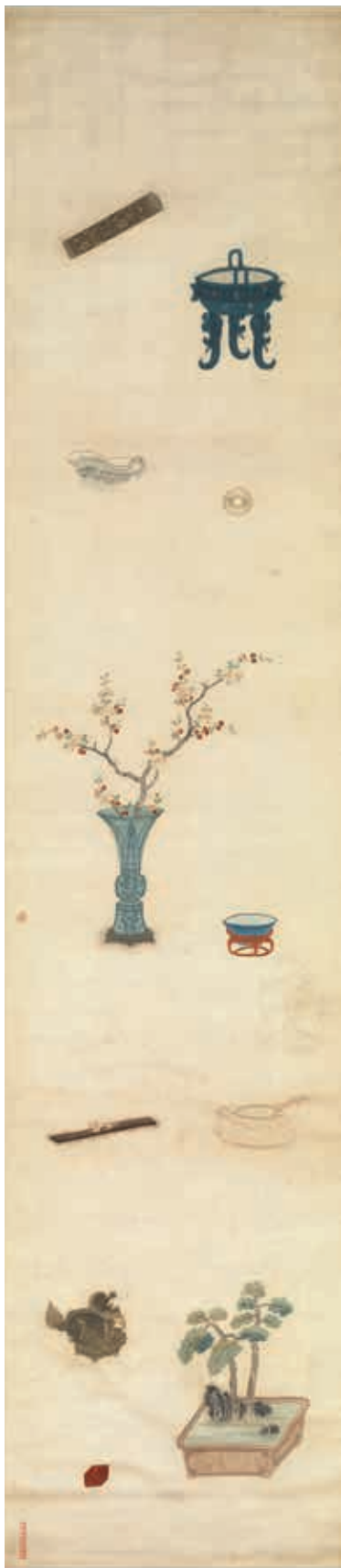
圖11 明 粵繡博古圖屏（八）軸 國立故宮博物院藏

和歲朝清供結合而發展成另一個類別。歲朝圖裡常見青銅器或瓷器插上冬盡春來時節花卉，如水仙、蠟梅之類，再搭配爆竹、如意等物，象徵新歲伊始，妝點出年節氣息。院藏兩幅清乾隆〈絳絲歲朝圖〉（圖十二、十三）正是此類作品代表，和當時畫作構圖十分相近。