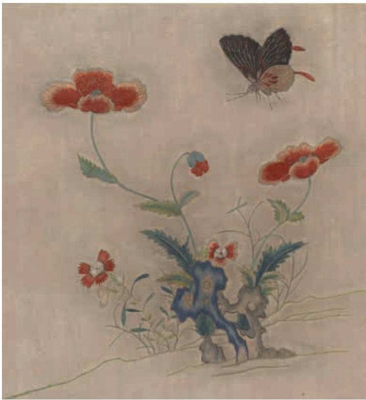
圖20 傳宋 繡黃至畫花鳥（一）雙粟蝴蝶 冊 國立故宮博物院藏

的方式一次滿足消費者收購八仙的需求（如南京博物院〈南極呈祥圖〉）；甚至可以針對「祝壽」需要，只挑取最符合此意涵的「壽星」入繡（如蘇州博物館〈山水三壽圖〉），為財力有限的買家提供實惠選擇。換句話說，作坊運用子模的手法其實包含了兩個層次：一是在等級相同、數量相當的情形下，利用子模組裝出豐富多變