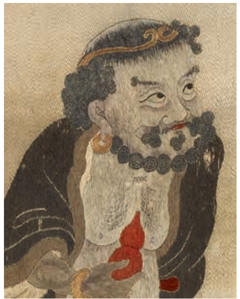
圖4 明 顧繡八仙慶壽掛屏(五)李鐵拐 局部 軸 國立故宮博物院藏

向繡成的腳掌。李鐵拐(圖四)胸口也是以不同方向的繡線具體表現肋骨當中凹陷處，而雙眼眼白之外，甚至在眼角染上了淡青色。南極仙翁這一幅裏，造型上則是偏好圓弧，仙鶴頸項、雙翼內緣和外圍各自連成曲度不同的圓弧，就連鶴爪末端的尖角，也兩兩相對共同組成小半圓形。仙翁衣袍、雙袖、飄帶同樣由一連串圓弧組成；額頭上三道皺紋作新月狀，眼尾特意延長，和眼睛連成S形，上下再各以圓