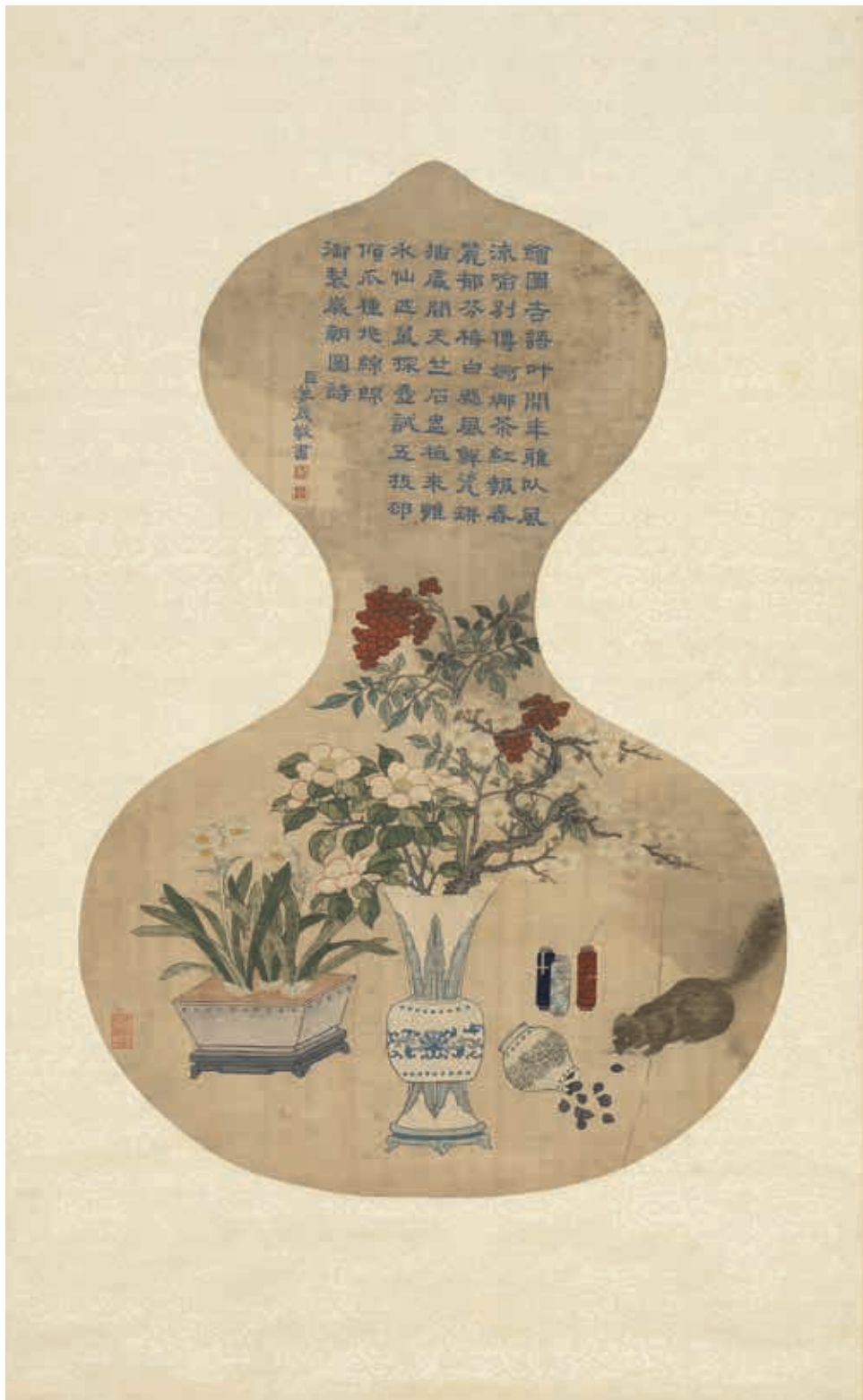
圖12 清 乾隆 絳絲歲朝圖(一) 軸 國立故宮博物院藏

本院新入藏一批藏傳佛教及道教刺繡，涵蓋多聞天王、文殊菩薩、道教列仙等，色彩明艷，精采絕倫。緯絲、刺繡發展過程中，已知最早有畫面構成的實例本就是