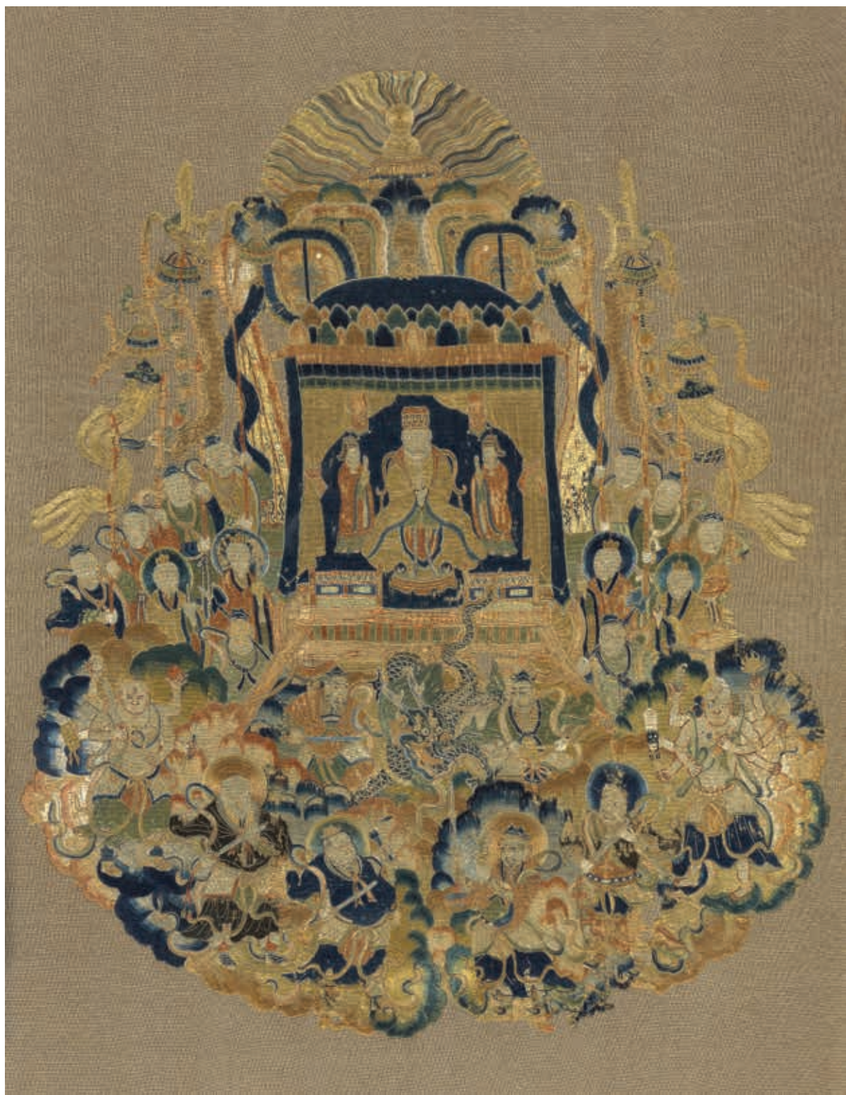
圖18 明 刺繡天神出巡圖 國立故宮博物院藏

藍緞地上以金線和五彩絲線刺繡，長方形幅面從上而下分為三段，依序為寶蓋、文殊菩薩、纏枝蓮花，邊緣及分隔框皆以盤金繡繡纏枝藤蔓。文殊菩薩居畫幅中央，右手持智慧劍，正面結跏趺坐於蓮座之上，頭頸微向左傾。蓮座兩旁有寶瓶，瓶中生出蓮花祥雲，把文殊從周邊到頭頂整個框