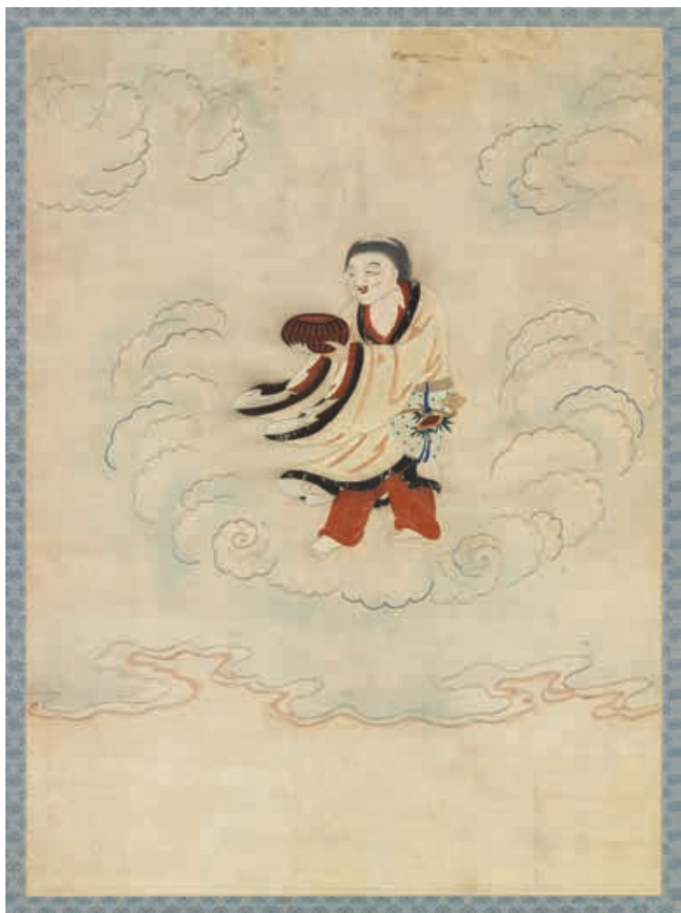
圖3 明 顧繡八仙慶壽掛屏（二）和合二仙之合仙 軸 國立故宮博物院藏

卻是十分講究，配色細膩，變化多端。就拿雲氣來說，製作者為每一道雲悉心賦予不同色彩，甚至同一道雲當中，也並非一色到底。例如南極仙翁（圖二）這裏，鶴首下方的雲彩以藍色配上朱色，接著旁邊那道用粉紅佐以草綠，再過去則是藍色和粉紅組合，如此，色彩交替穿插，既有變化又彼此協調，而在這些繡成的雲氣外圍，