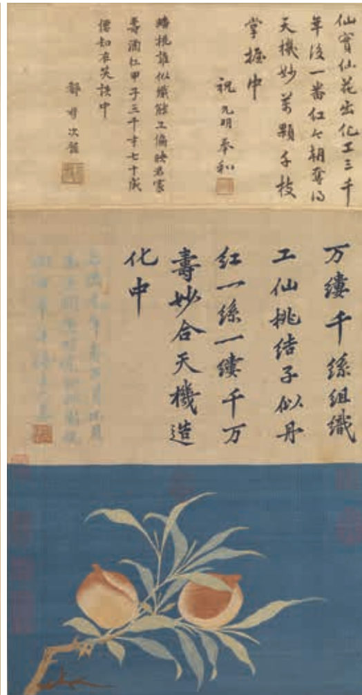
圖6 明 繡絲仙桃圖 軸 國立故宮博物院藏