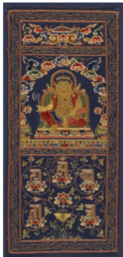
圖15 明 財神佛座像繡幅 國立故宮博物院藏

關於這批繡品的年代，早年曾定為元代（如一九九五年之展覽圖錄）（註九），某些破十四測試甚至定為宋代，但後來學界多半認為是明初之作，尤其和永樂年間製作最為接近，裝飾紋樣的細節及風格和十四世紀到十五世紀初的尼泊爾及西藏繪畫裡的表現相近，推測很可能也是出自明