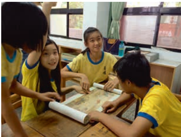
圖5 認識數位清明上河圖後，學生分組練習操作複製手卷，觀察探索實體內容。

用故宮線上資源於課程中；此外，鼓勵學校校外教學至故宮參觀，教師可運用巡迴展覽得之經驗，繼續操作進故宮正館參觀前、中、後的教案內容。 展示詮釋與教學策略 一、與生活結合，引導觀察、感受與思考 採用生活化的展示詮釋風格，引導觀眾觀看、思考並對照生活經驗。以「字的姿態——書法」單元為例，因目前中小學生對於書法作品相對陌生，故該區學習重點並非書體源流，而是選取具故事性的作品，