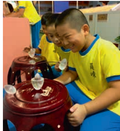
圖10 學童從〈秋庭戲嬰圖〉的「推棗磨」趣味競賽中模擬宋代童玩法，並與展場畫作內容對應。