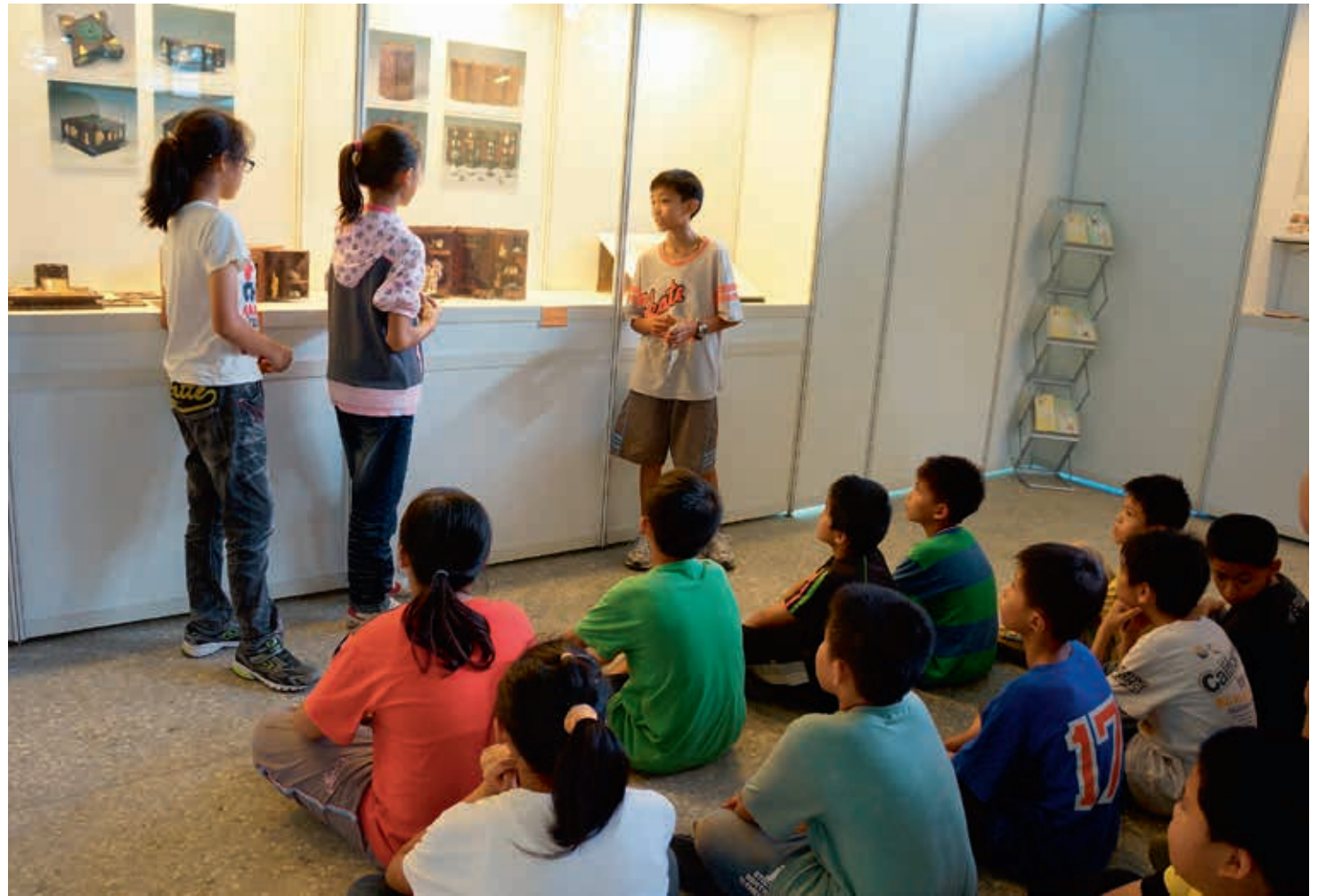
圖14 教師自發性運用巡迴展展場作為課堂教學場域，請學生於觀展聽導後分組準備導覽內容，即席介紹故宮文物，透過口述深化記憶。

為了規劃以觀眾為核心的展覽內容，本展運用前置性評量如問卷調查、參與觀察及焦點團體座談等方法理解目標觀眾的背景、需求與期望，並據此修正展覽規劃與教育活動設計。透過學員導覽解說、藝術創作展出、展示文案撰寫、觀眾留言板設置，使學習者在教育活動的過程與結果被突顯，將觀眾涉入展覽的時程提前，