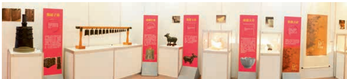
圖2 「國寶總動員」首站於臺中市梨山國小展出，訂製符合小學生觀看高度的展示系統，展示文案採問答引導設計，結合複製文物、多媒體影片及設備、遊戲教具，為利於觀眾自導式參觀的迷你教育展。