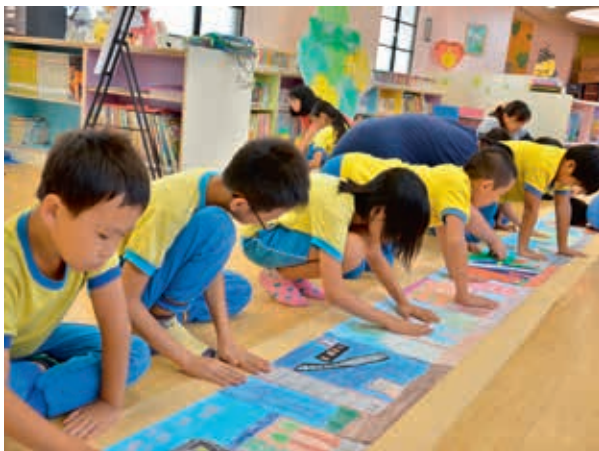
圖6 從清明上河圖引發對在地環境的觀察與關懷，新竹縣員嶼國小六年級學生合力完成長達14公尺的「員嶼生活地圖」長卷。

請觀眾從字體表現來推測作者心境，循序漸進了解作品背景。引導文字如下： 你（妳）相信人們可以透過字體看出作者的性情與創作時的情感嗎？這裏有幾幅書法名家的作品，分別呈現了他們在不同心境下的書寫樣貌。觀察一下，這些文字分別呈現了什麼樣的姿態，可能透露了什麼樣的情緒？你（妳）最喜歡哪一幅呢？為什麼？再想想，自己在開心時、難過時、平靜時所寫下的字體是什麼模樣？