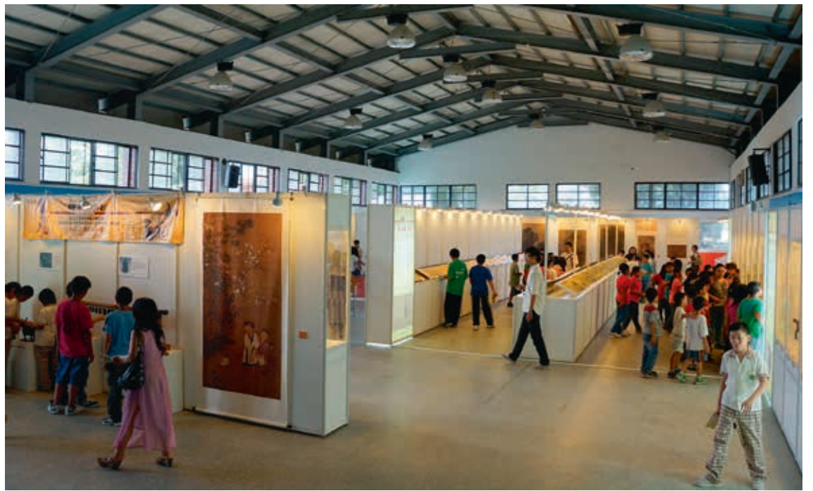
圖3 「國寶總動員」展覽量體及選件，隨合作單位場地規模以及教學需求而調整。