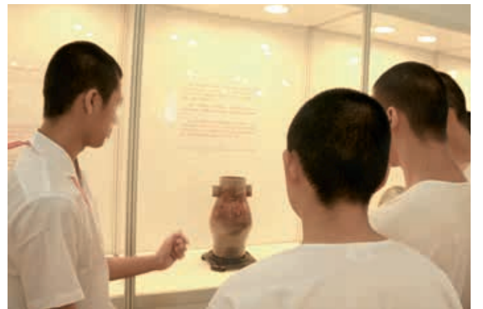
圖13 收容人向其他院生解說展品，展示文案闡述其作品與故宮文物的連結及創作理念。

為了規劃以觀眾為核心的展覽內容，本展運用前置性評量如問卷調查、參與觀察及焦點團體座談等方法理解目標觀眾的背景、需求與期望，並據此修正展覽規劃與教育活動設計。透過學員導覽解說、藝術創作展出、展示文案撰寫、觀眾留言板設置，使學習者在教育活動的過程與結果被突顯，將觀眾涉入展覽的時程提前，