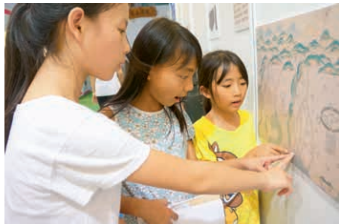
圖15 串聯古今！新竹縣鳳岡國小師生在清乾隆〈臺灣地圖〉圖版中發現學校所在地的舊地名「貓兒錠」。