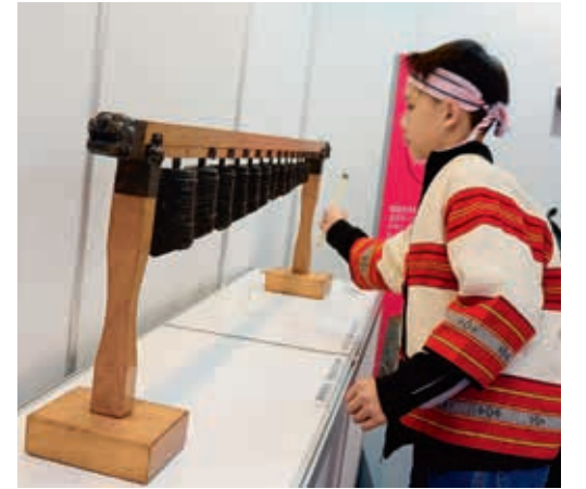
圖7 觀眾運用視覺、聽覺、觸覺及動手操作了解古代編鐘外形、材質及發聲原理。