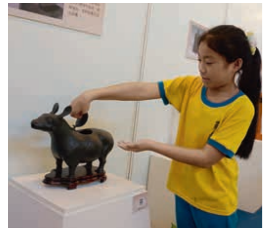
圖8 小小導覽員於展場解說機噐功能時，運用複製品示範如何操作。