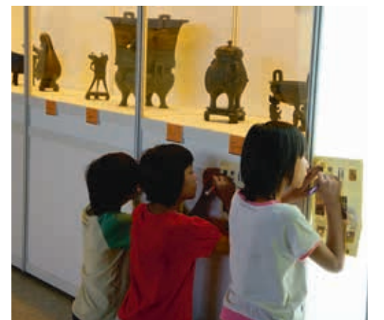
圖9 學生在學習單的引導下，於展場觀察認識文物造形、質材及內涵。

說，遠大於說（百分之七十）、看（百分之三十）、聽（百分之二十），及讀（百分之十），她並彙整出美術館教育中促進觀眾互動學習方式有：象徵符號的學習（如讀展示文字、聽導覽）、圖像的學習（如觀賞圖片、展品、影片等）與活動式的學習（如接觸物件、討論、互動展示、戲劇表演等等），多元感官的學習方式遠比單一感官有效。（註一）