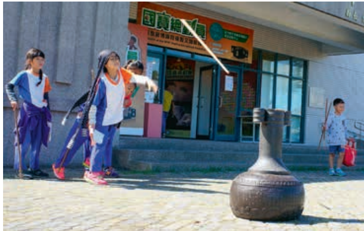
圖11 展場外設置「投壺」模型，觀眾透過肢體大動作體驗古代投擲遊戲。