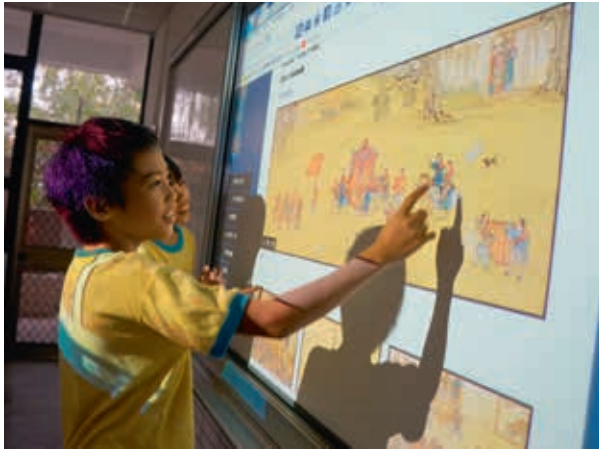
圖4 運用故宮數位資源於課堂介紹〈清院本清明上河圖〉背景資訊

用故宮線上資源於課程中；此外，鼓勵學校校外教學至故宮參觀，教師可運用巡迴展覽得之經驗，繼續操作進故宮正館參觀前、中、後的教案內容。 展示詮釋與教學策略 一、與生活結合，引導觀察、感受與思考 採用生活化的展示詮釋風格，引導觀眾觀看、思考並對照生活經驗。以「字的姿態——書法」單元為例，因目前中小學生對於書法作品相對陌生，故該區學習重點並非書體源流，而是選取具故事性的作品，