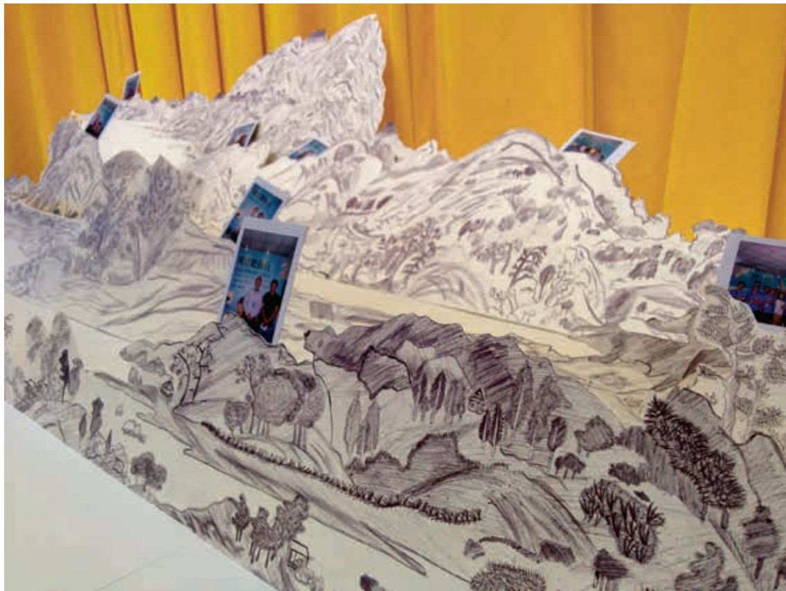
圖12 誠正中學收容人創作的立體〈富春山居圖〉，山水間錯落放置導覽培訓收容人與觀展家屬的現場合影，是這些收容期間禁止擁有私人物品的非行少年珍貴的生命紀錄。 作者攝