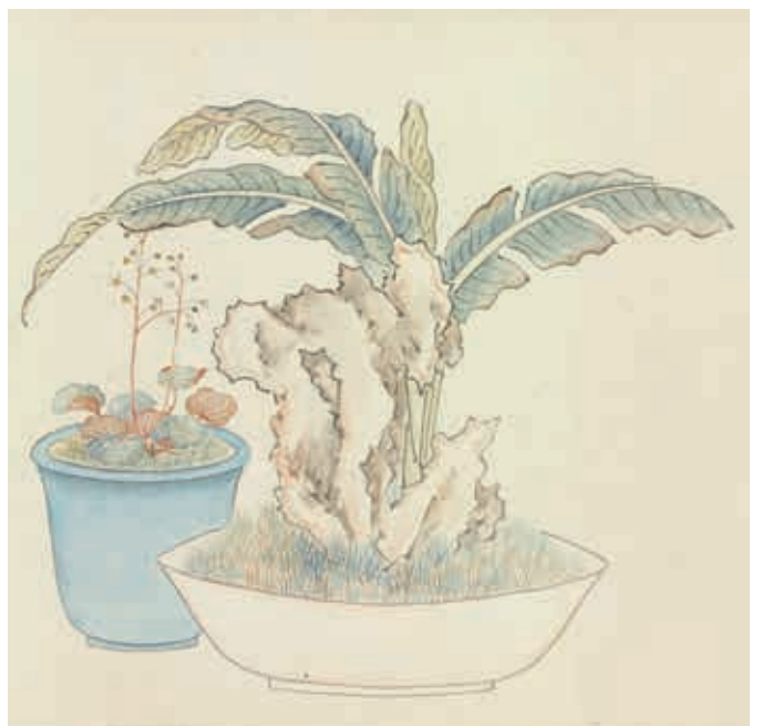
圖8 清 汪承霈 畫萬年花甲 局部 芭蕉、虎耳草 國立故宮博物院藏