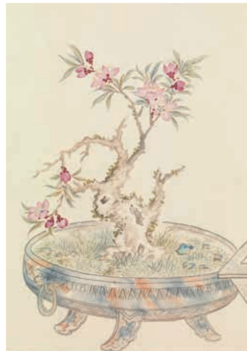
圖5 清 汪承霈 畫萬年花甲 局部 杏花 國立故宮博物院藏