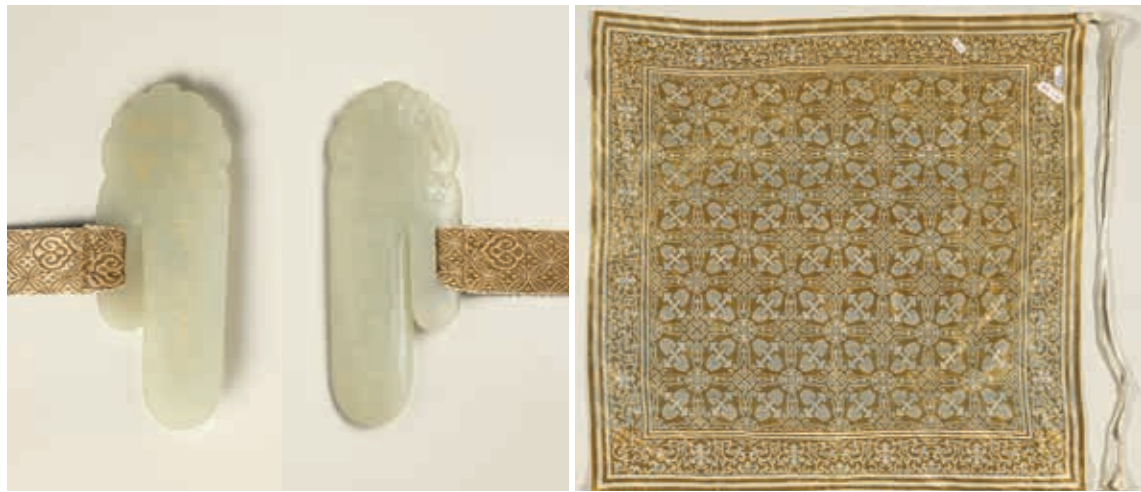
圖16 《畫萬年花甲》錦狀、玉警 國立故宮博物院藏

乾隆皇帝每次南巡歷時三至五個月，多選擇在江南春暖花開時節。所到之處一方面觀賞沿途名勝，另一方面巡視江南水利、視察民情，督促地方政務。乾隆皇帝對南巡一事的文字紀錄相當重視，於乾隆三十六年（一七七二）、四十九年、五十六年（一七九一），命令高晉等人初編、薩載等人續編《南巡盛典》、阿桂等人合編《欽