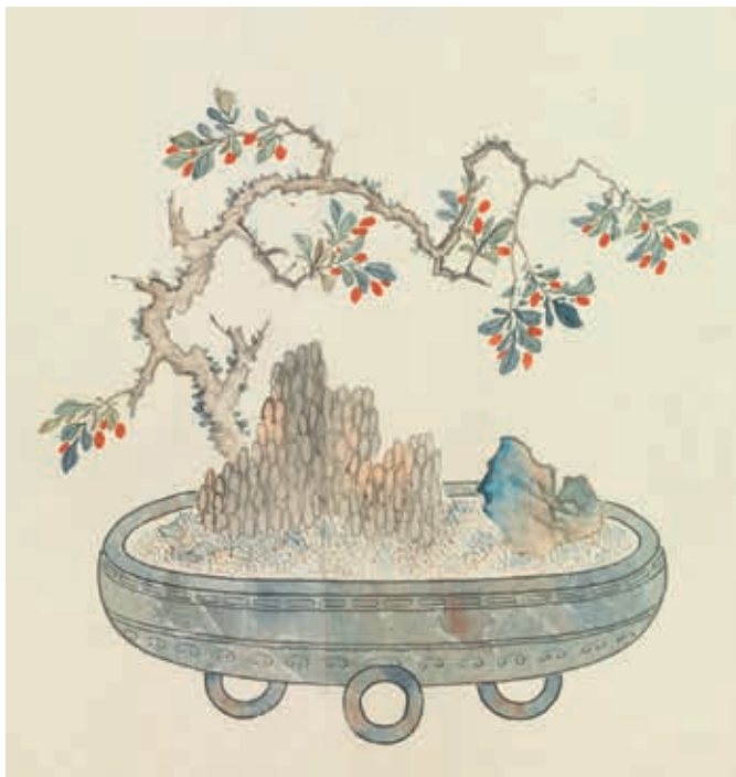
圖9 清 汪承霈 畫萬年花甲 局部 枸杞 國立故宮博物院藏