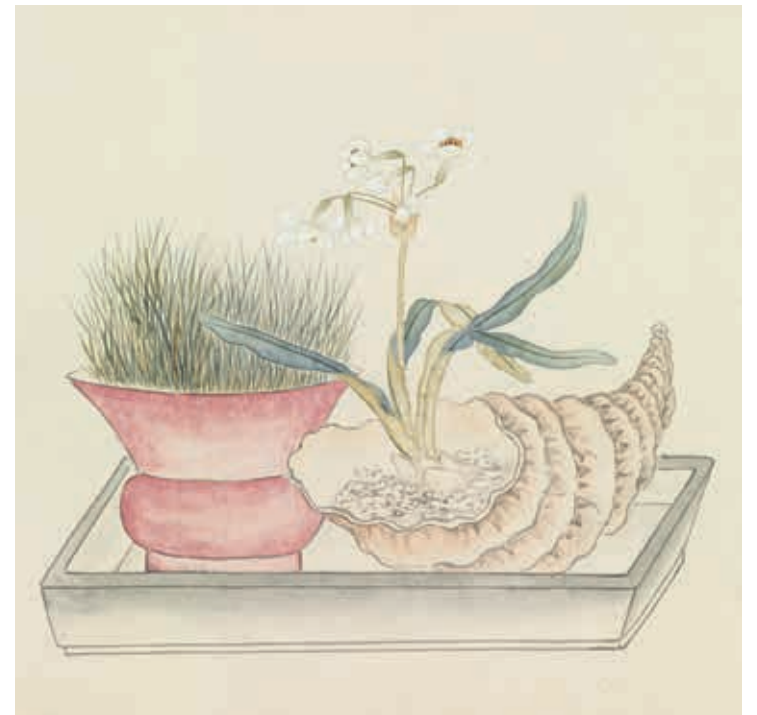
圖11 清 汪承霈 畫萬年花甲 局部 水仙、石菖蒲 國立故宮博物院藏

六蒞南邦，春祺普錫，白叟黃童，罔不翹首翠華，祝聖人萬萬壽。臣以樗質，世受洪恩，以供職京師，不獲偕。吳越臣民，迎鑾道左。謹圖繪花卉二十四盞合為一卷，同江鄉父老，申芹曝之獻。」（圖十三）可知此圖乃是為歌功頌德所作。乾隆四十九年乾隆皇帝第六次南巡，正月初八日出發之前，宮廷畫家汪承霈為他創作了《春祺集錦》：正月二十一日由京師啟程，汪氏並未隨鑾駕南下。此年閏三月十二日，乾隆皇帝返回北京途中，汪氏又繪製了《畫萬年花甲》長卷以示祝賀，畫名取其「千叟春祺、天子萬年」寓意，用以祈求上天福佑「四季長春」，祝頌乾隆皇帝「萬壽綿長」。《造辦處各作成做活計清檔》詳細記錄了清宮內務府依旨意承辦各類宮廷需用活計，其中若有在北京不能製作，就由檔房遵旨行文蘇州織造廠製作。乾隆四十九年正月，內務府造辦處《活計檔·行文》中有一筆記錄： 初八日接得郎中保成押帖一件。內開正月初六日，呂進忠交春祺集錦手卷一卷。……傳旨：交啓祥宮配袂擊匣，做袂擊樣，發往南邊，依前做法照樣做來。 （註六）（圖十四）