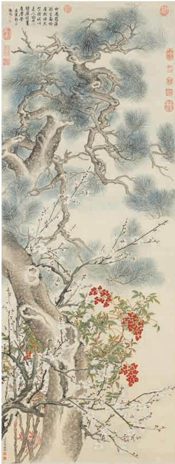
圖17 清 汪承需 畫歲寒三益圖 國立故宮博物院藏

閱《四庫全書》，得知自秦漢以來，得知唐代以來得見五世同堂者，僅有唐代錢明、宋代張燾、元代吳宗元、明代羅恢、歸璿、文徵明六人。而自漢以來，帝王中能活到八十歲，惟有梁武帝、宋高宗、元世祖，然皆不能親見玄孫。乾隆皇帝喜作《留京王大臣飛報得五代元孫之喜，詩以誌意》云：「飛章報喜達行軒，歡動中朝及外藩。曾以古稀數六帝，何期今復抱元孫。百男周室非五代，三祝堯封是一言。耄耄人多茲鮮遇，獲茲惟益凍天恩。」詩中引用兩個典故，其一「百男周室非五代」，說的是周文王；其二「三祝堯封是一言」，引