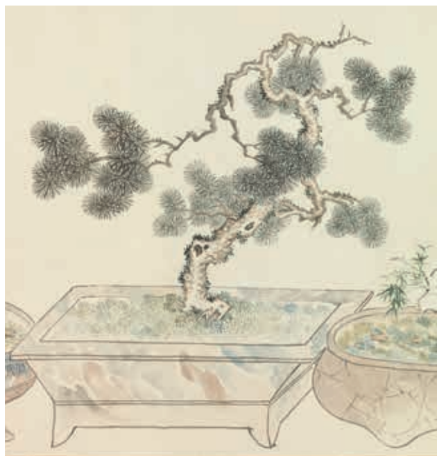
圖4 清 汪承霈 畫萬年花甲 局部 松 國立故宮博物院藏

柔細竹葉與瘦漏湖石相映生輝(圖三)；盤幹虬屈如龍蛇，松針勁挺，疏朗有致(圖四)；杏花樹幹疏瘦古怪，懸根露爪擲仰有態，花朵清雅悅目(圖五)；柏樹枝柯虬屈，橫斜凌空。針葉蔥郁，修剪有致(圖六)；古樸奇石堆疊，上植石菖蒲柔中帶剛，構圖出自畫家想像(圖七)；芭蕉葉片依附枯石，更添自然野趣(圖八)；或以神態取勝，枝條灑脫，鮮紅小果，相映成趣。(圖九)更有一類「吉語盆景」，運用花材與花器名稱的諧音來表達吉祥寓意，包括萬年青「一統萬年」(圖十)；靈芝