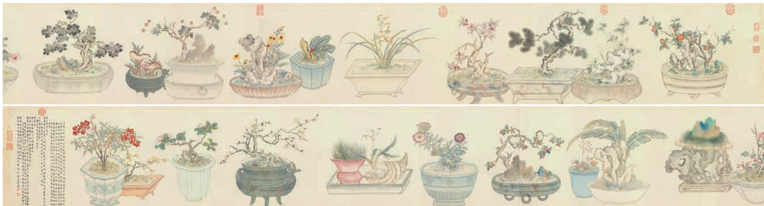
圖2 清 汪承霈 畫萬年花甲 國立故宮博物院藏