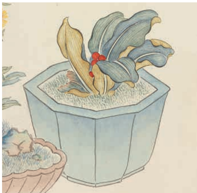
圖10 清 汪承霈 畫萬年花甲 局部 萬年青 國立故宮博物院藏