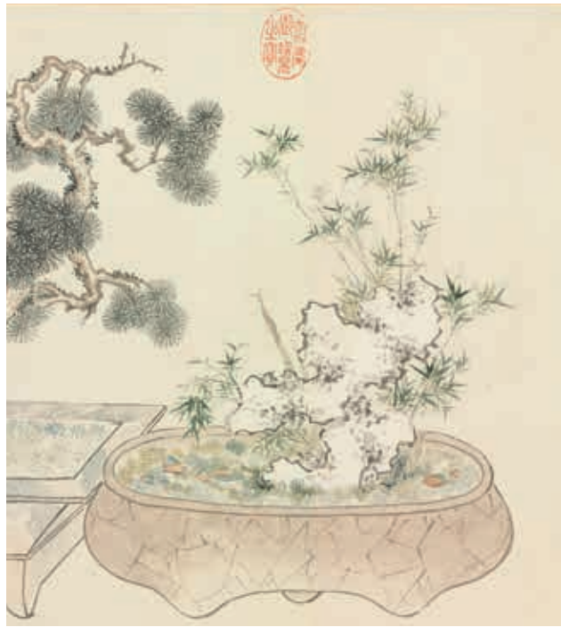
圖3 清 汪承霈 畫萬年花甲 局部 竹 國立故宮博物院藏