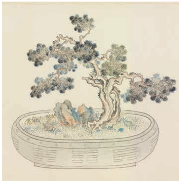
圖6 清 汪承霈 畫萬年花甲 局部 柏樹 國立故宮博物院藏