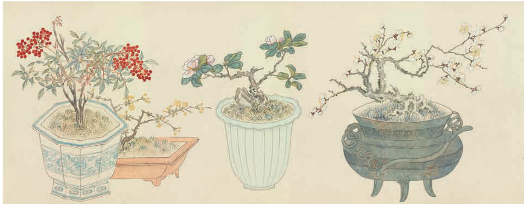
圖12 清 汪承霈 畫萬年花甲 局部 由右至左：梅、山茶、臘梅、南天竹 國立故宮博物院藏