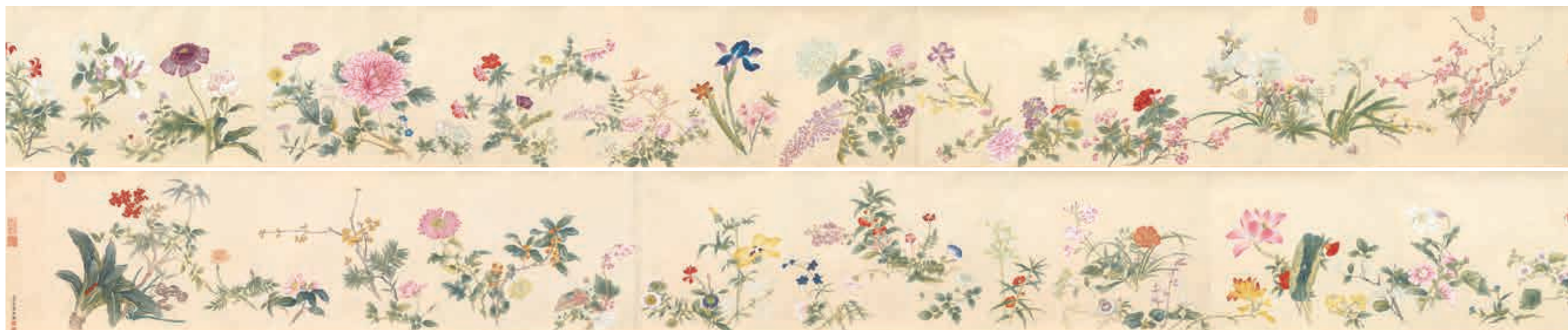
圖1 清 汪承霈 春祺集錦 國立故宮博物院藏