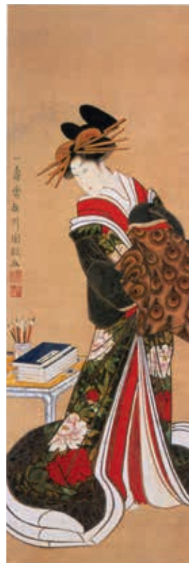
圖13 江戶時代 19世紀 歌川國政 書齋美人圖 財團法人大谷美術館藏 引自《江戸の美—きものデザイン》，女子美術大學監修，頁75插圖

紋，日文熨斗意指削成長條曬乾的鮑魚乾貨，原本用於祭祀後來引為永遠的象徵，用於婚慶儀式。因此孔雀羽毛束成的熨斗，暗喻婚禮。有別於江戶時代浮世繪所見的