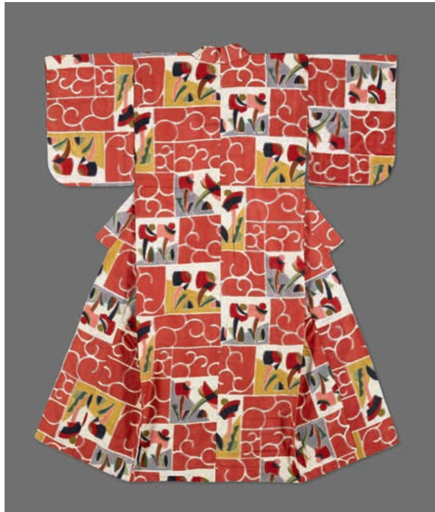
圖18 昭和後期 20世紀 紅地幾何抽象紋銘仙和服 國立故宮博物院藏