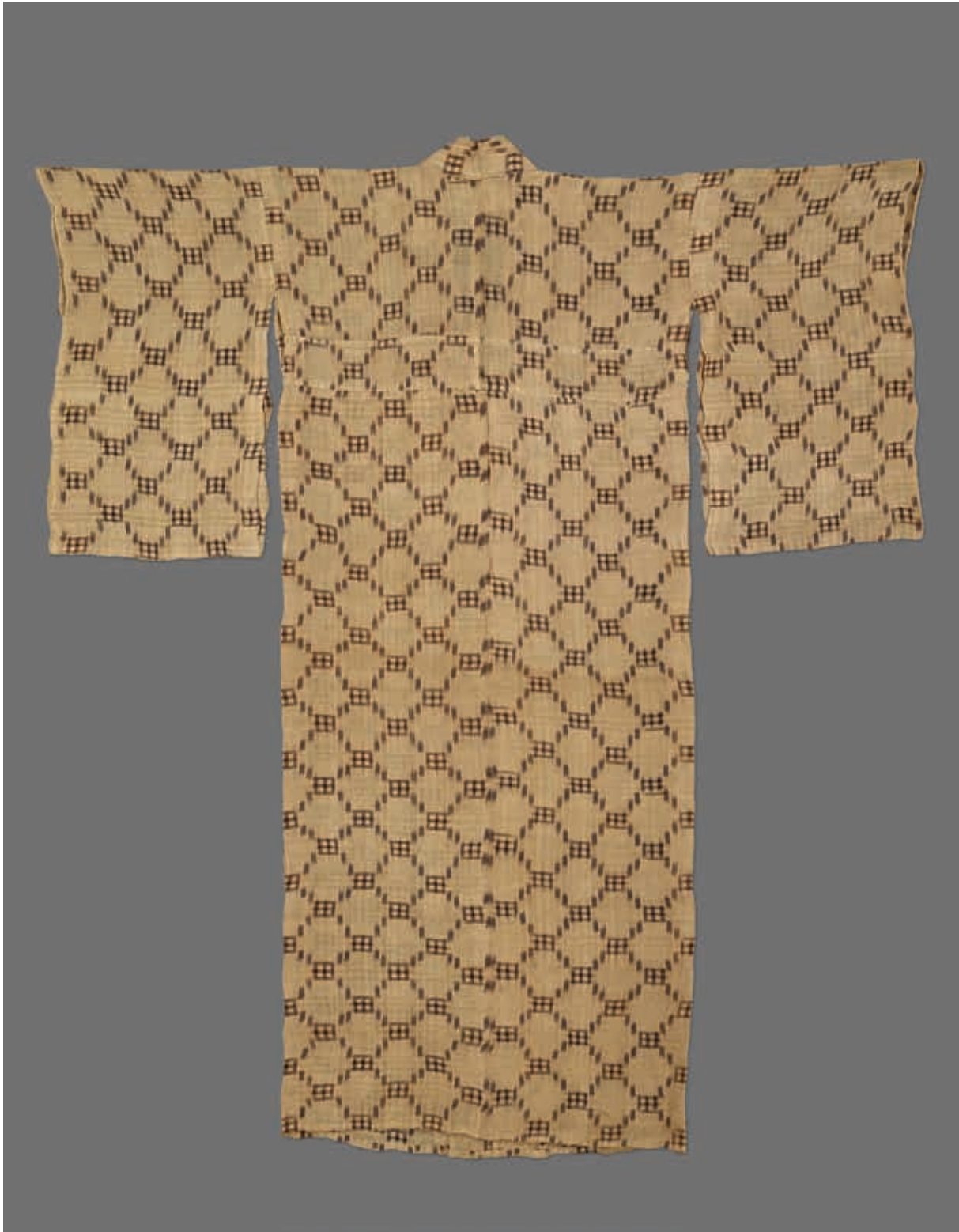
圖2 昭和時代 20世紀 淺黃地幾何紋緋織蕉布和服 國立故宮博物院藏