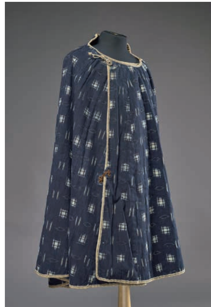
圖3 江戶~明治時代 19世紀末期 紺地幾何紋緞織風衣(合羽) 國立故宮博物院藏

型的琉球緞織設計；另一件〈紺地幾何紋緞織風衣〉(圖三)，藍染的綿線織出雙線、格子及橢圓菱形等簡樸的設計，這類斗篷形風衣又稱「坊主合羽」是源於桃山時代葡萄牙傳教士穿著的風衣，江戶時代則成為男子旅行的外出服飾。 隨著織機改良及技術提升，緞織也能呈現較複雜的日本傳統紋飾，院藏的〈紺地團扇流水菊花緞織童服〉及〈紺地團鳥