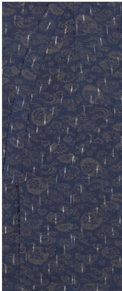
圖4 明治時代 20世紀初期 紺地團扇流水菊花緞織童服 局部 國立故宮博物院藏