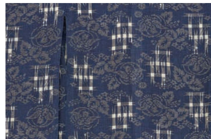
圖5 明治時代 20世紀初期 紺地團鳥桐花格紋緞織童服 局部 國立故宮博物院藏

型的琉球緞織設計；另一件〈紺地幾何紋緞織風衣〉(圖三)，藍染的綿線織出雙線、格子及橢圓菱形等簡樸的設計，這類斗篷形風衣又稱「坊主合羽」是源於桃山時代葡萄牙傳教士穿著的風衣，江戶時代則成為男子旅行的外出服飾。 隨著織機改良及技術提升，緞織也能呈現較複雜的日本傳統紋飾，院藏的〈紺地團扇流水菊花緞織童服〉及〈紺地團鳥