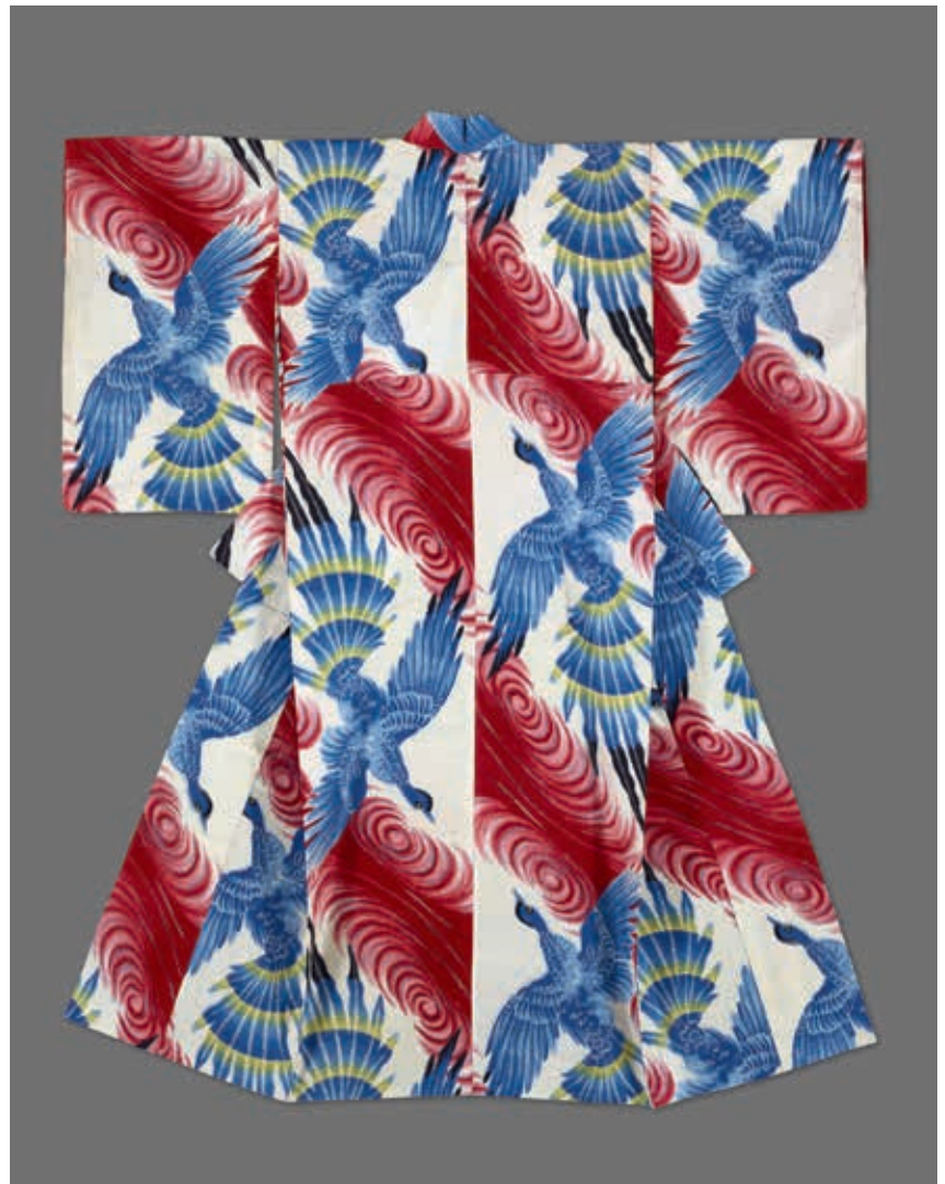
圖1 昭和時代 20世紀 白地孔雀紋銘仙和服(單衣) 國立故宮博物院藏