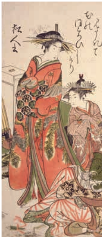
圖12 北尾政演 新美人合自筆鏡 天明4年(1784)序刊本 國立國會圖書館藏