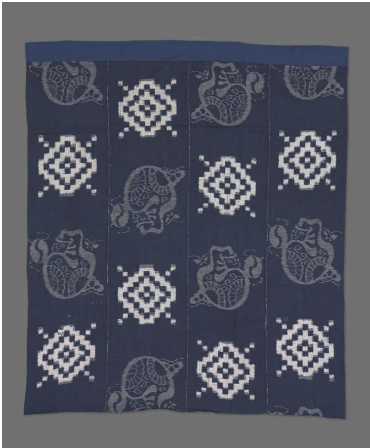
圖6 大正時代~昭和初期 20世紀前期 紺地達摩幾何紋緞織被套 國立故宮博物院藏