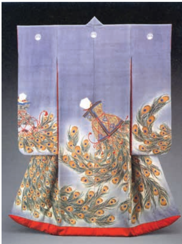
圖14 明治時代 19世紀 鼠縹網地孔雀熨斗紋打掛 ポストン美術館藏 引自參考書目3, 圖15

明治時代以後孔雀紋和服穿用的族群與呈現的意義，已有所改變。明治時代作品〈鼠縹網地孔雀熨斗紋打掛〉(圖十四)的孔雀羽紋搭配象徵吉祥的「熨斗」