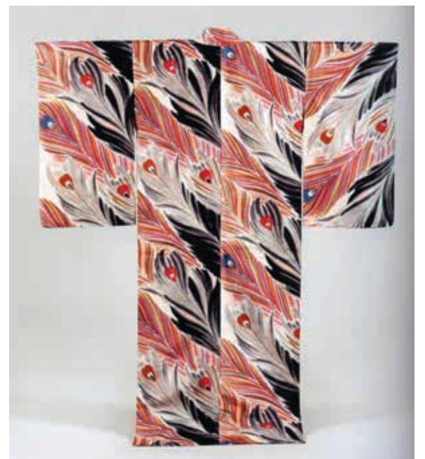
圖16 昭和初期~昭和10年前期（1925~1935）白地孔雀羽根紋銘仙單衣 須坂クラシック美術館藏 引自參考書目1，圖66。

就是一九二二年到一九三〇年代左右日本所流行的和服款式，一般推測較具體的孔雀紋的流行與當時西方的新藝術風潮有關聯。這個時期不論在油畫、工藝品及服飾，孔雀紋變得較為常見，而近幾年日本各地也陸續推出銘仙特展，例如須坂クラシック美術館藏〈白地孔雀羽根紋銘仙單衣〉（圖十六）、足立市立美術館藏〈孔雀羽紋銘仙長著〉（圖十七）兩件孔雀紋銘仙，皆是全體配置斜向的孔雀羽紋，多彩且新潮的銘仙精品。隨著戰爭結束，受到新裝