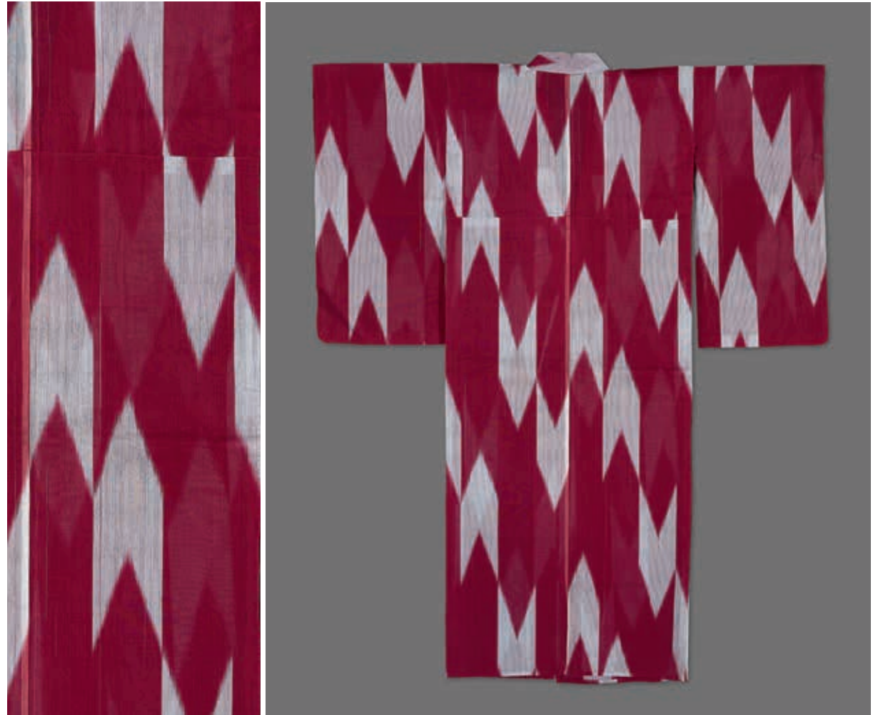
圖7 大正時代~昭和初期 20世紀前期 紅地矢羽紋銘仙和服(單衣) 國立故宮博物院藏

桐花格紋緞織童服(圖四、五)，兩件童服中團扇、團鳥、流水、菊花、桐花等曲線的流水及蜿蜒的花卉，紋飾精巧細緻；還有(紺地達摩幾何紋緞織被套)(圖六)，達摩身上的花紋及面部表情亦栩栩如生，不論布料材質，各種複雜紋飾皆能精準呈現，日本緞織技法已臻如火純青。