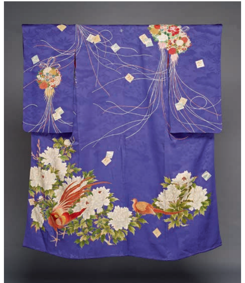
圖9 昭和時代 20世紀 紫緞地牡丹雉鳥花綵球紋振袖 國立故宮博物院藏