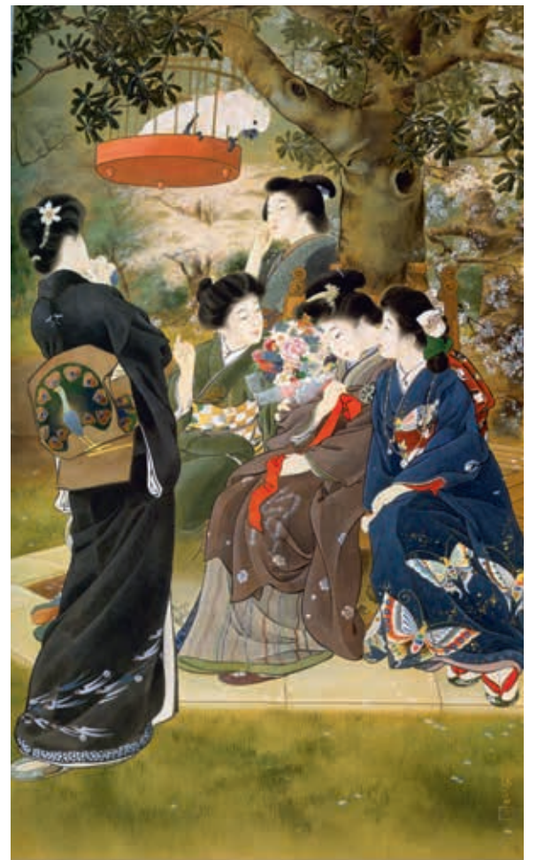
圖15 明治40年（1907）鐫木清方 待嫁 鐫木清方記念美術館藏 引自《鐫木清方—逝きし明治のおもかげ》，日本：平凡社，2008，頁60，圖14。

孔雀羽紋小袖，這件打掛應為華美的婚禮服飾。 大正、昭和時代日本代表性的美人畫家，鐫木清方（一八七八~一九七二）作品〈待嫁〉（圖十五），主角是眾人圍繞手捧花束的嬌羞女子，其中立姿背影的女子應是其閨中密友，身穿深灰地飛鳥紋和服，腰間繫綁著孔雀開屏的腰帶的女子，髮型是當時最流行的西洋束髮，華麗端莊。而本次展出的精品〈白地孔雀紋銘仙和服〉，所代表的是大正、昭和初期，也