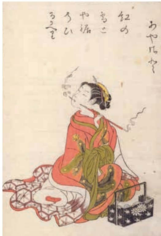
圖11 鈴木春信 青樓美人合 明和7年(1770)序刊本 國立國會圖書館藏

振袖飾有孔雀羽紋極盡奢華。除了小袖以外，江戶時代歌川國政〈書齋美人圖〉(圖十三)中誇張地繫綁在正面的孔雀羽紋腰帶亦是吸引目光的重要衣飾。