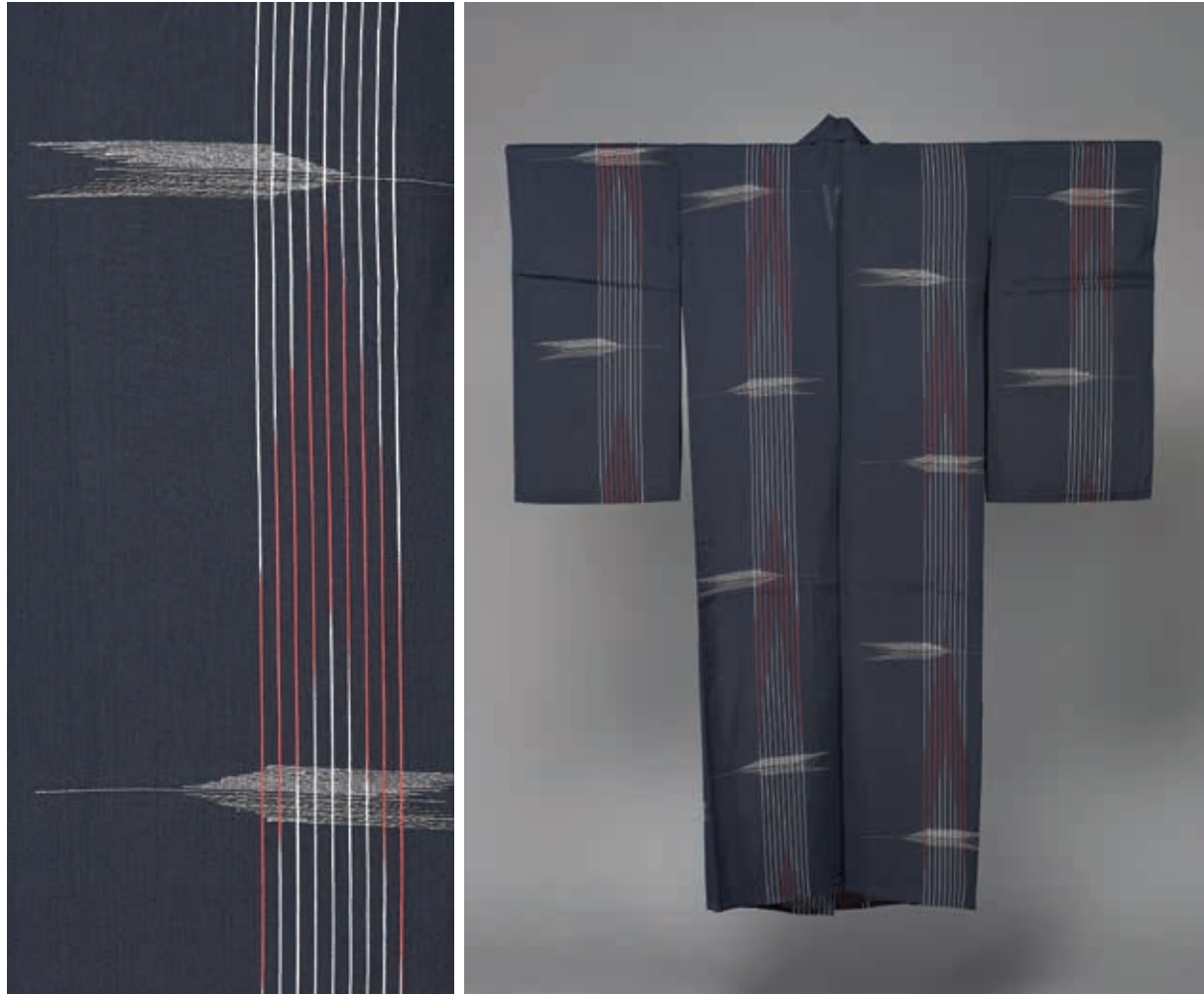
圖8 昭和時代 20世紀 黑地矢羽條紋緞織和服 國立故宮博物院藏