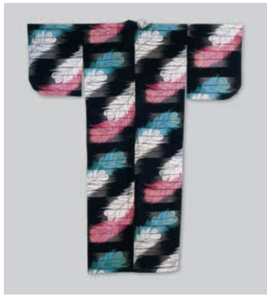
圖17 昭和10年~昭和15年（1935~1940）孔雀羽紋銘仙長著（單衣） 足立市立美術館藏 引自參考書目2，圖2-3-05。

孔雀羽紋小袖，這件打掛應為華美的婚禮服飾。 大正、昭和時代日本代表性的美人畫家，鐫木清方（一八七八~一九七二）作品〈待嫁〉（圖十五），主角是眾人圍繞手捧花束的嬌羞女子，其中立姿背影的女子應是其閨中密友，身穿深灰地飛鳥紋和服，腰間繫綁著孔雀開屏的腰帶的女子，髮型是當時最流行的西洋束髮，華麗端莊。而本次展出的精品〈白地孔雀紋銘仙和服〉，所代表的是大正、昭和初期，也