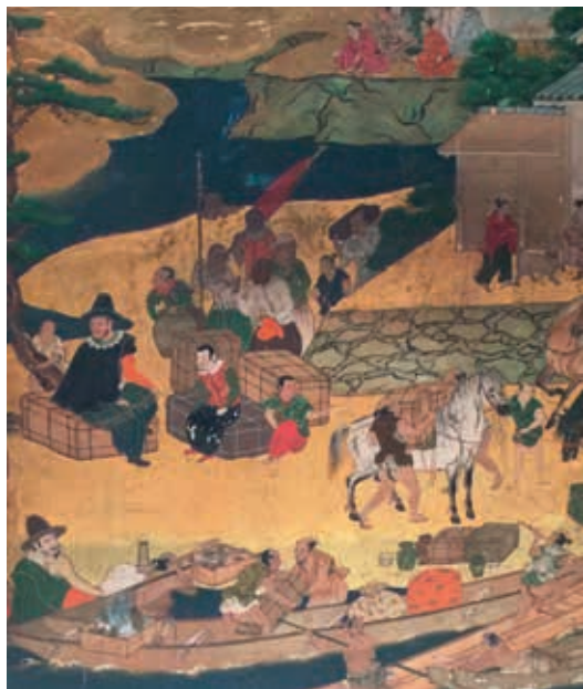
圖16 安土桃山~江戶時代 唐船、南蠻船圖屏風 局部 九州國立博物館藏