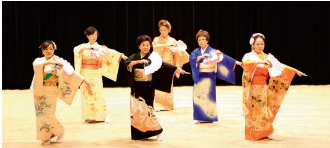
圖4 日本舞蹈表演示範

為能樂幕間加演的簡短劇目，由演出者即興發揮，主要目的是協助表演者了解能劇，並作為轉化觀賞者情緒的過場節目。室町時代至江戶末期，「狂言」提高其即興、滑稽之特質，與高度藝術性且多屬悲劇性的能樂相扞格，難以協調同臺演出，便獨立成一種演出形式，成為滑稽諷刺為主調的寫實喜劇。