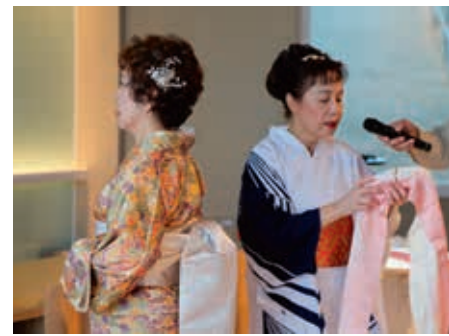
圖9 和服腰帶內藏小枕頭以增加挺度