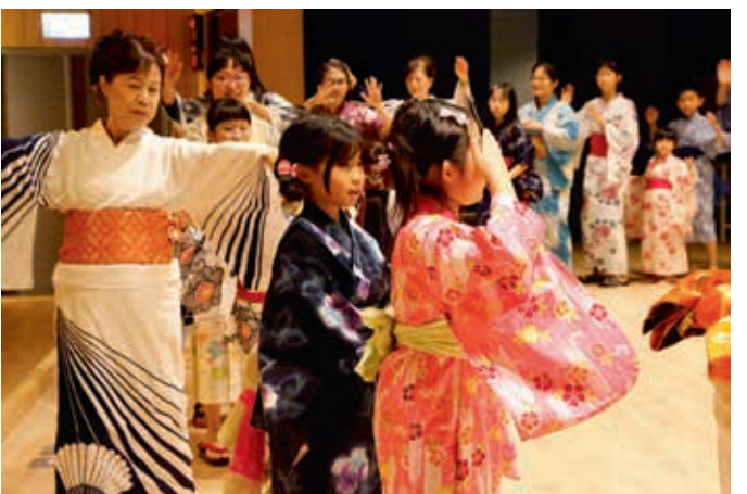
圖7 親子觀眾體驗日本舞蹈