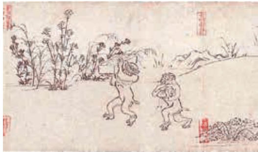
圖15 12世紀 平安時代 鳥獸戲畫 甲卷 局部 第19至20紙 京都 高山寺 引自《鳥獸戲畫—高山寺の至寶》，2015