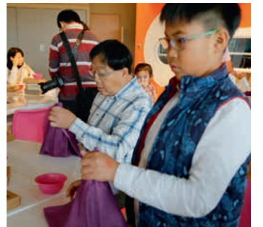
圖21 父子共同學習風呂敷包裝

二十）但此次活動，可以發現男性的參與程度較以往的課程更高，推測可能是與其生活經驗具密切的連結。（圖二二）