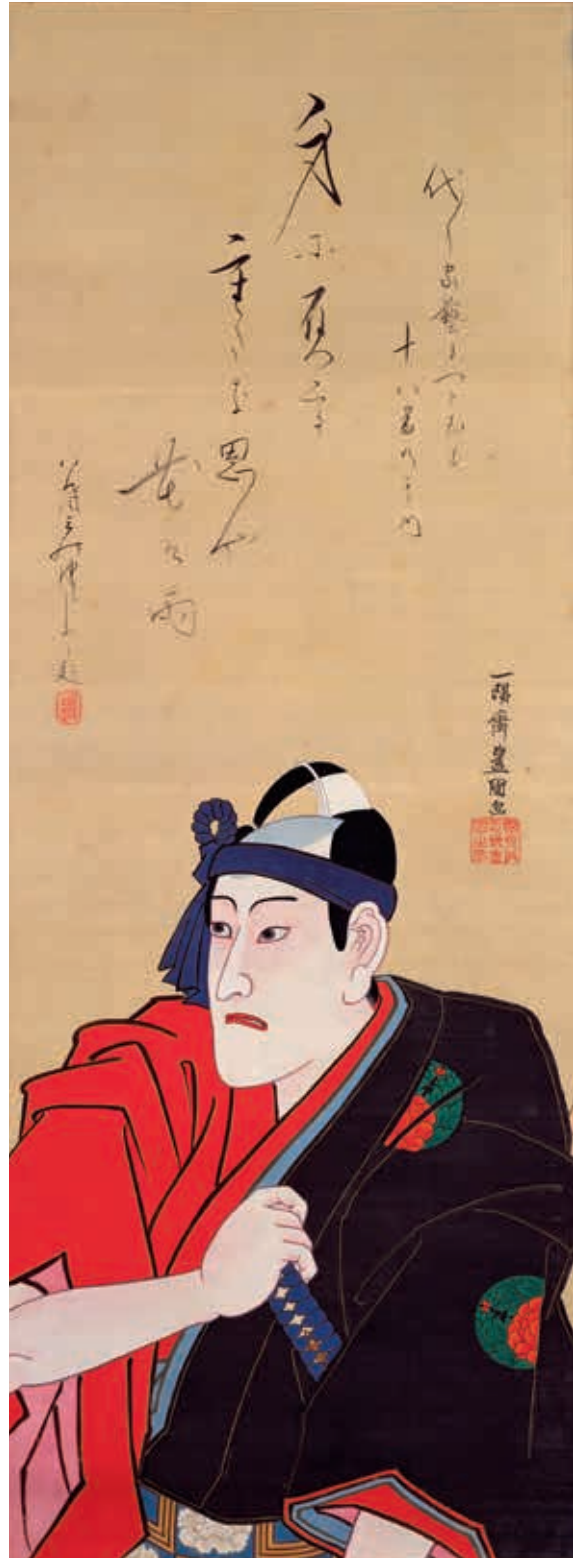
圖3 江戶時代 歌川國貞（三代豐國）八代市川團十郎飾助六團東京國立博物館藏

進般，舞出優美的姿勢。舞步多為滑步，舞動時身體自然垂直，腰椎挺直，不要有過多的律動，以典雅的姿態演繹舞曲的意境。舞者在表演時臉部幾乎沒有表情，藉由手部的姿勢、幽微的動作，表達最純粹的情感，希望觀者可以專注於舞者身體的律動。（圖四）