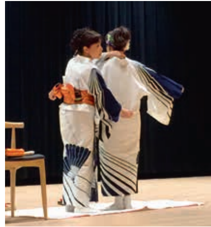
圖13 穿著時於後領口預留一個拳頭的寬度，以維持浴衣的挺度。

在此階段互動過程中，由於和服的穿著非常複雜，親子觀眾皆聚精會神的觀看整個示範過程，連首次完整觀看和服穿著歷程的家長，也讚嘆不已。小朋友們更是充滿好奇，提出一連串問題，例如：「和