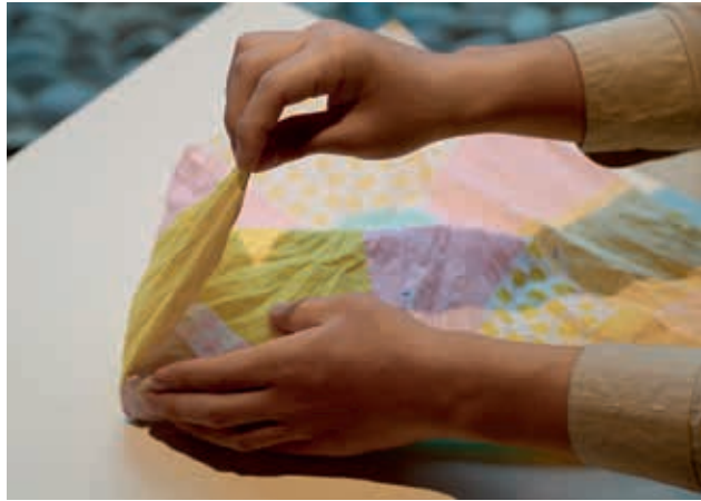
圖22 喜慶包裝方式