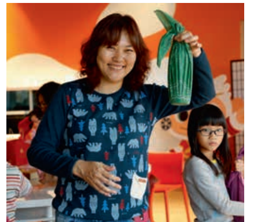
圖20 風呂敷包裝紅酒