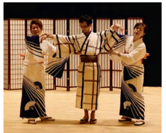
圖14 男性浴衣的穿著方式

難在短暫的時間提供體驗，因此改以夏季較常穿著的和服——浴衣呈現。浴衣源自江戶時期，早期稱湯帷子，帷子是指麻布材質的小袖，原為沐浴之後的簡便穿著，具