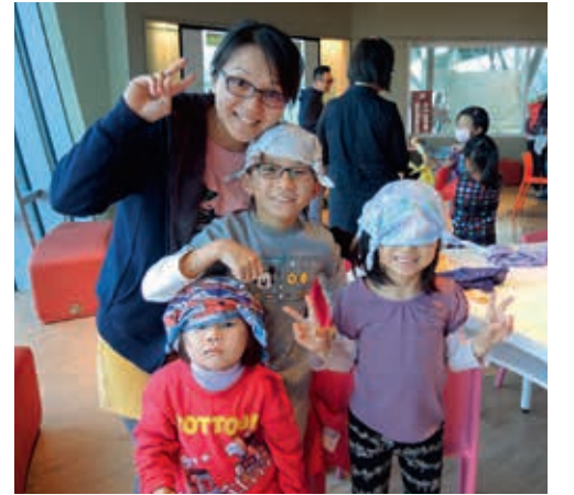
圖18 風呂敷紮綁成帽子

助角色或是負責攝影紀錄。但此次活動由於實用性極高，在登山健行時若手持寶特瓶不利行走，只要將風呂敷扣於腰際打上兩個平結，便可收納水瓶及各式小物（圖十九）；或是將風呂敷鋪平，將紅酒收納於內，只要運用平結與雙結兩個簡單技巧，即可變成美觀又易於拿取的包裝。（圖