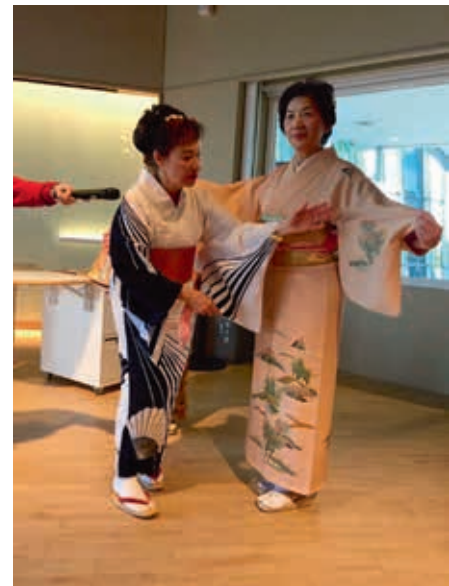
圖11 和服綁繩在雙套結後，由下往上固定代表喜事場合穿著。