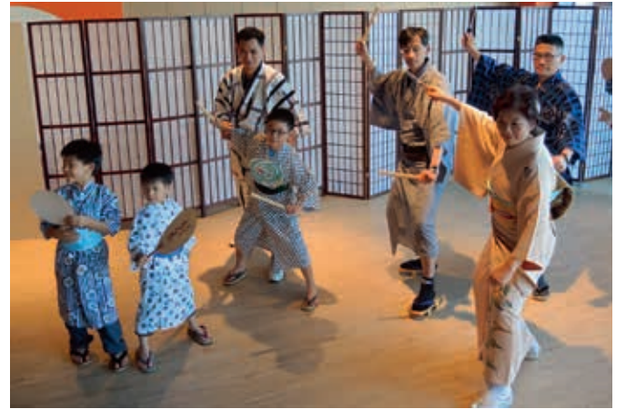
圖5 示範男性舞者舞姿

明顯的區別，年紀較小的女孩在比劃好舞蹈動作後，會很自然地露齒微笑，這可能與現在的小孩習慣面對鏡頭作表情有關。 接續由舞蹈老師帶領親子觀眾，共同練習「櫻花」曲目。櫻花是日本的國花，在天光晴朗的春天，人們滿懷著喜悅的心情翩然起舞。親子觀眾跟著節拍，亦步亦趨地隨著舞蹈老師的腳步，體驗日本舞蹈獨特的滑步、單純的重覆動作，領略日本