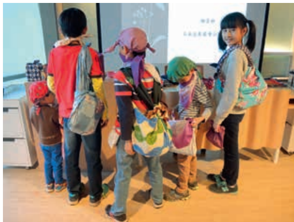
圖17 以呂敷紮綁成各式包款

風呂敷 (Furoshiki) 在原始的意涵即有「布包」之意，宛如母親懷孕時，子宮保護嬰孩，出生後母親以育兒袋照料嬰兒，具有保護、珍愛的意涵。日本以織布包裹物品的方法很早即出現，在知名平安時代的鳥獸戲畫繪卷中可見其蹤跡。該畫被稱為是日本漫畫的先驅，以擬人化的動物為