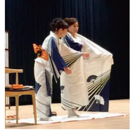
圖12 浴衣穿著時將左片服飾覆蓋於右片之上