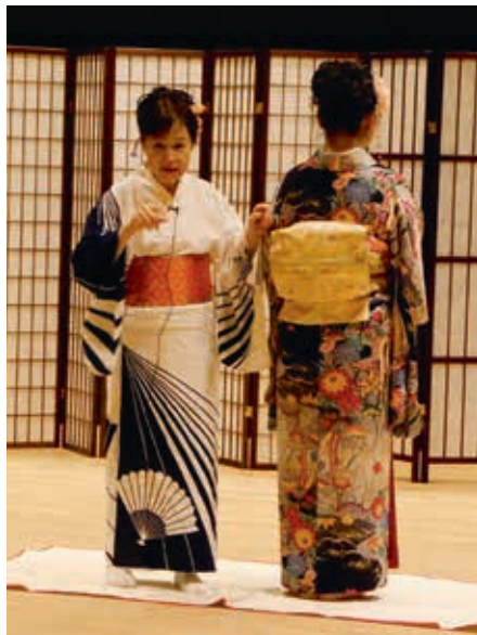
圖10 以紮綁方式於腰際後方打結

兩種不同形式，此次示範為袋帶，其為長形腰帶未先縫製定型，上有細緻的紋飾。為增加和服的整體挺直程度，會內藏小枕於腰帶內(圖九)，最後以綁紮的方式於