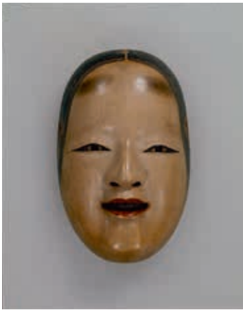
圖1 能面〈小面〉 上杉家傳世品 東京國立博物館藏

此次「日本美術之最」展出珍貴的能面與劇服。其中「小面」指的是能劇中扮演年輕女性時所佩戴的面具（圖一），被認為是女性面具較早形成的作品，「小