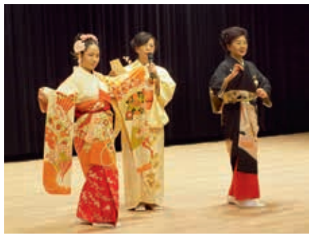
圖8 左邊舞者所穿服飾為振袖，右邊為留袖。