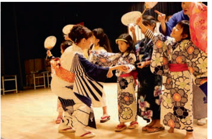
圖6 示範女性舞者舞姿 作者提供

藝術的獨特魅力。(圖七)舞曲剛開始時，多數的親子觀眾很難適應緩慢的舞步，與過往的身體經驗有很大的不同，在經過反覆練習後才慢慢跟上節奏。民眾在活動結束後，紛紛表示以往博物館參觀較為靜態，此次透過舞蹈來體驗日本文化令人印象深刻。