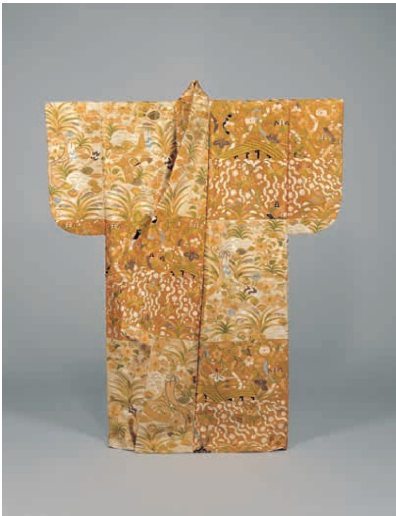
圖2 安土桃山時代 紅白地草花短髮八橋紋能劇衣裳 毛利家傳世品 東京國立博物館藏

及刷貼金箔技法製作，極盡華麗之能事。江戶時代大名為彰顯其身份與不凡的藝術品味，在宅邸設置能劇舞臺，並訓練專屬的自家能劇演員，於重要的聚會時演出。因需經常展演，故能面與能劇衣著保存不易，此次來臺展出的能劇衣裳，其年代可追溯至十六世紀，是傳世作品中實屬難得的文物。