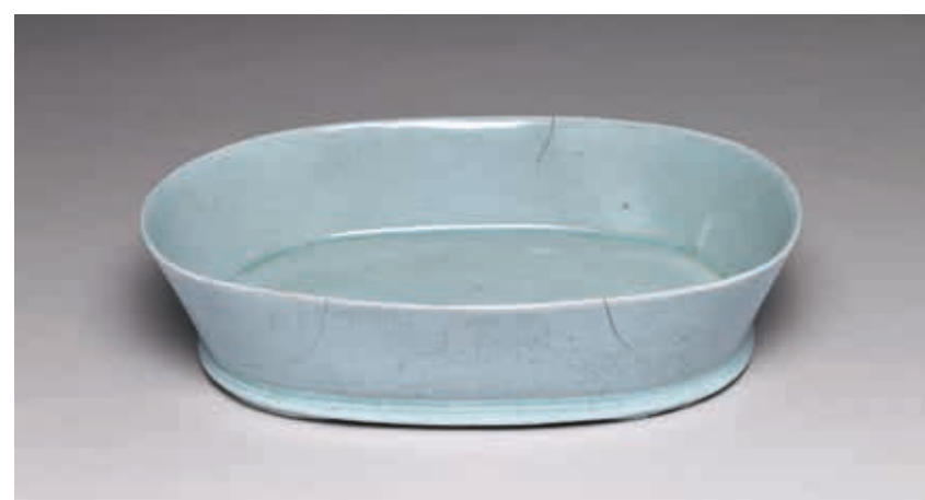
北宋 汝窯 青瓷水仙盆 故瓷14019 國立故宮博物院藏

汝窯也被高麗青瓷當作模仿的對象。河南的產地因發現與高麗青瓷相似的樣本，所以也能夠回應這樣的看法。儘管後世致力於重現汝窯瓷器，卻仍無法企及。近年