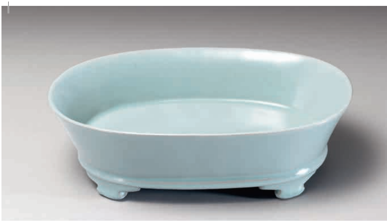
北宋 汝窯 青瓷無紋水仙盆 故瓷17851 國立故宮博物院藏