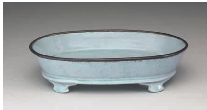
北宋 汝窯 青瓷水仙盆 故瓷13977 國立故宮博物院藏

是一件相當好的作品。在日本這塊土地上，臺日各自持有的〈汝窯水仙盆〉共聚一堂，是這次展覽的焦點。最後加上一件清朝帝王下令仿製的景德鎮〈官窯水仙盆〉，共計六件〈汝窯水仙盆〉構成純粹的單一主