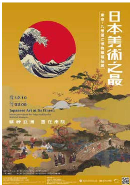
「日本美術之最—東京、九州國立博物館精品展」展覽海報