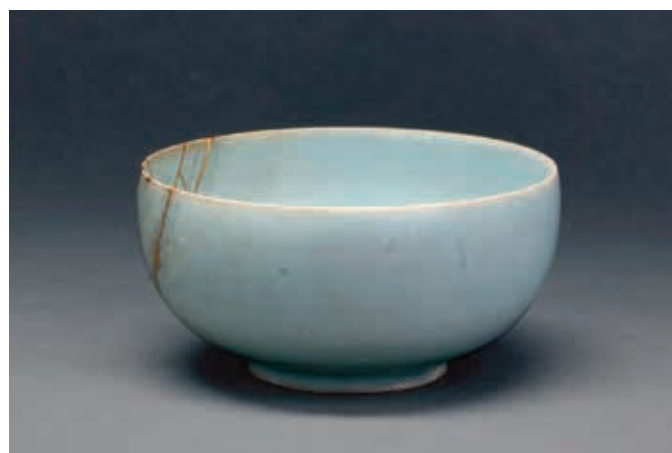
新發現的第三件汝窯青瓷盞

洋陶瓷美術館因應展覽需求，細心處理及考慮照明方式，挑戰如何能夠盡量呈現汝窯青色的透亮質感。其中，又以如何在室內營造出接近自然光下觀看的环境為一大課題。