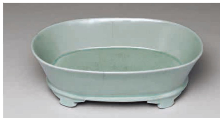
北宋 汝窯 青瓷水仙盆 故瓷17699 國立故宮博物院藏

來也利用遺址發現的瓷片進行研究，不過那種「雨過天青」色彩的秘密仍未解開。汝窯尚存謎團，水仙盆也有未解之謎。其用途至今仍不清楚。水仙盆這個名稱實為後世所附加。究竟是盛裝何物才對……？