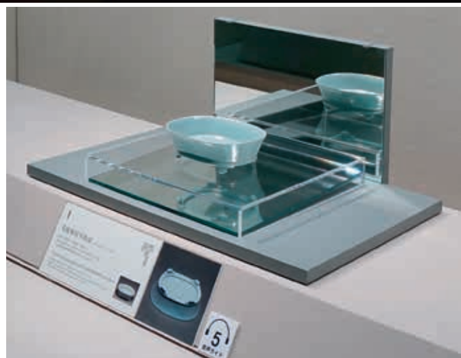
「台北國立故宮博物院—北宋汝窯青磁水仙盆」展場

或如同乾隆皇帝將之吟詠為盛裝狗食或貓食，但我想應該不是那樣，究竟是什麼呢，只能想到裝滿水後用以插上一朵鮮花之類的。