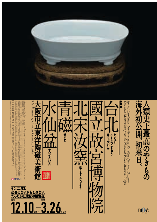
「台北國立故宮博物院—北宋汝窯青磁水仙盆」特別展海報

稱，近年來也持續有相關的新發現。專家一致認同，汝窯是青瓷的巔峰之作。這種如清澈「天青色」般的藍色以及端正的造型，僅用「洗練」一詞已足以說明其等級之高。這種藍色被評為「雨過天青（雨後的藍天）」，實際上正是當時依據皇帝的指示，追求「天青色」所燒造之瓷器。 汝窯基本上都是獻給皇帝的上貢品，現存的數量極少，這也因此提高不少汝窯的神祕感及珍稀性。世界公認完整的傳世汝窯，據目前統計，約有九十件左右。在