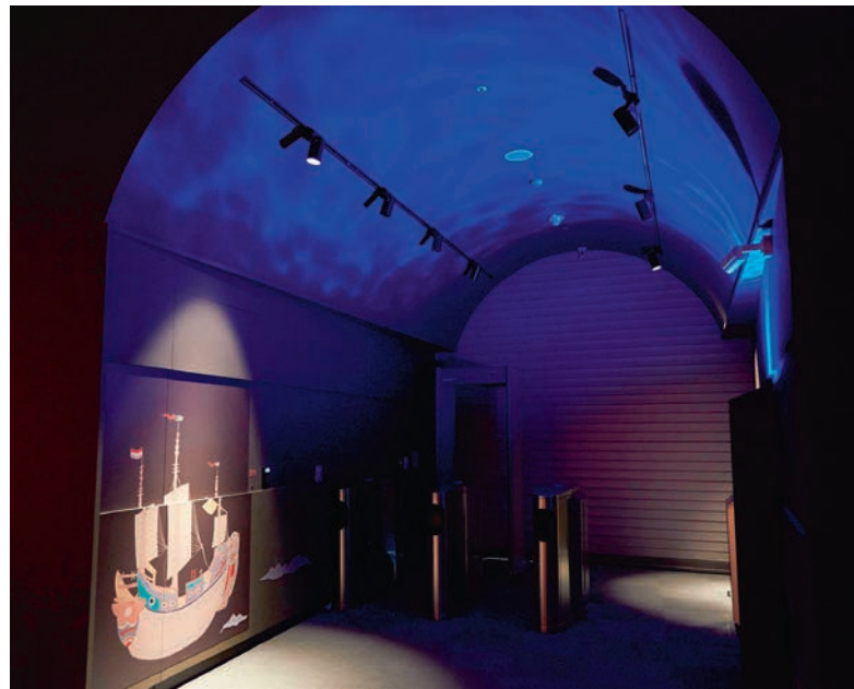
廊道燈光與圖像呈現「遊臺灣」的意象，此為閉館時拍攝。

暗藏在收藏品中的詩集，顯示嘉慶皇帝對於詩文的喜愛。例如，鑲嵌紫檀木罩蓋匣內貯存《御筆節錄洪範》冊與白玉雕十二生肖，木匣內的白玉雕代表十二生肖的循環不息，中間的木盒匣有嘉慶御筆《御筆節錄洪範》冊。此冊是嘉慶節錄《尚書·洪範》中的庶徵段，表達至治理天下敬天心境，賞玩中以詩自勉。在陳列上使用複合式材質的墩座，多層次擺設，搭配斜臺以展現器物的多樣性。 〈嵌玉棕櫚木三層蓋盒〉亦屬器物與書畫複合式展品。三層蓋的小圓盒裡每層皆存有玉璧一枚和嘉慶御書小冊，共計三本小冊子。小冊子抄錄北宋周敦頤〈拙賦〉、南朝蕭子良〈眼耳口三銘〉、南宋戴復古〈吡陵太平寺畫水呈王君保使君〉，是嘉慶皇帝用來鼓勵自身對治理國家的期許。為了讓觀眾閱讀小冊內容，特製斜臺固定小冊，在展品後方設置說明版，整合成多層次展示結構，企圖提供突破實體展示的限制，將細膩的詩文內容與民眾共賞。