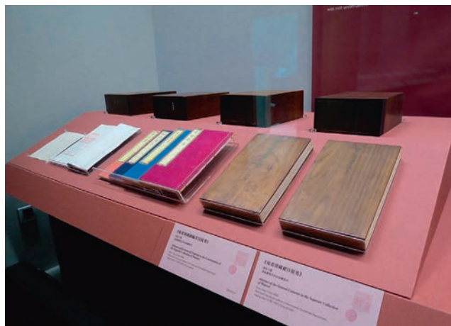
第四單元斜臺與視覺背板應用

的視角與器物類型，而製作的不同角度之斜臺及組合形式，略可分為四種類型：第一類用於展示文獻或奏摺，斜度約三十至四十五度，文物分兩層上下陳列；第二類用於展示書畫，斜度約六十度；第三類用於陳列套裝書籍或冊頁，搭配兩種不同角度的斜臺組合，凸顯文物不同角度的觀看重點。第四類則是為獨立型展櫃中的器物類文物，訂製製作特定角度之斜臺。