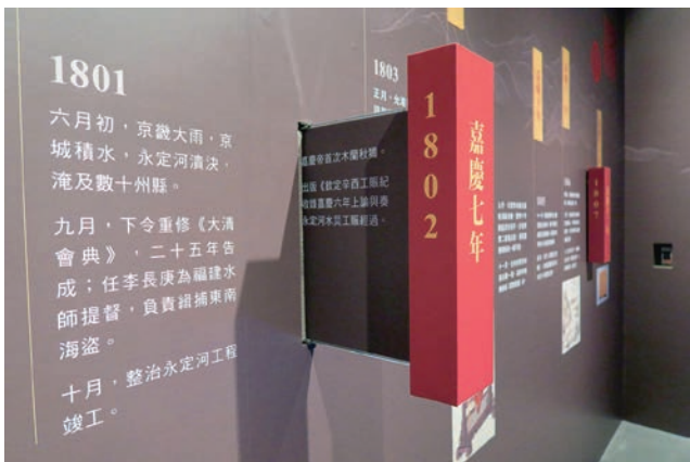
抽屜型年表