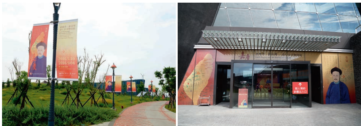
博物院園區宣傳