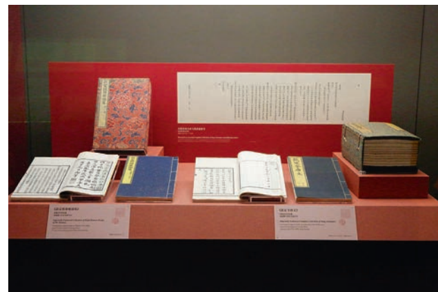
結合圖文說明板之多層次展示結構