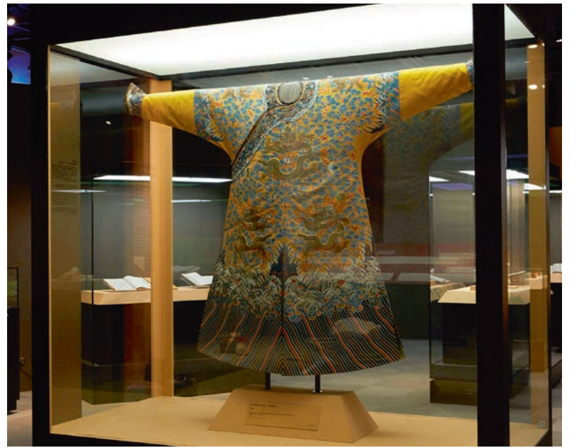
嘉慶龍袍展示情形

多媒體影片播放區位於第四單元「文化事業」及第五單元「安內靖亂」之間的畸零地，在前展「藍白輝