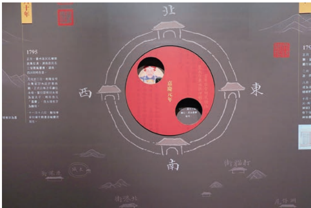
旋轉式資訊對應盤

特展在內容的詮釋上，從傳說的角度切入，反證並重新建立觀眾對嘉慶朝的歷史史觀、文化和記憶，就故宮而言，是一項大膽的嘗試。而展覽內容中，除呈現諸多精品文物外，並透過詳盡的輔助圖文說明、生動活潑的光影劇，與互動式歷史年表牆，在展覽空間內不停的梳理、彙整展覽重點，拉近與觀眾之間的距離。而為讓觀眾在順利進入展廳，並透過各式的參觀宣傳指標及主視覺牆，引導其一探究竟。展覽中運用眾多的設計，希冀可