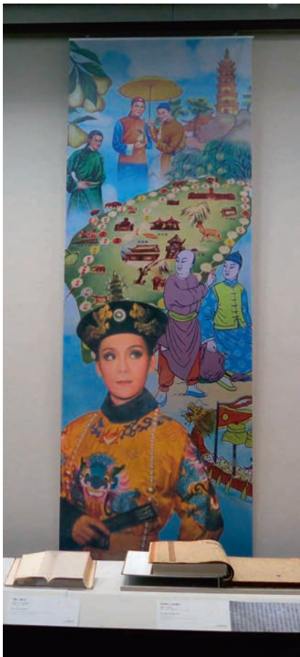
「傳說戲劇」子題的視覺圖板 南院處提供

計。然而考量增加空間層次，在色彩在賦予不同視覺強度，選用金色為輔色，襯托第二單元皇帝的尊貴形象及各單元的說明牆面。 本次展出的大量文獻、書畫資料，考量觀看文物的視角及展示範圍，大部分的文獻及書畫安排陳列於展廳邊櫃中。如何吸引觀眾駐留細讀或暗示陳列內容的群組關係，為規劃上述展件類型時的一大考驗。設計團隊採用說明性圖板及視覺圖板兩種方式應變。文獻類型的文物，搭配線描圖與文字為構成的說明性圖板，將各單元子題重點題示，為觀眾梳理敘事脈絡。書畫類型文物，則是採用局部文物的視覺圖板設置於該區展臺後方，凸顯該區展件特性，呈現文物的素雅