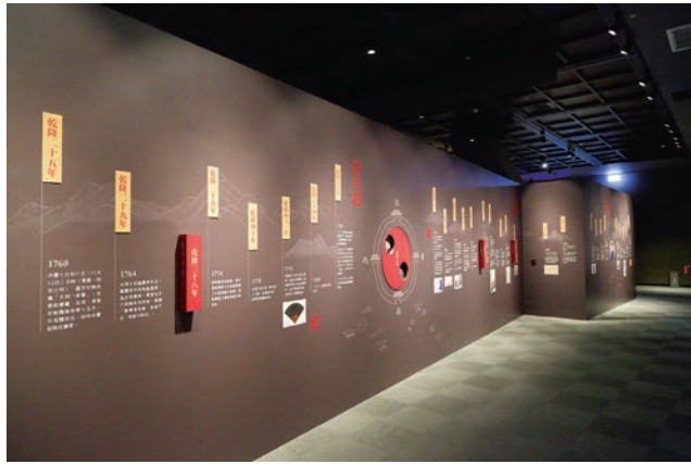
互動性年表牆