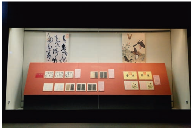
第三單元斜臺與視覺背板應用 南院處提供