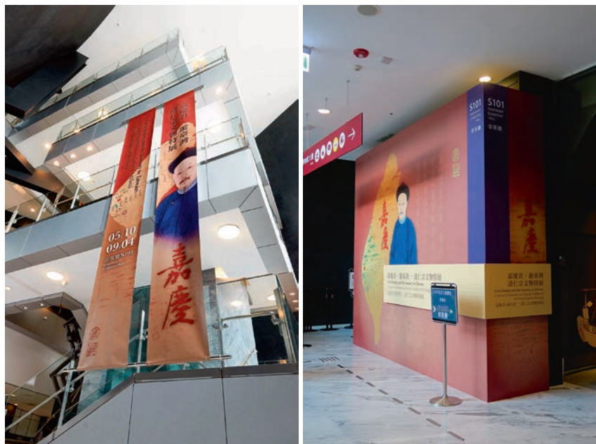
博物院內展覽宣傳

此外，本展開展前適逢南部院區玻璃帷幕修繕工程，因此調整觀眾入館動線、團體集合點與購票位置。入館動線依參觀人數分成團體預約與散客預約兩個博物院進出入口。而借展廳前方即為散客參觀入口，另並在借展廳旁新增個人語音導覽櫃臺、個人