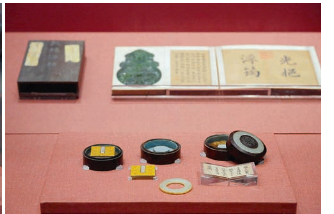
(前)嵌玉棕櫚木三層蓋盒陳列方式